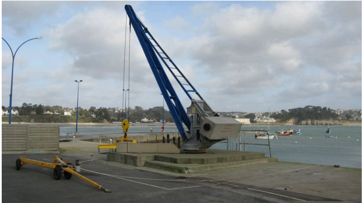
Grue du Kador