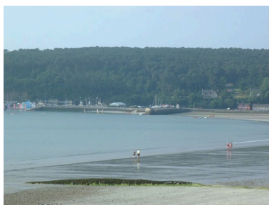
Zone portuaire du Kador