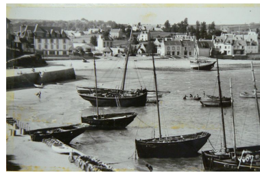
Vue ancienne du port de Morgat IVR53_20072908752NUC