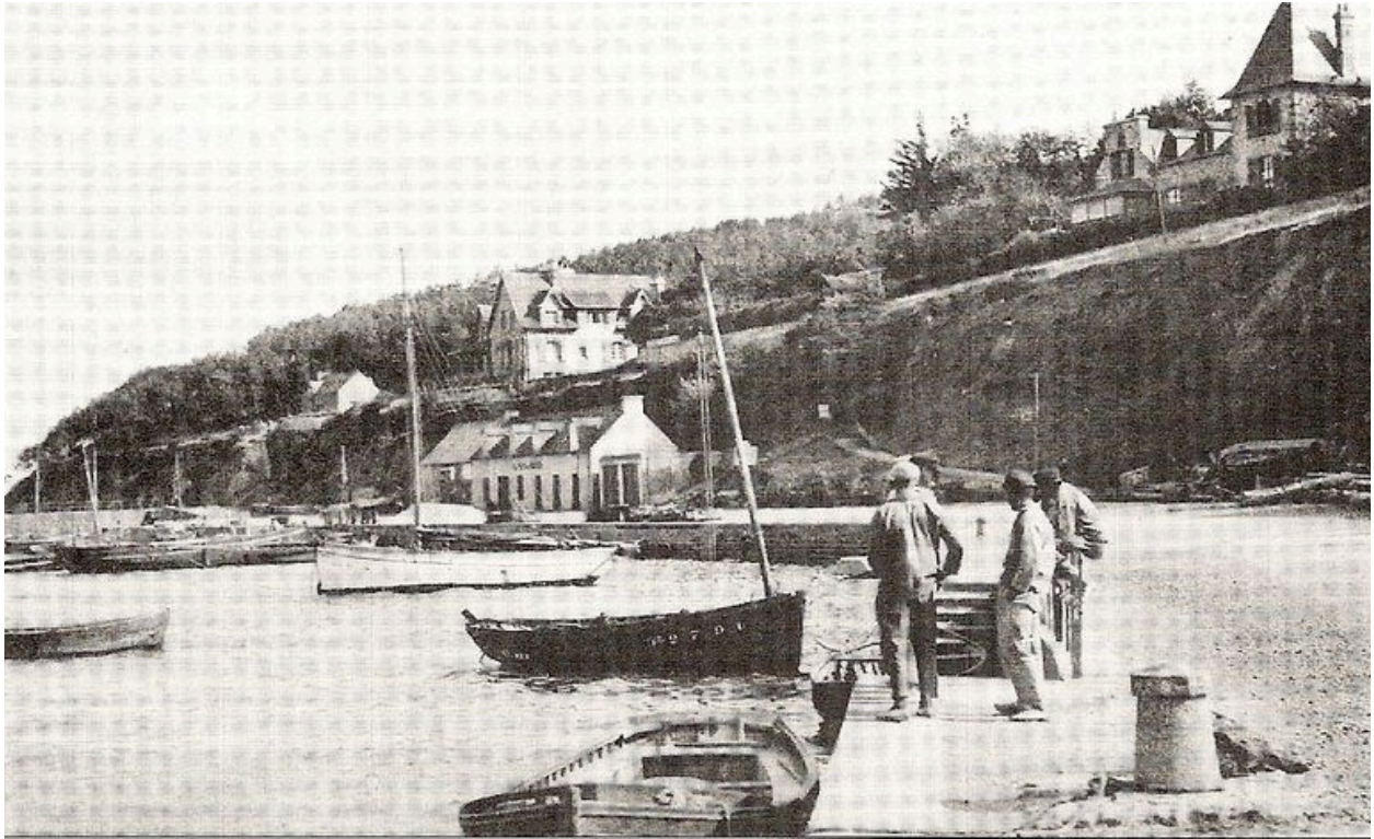
Vue ancienne de la zone portuaire du Kador