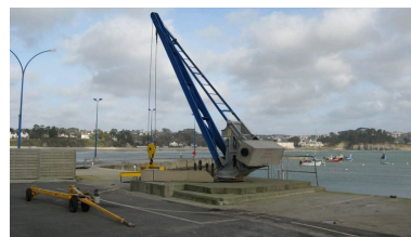
Grue du Kador IVR53_20072908599NUCA