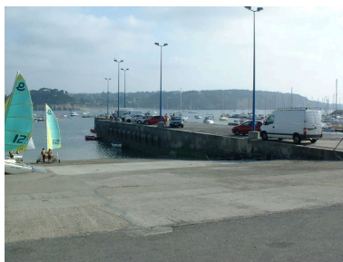
Cale de mise à l'eau du Kador