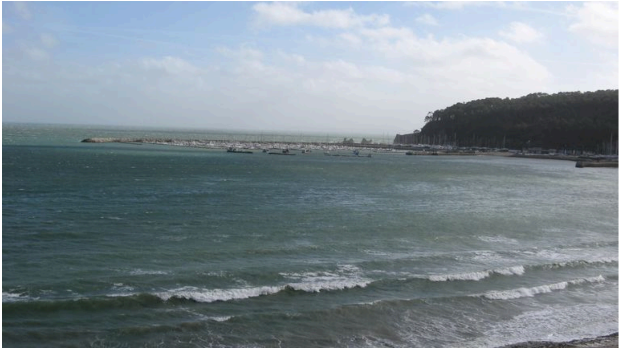
Vue générale de la zone portuaire du Kador