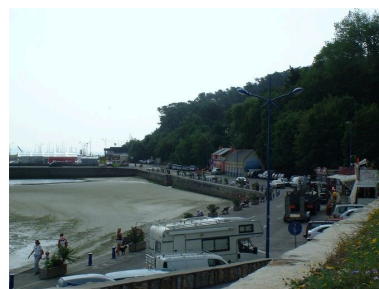
Quai et zone portuaire du Kador IVR53_20062908606NUCA