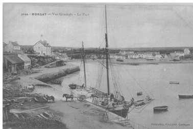
Carte postale : Vue générale du port de Morgat IVR53_20082908345NUCB