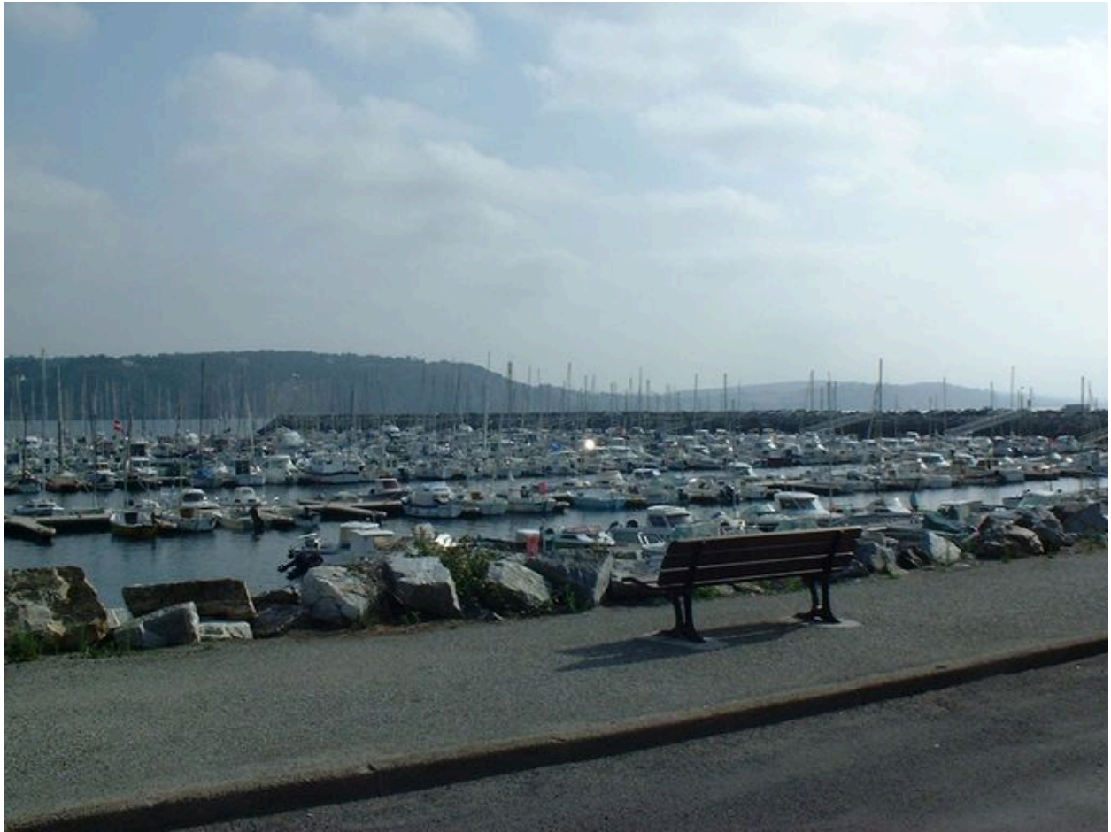
Port de plaisance du Kador