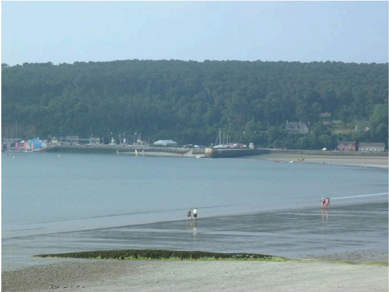
Zone portuaire du Kador