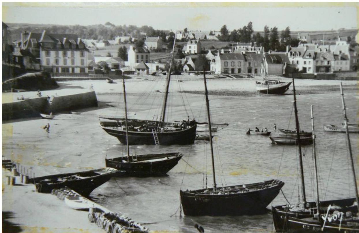
Vue ancienne du port de Morgat