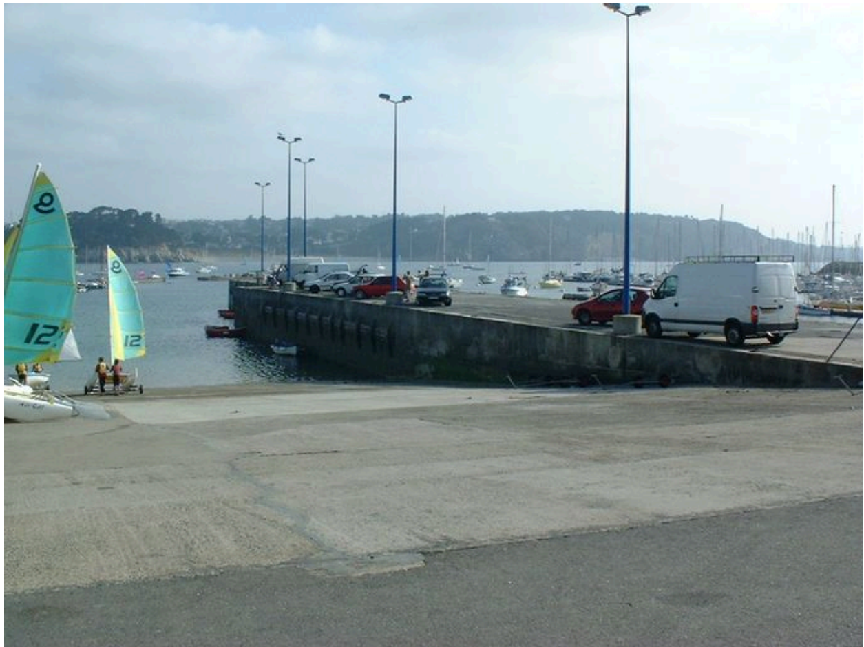
Cale de mise à l'eau du Kador