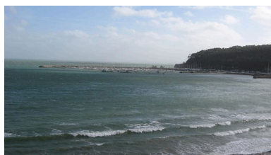
Vue générale de la zone portuaire du Kador IVR53_20072908598NUCA