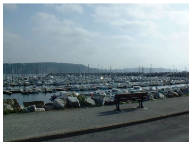
Port de plaisance du Kador IVR53_20062908607NUCA