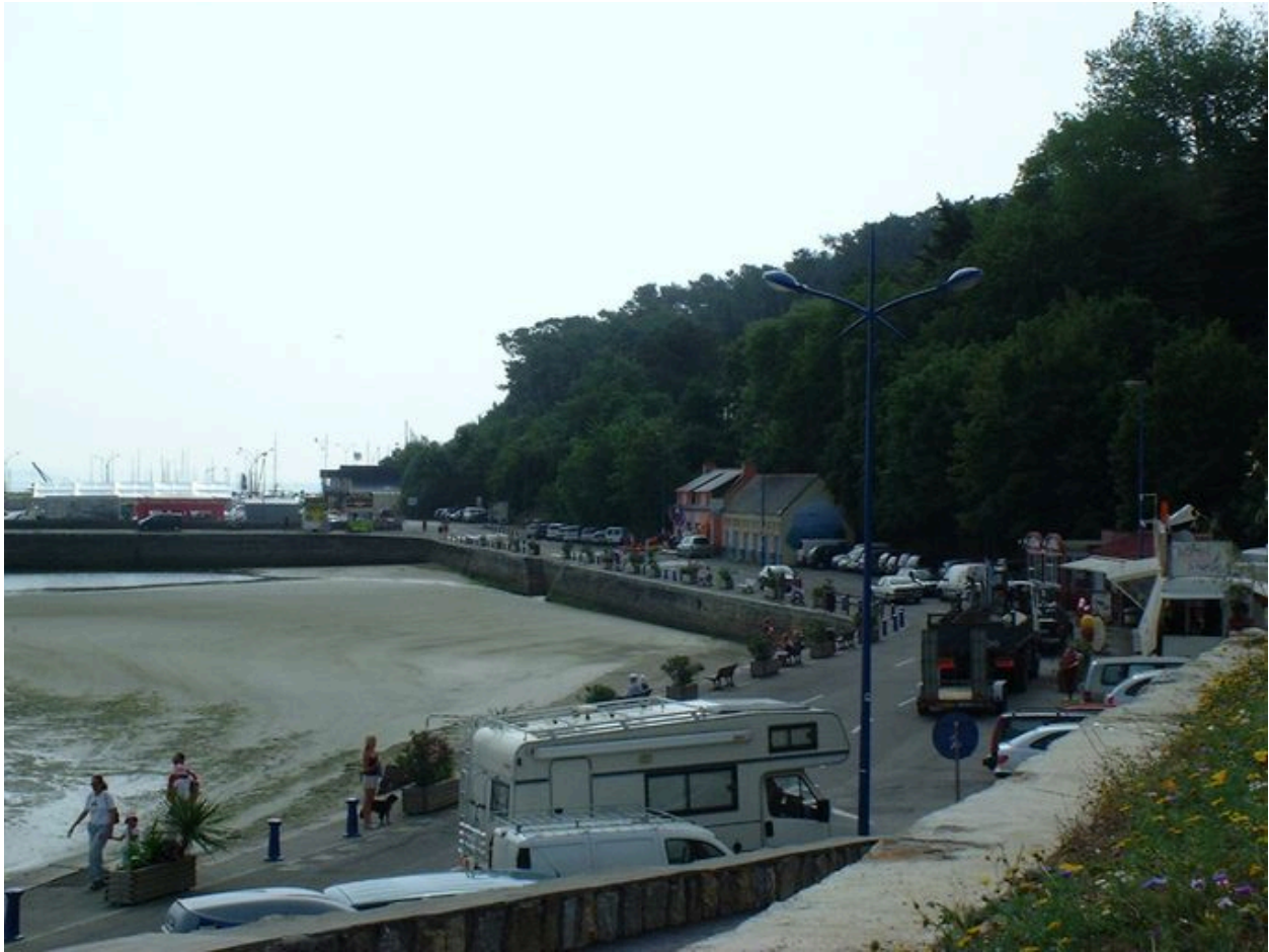
Quai et zone portuaire du Kador