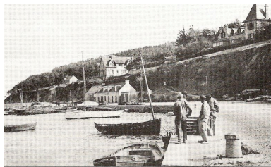
Vue ancienne de la zone portuaire du Kador