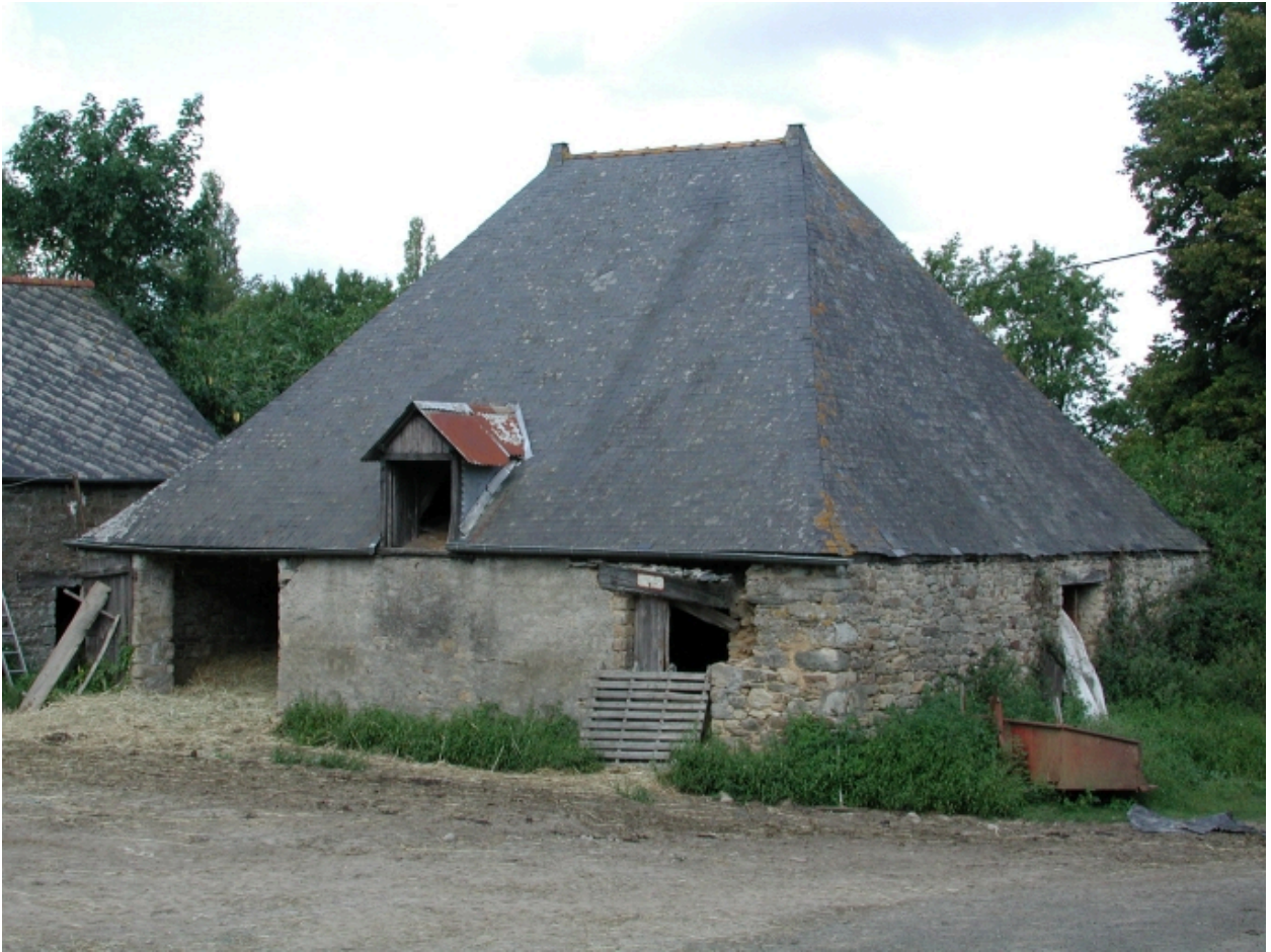
La ferme : anciennes écuries (?), vue générale sud-est