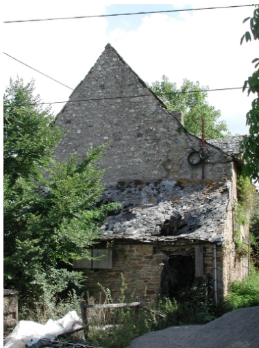
La ferme : ancien logis ruiné, vue du pignon est IVR53_20013511890NUCA