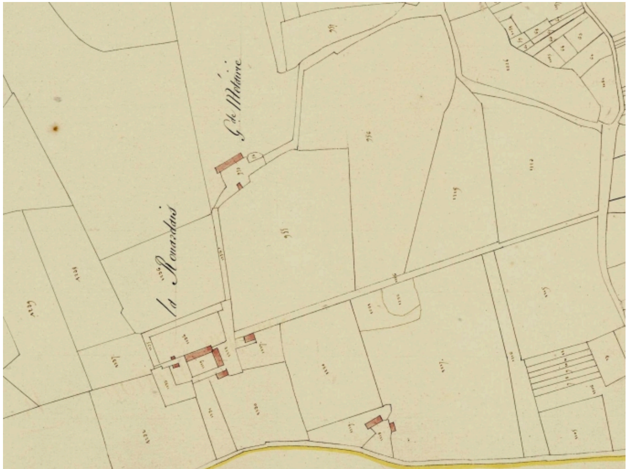
La ferme de la Rouardais et les vestiges de l'ancien manoir avant la construction du château sur le cadastre de 1817