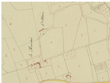
La ferme de la Rouardais et les vestiges de l'ancien manoir avant la construction du château sur le cadastre de 1817