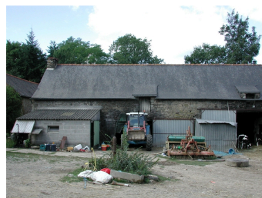
La ferme : ancien alignement de logis, vue générale est IVR53_20013511888NUCA