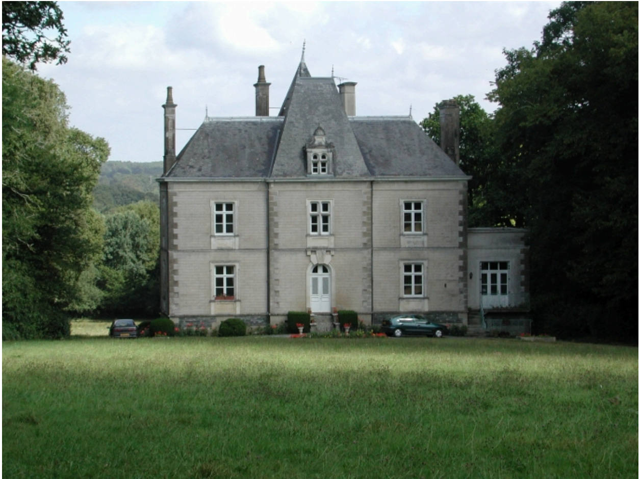
Le château : vue générale sud