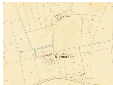
La ferme de la Rouardais et les vestiges de l'ancien manoir avant la construction du château sur le cadastre de 1847