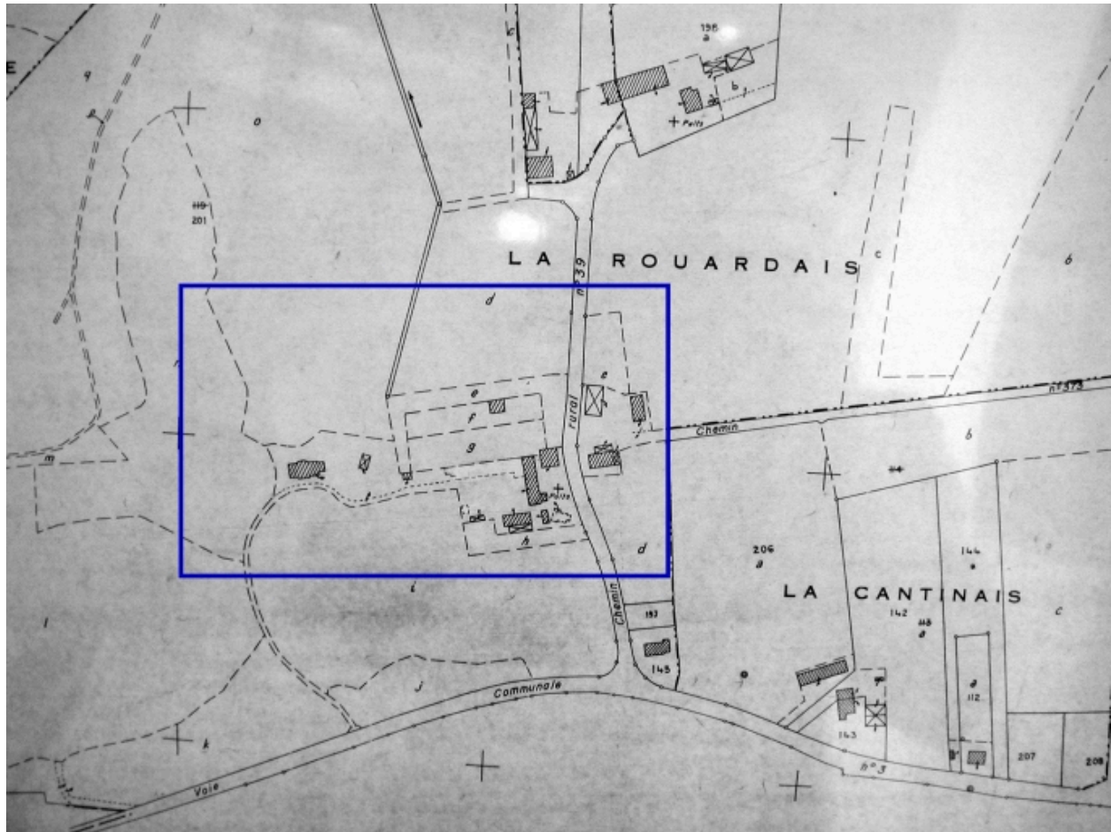
Extrait du cadastre de 1983