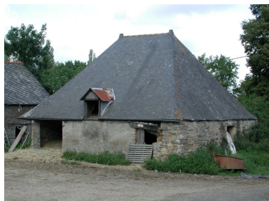
La ferme : anciennes écuries (?), vue générale sud-est