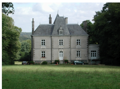
Le château : vue générale sud IVR53_20013511549NUCA