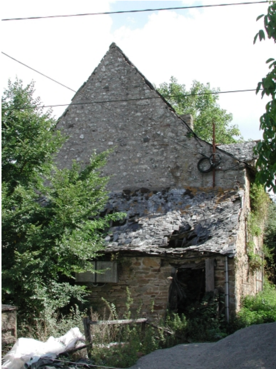
La ferme : ancien logis ruiné, vue du pignon est