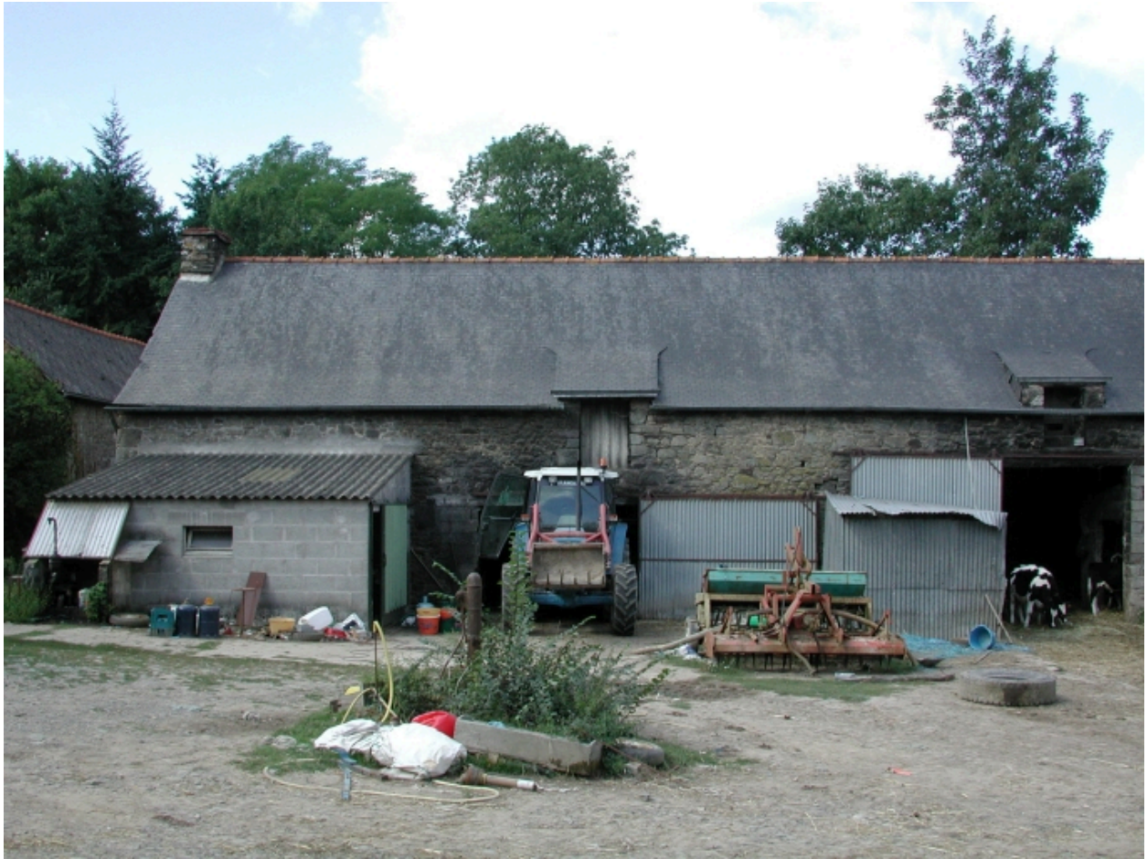
La ferme : ancien alignement de logis, vue générale est