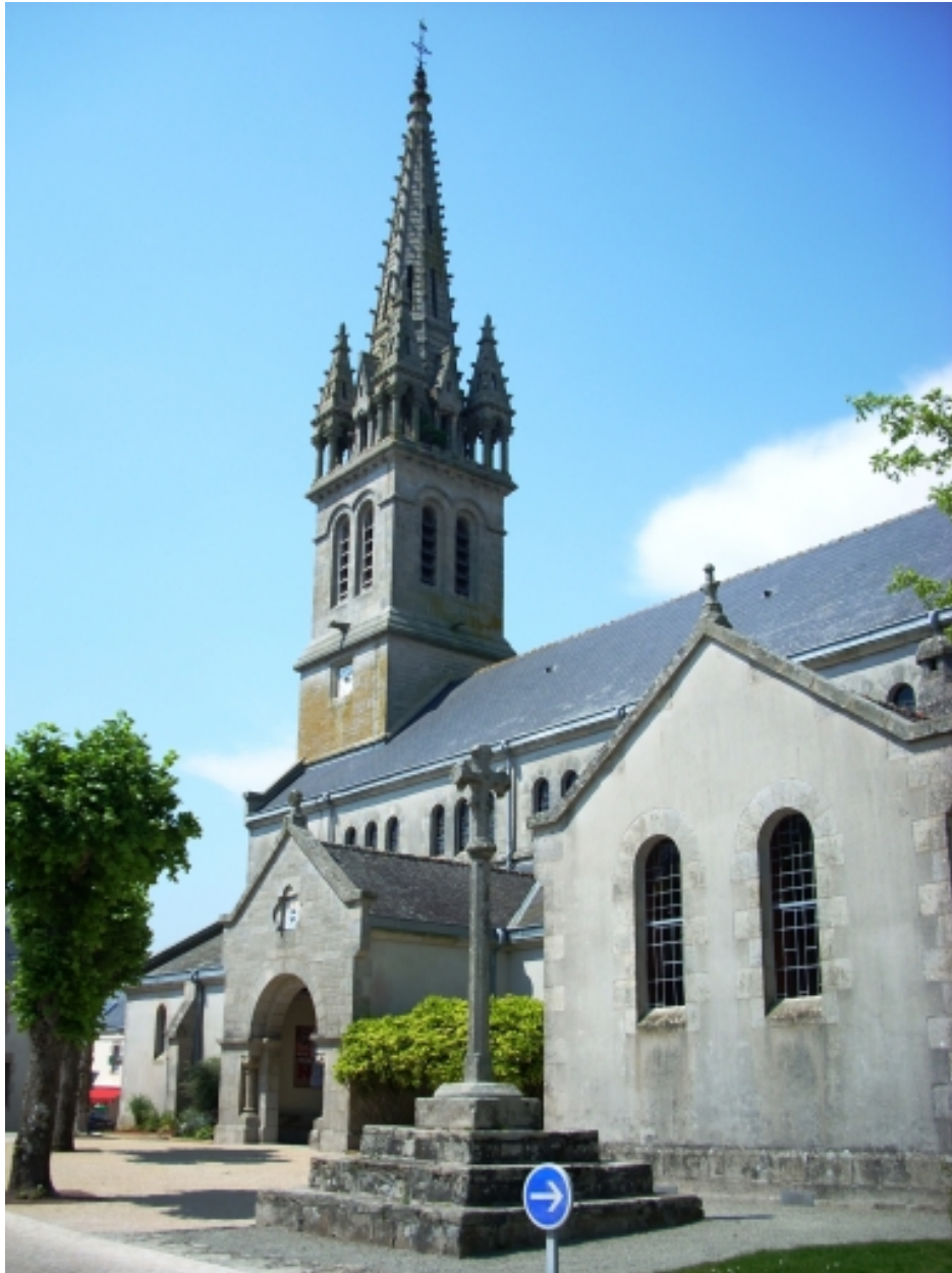
Plomelin, église paroissiale : monument aux morts et porche sud depuis l'est