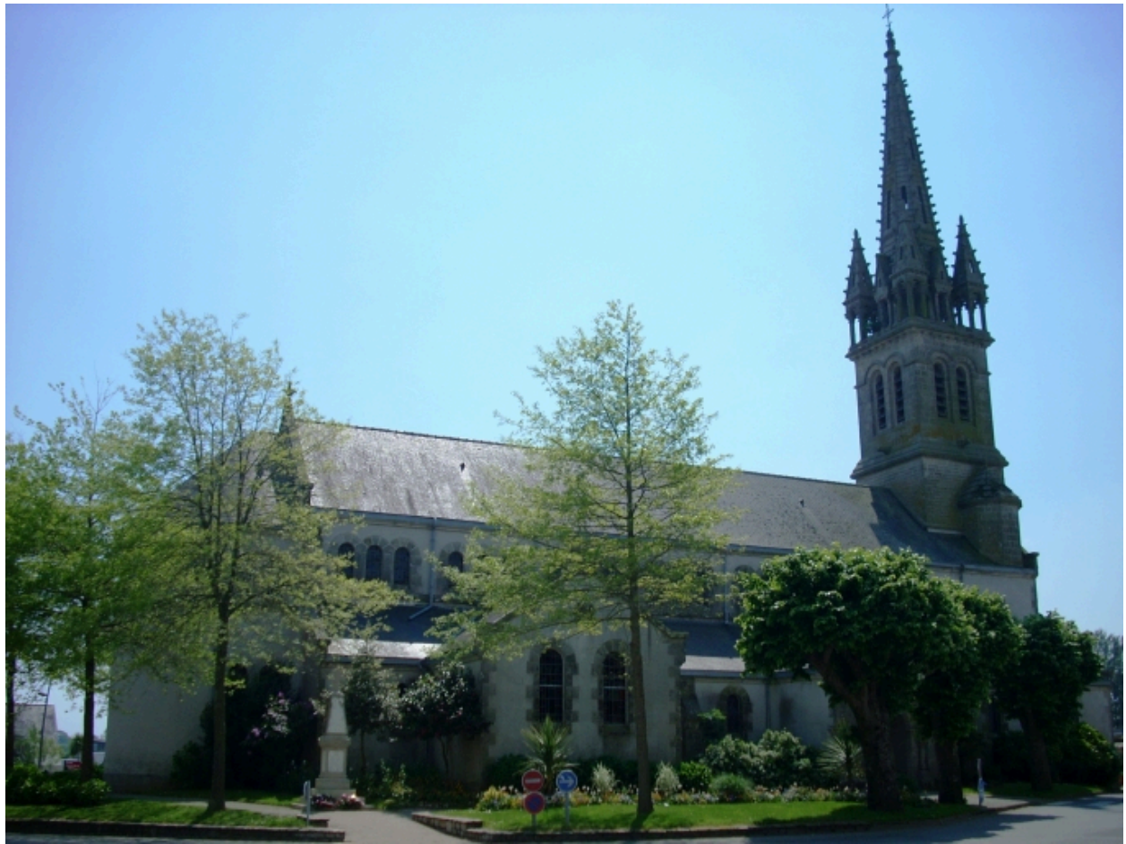
Plomelin, église paroissiale : vue générale nord-est