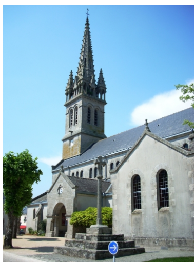
Plomelin, église paroissiale : monument aux morts et porche sud depuis l'est IVR53_20082905931NUCA