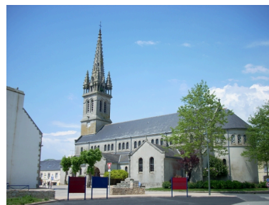
Plomelin, église paroissiale : vue générale sud-est IVR53_20082905929NUCA