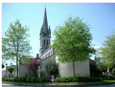
Plomelin, église paroissiale : vue générale est IVR53_20082905930NUCA