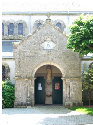
Plomelin, église paroissiale : porche sud