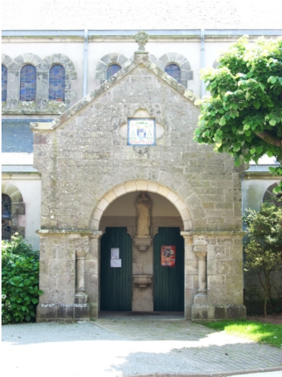
Plomelin, église paroissiale : porche sud