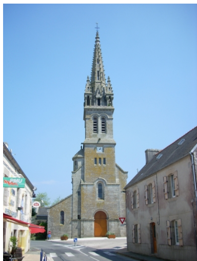
Plomelin, église paroissiale : vue générale ouest IVR53_20082905927NUCA