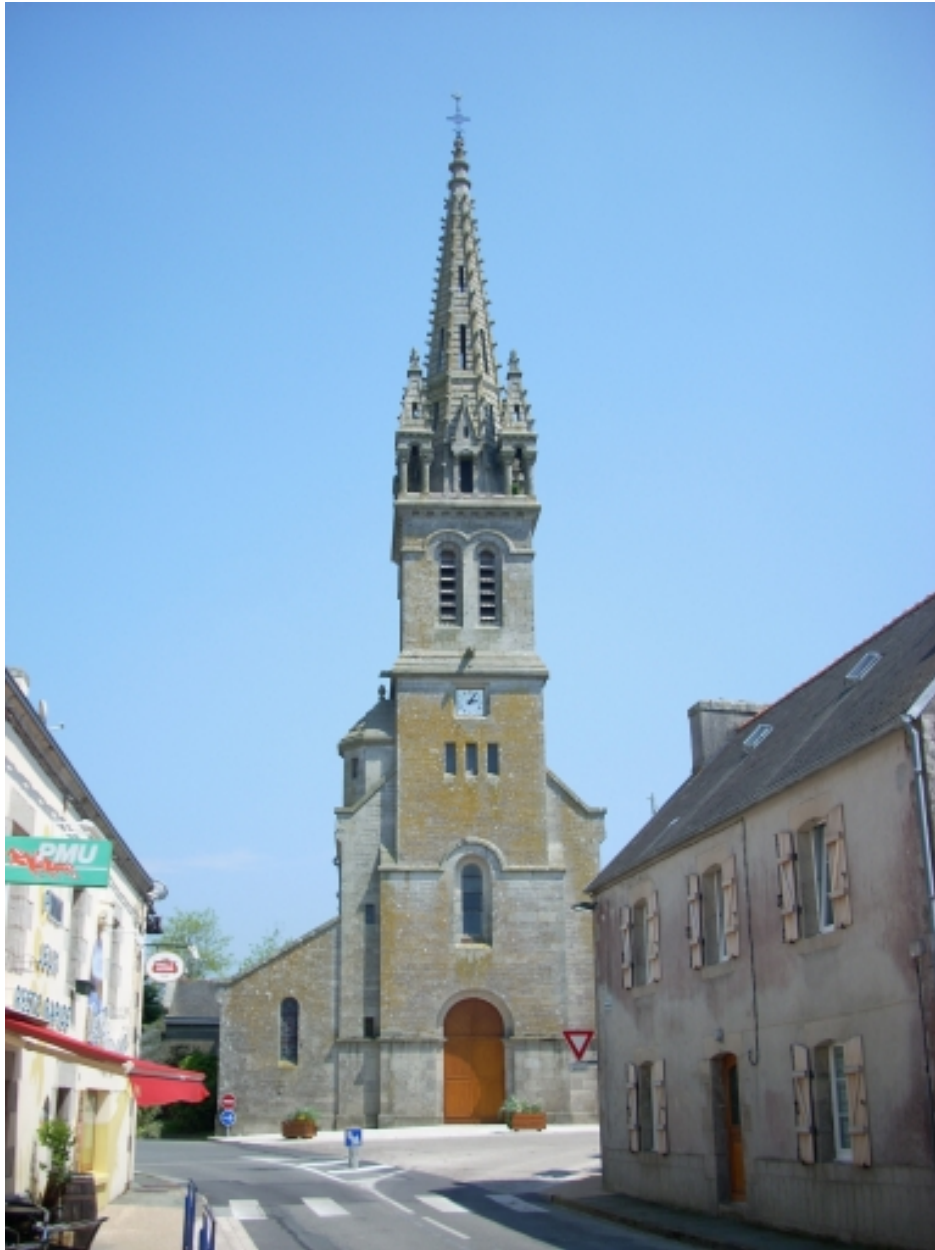
Plomelin, église paroissiale : vue générale ouest