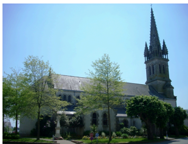
Plomelin, église paroissiale : vue générale nord-est