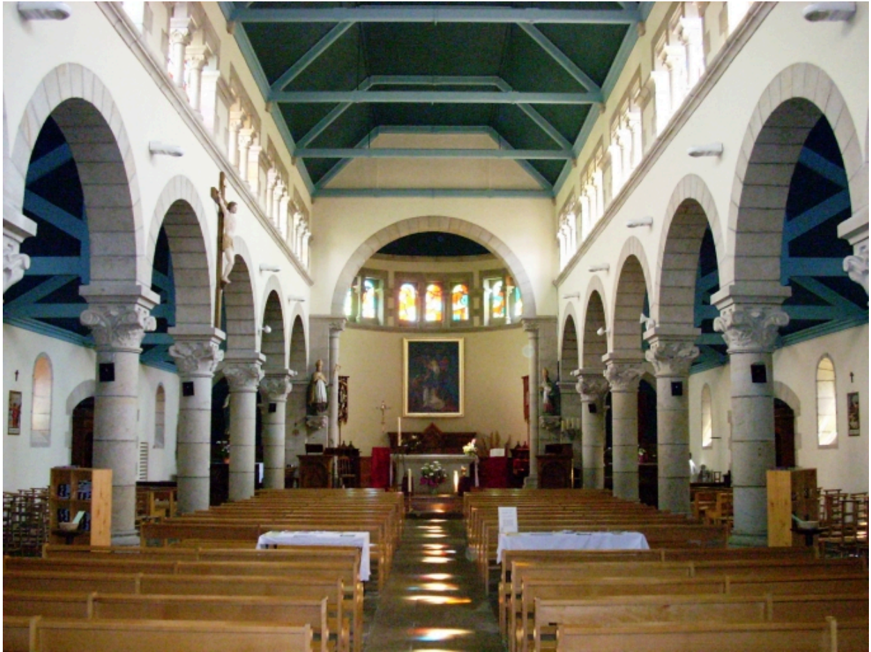
Plomelin, église paroissiale : vue axiale est