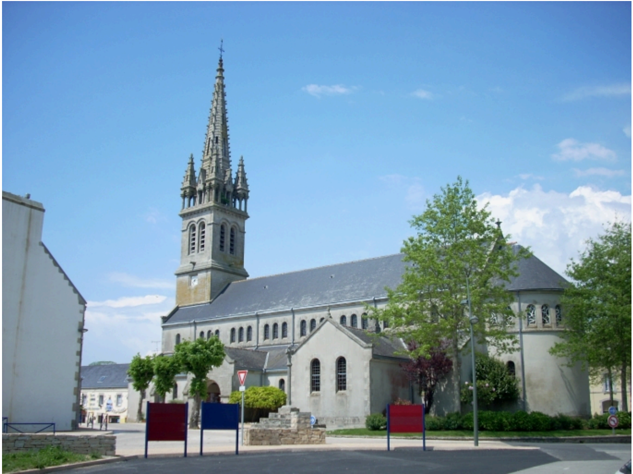
Plomelin, église paroissiale : vue générale sud-est