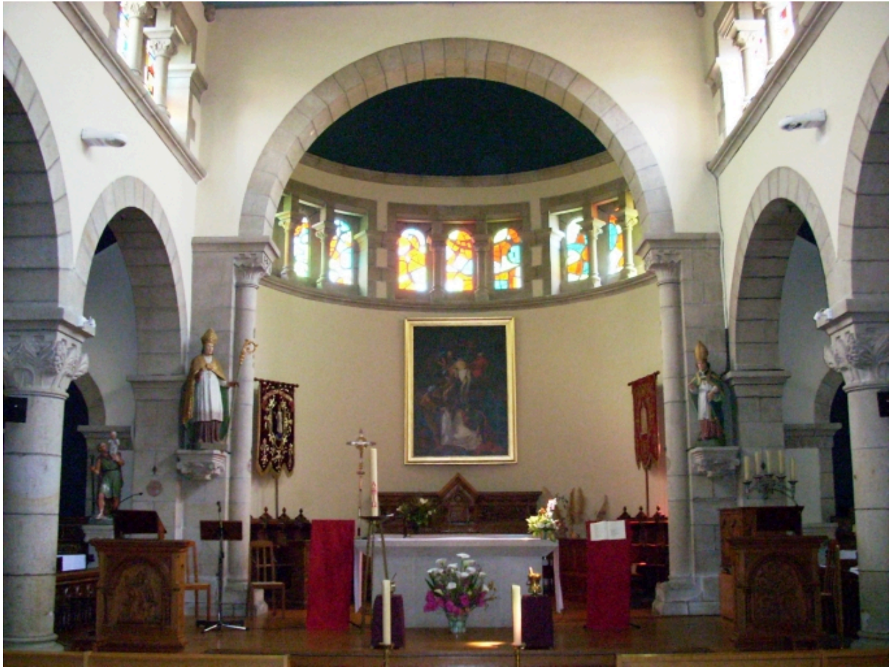
Plomelin, église paroissiale : vue du choeur