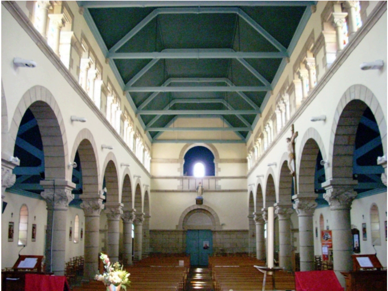
Plomelin, église paroissiale : vue axiale ouest