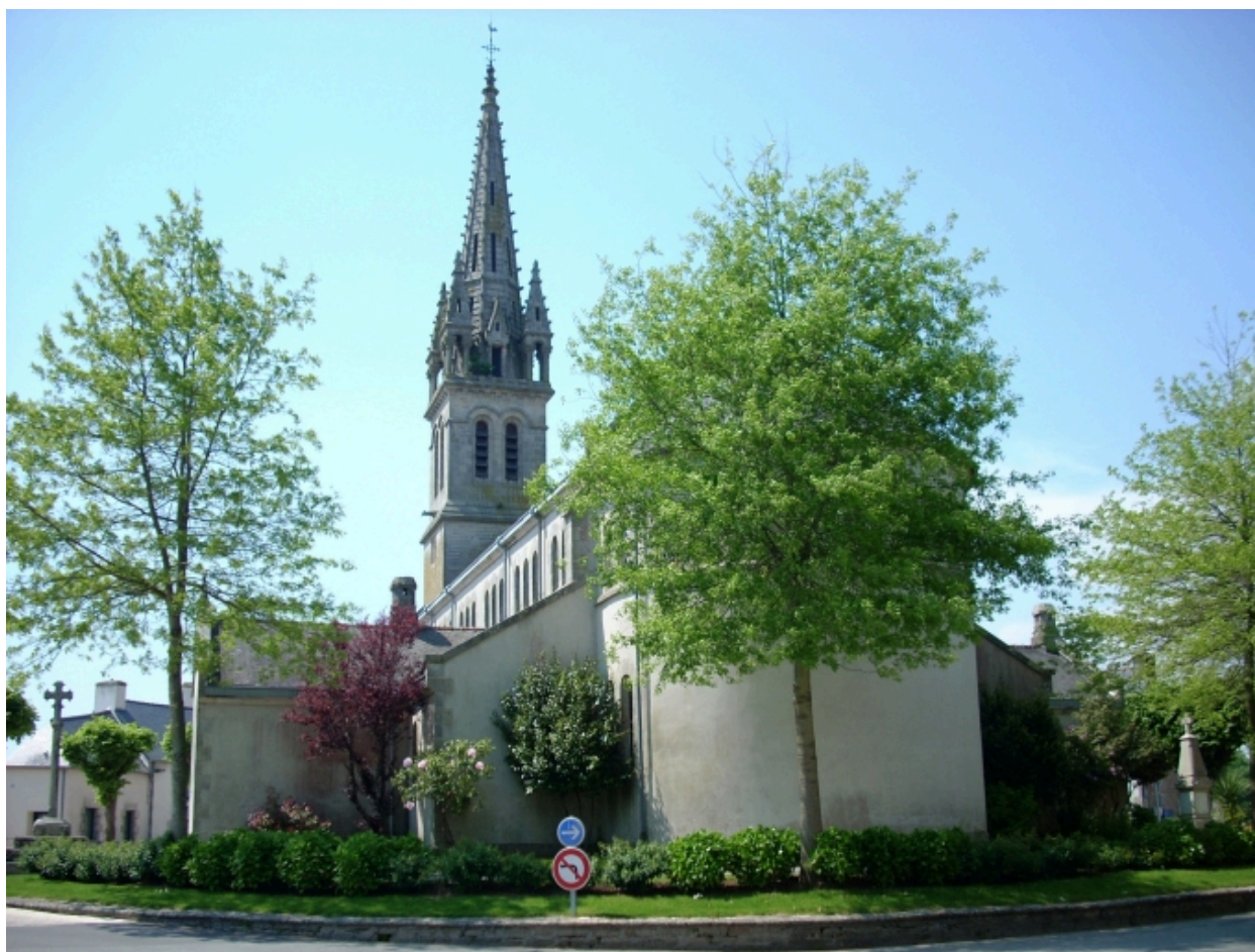
Plomelin, église paroissiale : vue générale est