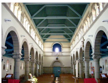
Plomelin, église paroissiale : vue axiale ouest IVR53_20082905934NUCA