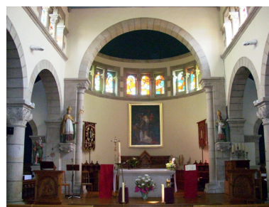
Plomelin, église paroissiale : vue du choeur IVR53_20082905935NUCA