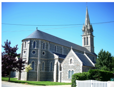
Taulé, église paroissiale Saint-Pierre : vue générale nord-est IVR53_20082906622NUCA