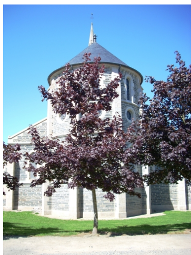
Taulé, église paroissiale Saint-Pierre : élévation est IVR53_20082906624NUCA