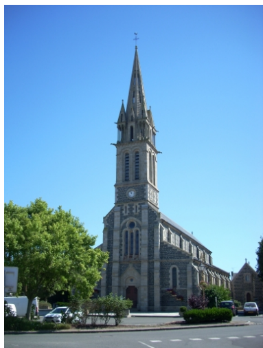
Taulé, église paroissiale Saint-Pierre : vue générale sud-ouest IVR53_20082906621NUCA