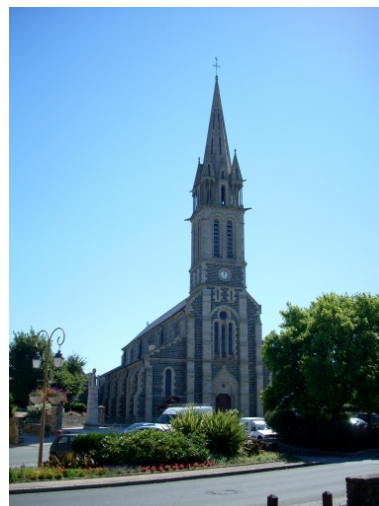
Taulé, église paroissiale Saint-Pierre : vue générale nord-ouest