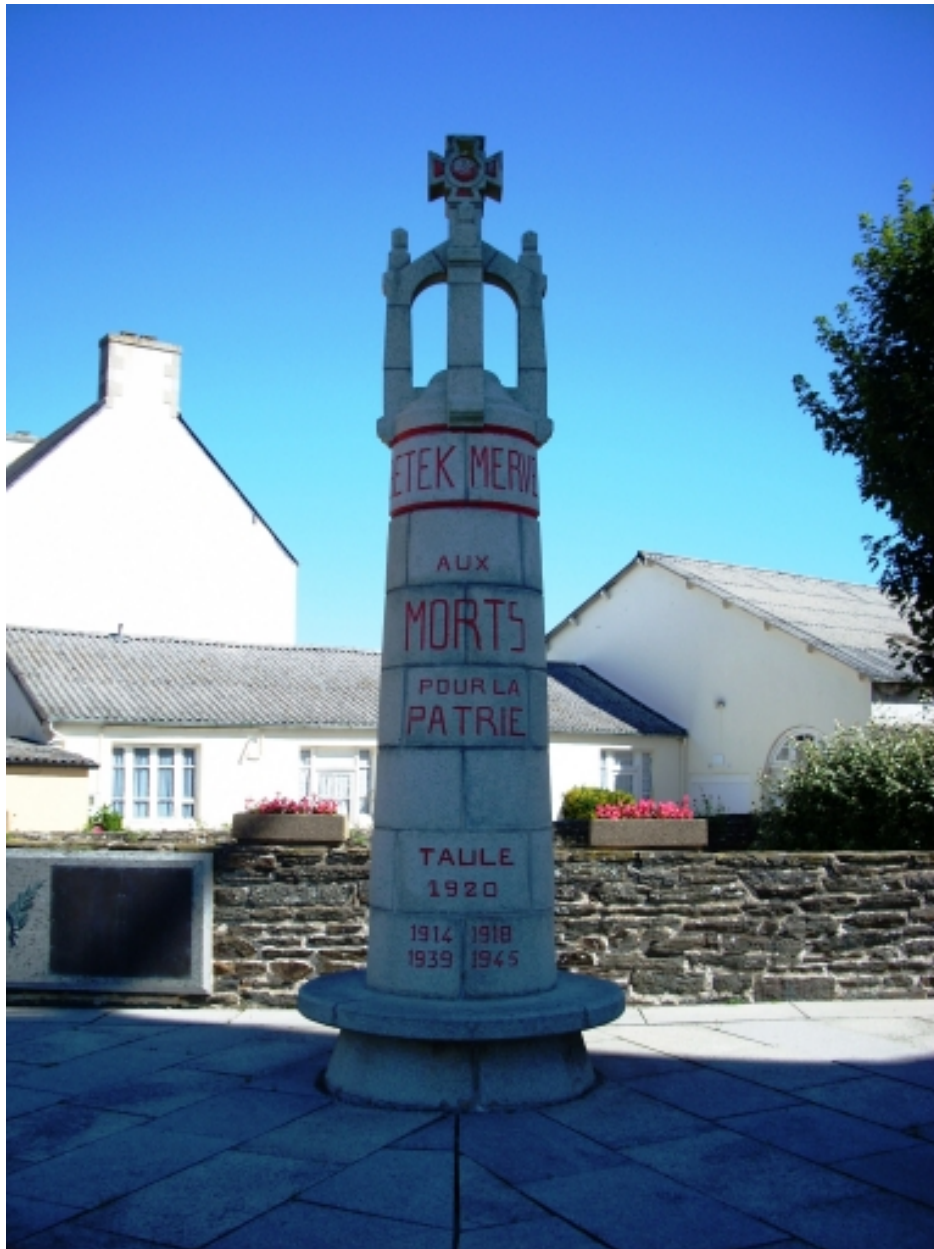
Taulé, église paroissiale Saint-Pierre : monument aux morts