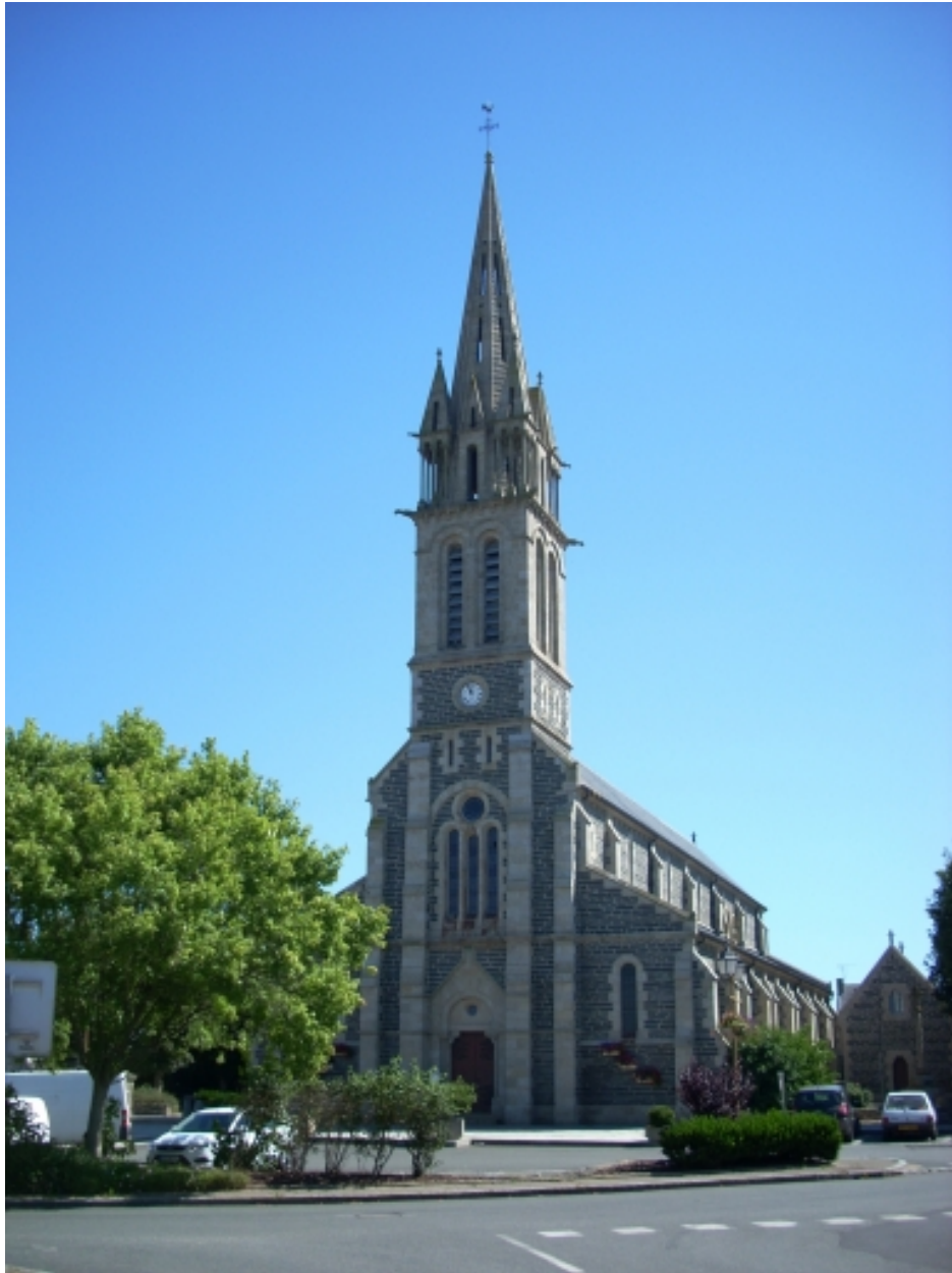
Taulé, église paroissiale Saint-Pierre : vue générale sud-ouest