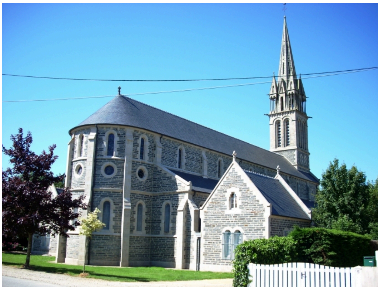
Taulé, église paroissiale Saint-Pierre : vue générale nord-est