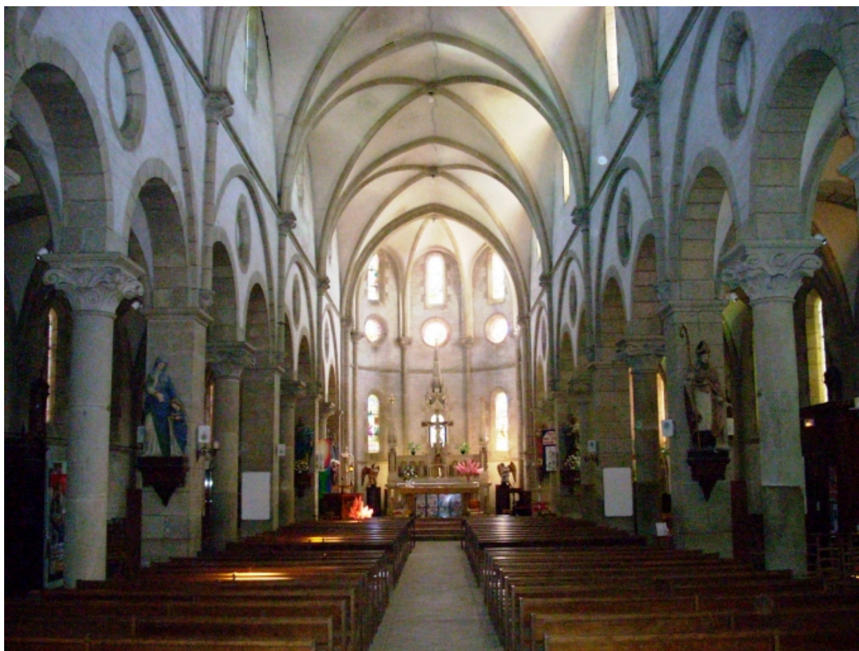
Taulé, église paroissiale Saint-Pierre : vue axiale est