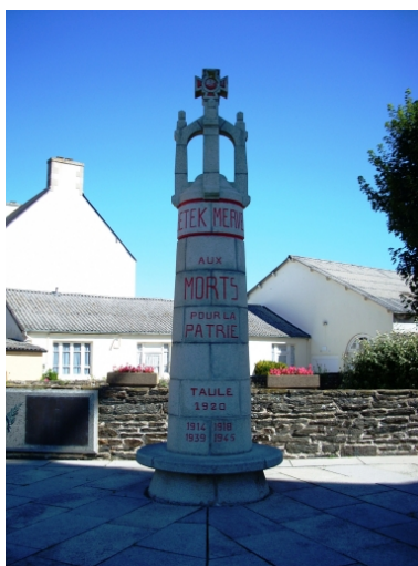
Taulé, église paroissiale Saint- Pierre : monument aux morts IVR53_20082906625NUCA