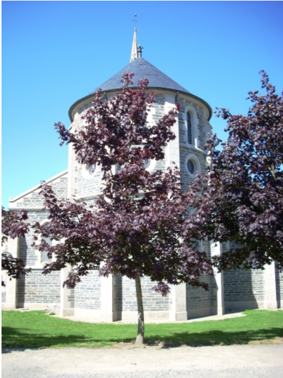
Taulé, église paroissiale Saint-Pierre : élévation est