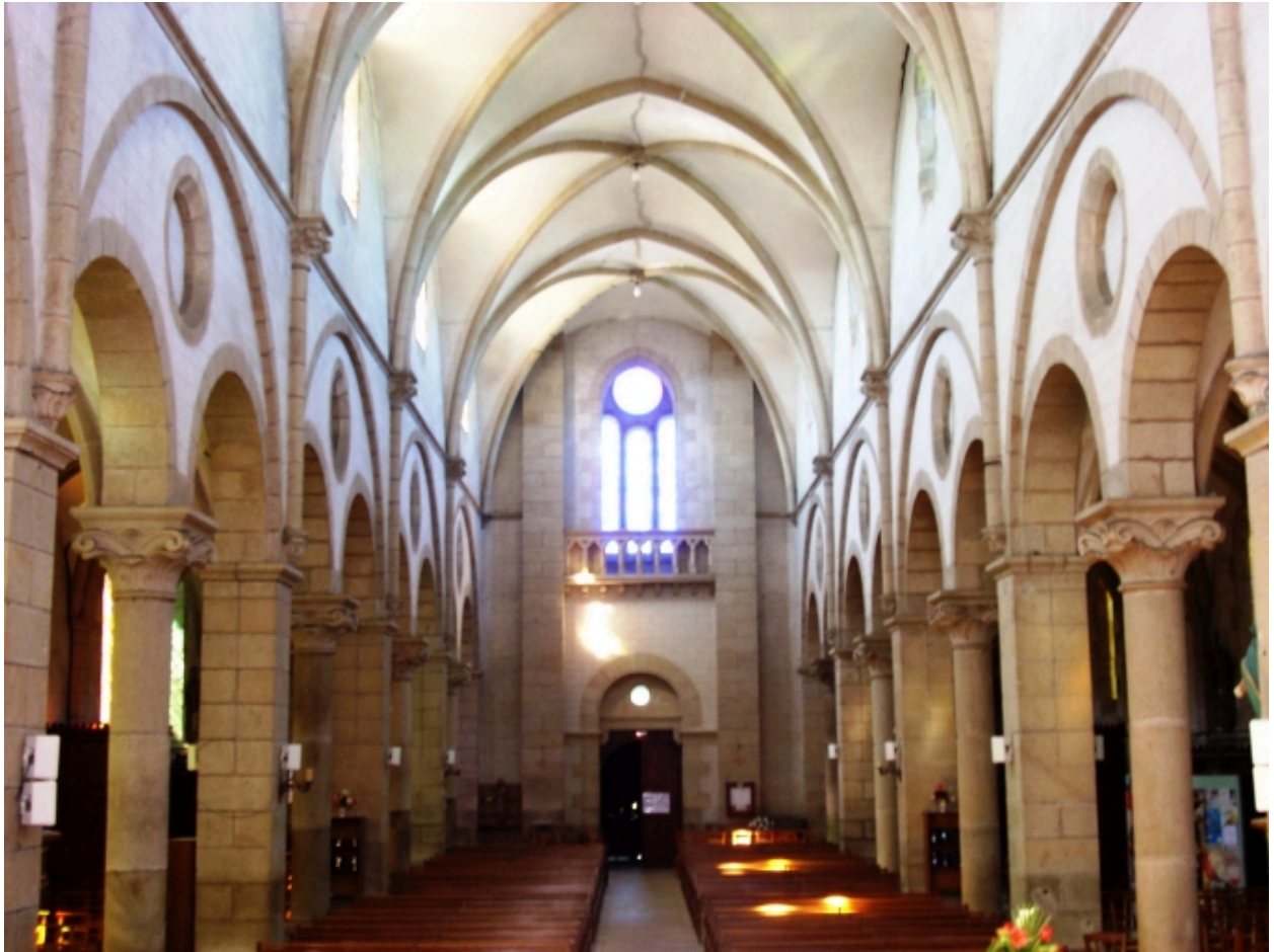
Taulé, église paroissiale Saint-Pierre : vue axiale ouest