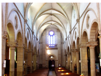
Taulé, église paroissiale Saint-Pierre : vue axiale ouest IVR53_20082906627NUCA