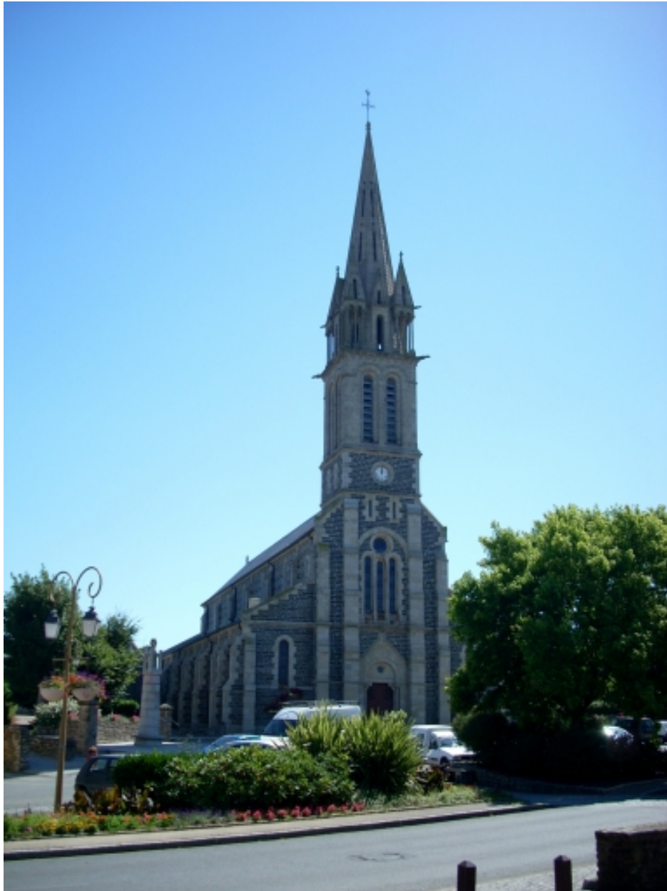
Taulé, église paroissiale Saint-Pierre : vue générale nord-ouest