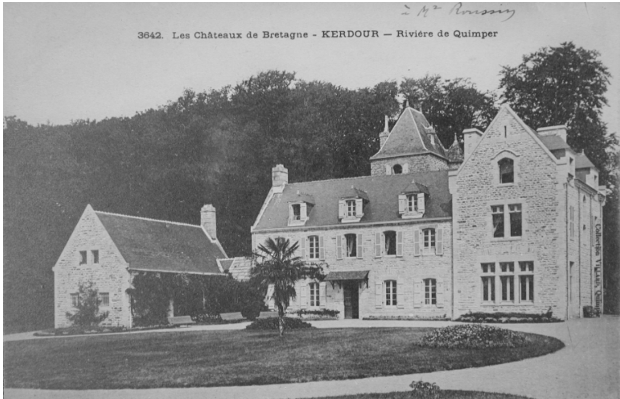
Vue générale façade principale