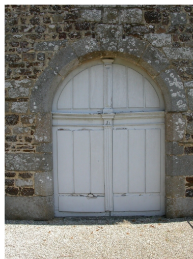
La porte d'entrée IVR53_20053517079NUCA