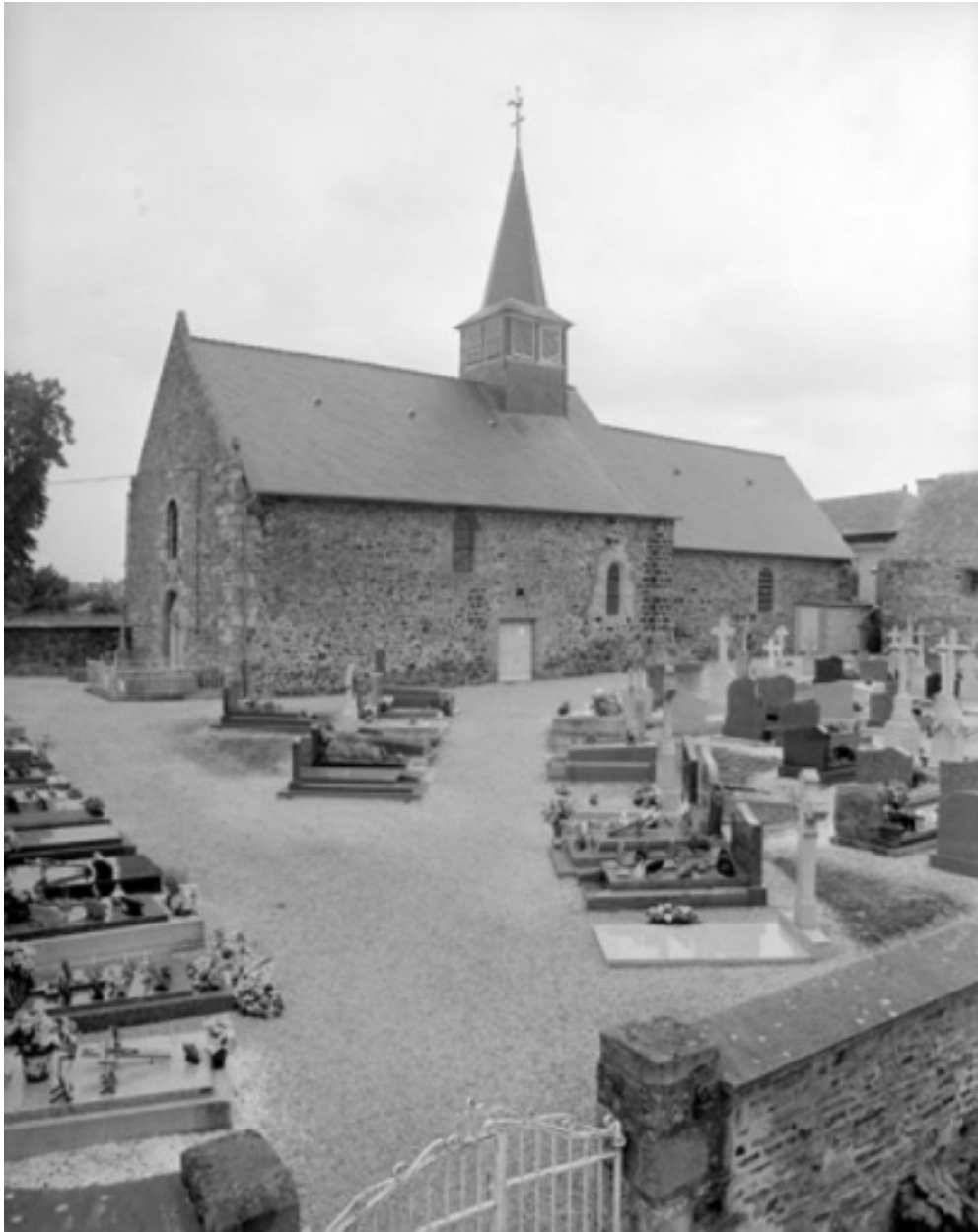
Vue générale : élévation sud