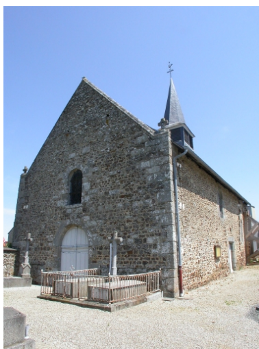
Elévation ouest