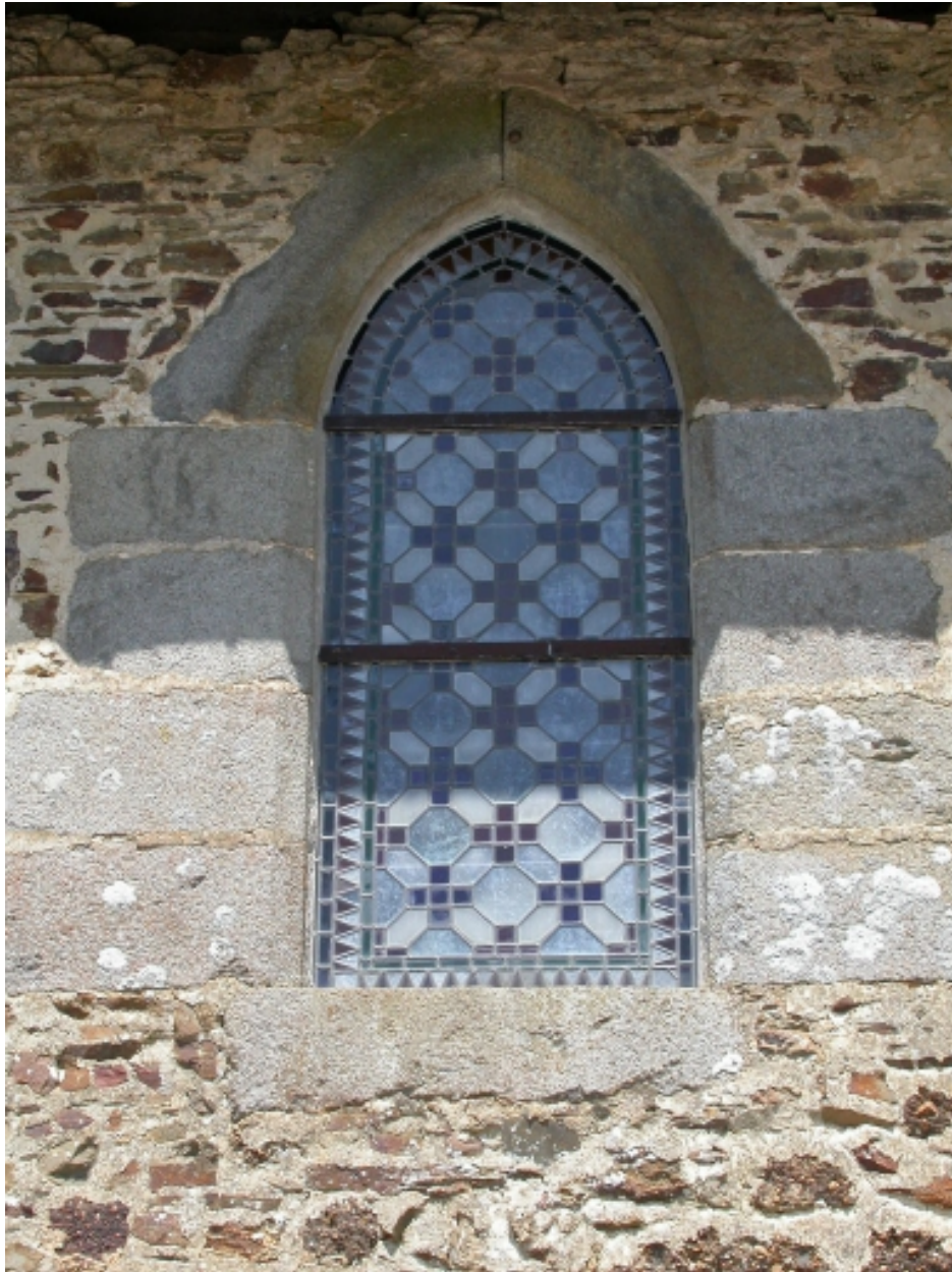
Baie façade sud