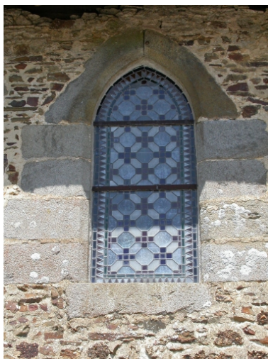
Baie façade sud IVR53_20053517081NUCA