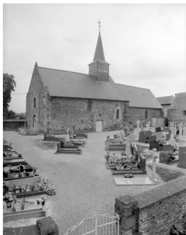
Vue générale : élévation sud IVR53_19943500895X