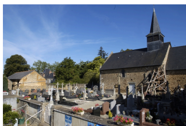
Elévation sud IVR53_20053502347NUCA