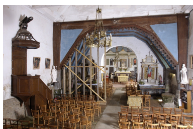
Vue intérieure prise de la nef vers le chœur IVR53_20053501652NUCA