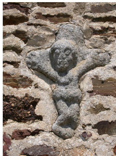
Façade sud : Christ en granite IVR53_20053517082NUCA