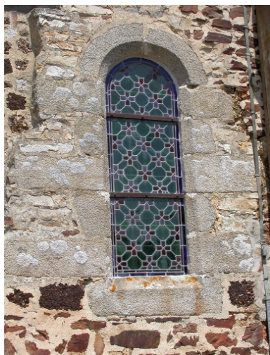
Baie façade sud IVR53_20053517080NUCA