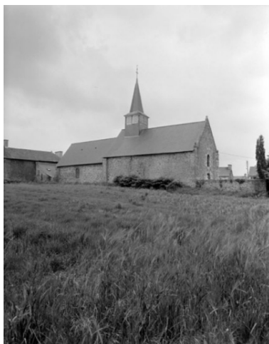
Élévation nord IVR53_19943500921X