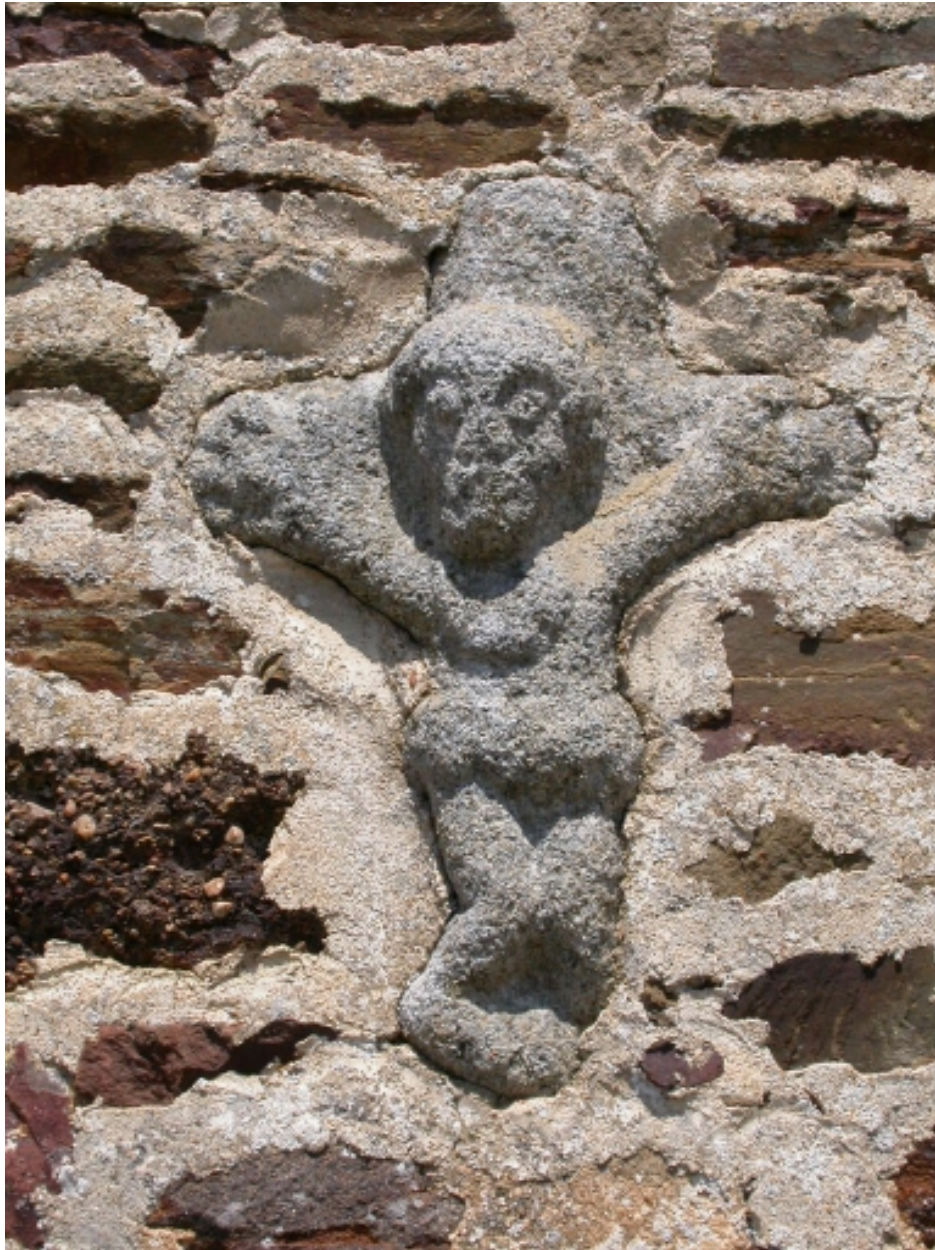
Façade sud : Christ en granite