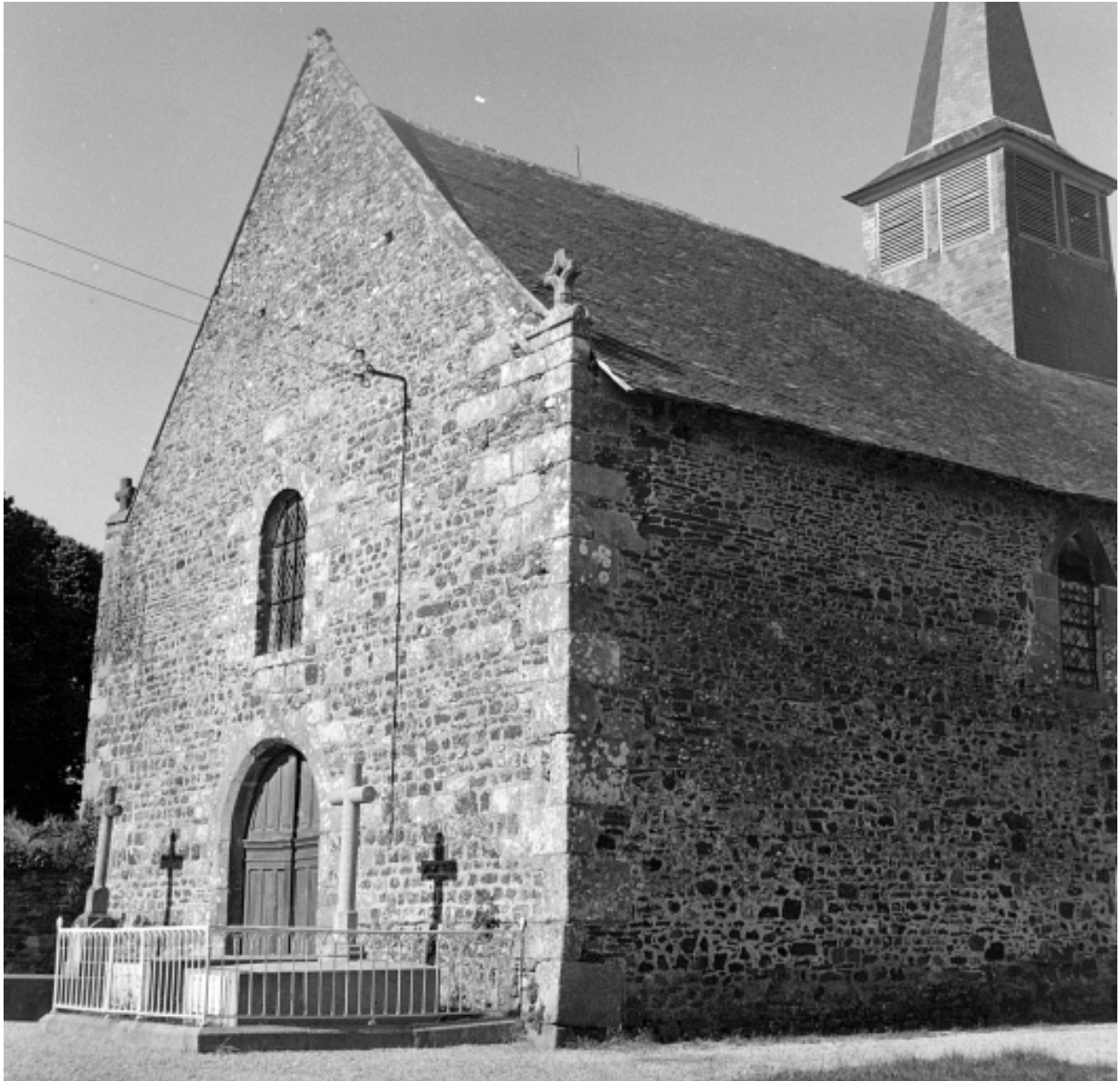
L'entrée de l'église