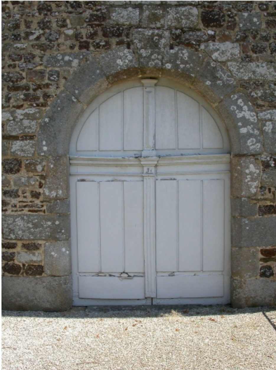
La porte d'entrée