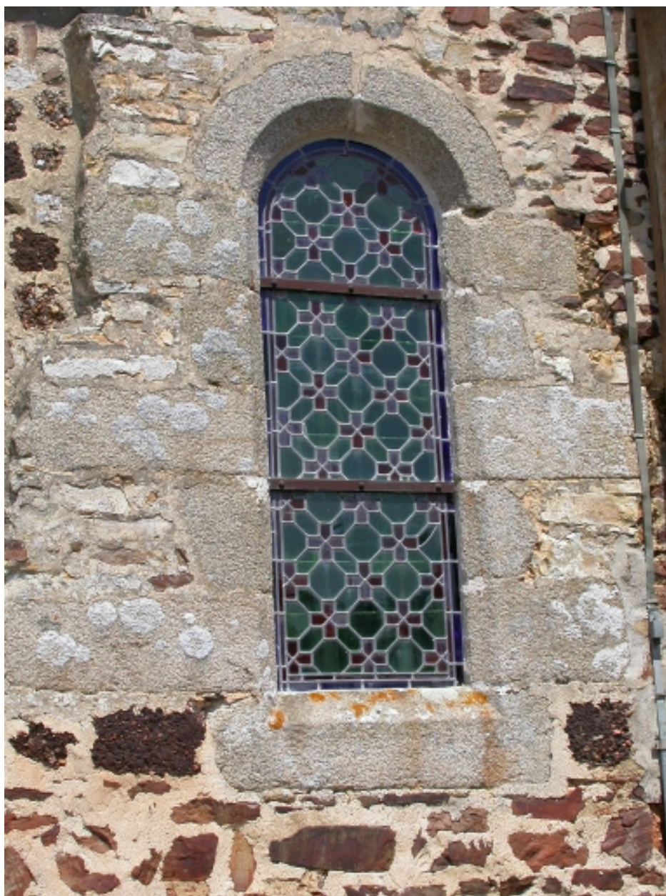
Baie façade sud