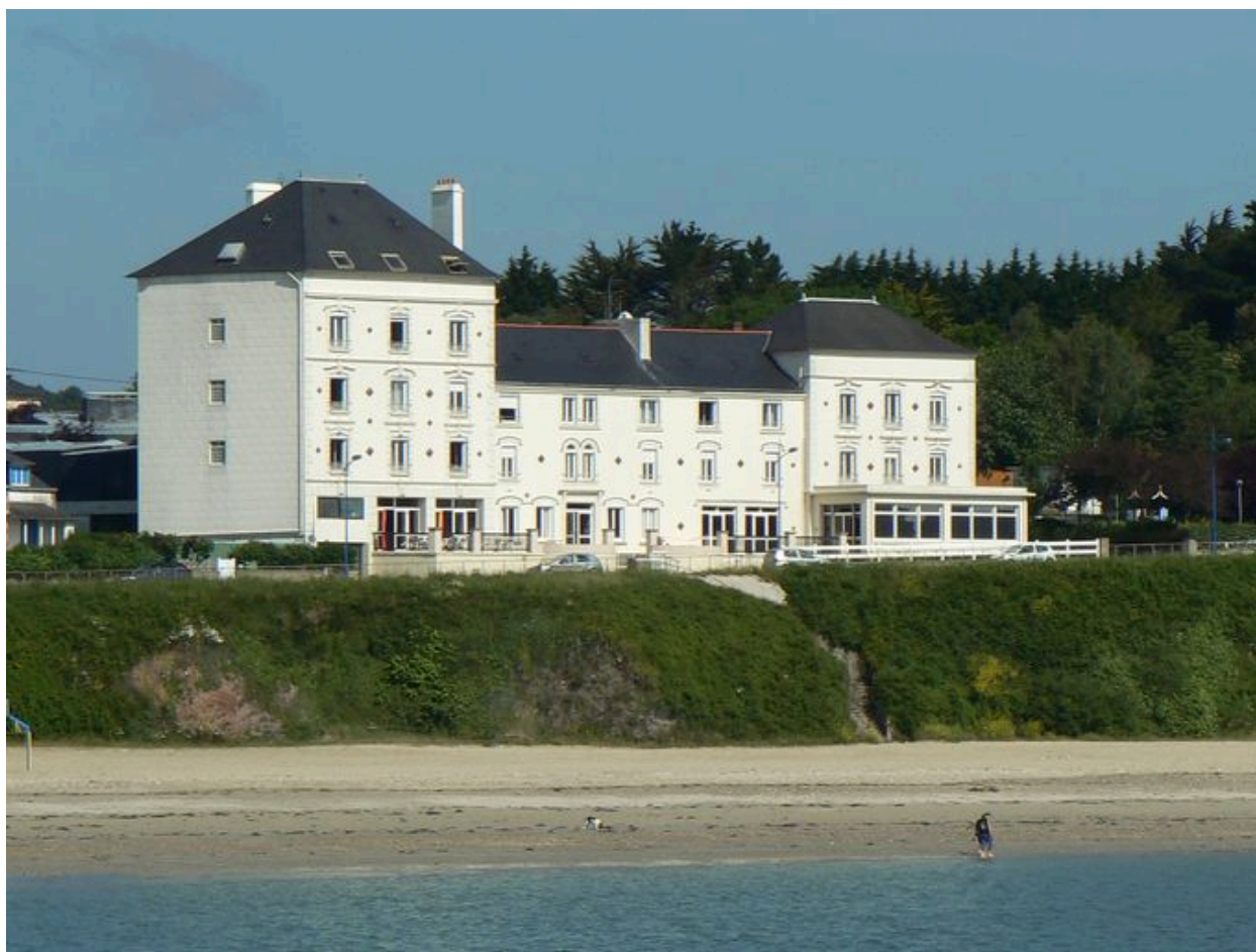
Vue générale du Grand Hôtel de la Plage, face à la mer