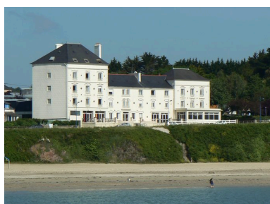
Vue générale du Grand Hôtel de la Plage, face à la mer