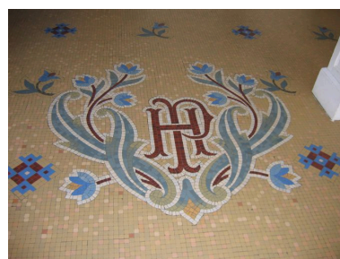
Céramique dans le hall d'entrée du Grand Hôtel de la Plage