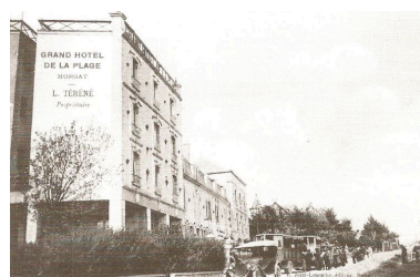
Vue ancienne du Grand Hôtel de la Plage IVR53_20072908734NUC