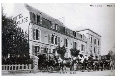
Reclame pour le Grand Hôtel de la Plage au début du 20e siècle