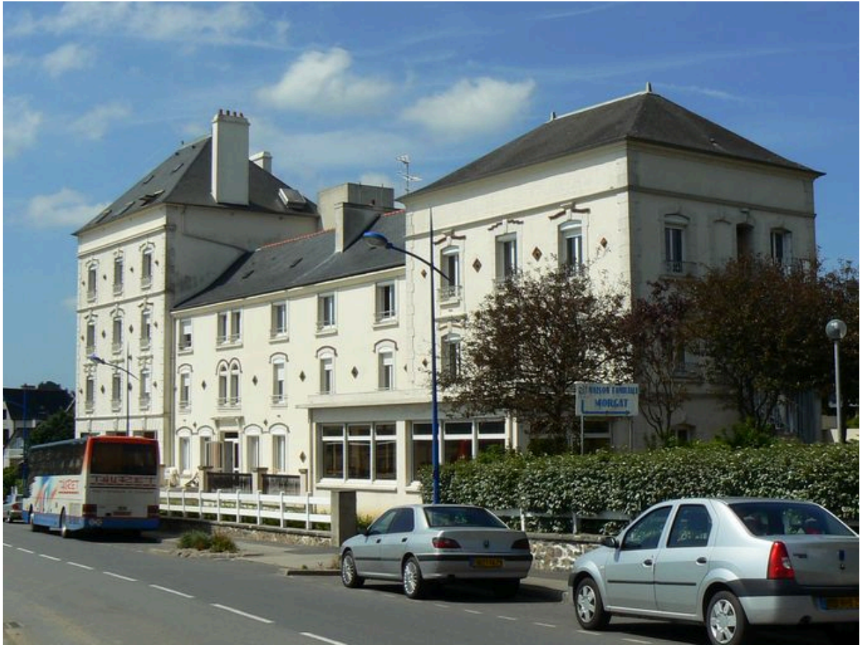
Vue du Grand Hôtel de la plage de trois-quarts