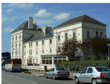
Vue du Grand Hôtel de la Plage de trois-quarts