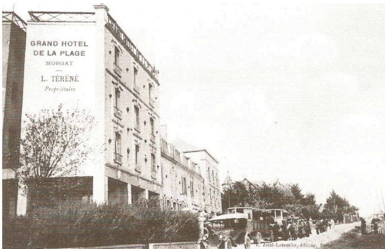
Vue ancienne du Grand Hôtel de la Plage