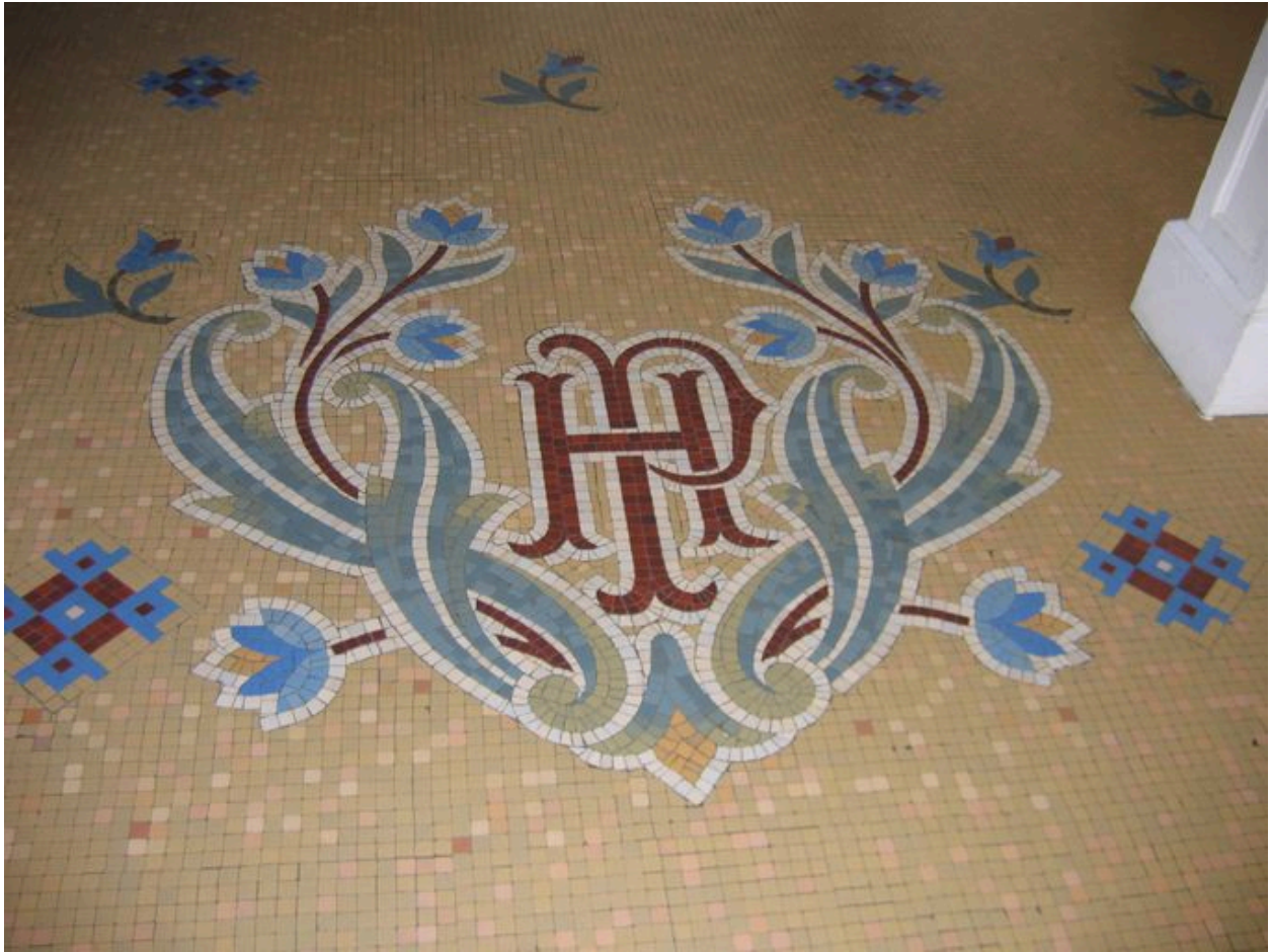
Céramique dans le hall d'entrée du Grand Hôtel de la Plage