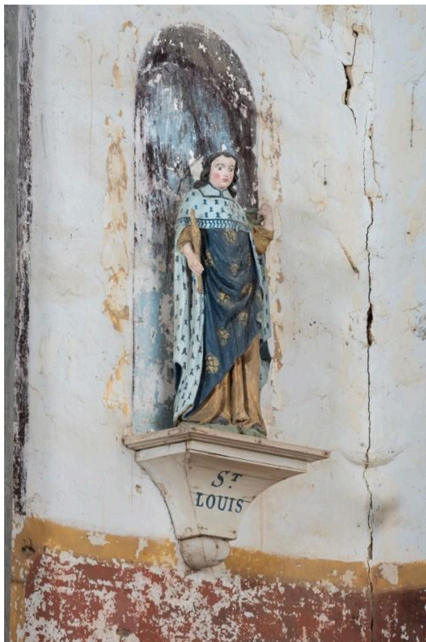
Statue en bois de saint Louis habillé avec un décor d'hermines et fleur de lys ; le roi porte un sceptre et une couronne d'épine