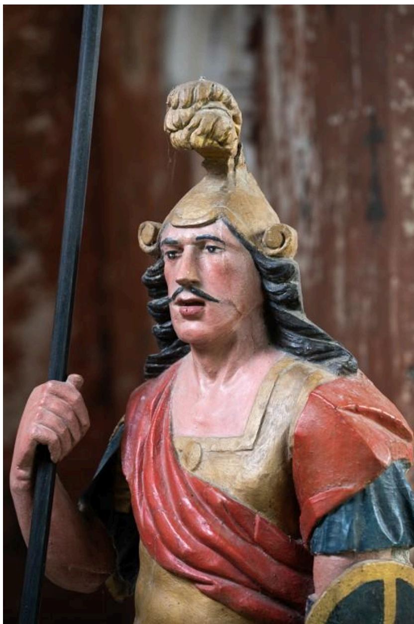
Statue de saint Maurice