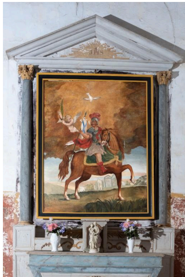
Tableau du retable secondaire 1835 ; Saint-Maurice à cheval armé de sa lance IVR53_20252201700NUCA