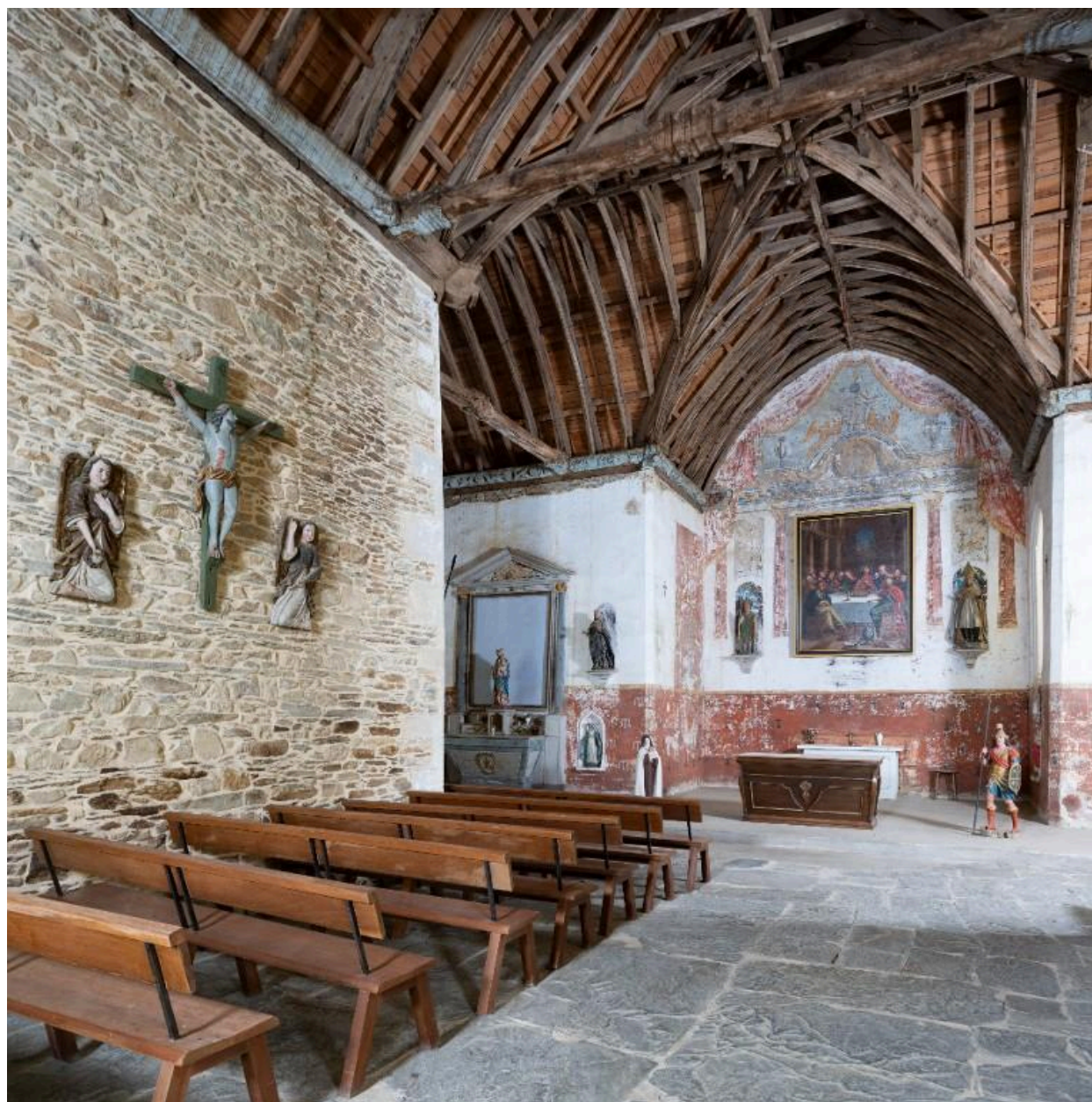
Vu générale vers le chœur