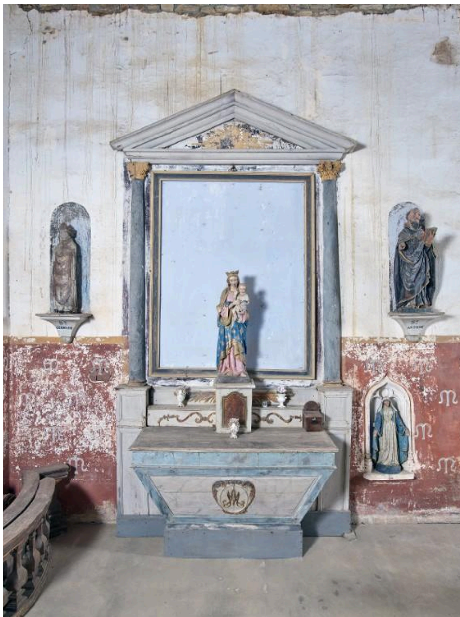
Vue axiale du retable secondaire nord