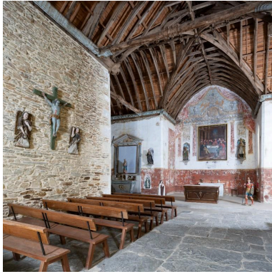
Vu générale vers le chœur IVR53_20252201686NUCA