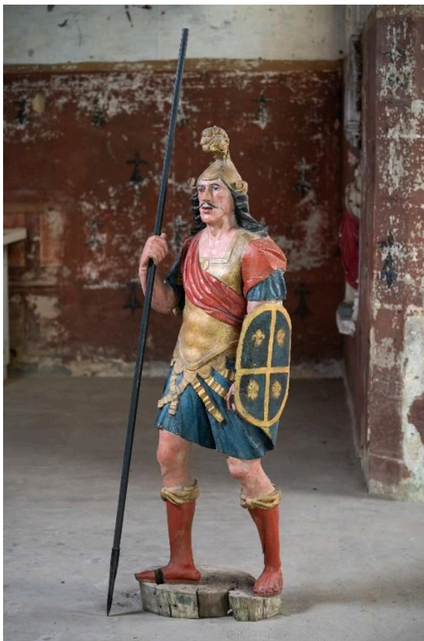
Statue de saint Maurice