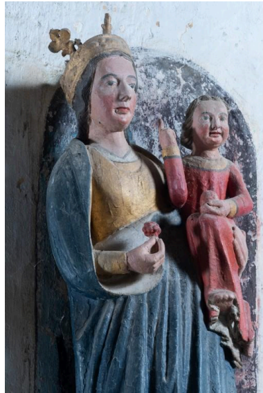
Statue de Notre Dame de Bon Secours IVR53_20252201706NUCA