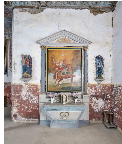
Retable secondaire sud IVR53_20252201658NUCA