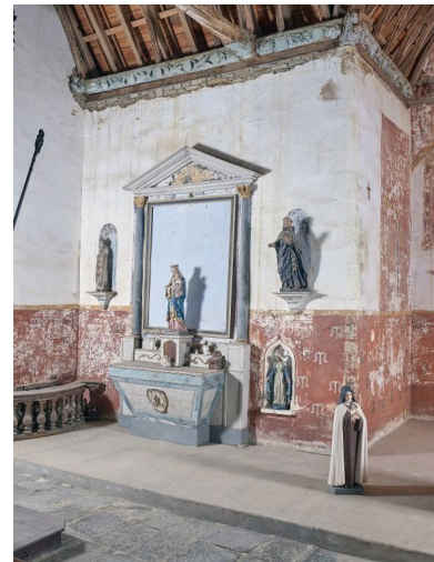
Retable secondaire du transept nord