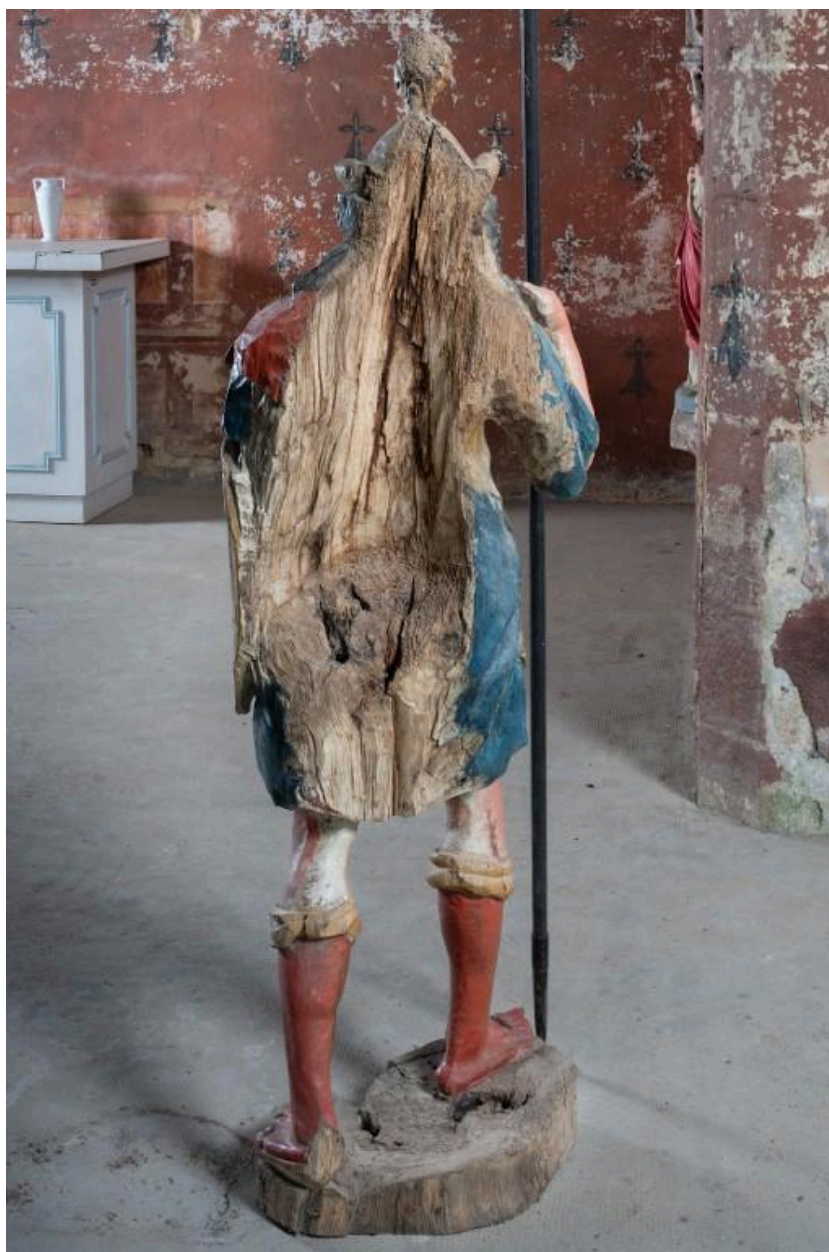
Revers de la statue de saint Maurice