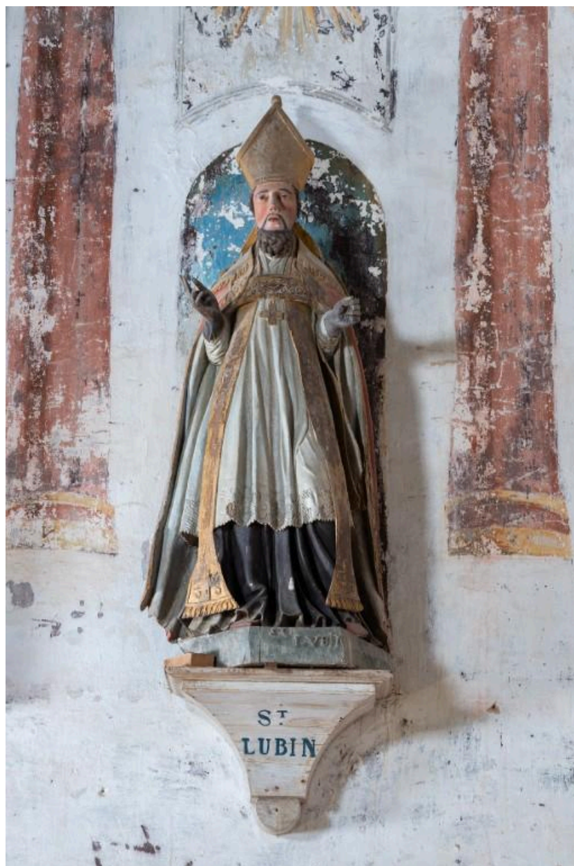
Statue en bois de saint Lubin évêque