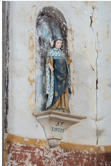
Statue en bois de saint Louis habillé avec un décor d'hermines et fleur de lys ; le roi porte un sceptre et une couronne d'épine IVR53_20252201699NUCA