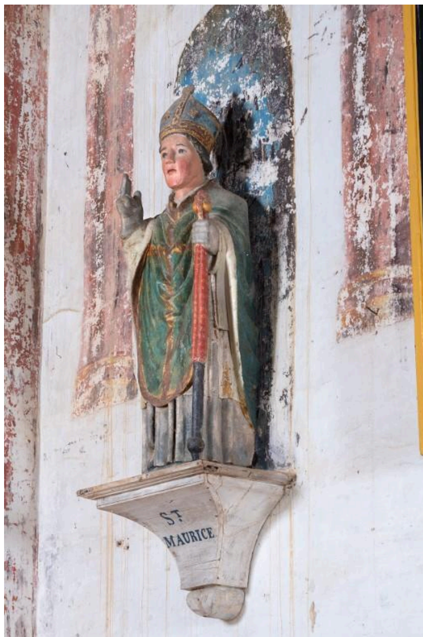
Statue en bois de saint Maurice , évêque qui tient un bourdon