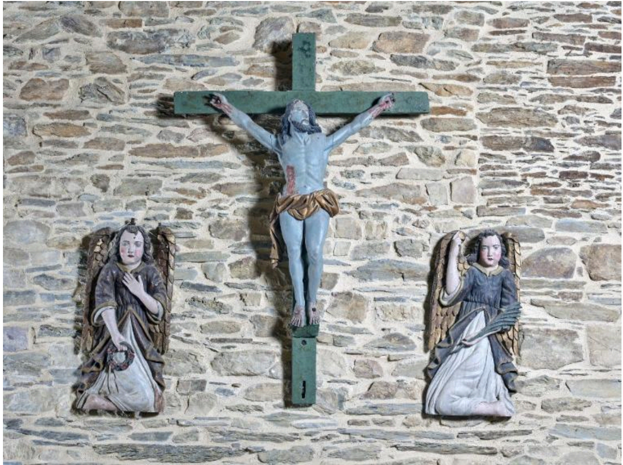
Christ en croix encadré de deux anges . mobilier qui possède des tenons et mortaises , qui proviendrait d'une poutre de gloire