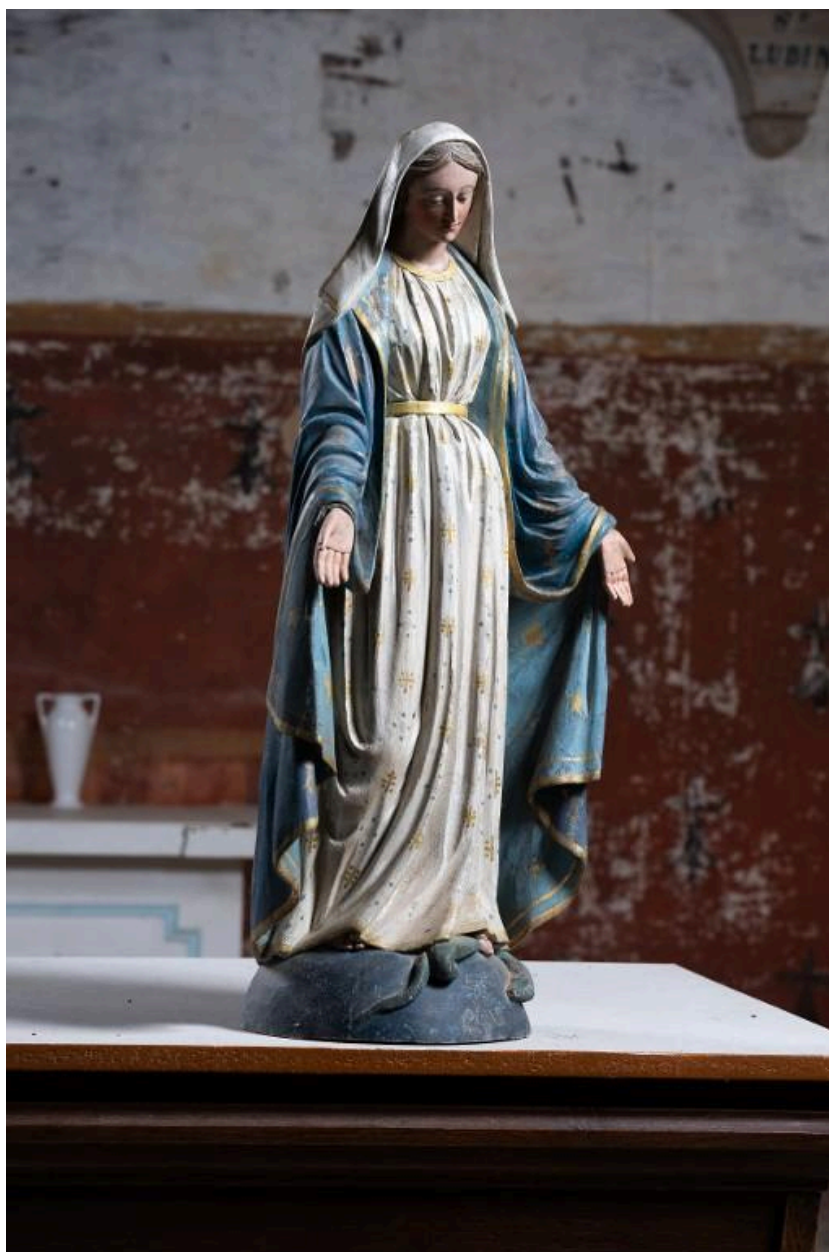
Statue de la Vierge