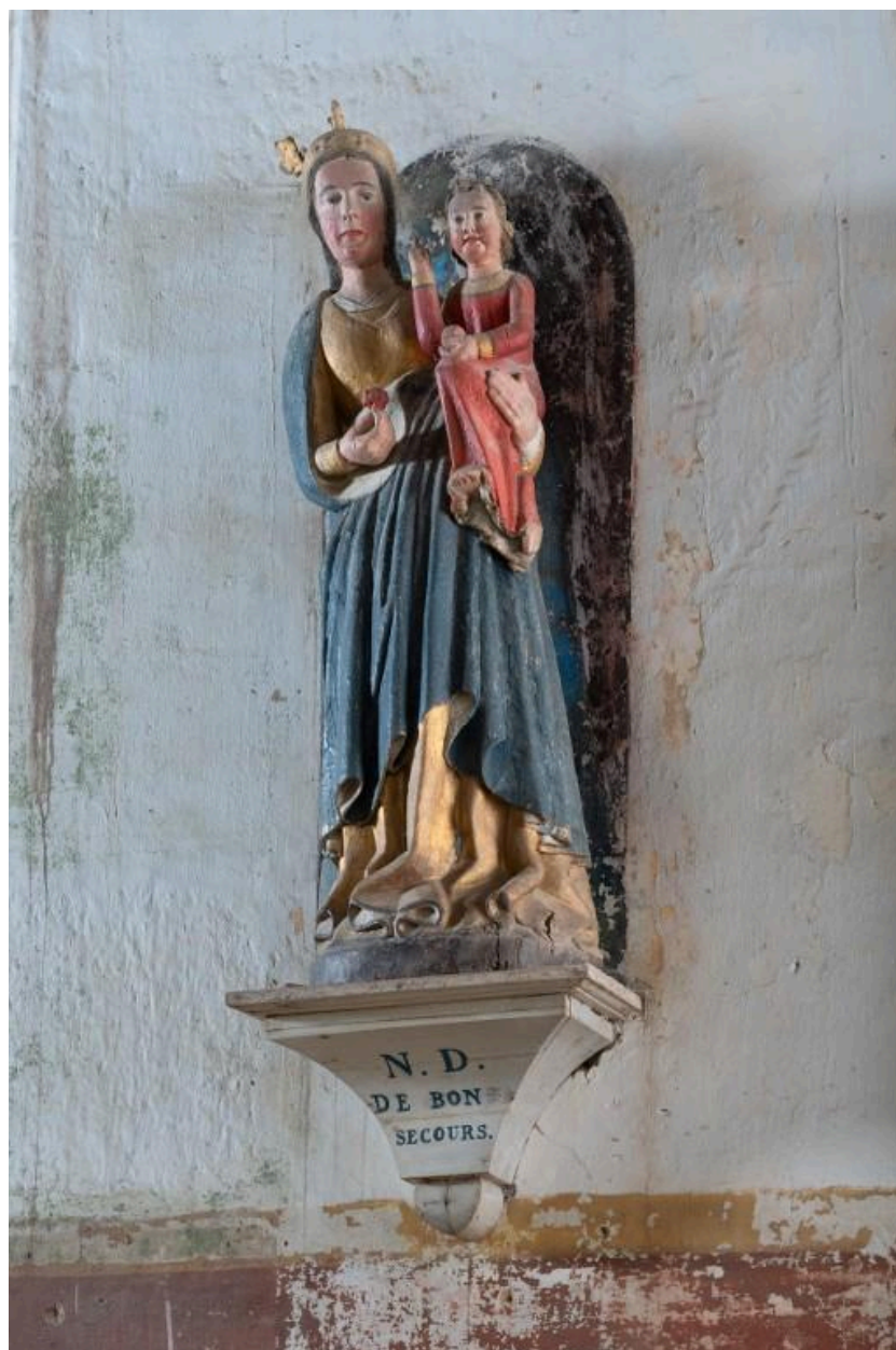
Statue en bois de Notre Dame de Bon Secours