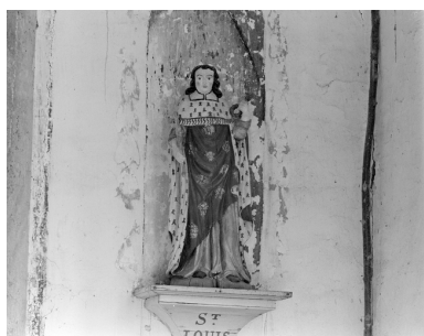
Statue de saint Louis IVR53_19962200332X