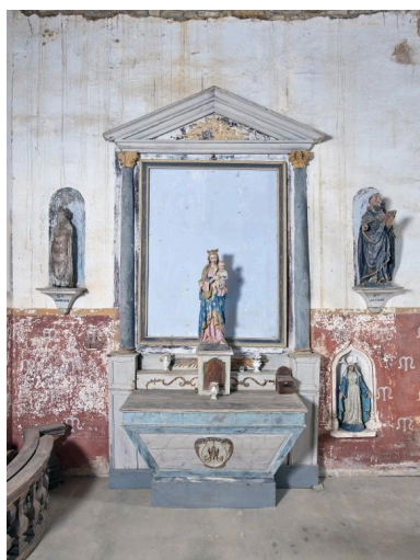
Vue axiale du retable secondaire nord IVR53_20252201657NUCA