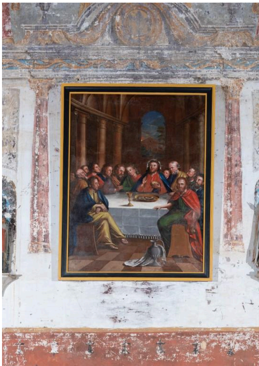
Tableau du maître autel , la Cène peint en 1835