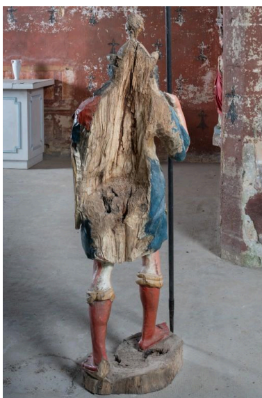
Revers de la statue de saint Maurice IVR53_20252201722NUCA