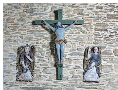
Christ en croix encadré de deux anges. mobilier qui possède des tenons et mortaises, qui proviendrait d'une poutre de gloire IVR53_20252201655NUCA