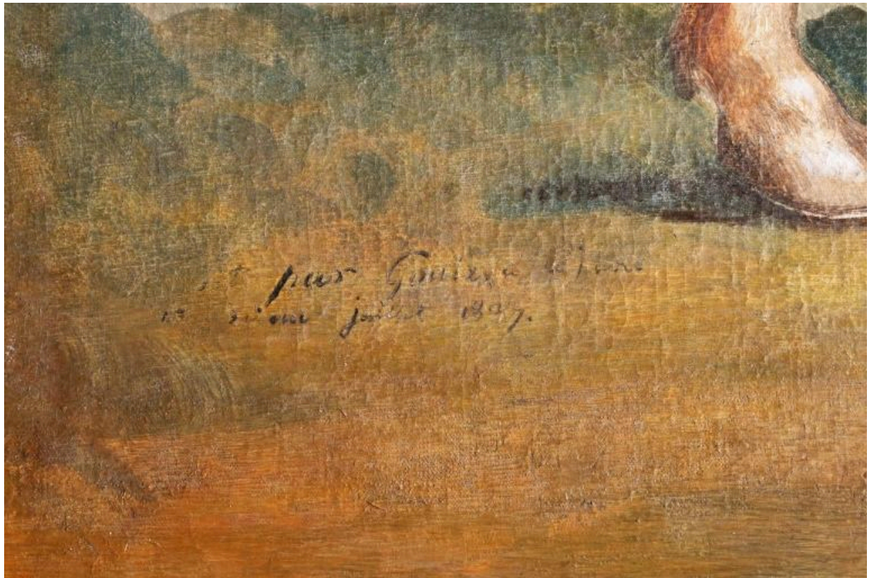
Signature du tableau de saint Maurice à cheval datée juillet 1837