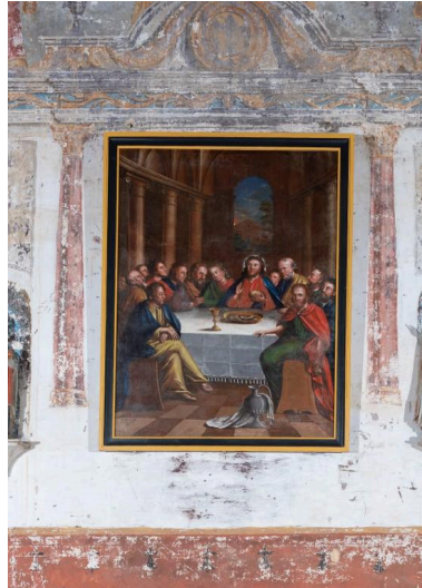
Tableau du maître autel, la Cène peint en 1835