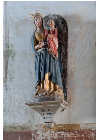
Statue en bois de Notre Dame de Bon Secours