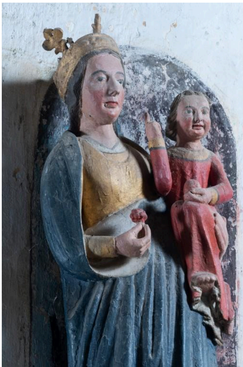
Statue de Notre Dame de Bon Secours