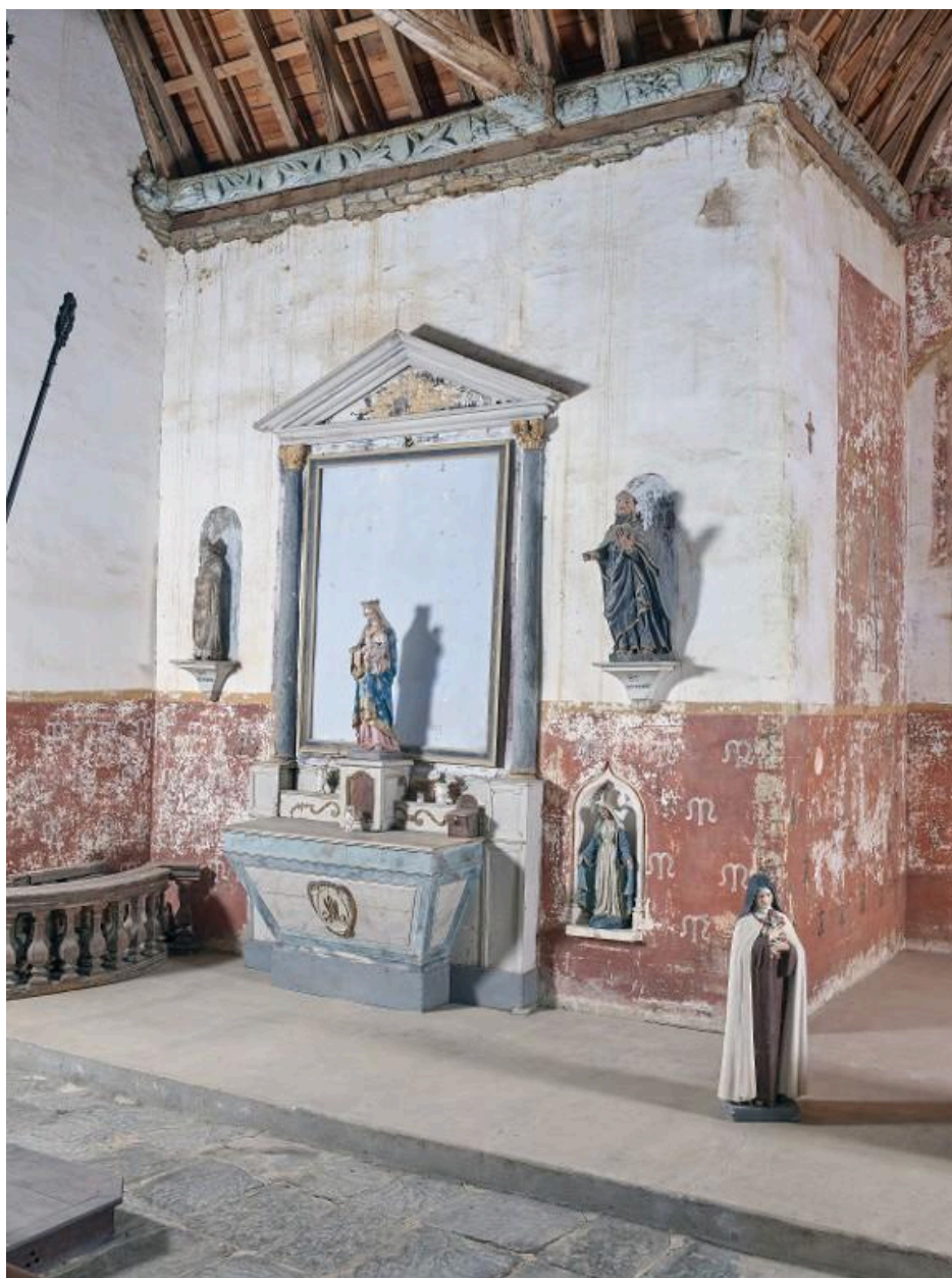
Retable secondaire du transept nord