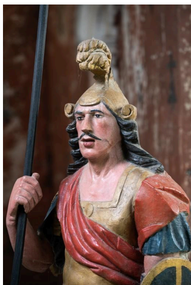
Statue de saint Maurice