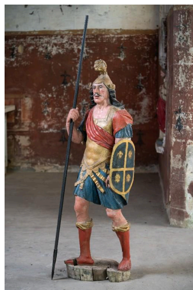
Statue de saint Maurice IVR53_20252201724NUCA