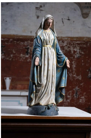
Statue de la Vierge IVR53_20252201729NUCA