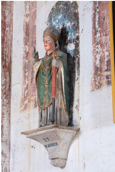
Statue en bois de saint Maurice, évêque qui tient un bourdon