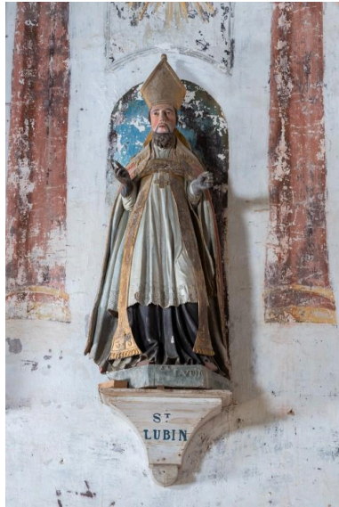
Statue en bois de saint Lubin évêque IVR53_20252201697NUCA