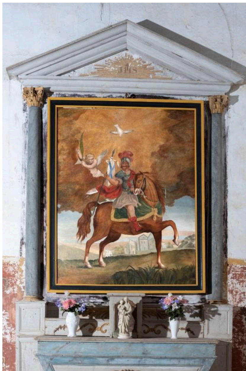
Tableau du retable secondaire 1835 ; Saint-Maurice à cheval armé de sa lance