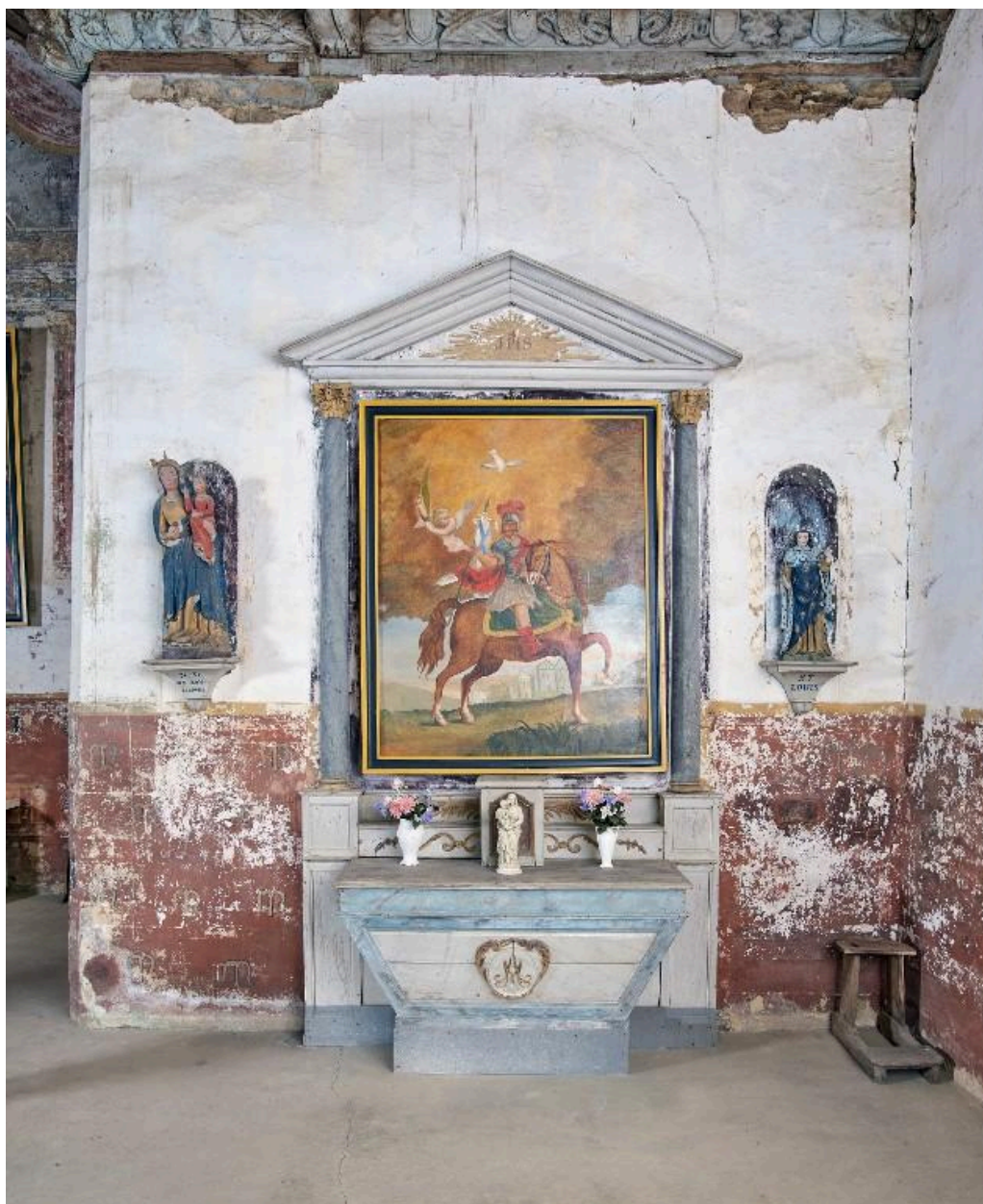
Retable secondaire sud