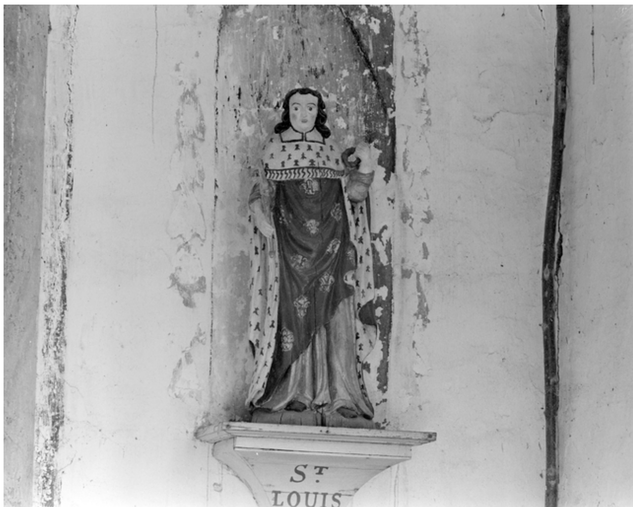
Statue de saint Louis