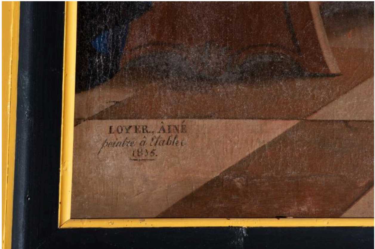
Signature du tableau de la Cène datée 1835 ,avec l'inscription Loyer Aîné peintre à Etablec