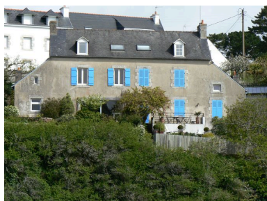
Façade de la maison 'Joseph Tonnerre', côté ria IVR53_20082908703NUCA