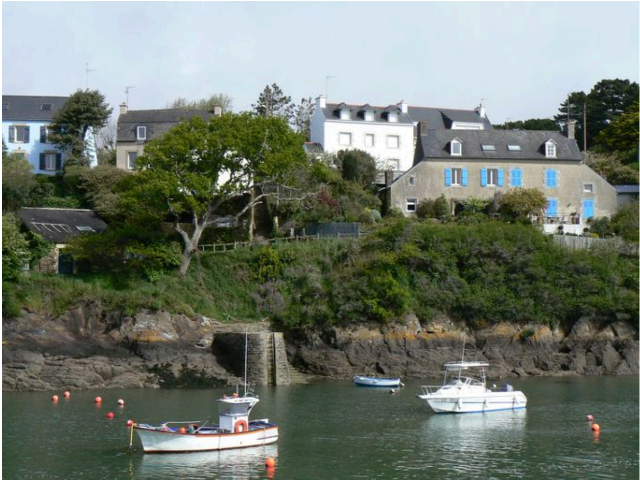
Vue générale de la maison 'Joseph Tonnerre'