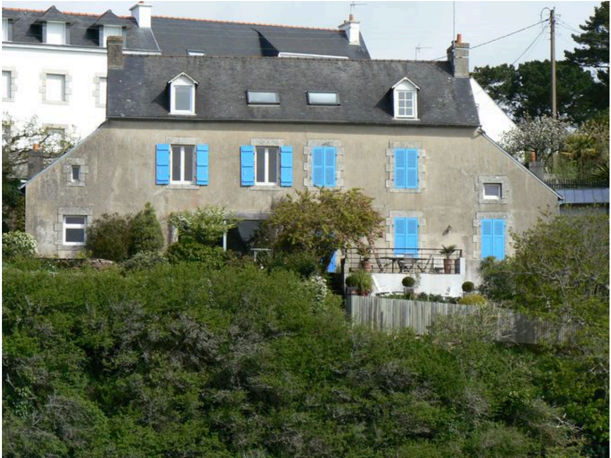
Façade de la maison 'Joseph Tonnerre', côté ria