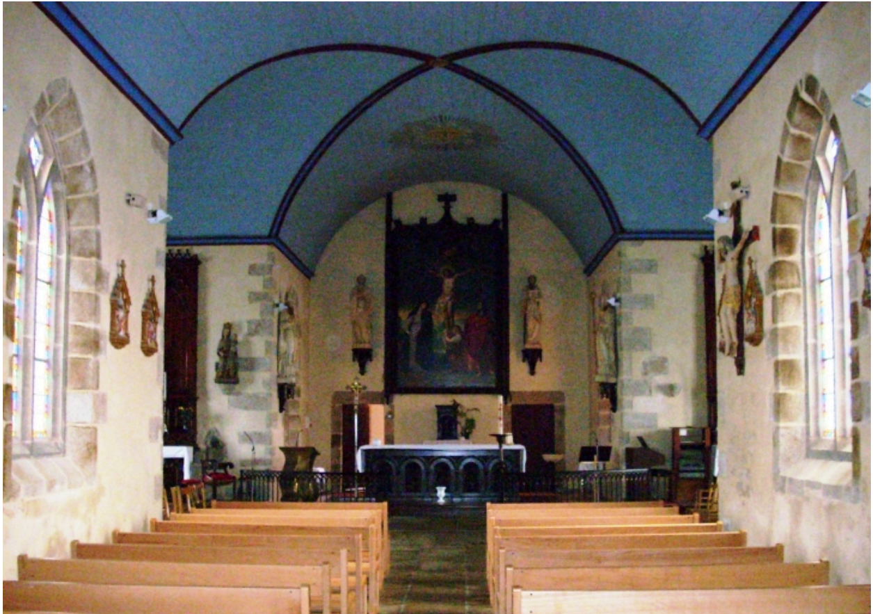
Lanarvily, église paroissiale : vue axiale est