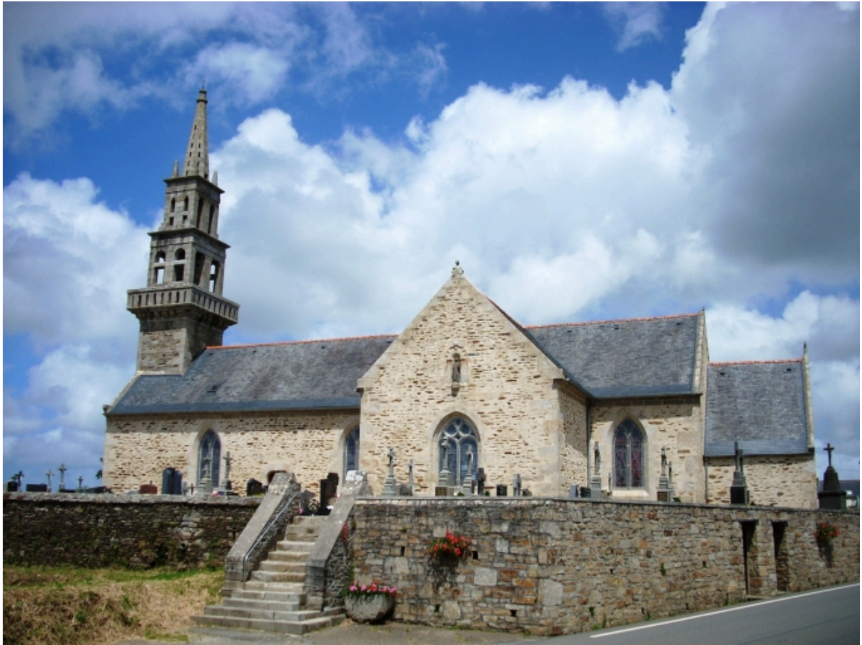
Lanarvily, église paroissiale : vue générale sud-est