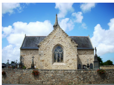
Lanarvily, église paroissiale : élévation est IVR53_20082906322NUCA