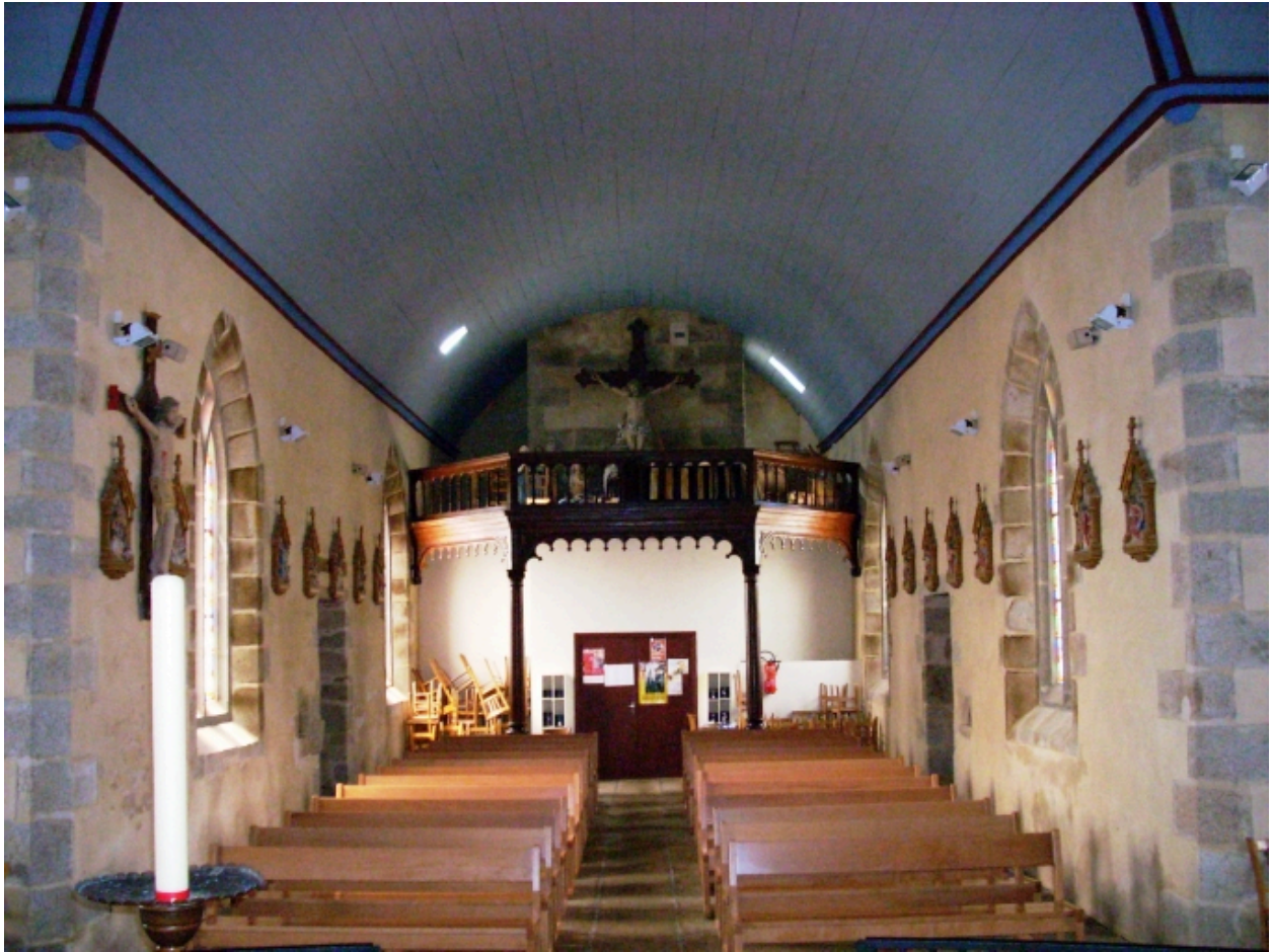
Lanarvily, église paroissiale : vue axiale ouest