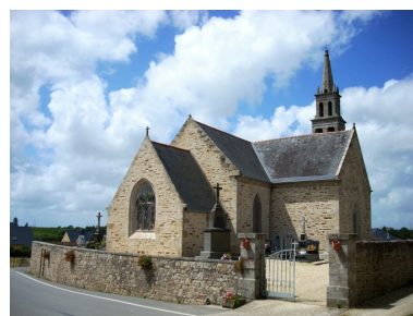
Lanarvily, église paroissiale : vue générale nord-est