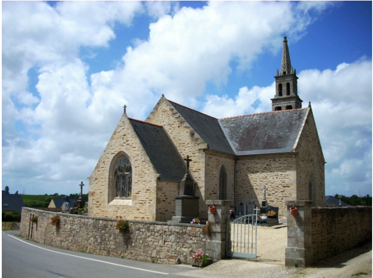
Lanarvily, église paroissiale : vue générale nord-est