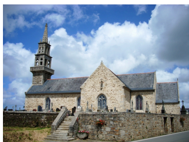
Lanarvily, église paroissiale : vue générale sud-est IVR53_20082906319NUCA