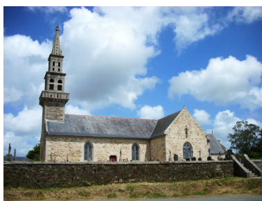
Lanarvily, église paroissiale : vue générale sud-ouest