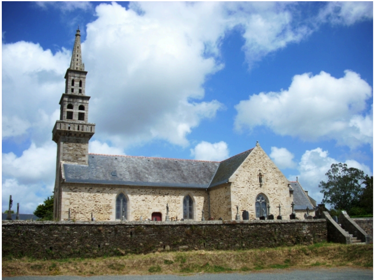
Lanarvily, église paroissiale : vue générale sud-ouest