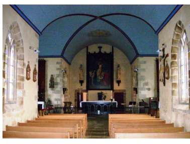
Lanarvily, église paroissiale : vue axiale est