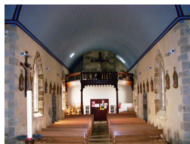
Lanarvily, église paroissiale : vue axiale ouest IVR53_20082906324NUCA