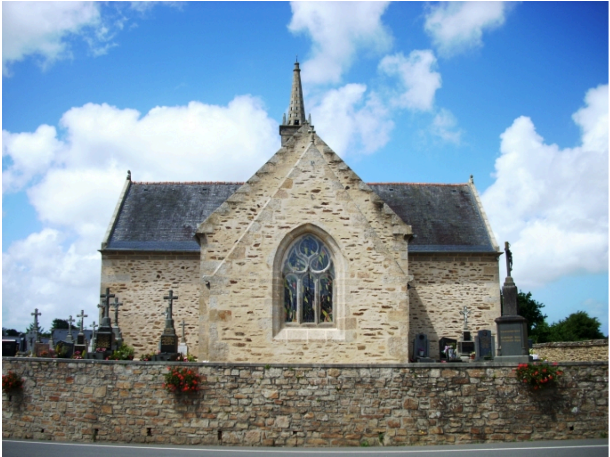
Lanarvily, église paroissiale : élévation est