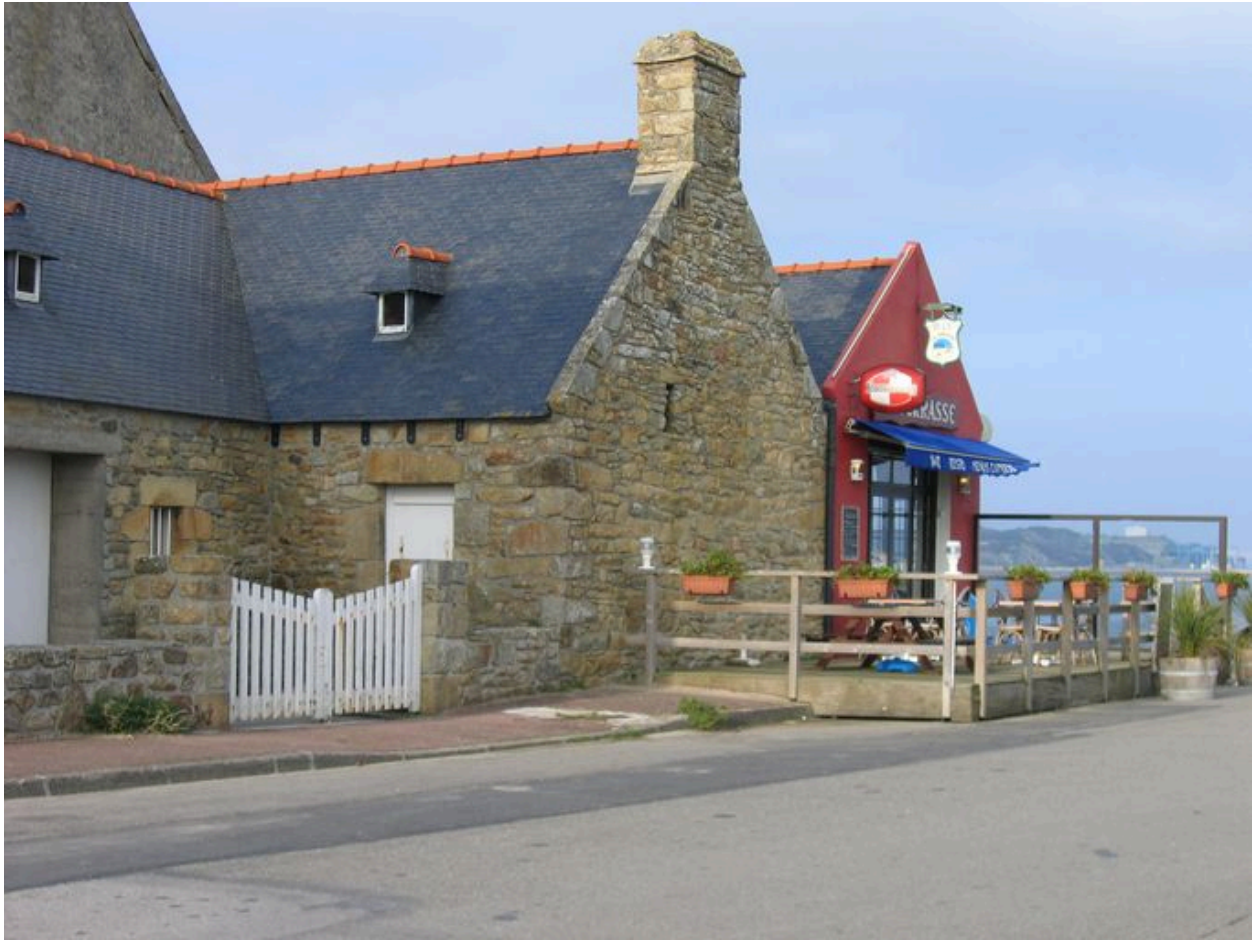
Vue latérale de l'Hôtel de la Terrasse