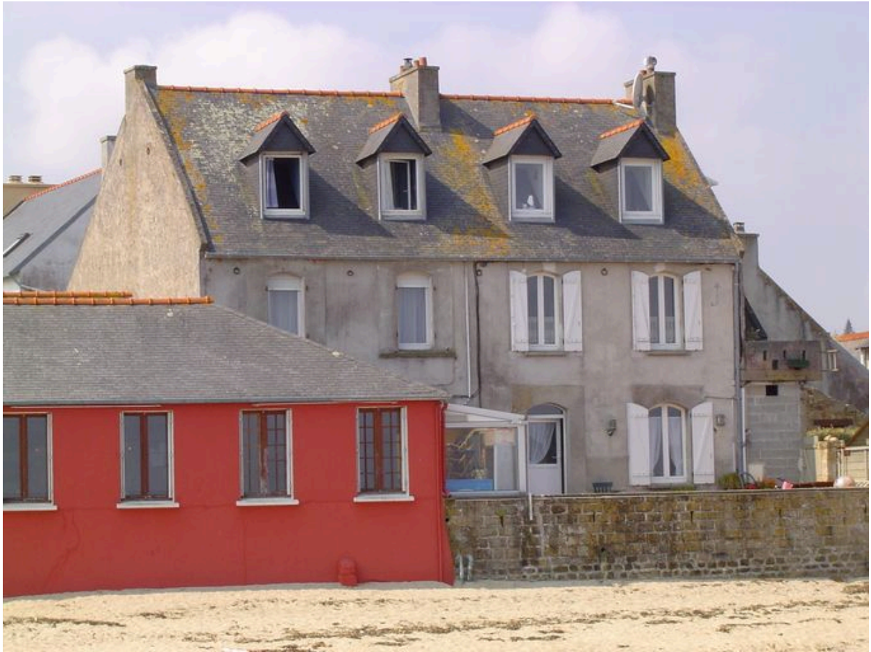
Vue générale de l'Hôtel de la Terrasse