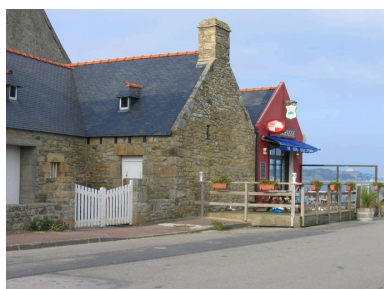
Vue latérale de l'Hôtel de la Terrasse IVR53_20062908552NUCA