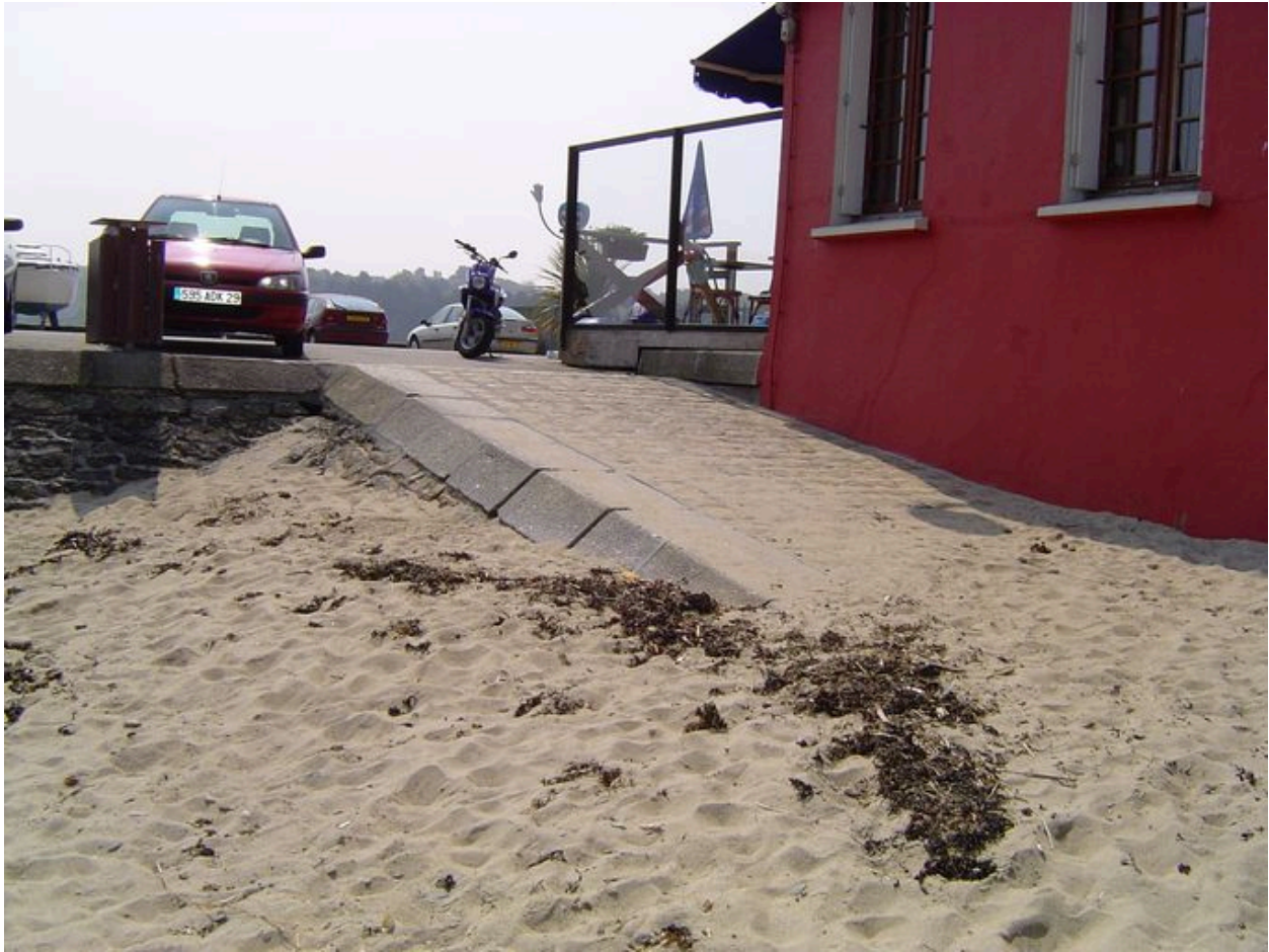
Cale de l'Hôtel de la Terrasse