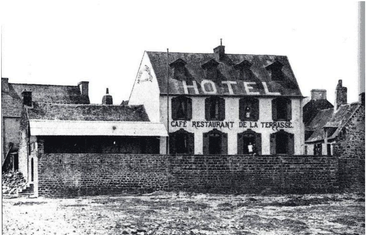
Café-hôtel La Terrasse au début du 20e siècle (?)