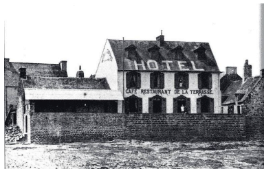
Café-hôtel La Terrasse au début du 20e siècle (?) IVR53_20072908852NUC