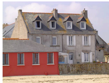
Vue générale de l'Hôtel de la Terrasse IVR53_20062908521NUCA