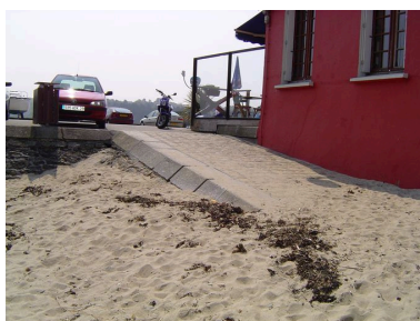
Cale de l'Hôtel de la Terrasse