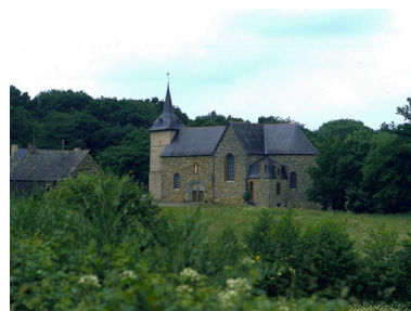
Vue de situation sud-est IVR53_19993501137XA