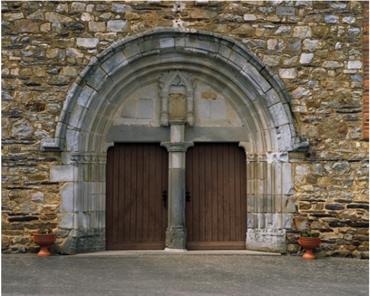
L'ancien porche remployé et la statue de Notre-Dame : vue générale sud