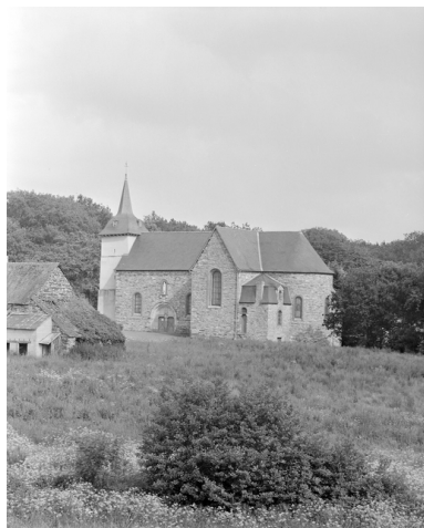
Vue de situation sud-est