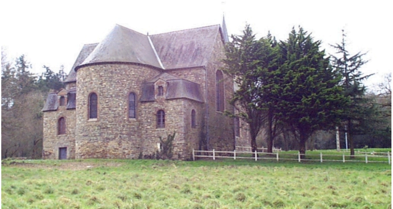
Vue de situation nord-est