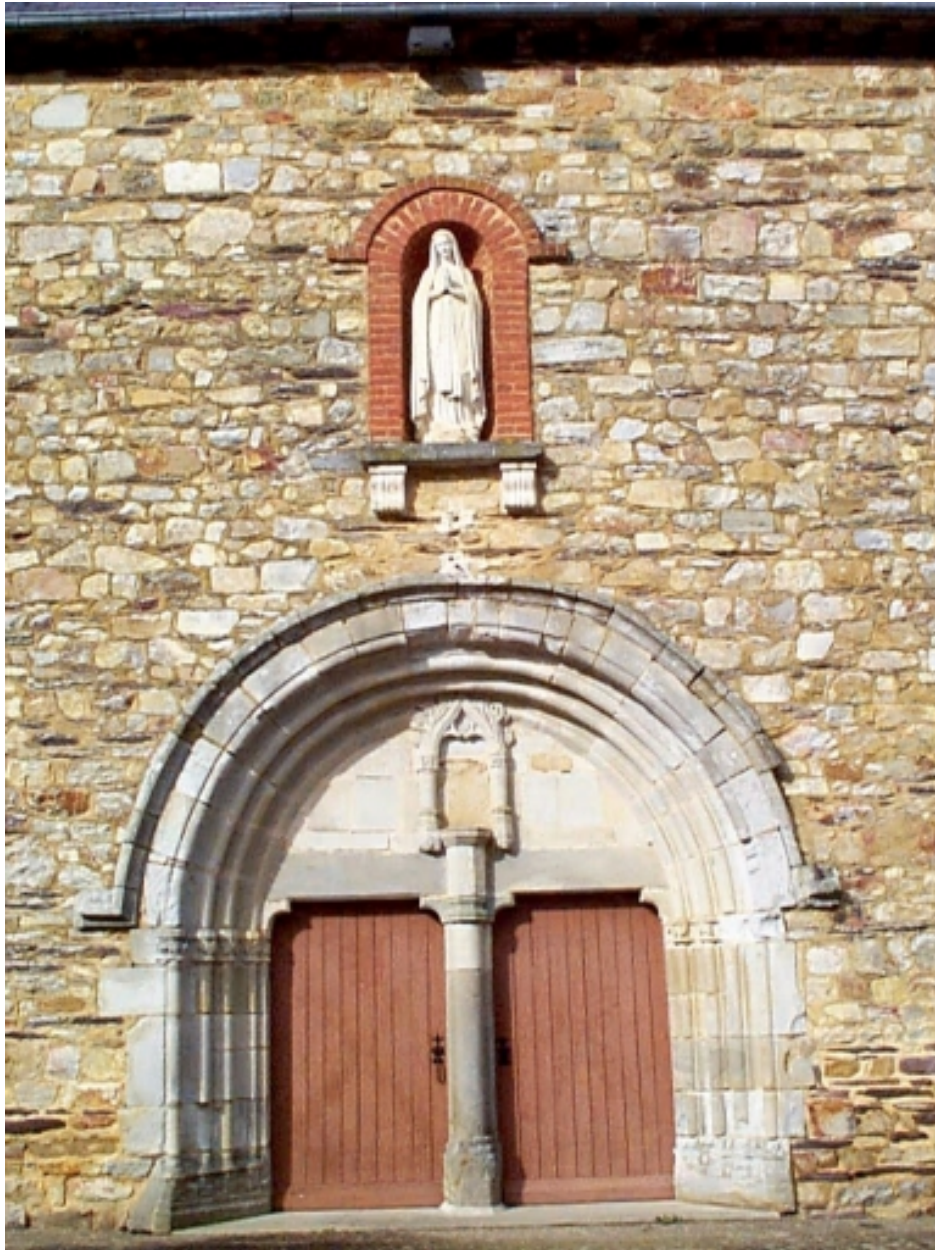
L'ancien porche remployé et la statue de Notre-Dame : vue générale sud