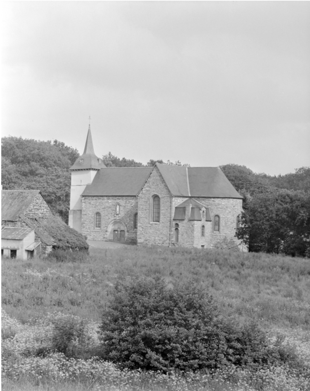
Vue de situation sud-est