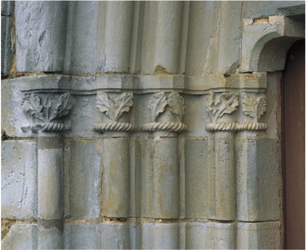
Chapiteaux du vieux porche : détail