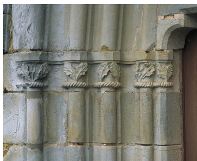
Chapiteaux du vieux porche : détail IVR53_19993501140XA

L'ancien porche remployé et la statue de Notre-Dame : vue générale sud IVR53_19993503327NUCA