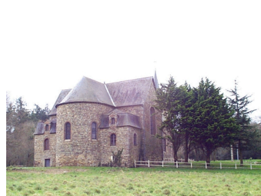
Vue de situation nord-est IVR53_19993503159NUCA