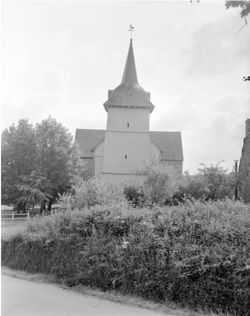
La tour porche : vue générale ouest