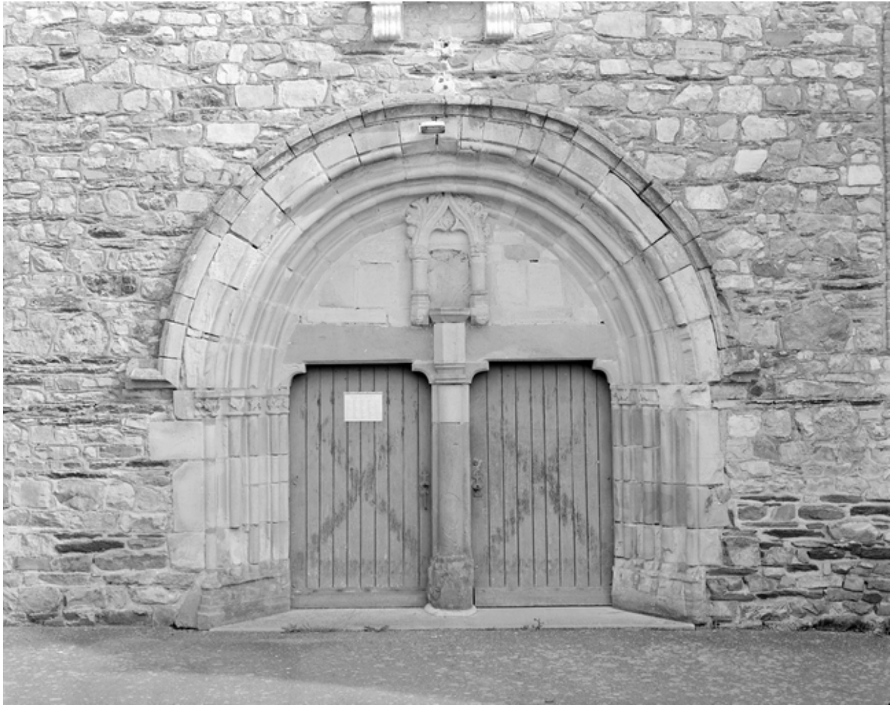
L'ancien porche remployé et la statue de Notre-Dame : vue générale sud