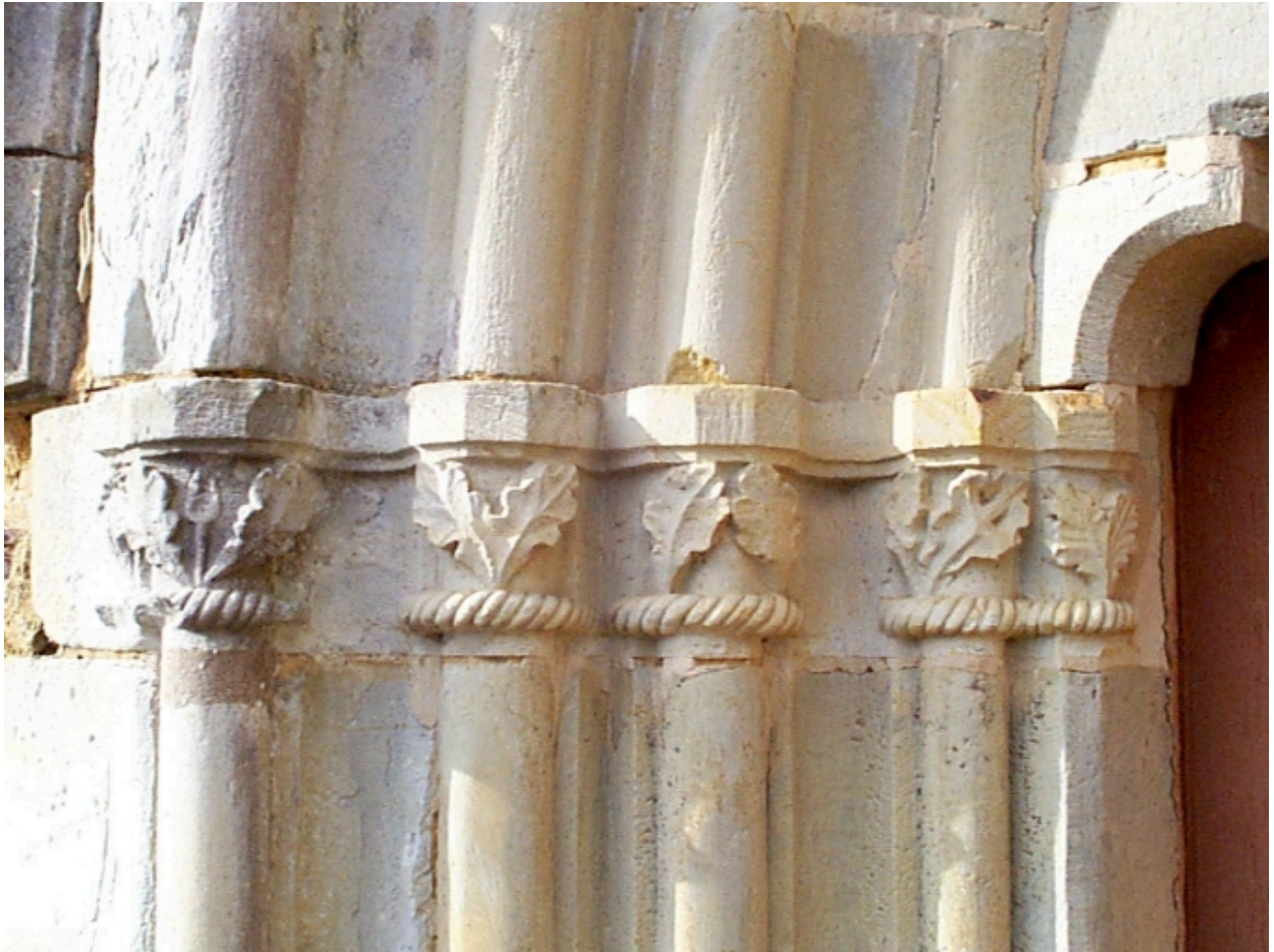
Chapiteaux du vieux porche : détail