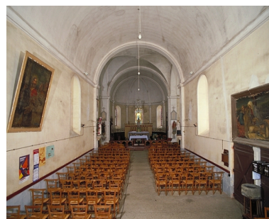
Vue intérieure prise de la nef vers le chœur IVR53_19993501490XA