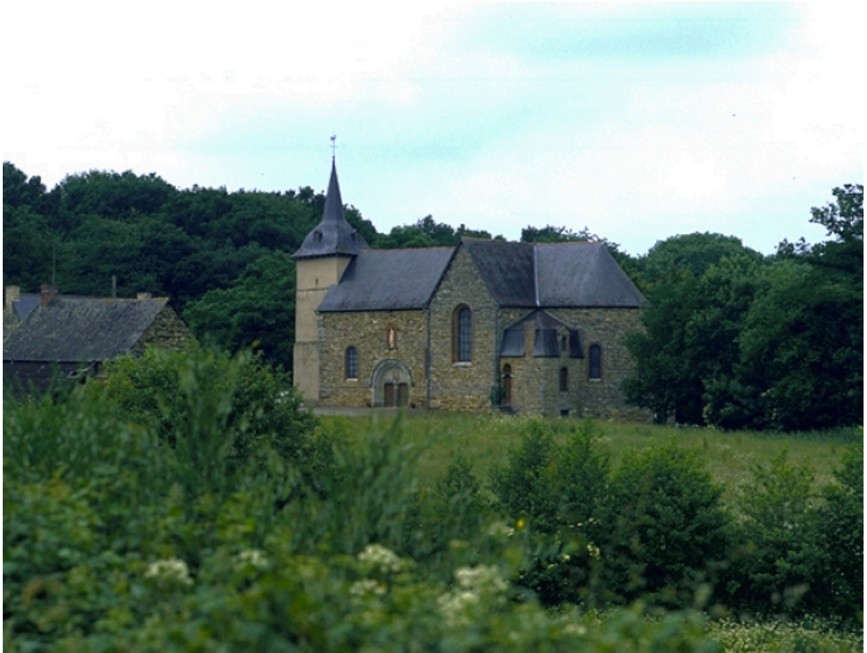
Vue de situation sud-est