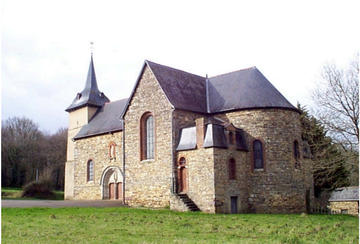
Le chœur et la sacristie : vue générale sud-est