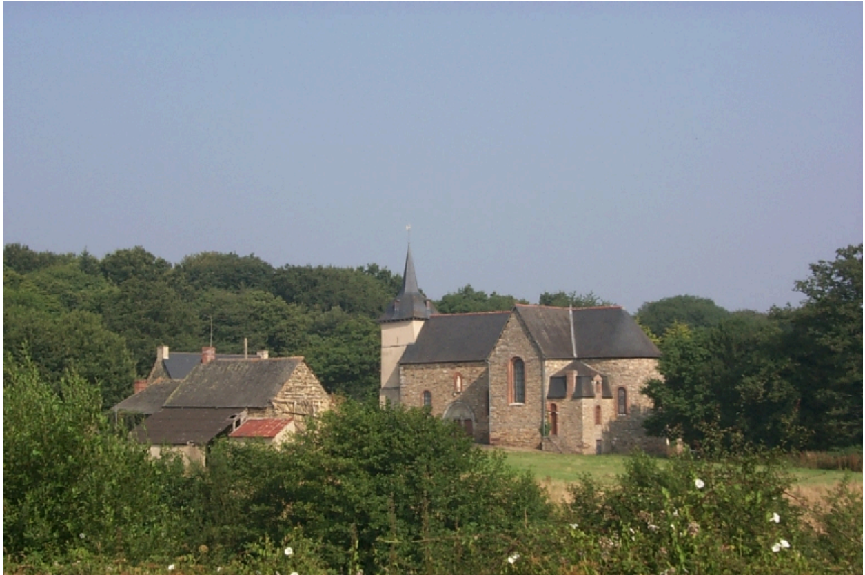
Vue de situation sud-est