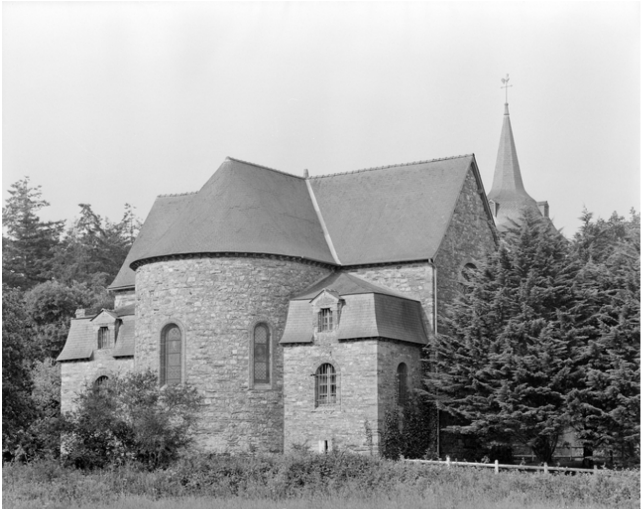
Vue de situation nord-est