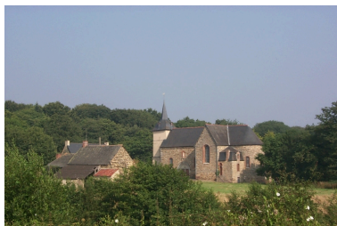
Vue de situation sud-est IVR53_19993503328NUCA