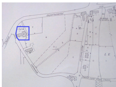
L'église Notre-Dame sur le cadastre rénové