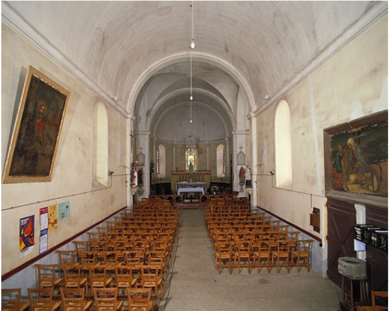
Vue intérieure prise de la nef vers le chœur