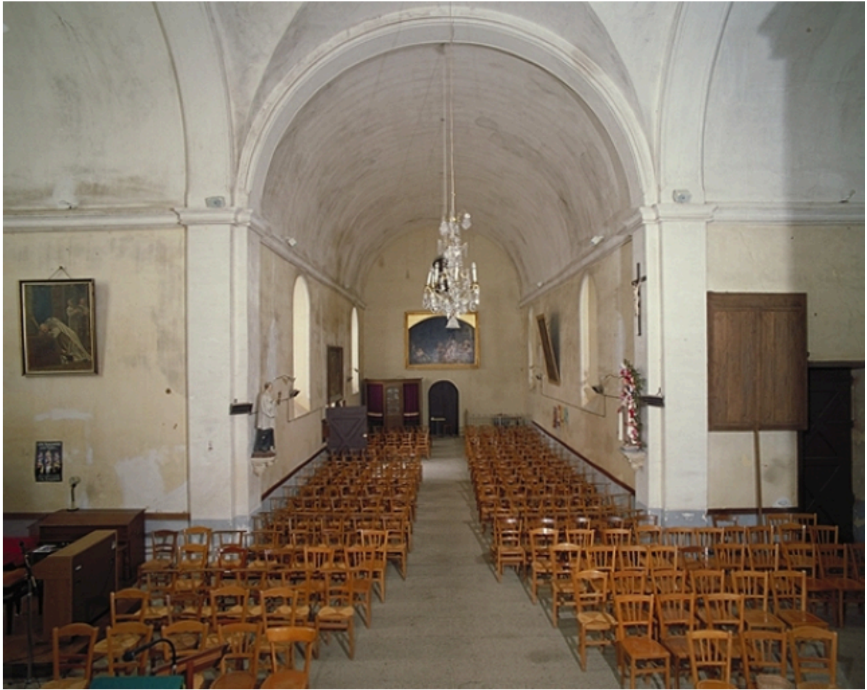
Vue intérieure prise du chœur vers la nef