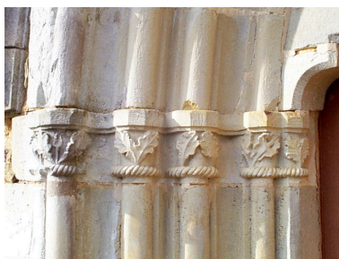
Chapiteaux du vieux porche : détail IVR53_19993503326NUCA