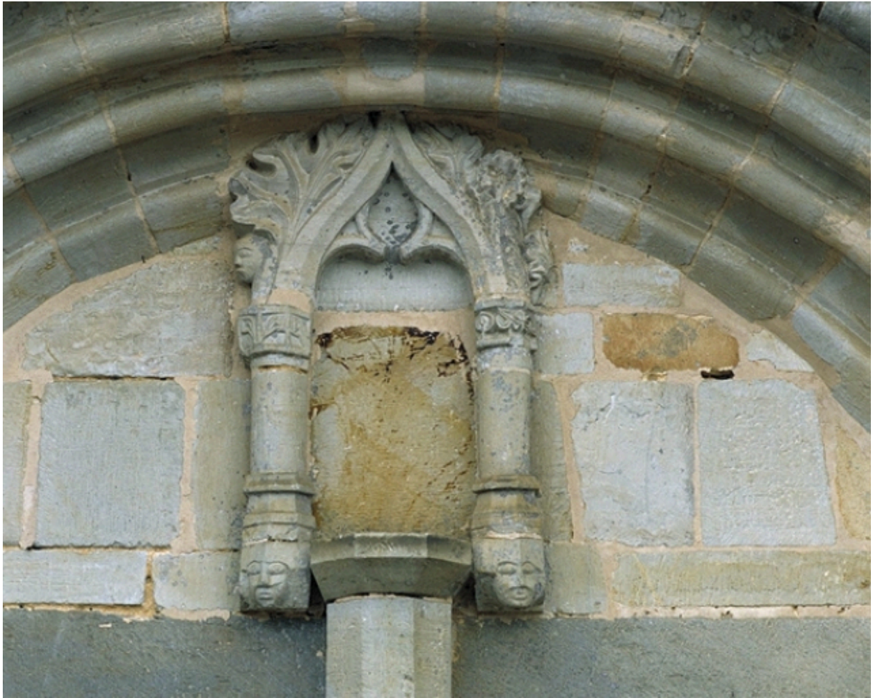
Niche à saint au tympan du vieux porche : vue générale sud