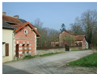
Les pavillons IVR53_20013508859NUCA