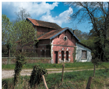
Pavillon sud-est IVR53_20013500924XA