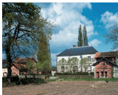
Vue de situation sud IVR53_20013500923XA