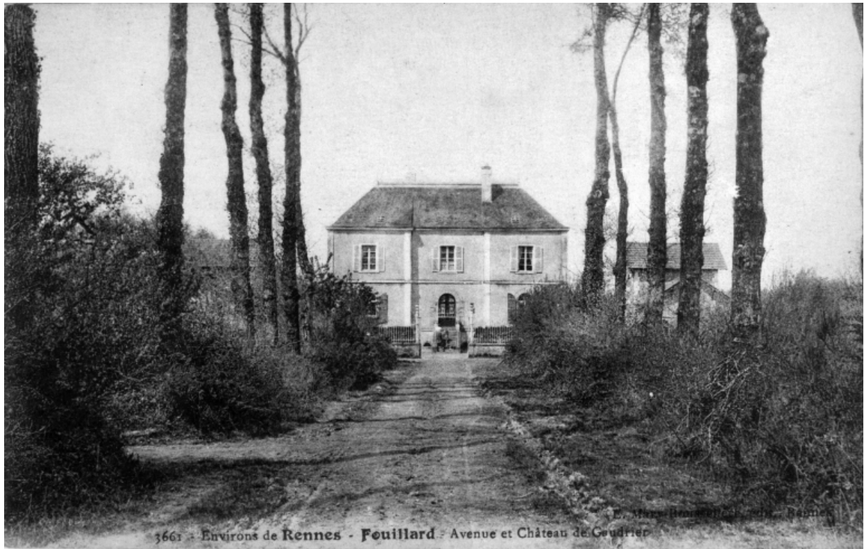
Carte postale ; façade sud