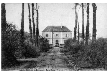
Carte postale ; façade sud IVR53_19883500345X