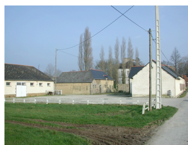
Vue de situation sud-ouest