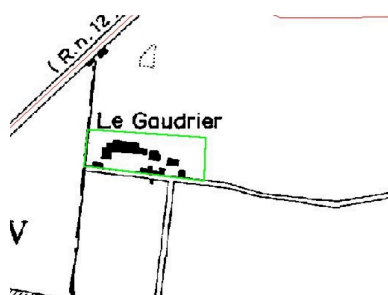
Le grand logis est situé dans l'axe de l'allée perpendiculaire