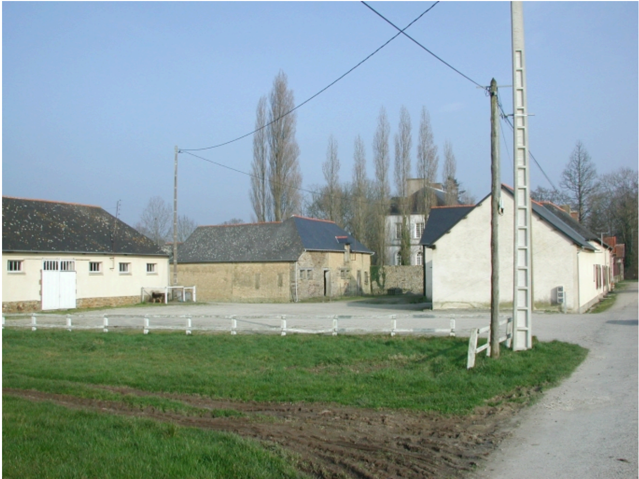
Vue de situation sud-ouest