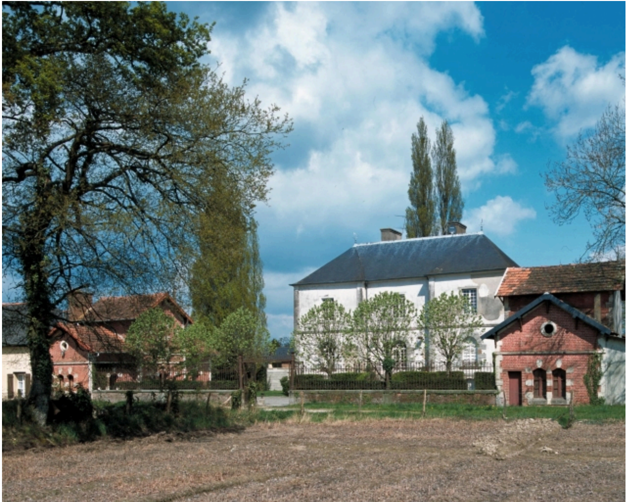
Vue de situation sud