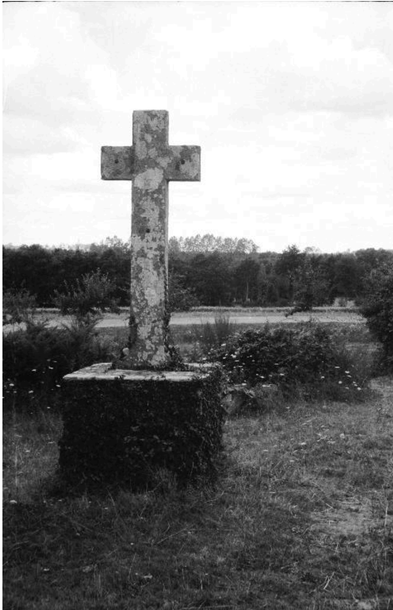
Croix de chemin : face est (état en 1969)