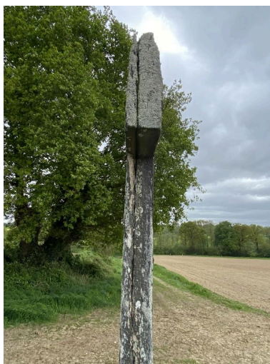
Vue nord IVR53_20255611128NUCA