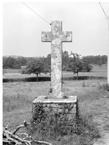
Croix de chemin : face est (état en 1983) IVR53_19835601151X