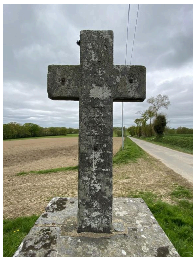
Face est IVR53_20255611127NUCA