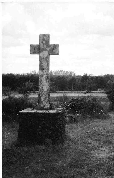
Croix de chemin : face est (état en 1969)