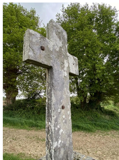
Vue nord-ouest