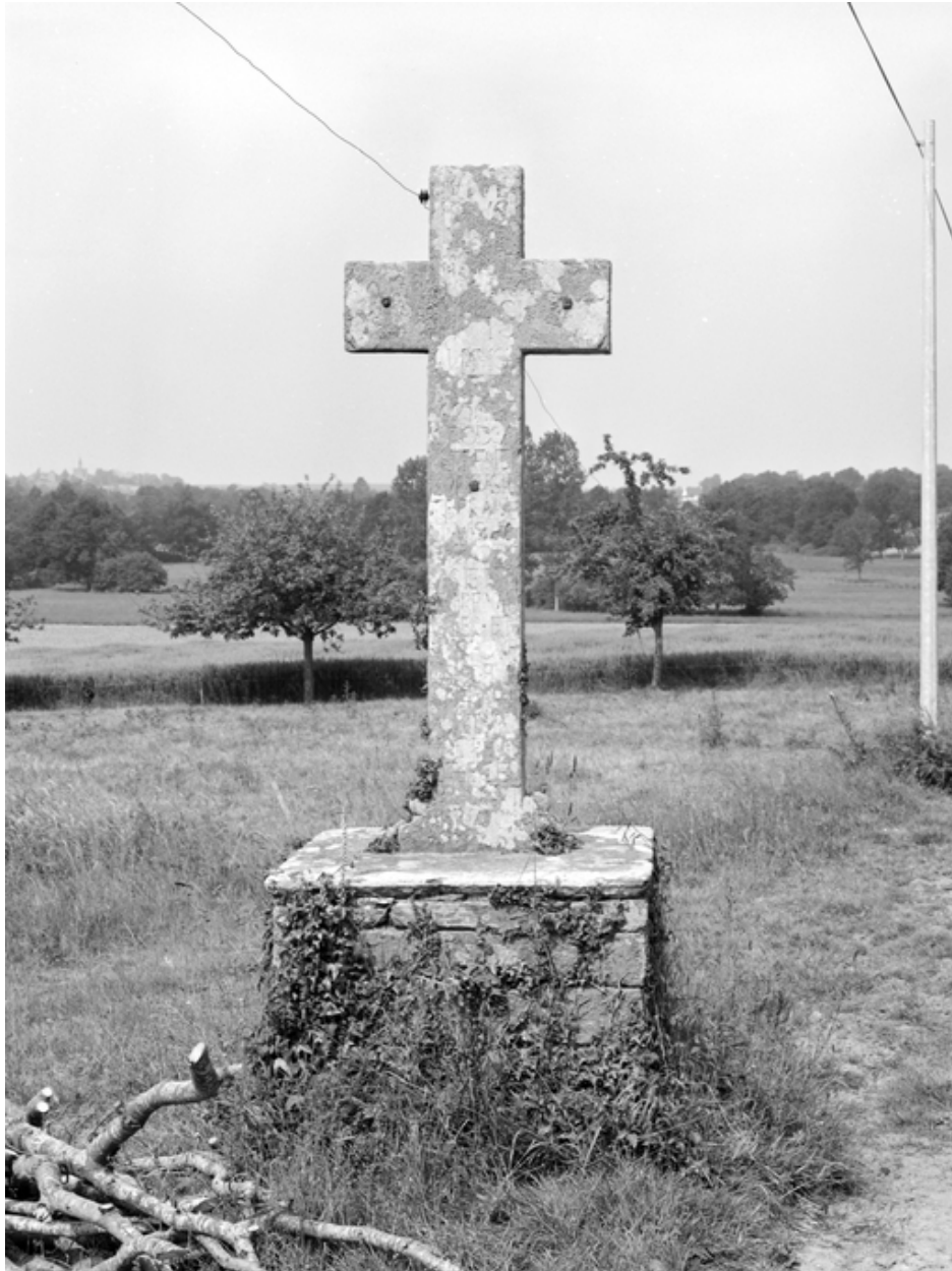
Croix de chemin : face est (état en 1983)