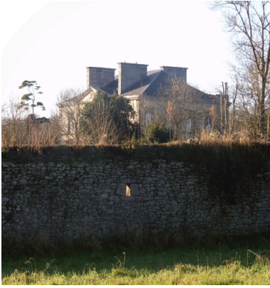
Vue générale (façade postérieure) IVR53_20082206957NUCA