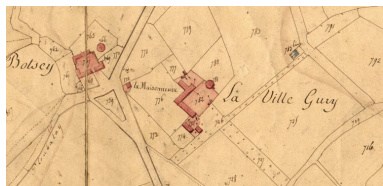
Extrait du cadastre de 1827 (AD 22)