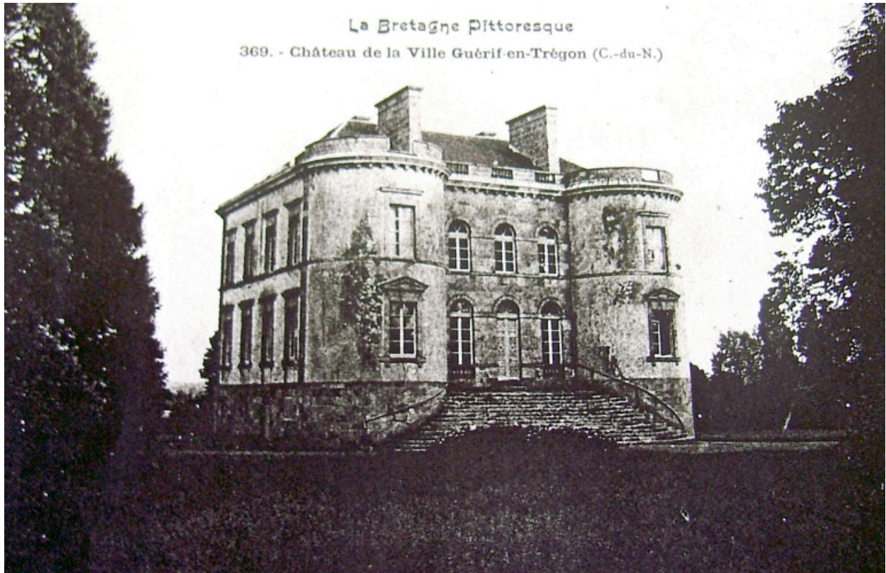
Vue générale, façade antérieure (AD 22)