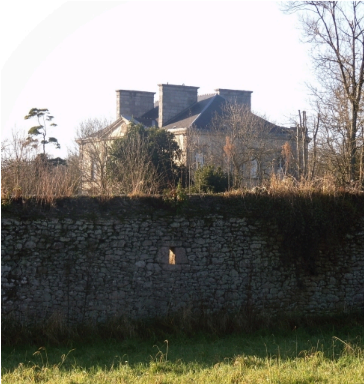
Vue générale (façade postérieure)