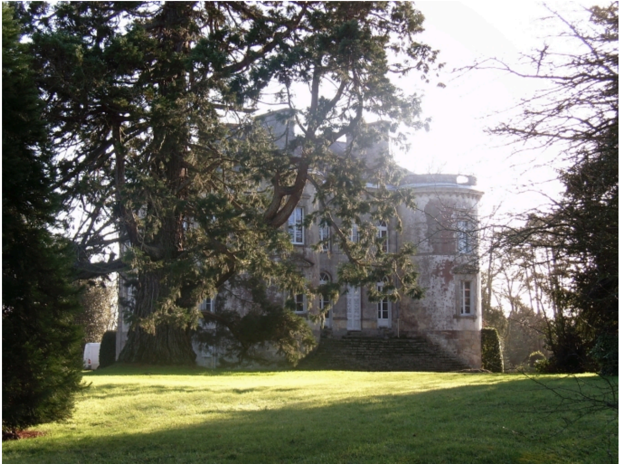
Vue générale (façade antérieure)