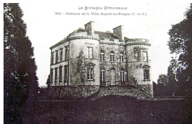
Vue générale, façade antérieure (AD 22) IVR53_20082206980NUCB