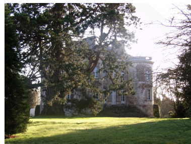
Vue générale (façade antérieure)