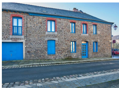
Façade rue du Four datant du début du 19e s. selon la date gravée sur le linteau de la porte (1810).