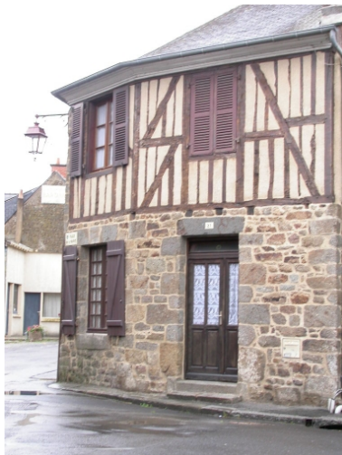
Vue générale ouest IVR53_20053518279NUCA