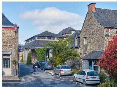
Rue Saint-Louis, depuis la place de la Mairie. IVR53_20243501126NUCA