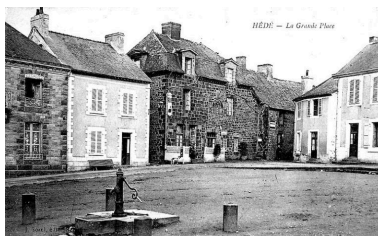
Vue sur l'Hôtel de l'Ecu et une maison en pan de bois recouvert d'un enduit IVR53_20243510225P