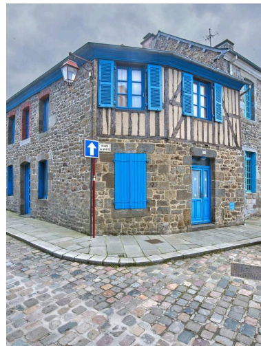
Le pan de bois visible au premier étage était enduit à l'origine.