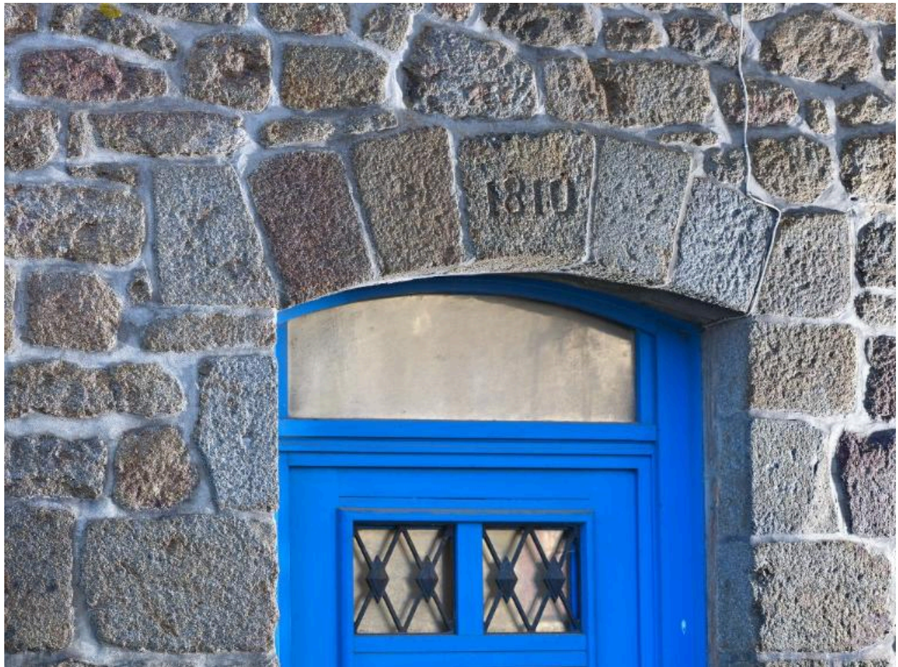
Date de 1810 gravée sur le linteau de la porte d'entrée rue du Four.