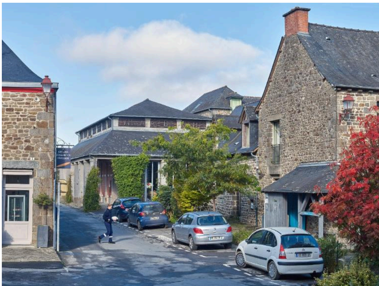
Rue Saint-Louis, depuis la place de la Mairie.