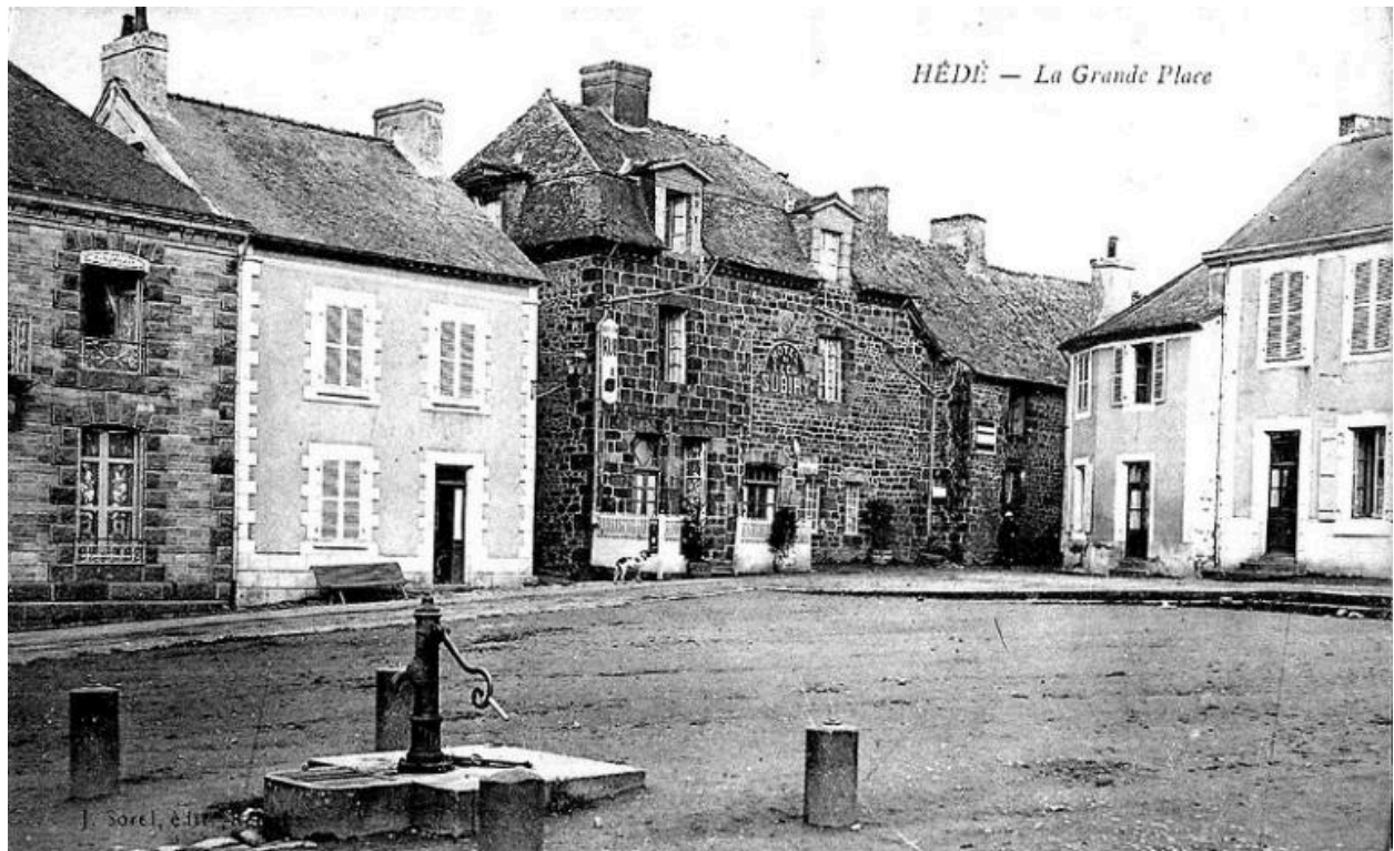
Vue sur l'Hôtel de l'Ecu et une maison en pan de bois recouvert d'un enduit