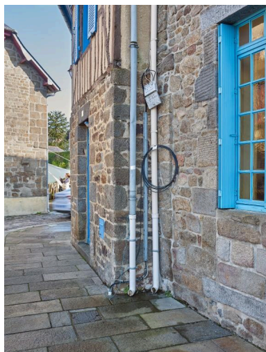
Rupture d'alignement de l'ancienne maison à porche par rapport à sa voisine. IVR53_20243501125NUCA