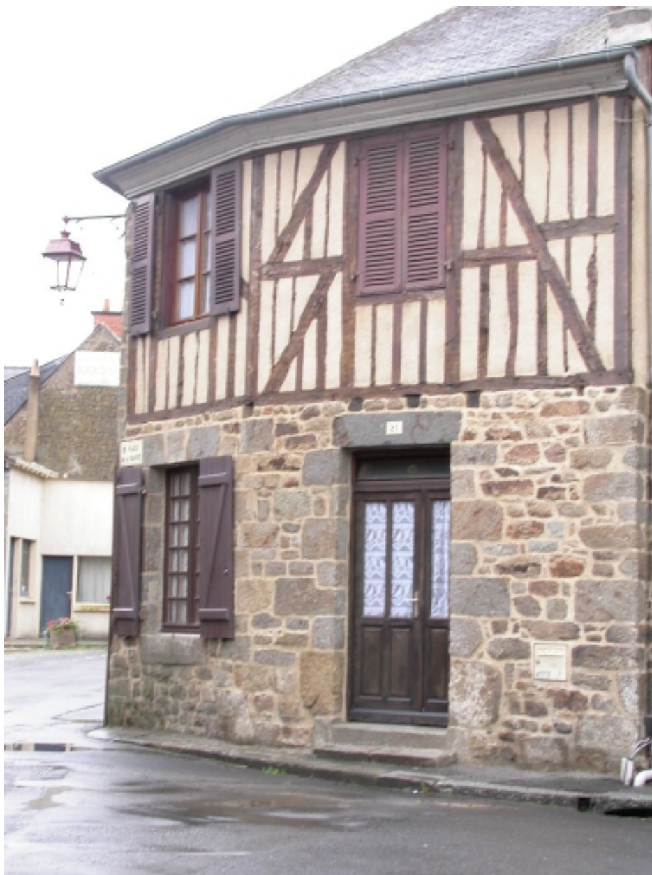
Vue générale ouest