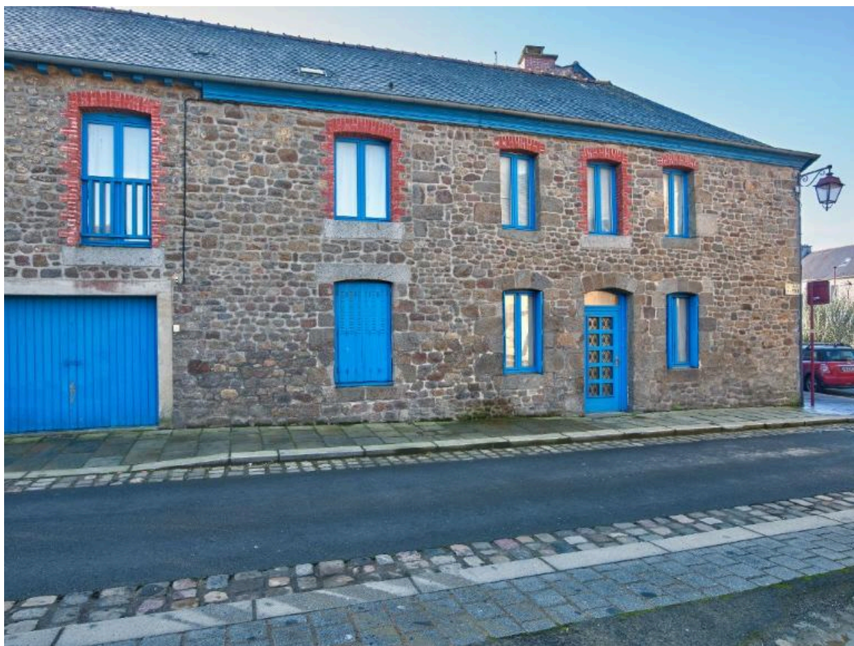
Façade rue du Four datant du début du 19e s. selon la date gravée sur le linteau de la porte (1810).