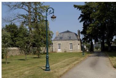
Pavillon d'entrée, vue générale sud