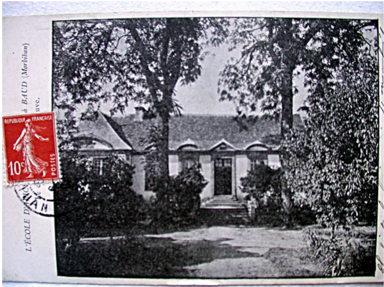
Carte postale ancienne, vers 1910