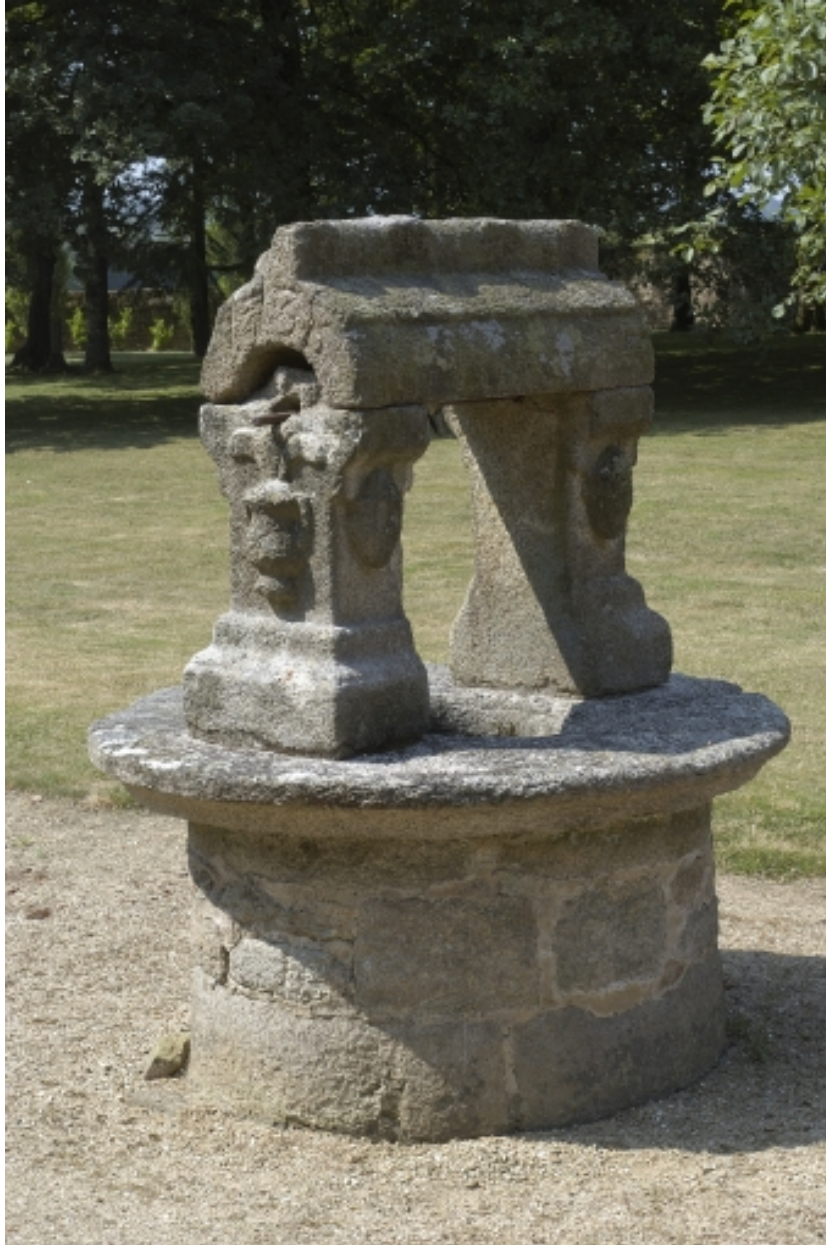
Puits sud, vue générale