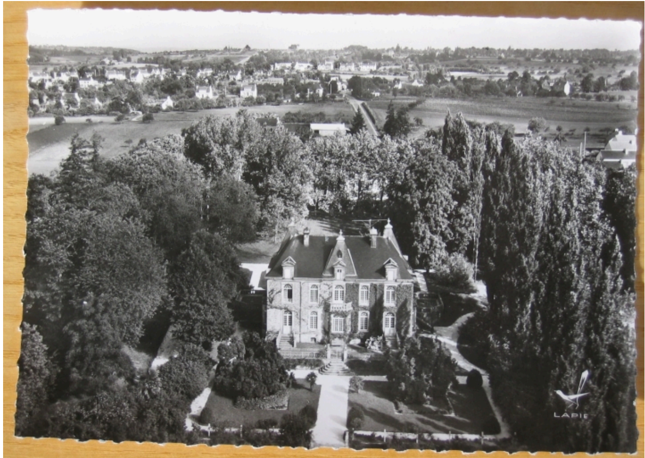
Vue aérienne, prise du sud vers 1950