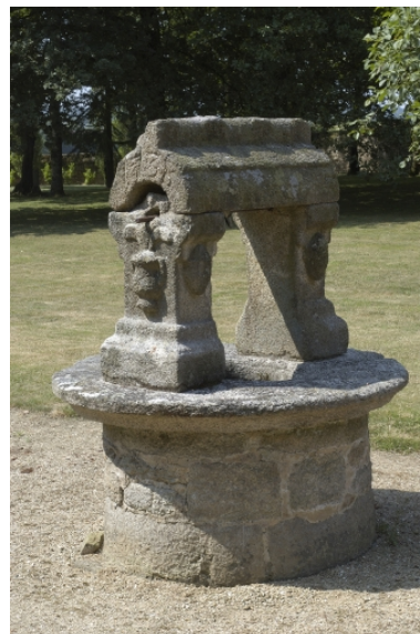
Puits sud, vue générale IVR53_20065600495NUCA