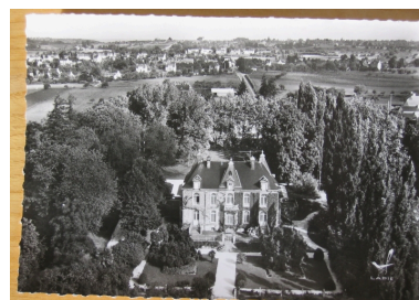
Vue aérienne, prise du sud vers 1950