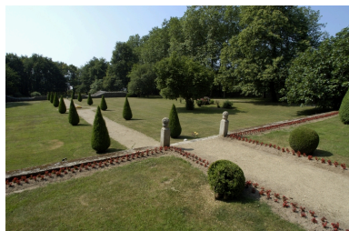
Vue générale du jardin et des terrasses situés au sud IVR53_20065600493NUCA