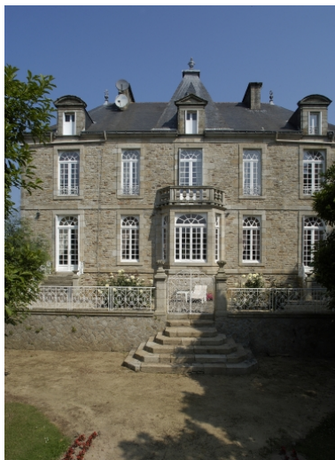
Façade sud IVR53_20065600492NUCA