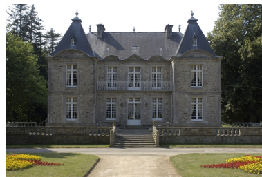
Vue générale nord IVR53_20065600490NUCA