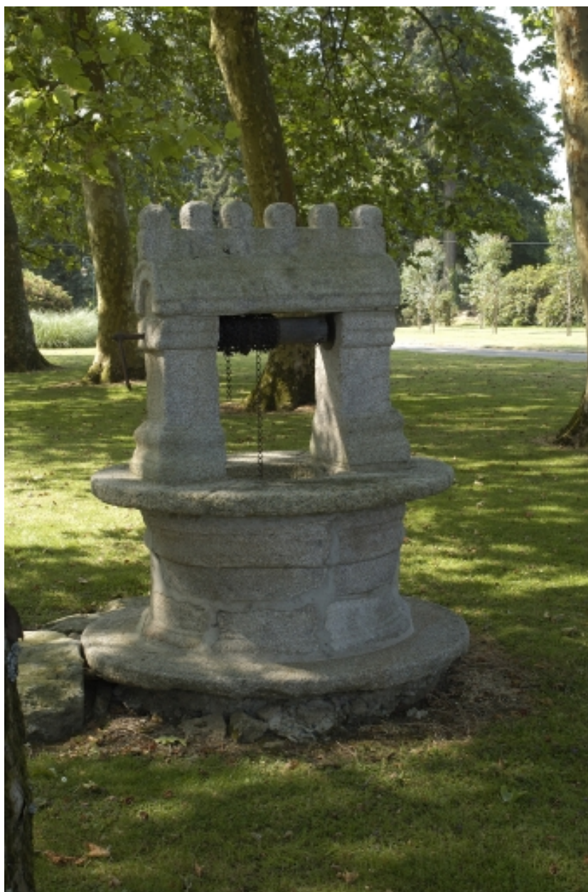
Puits nord, vue générale