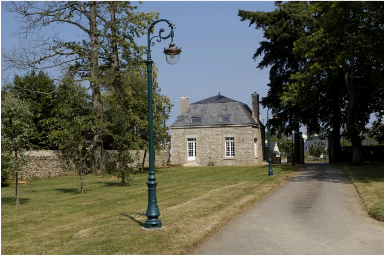
Pavillon d'entrée, vue générale sud