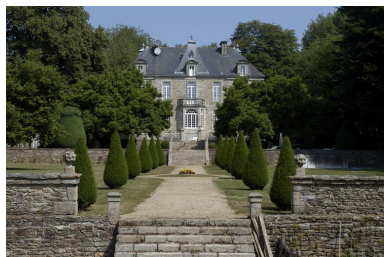
Vue générale sud depuis le jardin IVR53_20065600494NUCA