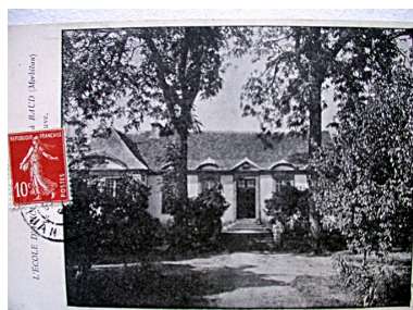
Carte postale ancienne, vers 1910 IVR53_20055604042NUCA