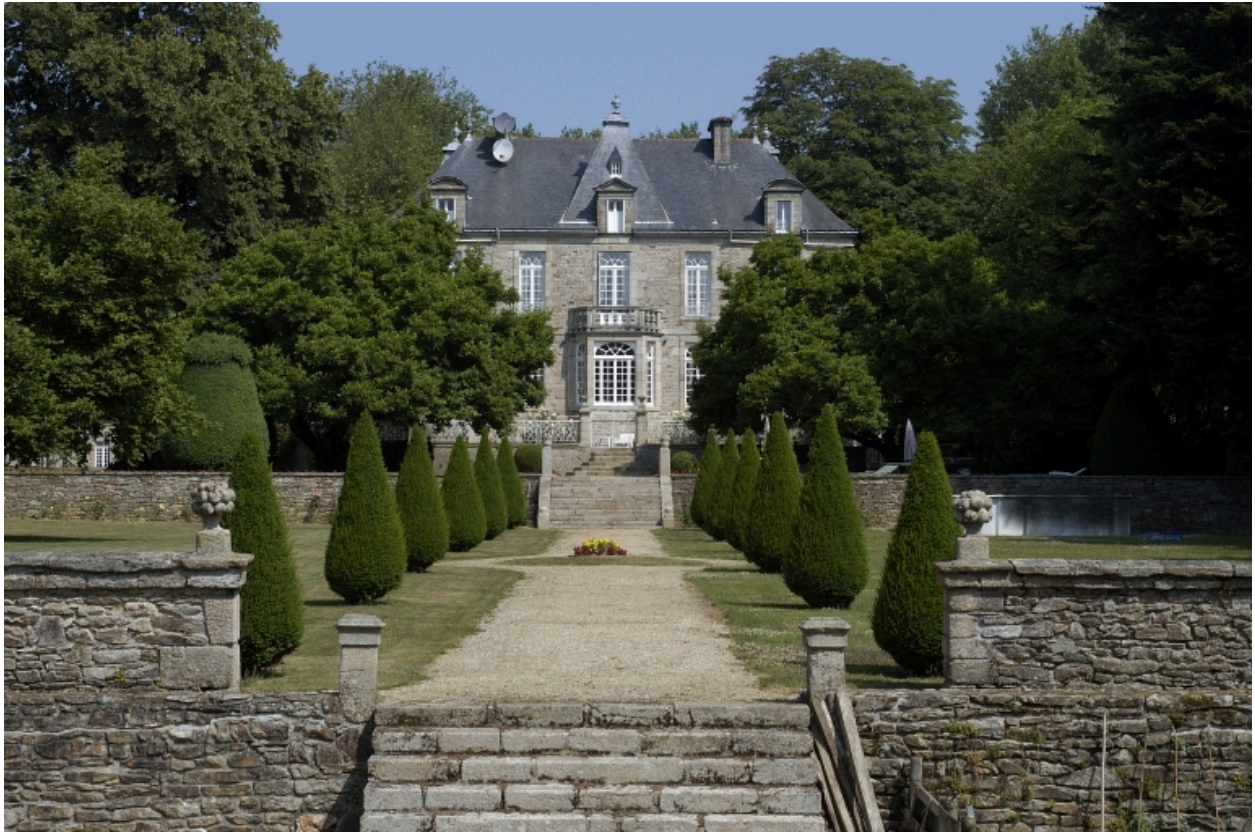
Vue générale sud depuis le jardin