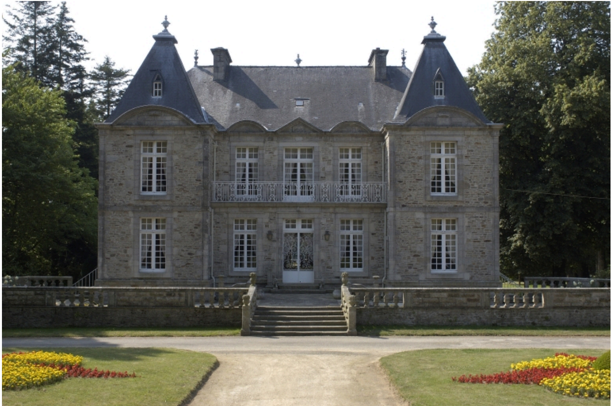
Vue générale nord