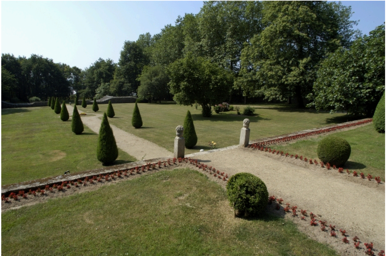
Vue générale du jardin et des terrasses situés au sud