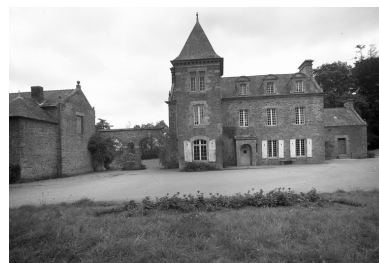
Vue générale sud IVR53_19775601169V