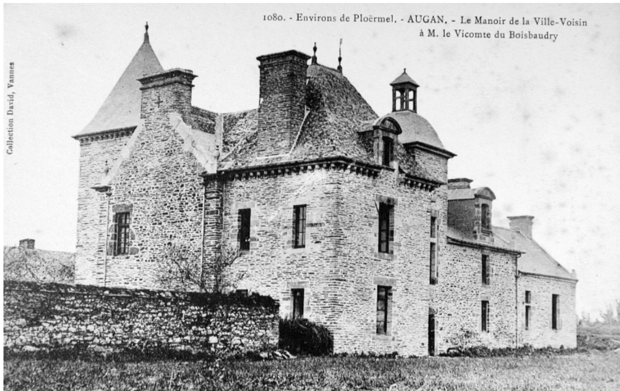
Elévation postérieure, vue de trois-quart