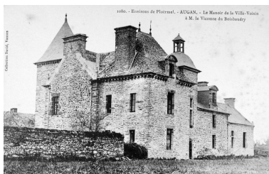
Elévation postérieure, vue de trois-quart IVR53_20045606240NUCB