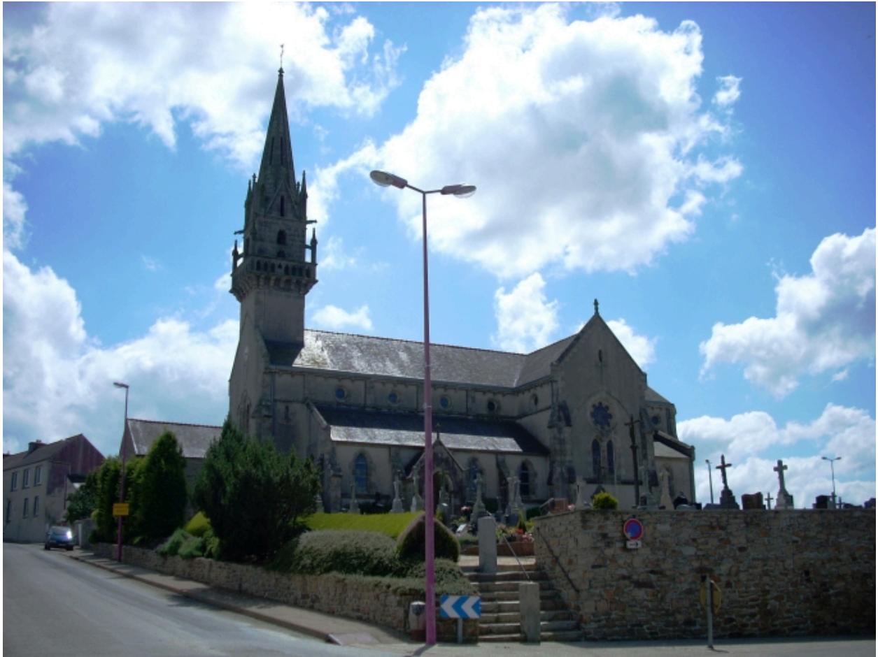
Saint-Thonan, église Saint-Nicolas : vue générale sud-ouest