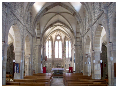
Saint-Thonan, église Saint-Nicolas : vue axiale est