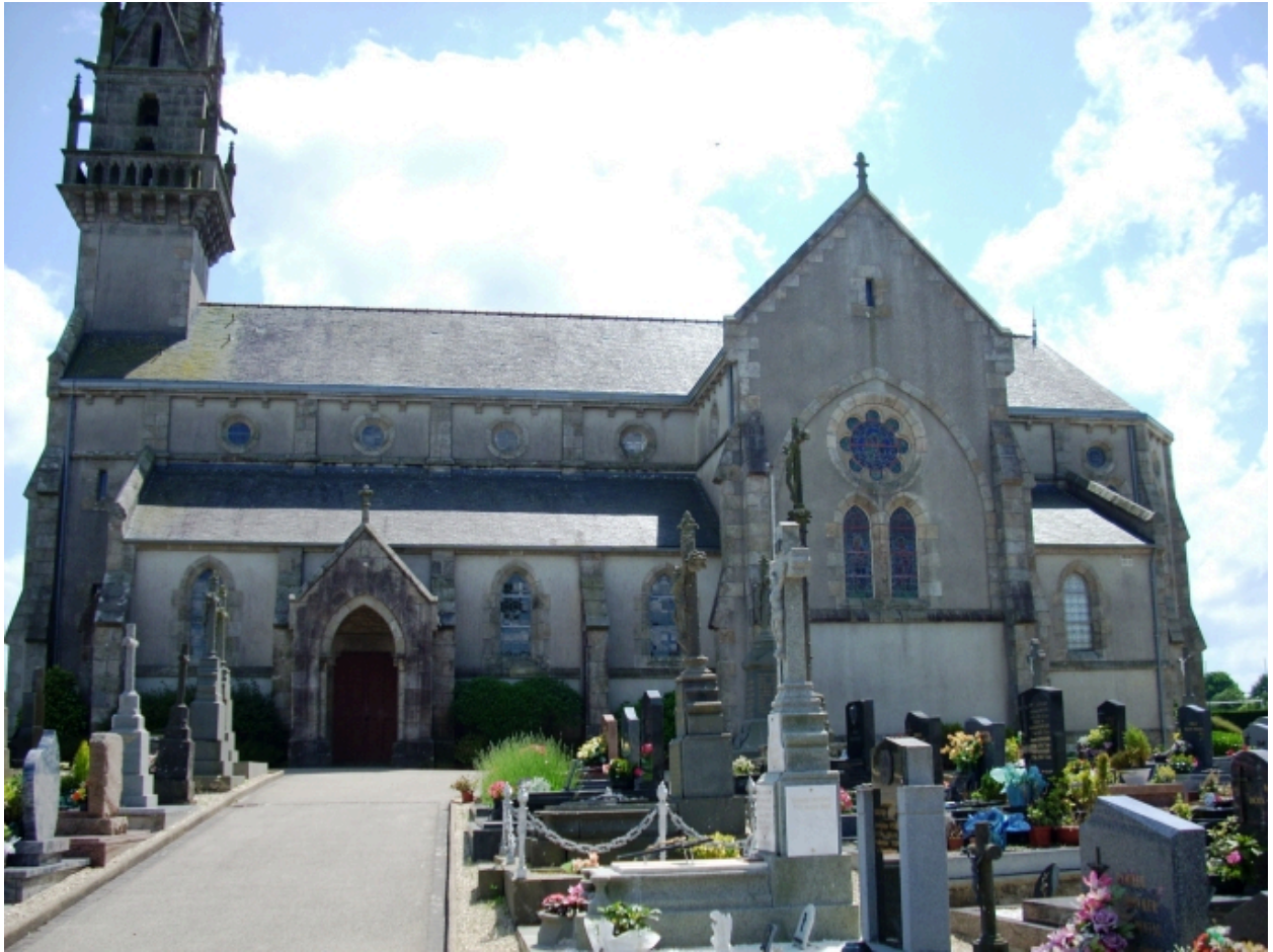
Saint-Thonan, église Saint-Nicolas : élévation sud