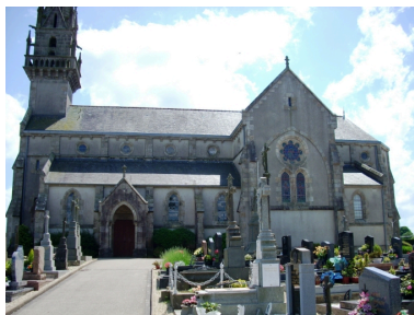
Saint-Thonan, église Saint-Nicolas : élévation sud IVR53_20082905981NUCA