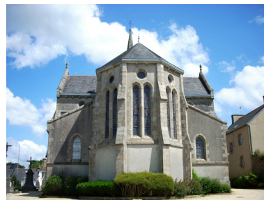
Saint-Thonan, église Saint-Nicolas : élévation est IVR53_20082905982NUCA