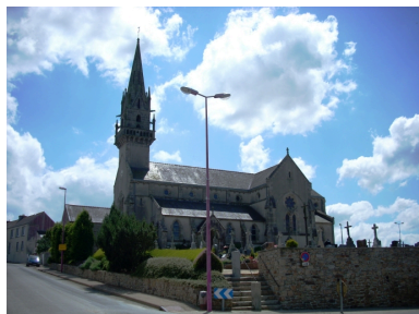
Saint-Thonan, église Saint-Nicolas : vue générale sud-ouest IVR53_20082905980NUCA