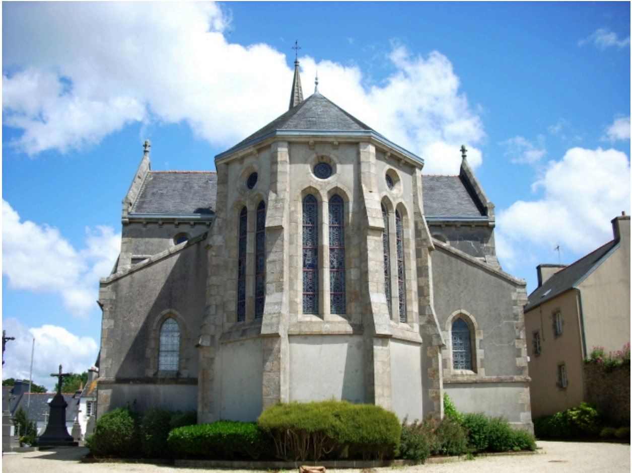
Saint-Thonan, église Saint-Nicolas : élévation est