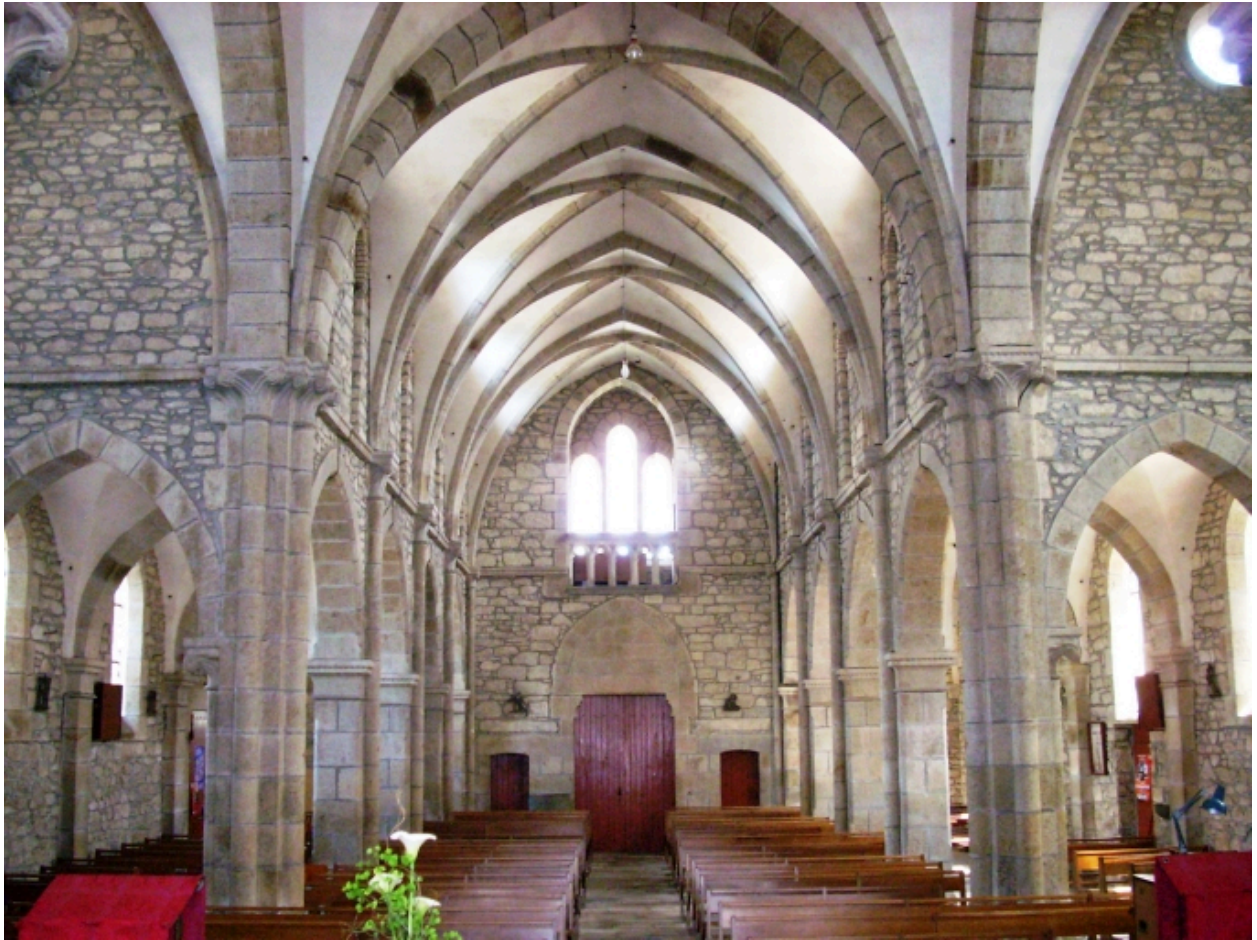
Saint-Thonan, église Saint-Nicolas : vue axiale ouest