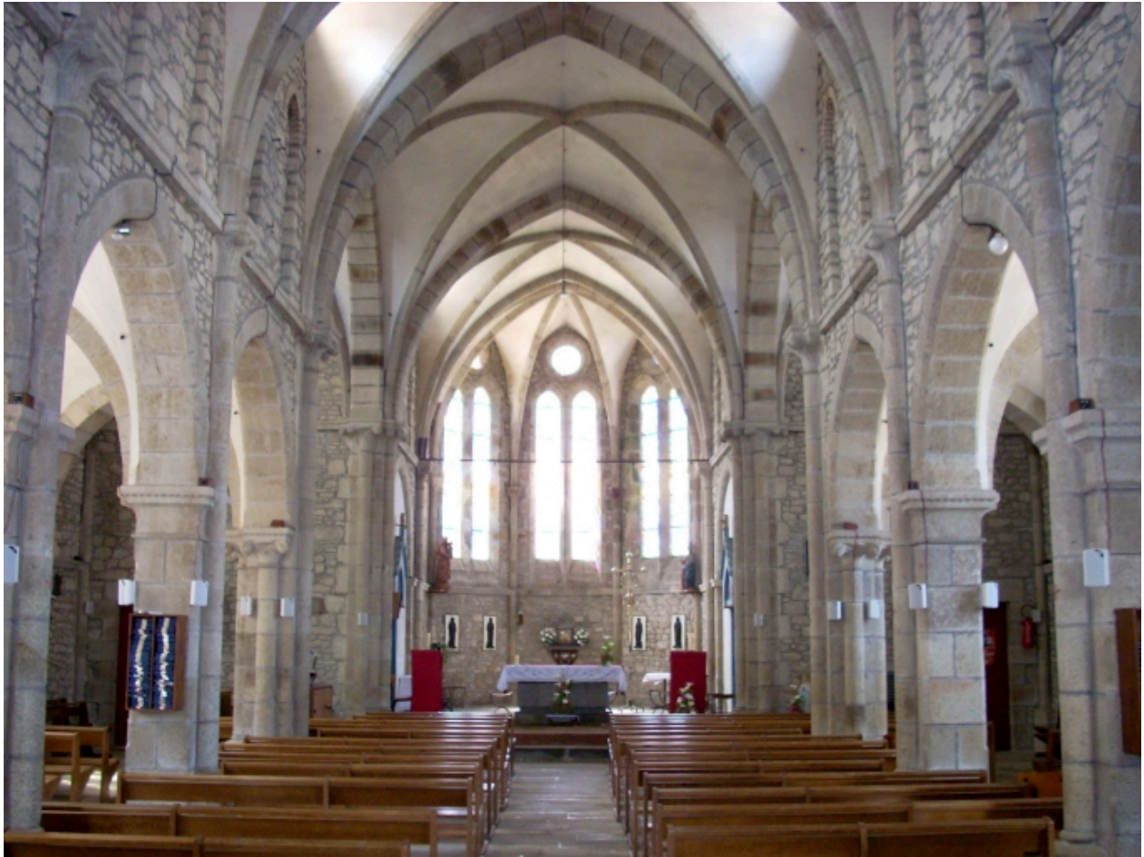
Saint-Thonan, église Saint-Nicolas : vue axiale est