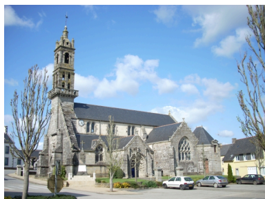
Edern, église paroissiale Saint-Edern : vue générale sud-ouest IVR53_20082905504NUCA