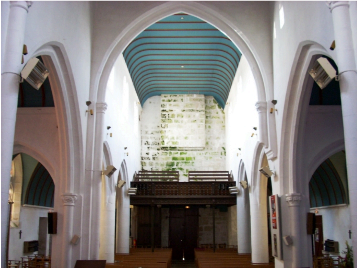
Edern, église paroissiale Saint-Edern : vue axiale ouest