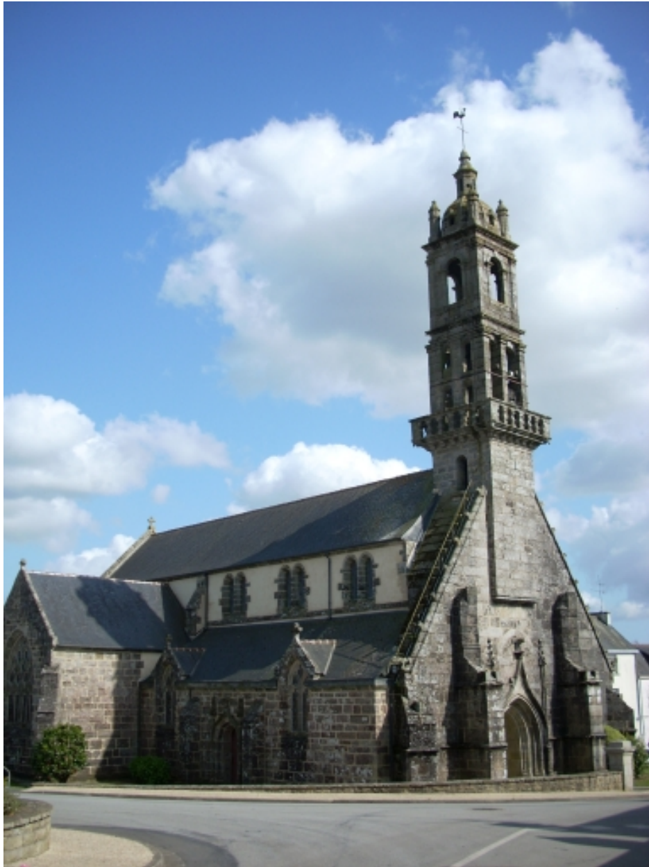
Edern, église paroissiale Saint-Edern : vue générale nord-ouest