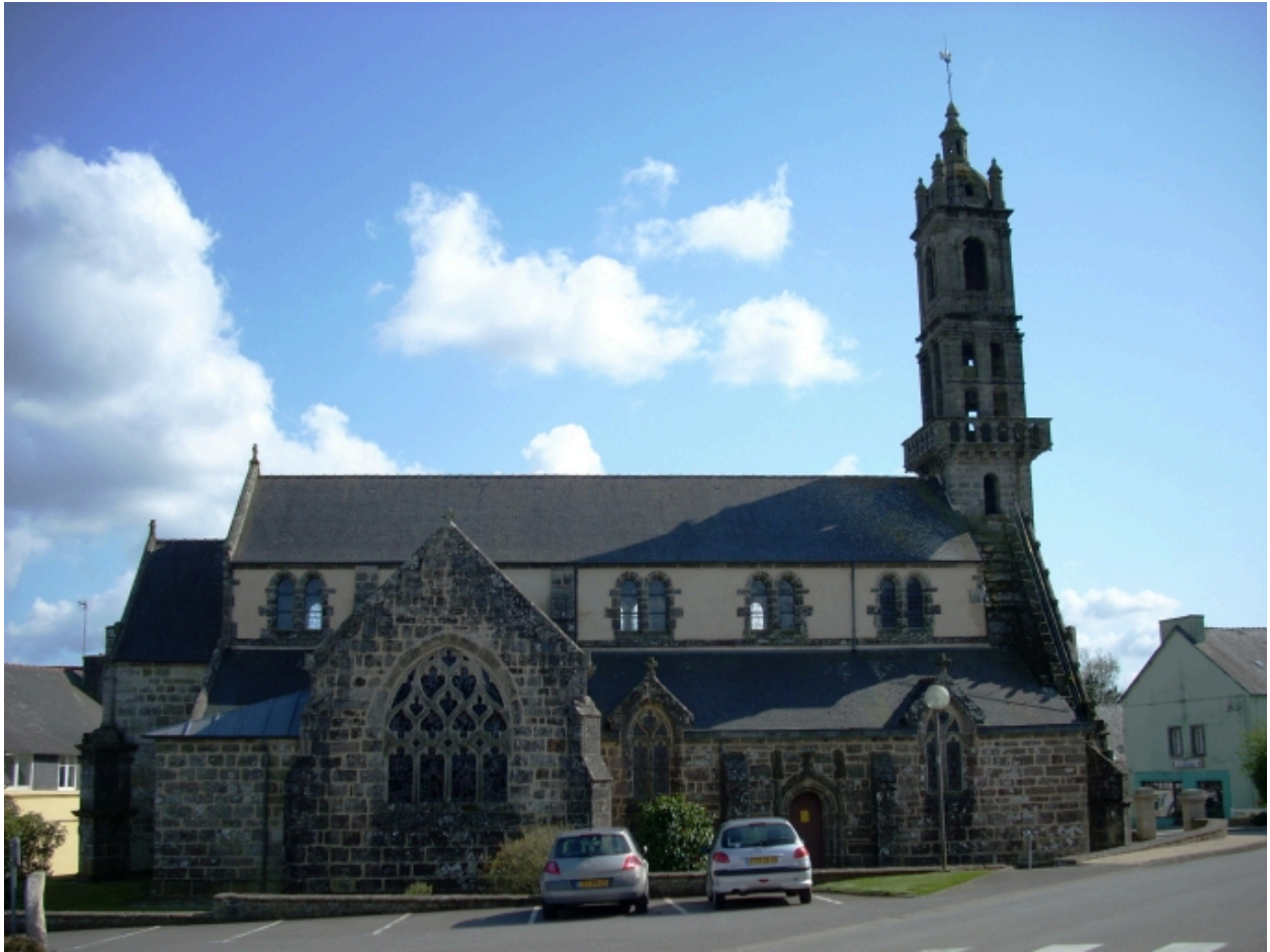
Edern, église paroissiale Saint-Edern : élévation nord