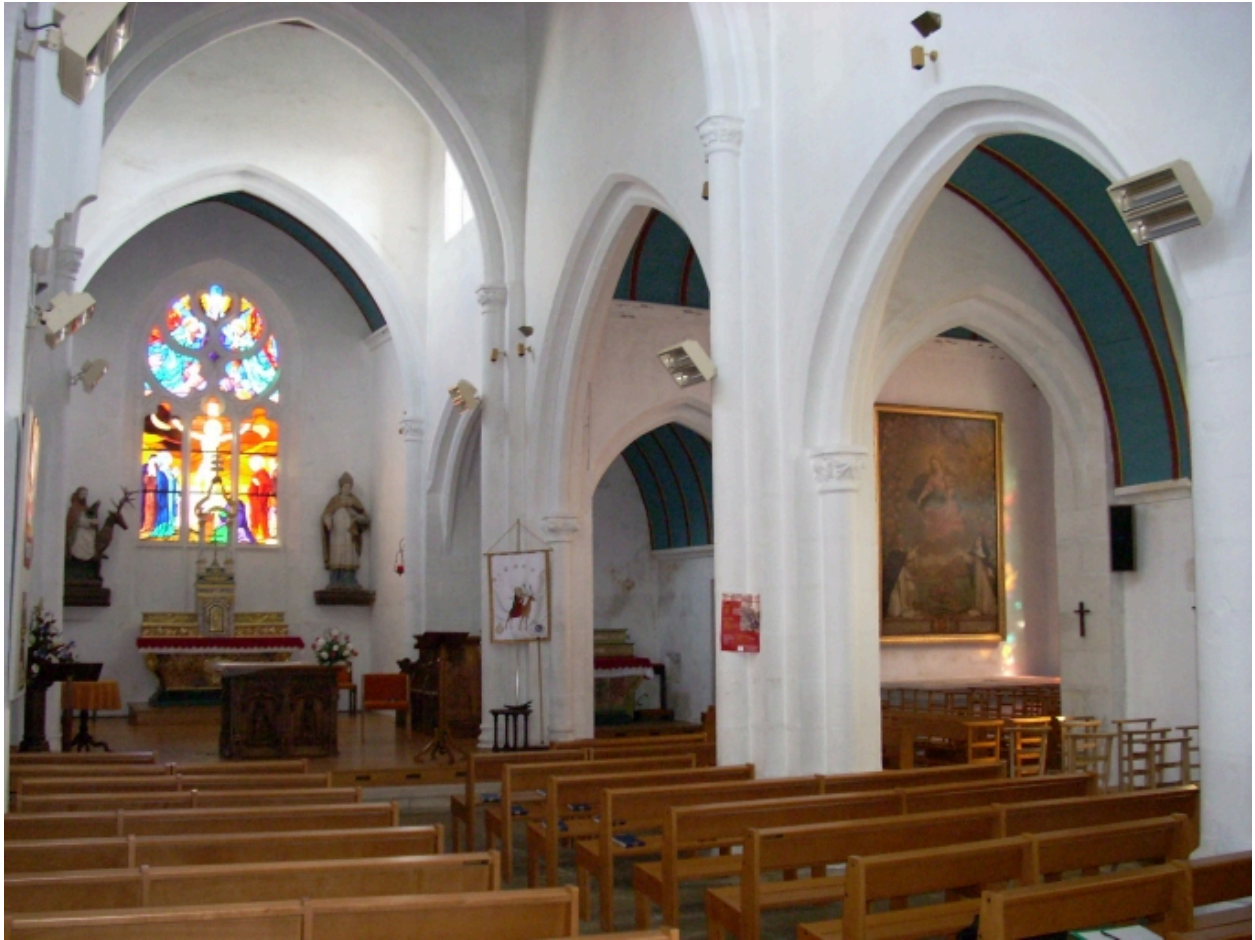
Edern, église paroissiale Saint-Edern : vue transversale sud-est