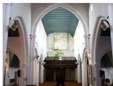
Edern, église paroissiale Saint-Edern : vue axiale ouest IVR53_20082905512NUCA