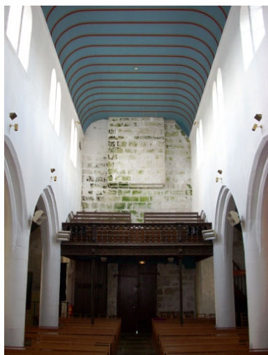
Edern, église paroissiale Saint-Edern : vue axiale ouest IVR53_20082905513NUCA