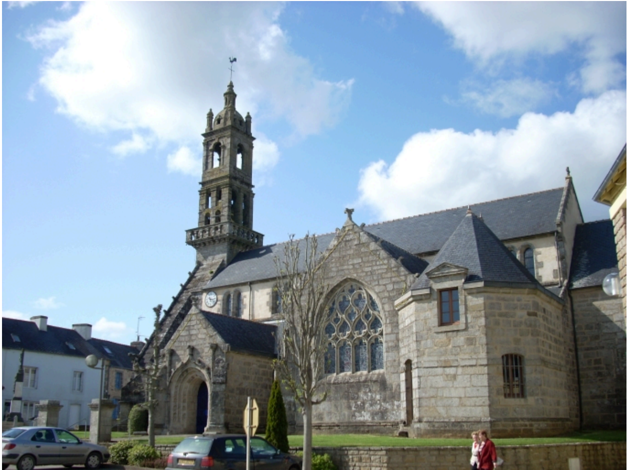
Edern, église paroissiale Saint-Edern : vue générale sud-est