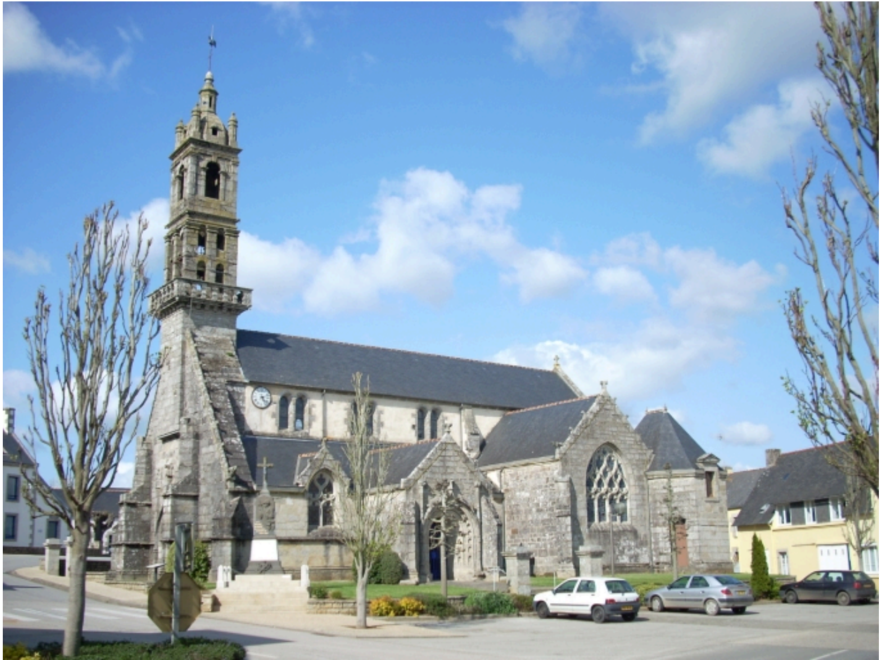
Edern, église paroissiale Saint-Edern : vue générale sud-ouest