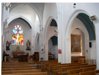
Edern, église paroissiale Saint- Edern : vue transversale sud-est IVR53_20082905511NUCA