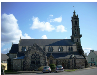
Edern, église paroissiale Saint-Edern : élévation nord IVR53_20082905508NUCA