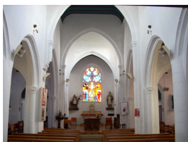
Edern, église paroissiale Saint-Edern : vue axiale est IVR53_20082905510NUCA