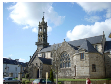
Edern, église paroissiale Saint-Edern : vue générale sud-est