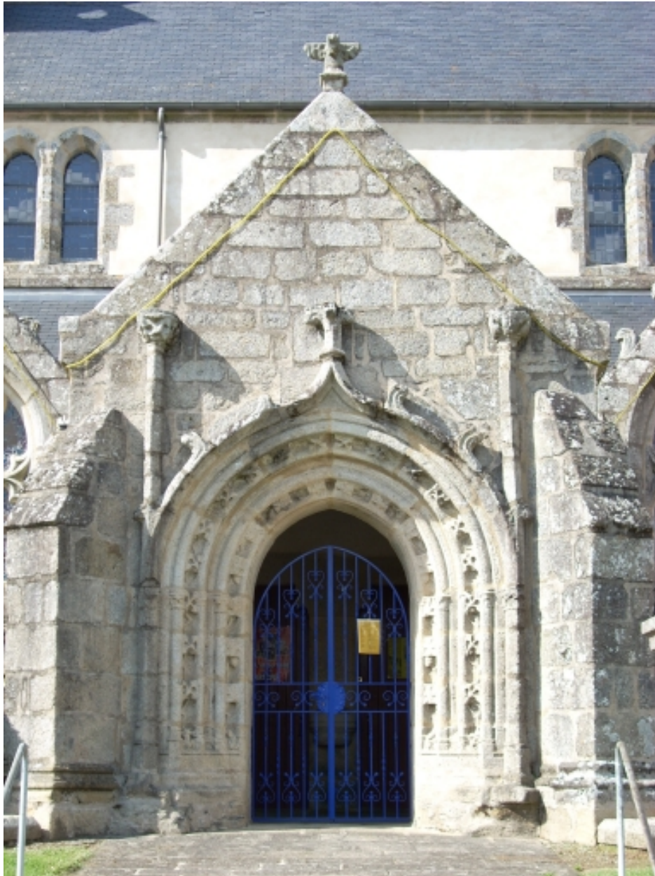
Edern, église paroissiale Saint-Edern : détail porche sud