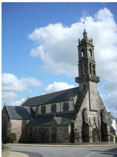
Edern, église paroissiale Saint-Edern : vue générale nord-ouest IVR53_20082905505NUCA