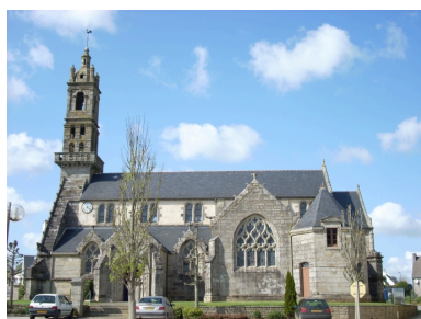
Edern, église paroissiale Saint-Edern : élévation sud IVR53_20082905507NUCA