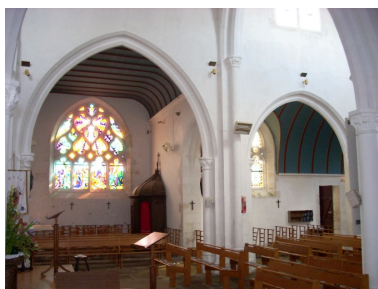
Edern, église paroissiale Saint- Edern : détail chapelle latérale sud IVR53_20082905514NUCA