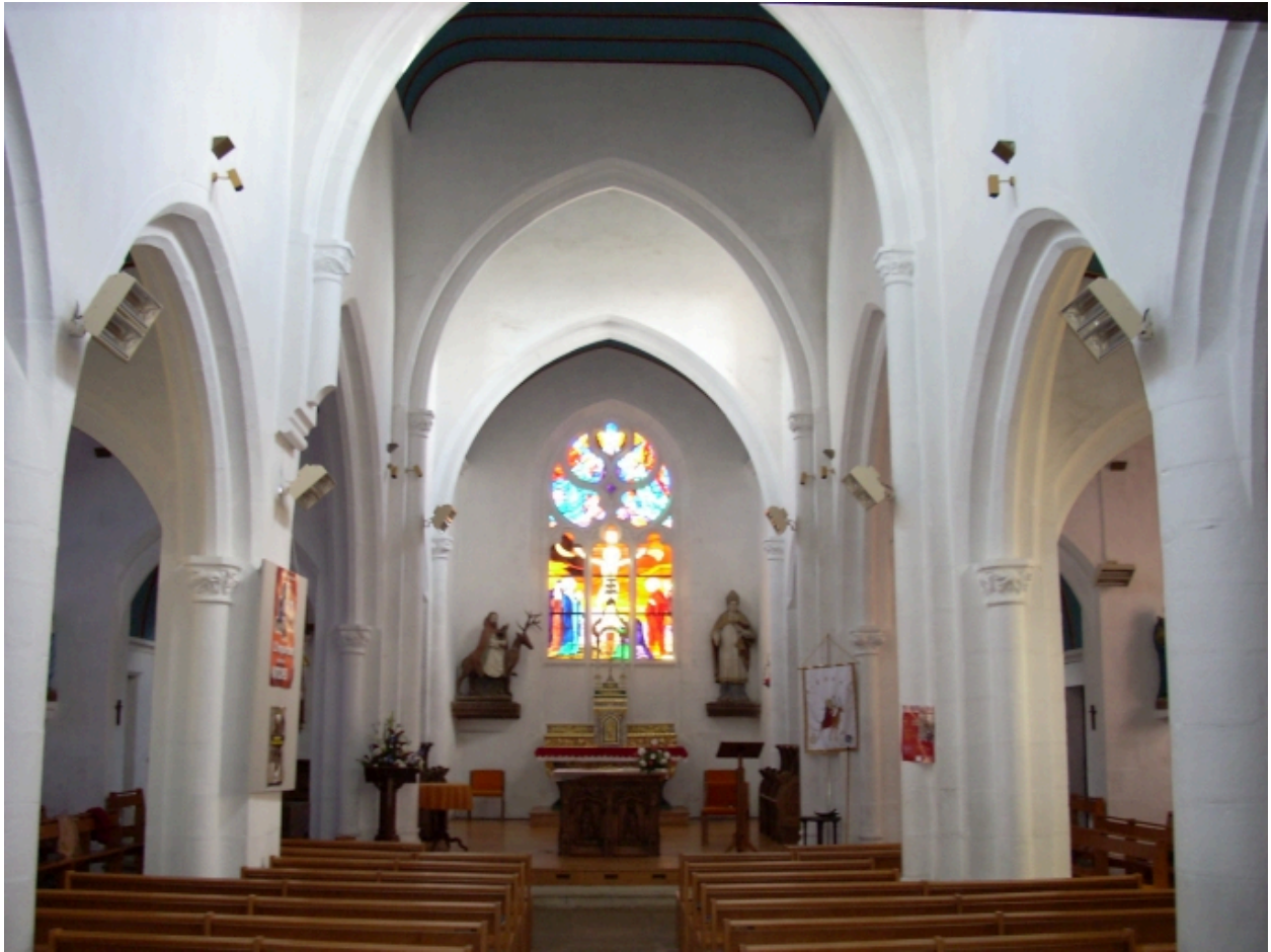
Edern, église paroissiale Saint-Edern : vue axiale est