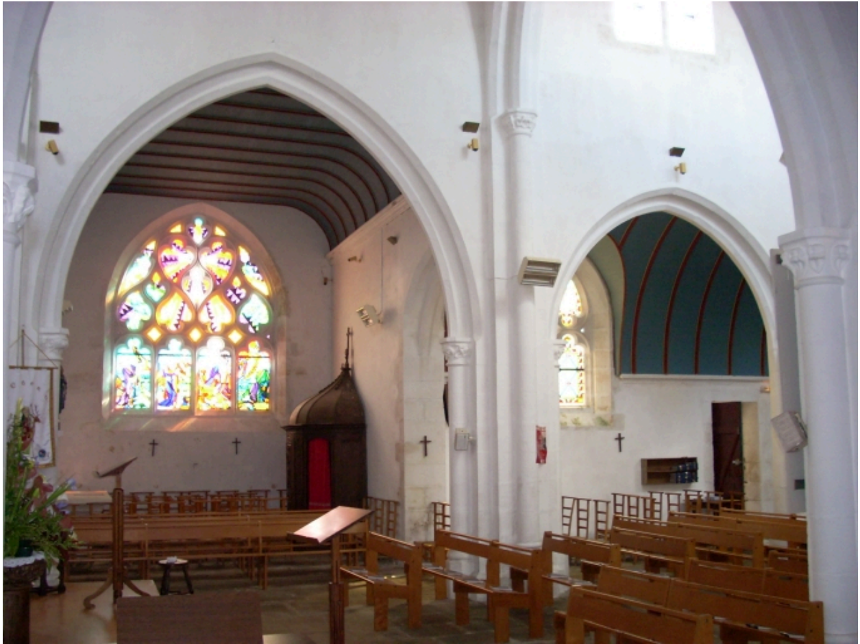
Edern, église paroissiale Saint-Edern : détail chapelle latérale sud