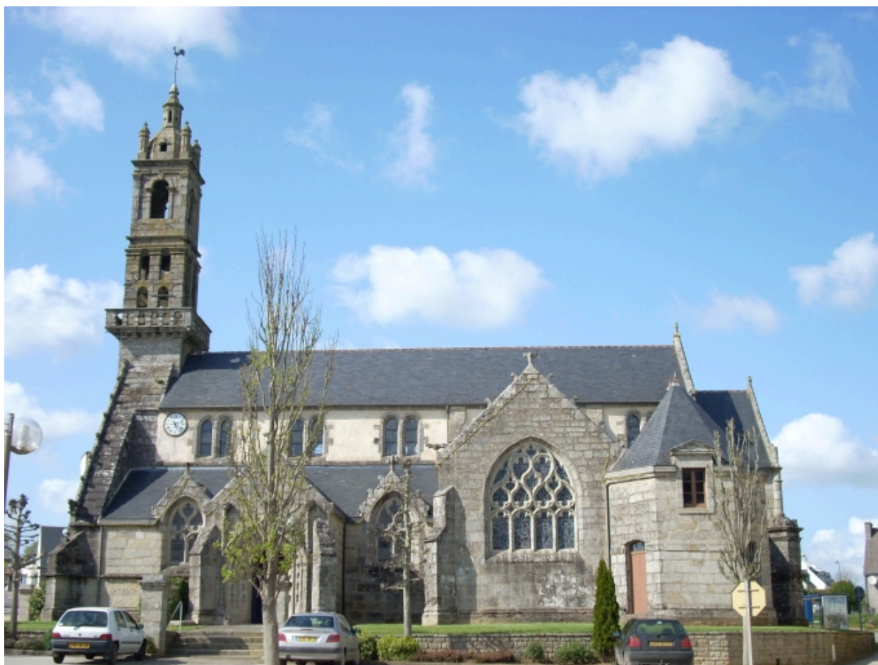
Edern, église paroissiale Saint-Edern : élévation sud