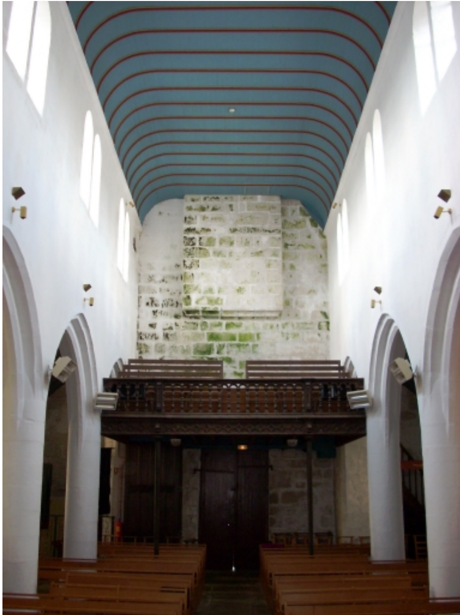
Edern, église paroissiale Saint-Edern : vue axiale ouest