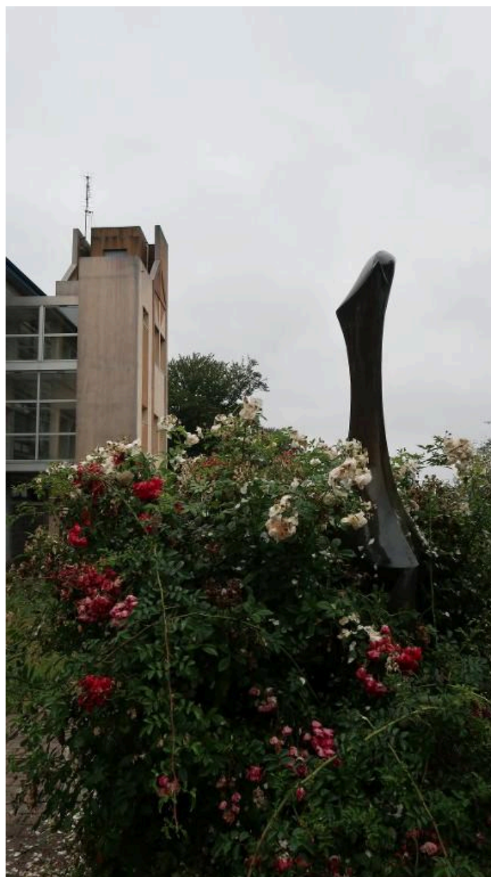
"Stella", sculpture en bronze de Baltasar Lobo (1968). Vue prise en 2018.