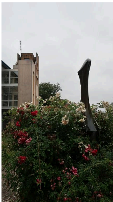
"Stella", sculpture en bronze de Baltasar Lobo (1968). Vue prise en 2018.

IVR53_20252910987NUCA