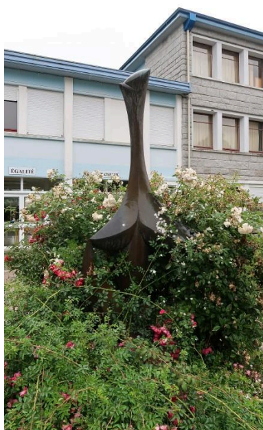
"Stella", sculpture en bronze de Baltasar Lobo (1968). Vue prise en 2018.

Autr. Baltasar Lobo IVR53_20252910958NUCA