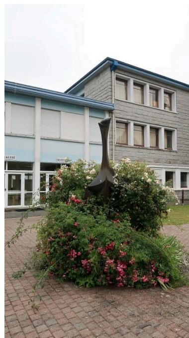
"Stella", sculpture en bronze de Baltasar Lobo (1968). Vue prise en 2019.

Phot. Thierry Goyet IVR53_20252910985NUCA