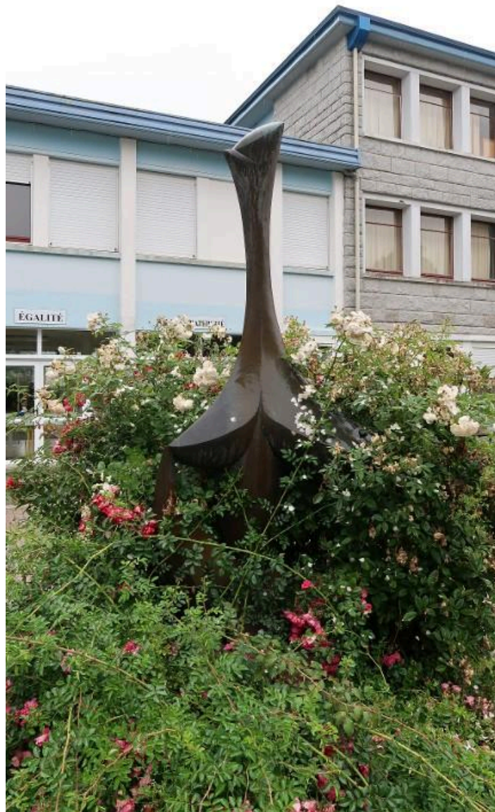
"Stella", sculpture en bronze de Baltasar Lobo (1968). Vue prise en 2018.