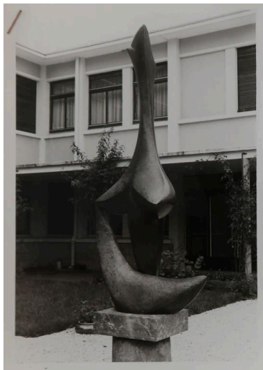
"Stella", sculpture en bronze de Baltasar Lobo (1968), photographiée peu après son installation.