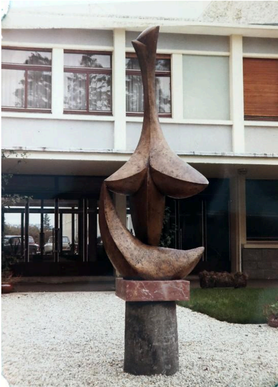
"Stella", sculpture en bronze de Baltasar Lobo (1968), photographiée peu après son installation.