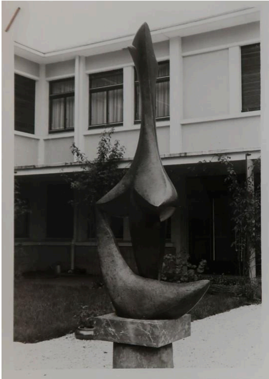
"Stella", sculpture en bronze de Baltazar Lobo (1968), photographiée peu après son installation.