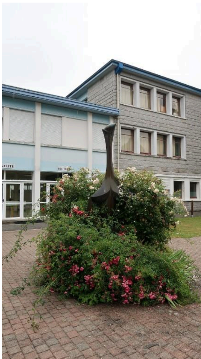
"Stella", sculpture en bronze de Baltasar Lobo (1968). Vue prise en 2019.