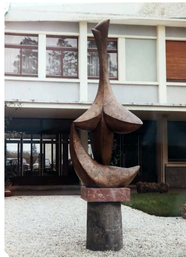
"Stella", sculpture en bronze de Baltasar Lobo (1968), photographiée peu après son installation.

Autr. Baltasar Lobo IVR53_20252910957NUC