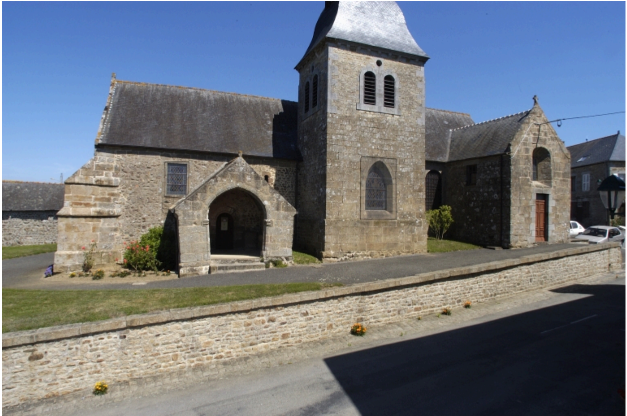
Elévation sud : vue générale