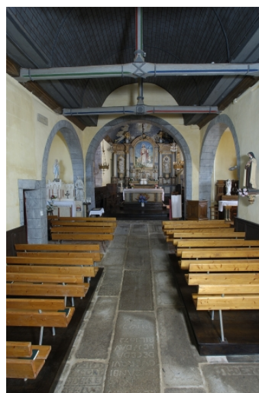
Vue intérieure prise de la nef vers le choeur