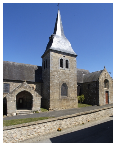
Elévation sud, porche et clocher