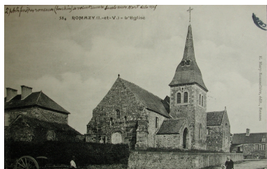
Vue générale sud-ouest (carte postale ancienne) IVR53_20053517524NUCB