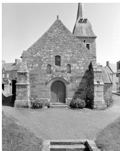
Elévation Ouest : vue générale IVR53_19943500969X