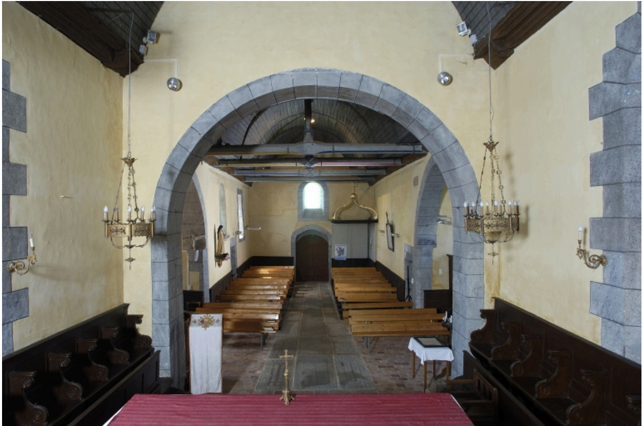
Vue intérieure prise du choeur vers la nef