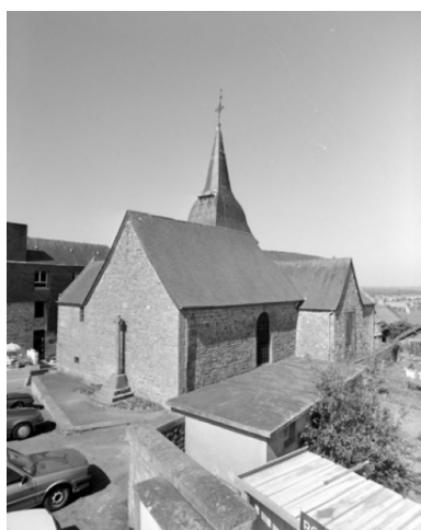
Elévation Nord-Est : vue générale, IVR53_19943500962X