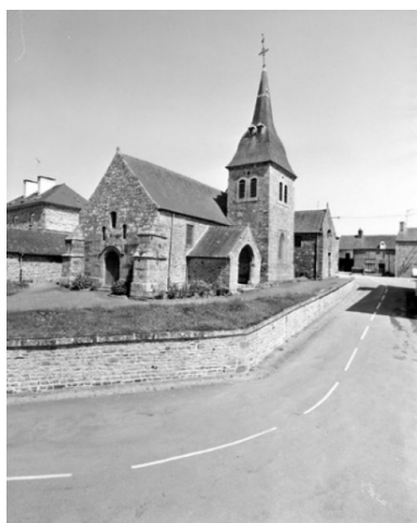
Elévation Sud-Ouest : vue générale IVR53_19943500968X