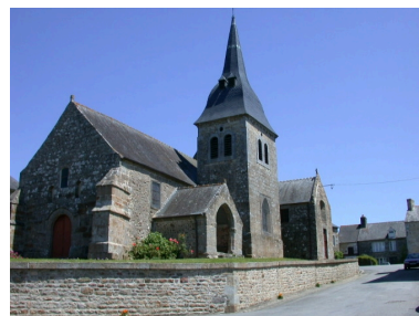
Vue générale sud-ouest IVR53_20053517347NUCA