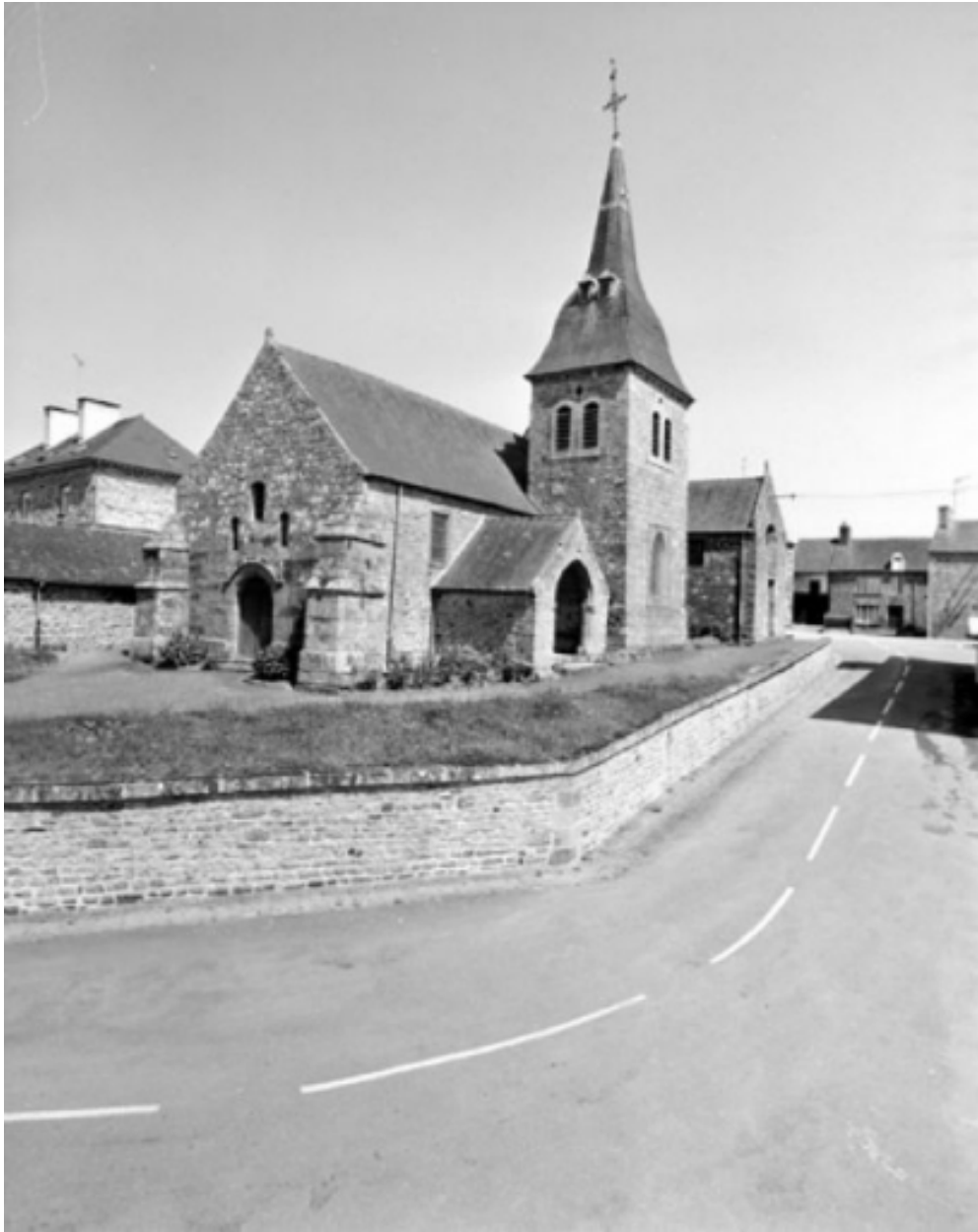
Elévation Sud-Ouest : vue générale