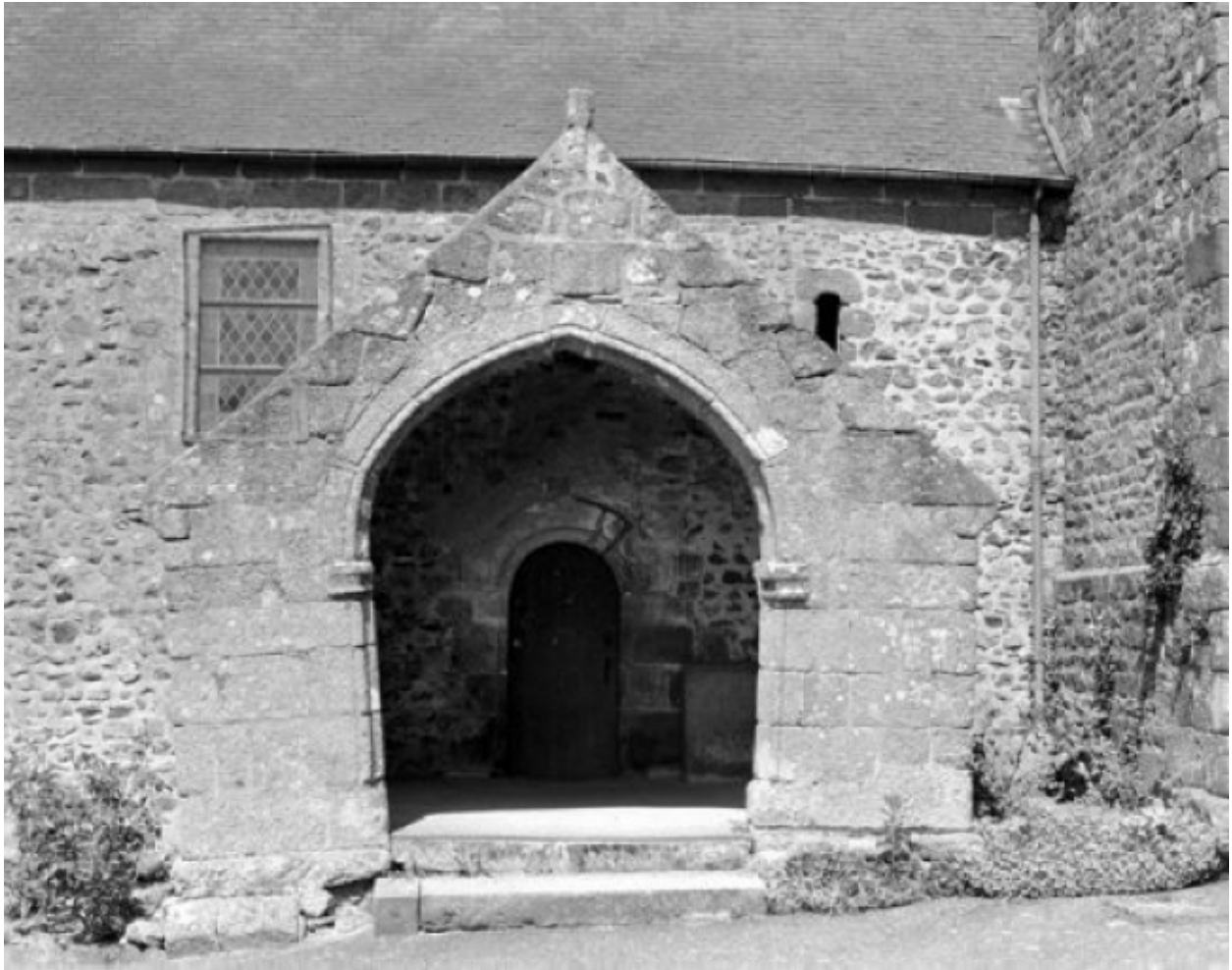
Elévation sud, porche : vue générale