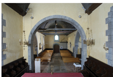
Vue intérieure prise du choeur vers la nef IVR53_20053502236NUCA