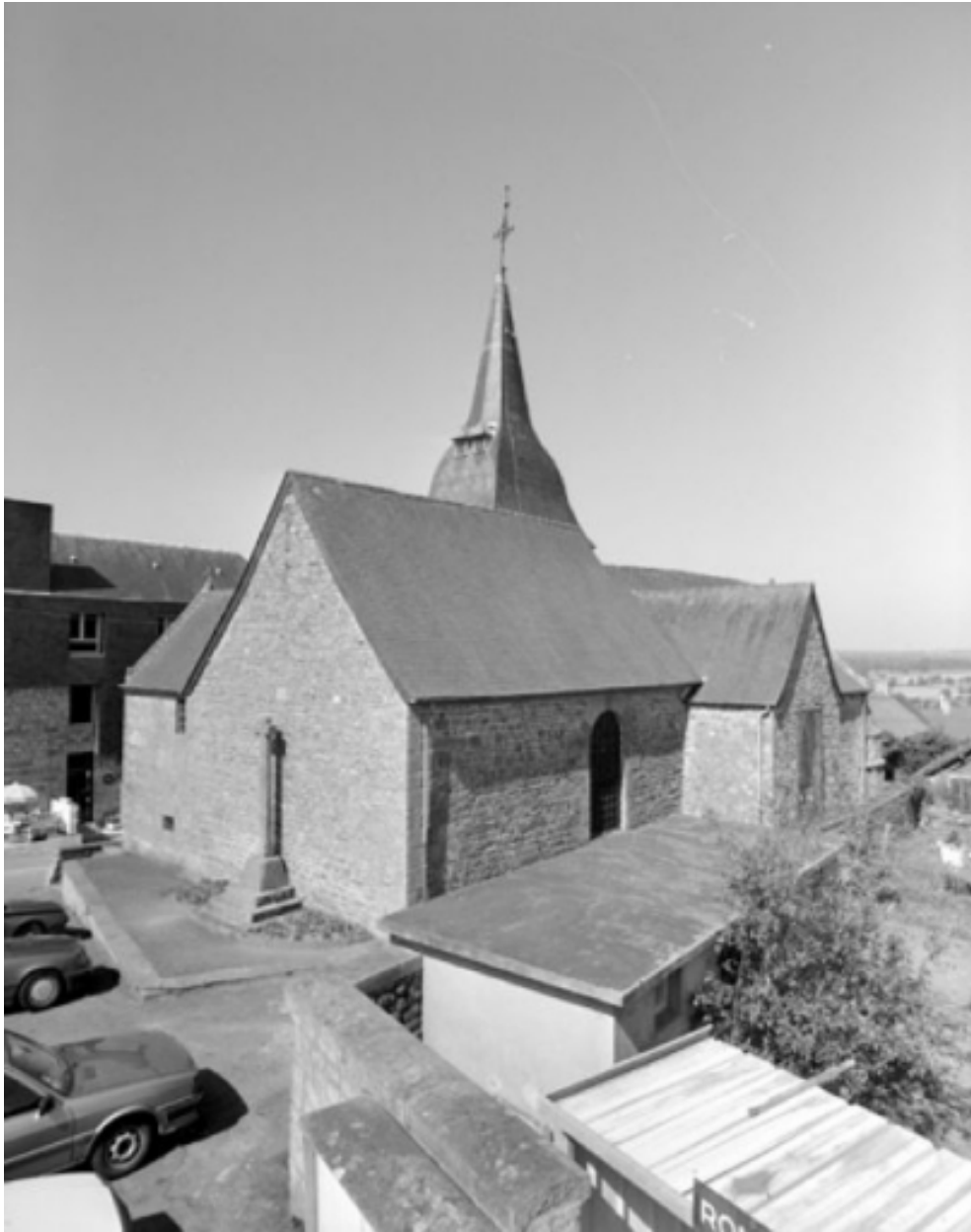
Elévation Nord-Est : vue générale