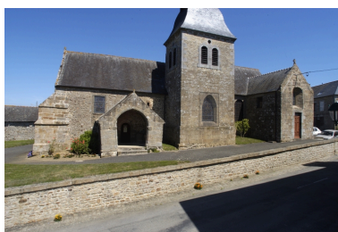
Elévation sud : vue générale IVR53_20053502405NUCA