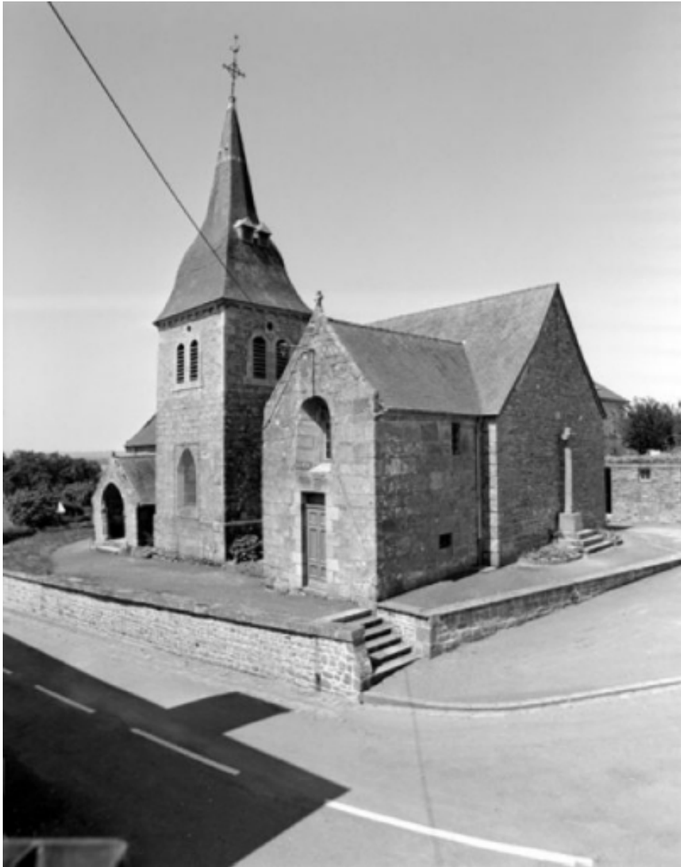
Elévation Sud-Est : vue générale