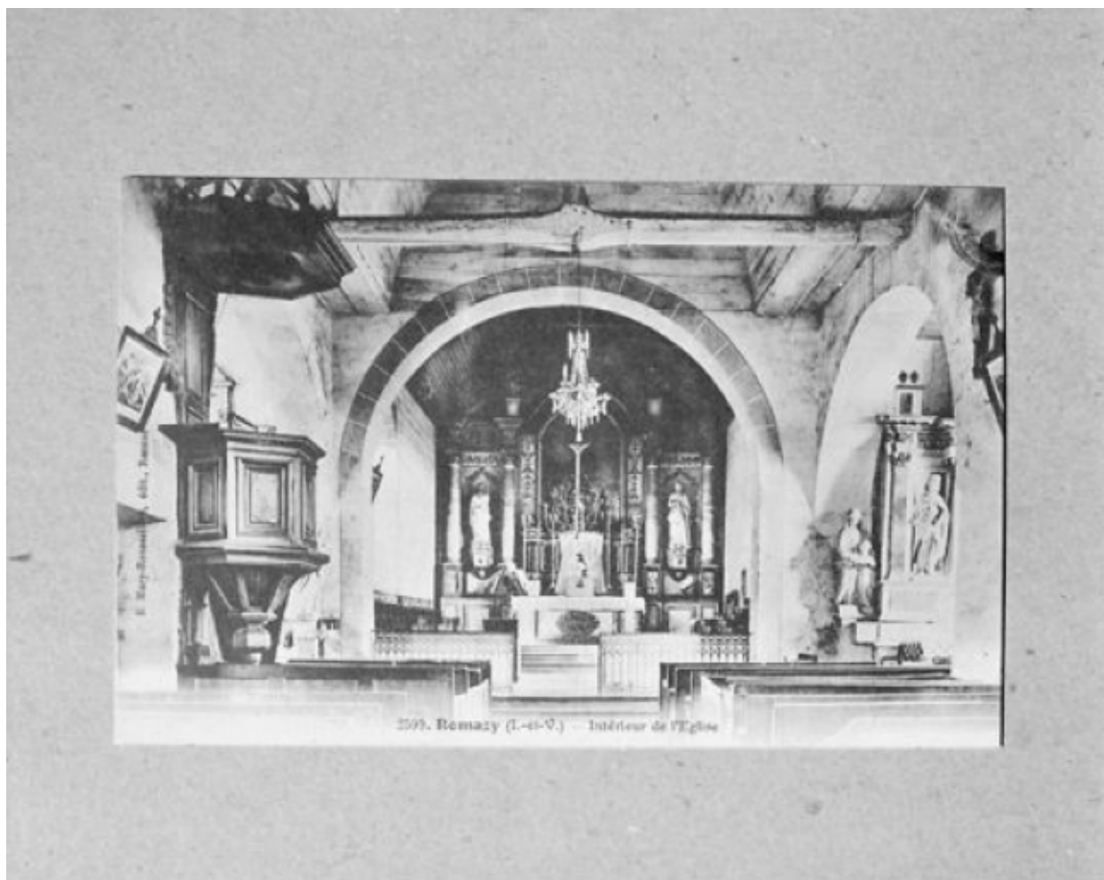
Intérieur : vue générale vers le chœur (carte postale ancienne)