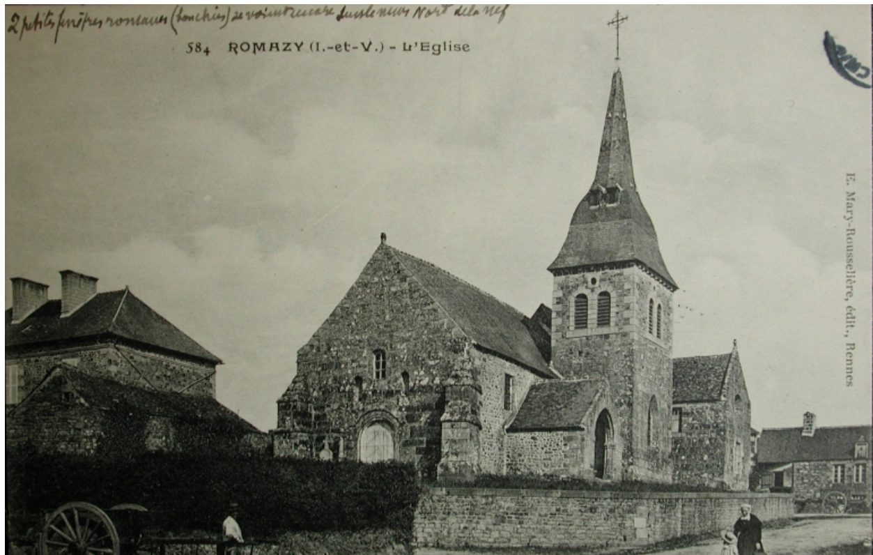
Vue générale sud-ouest (carte postale ancienne)