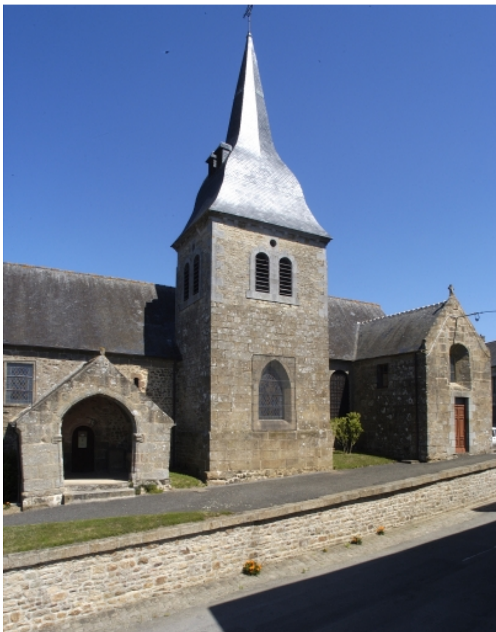
Elévation sud, porche et clocher