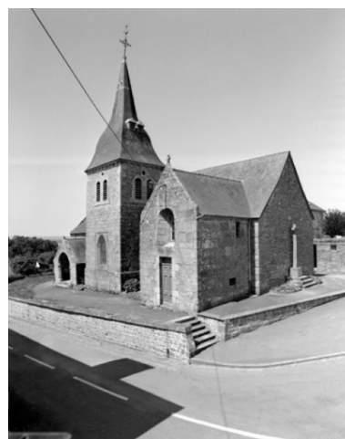
Elévation Sud-Est : vue générale IVR53_19943500966X