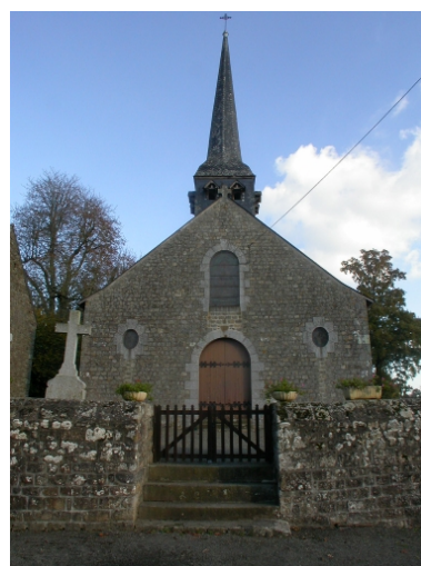
Vue de l'entrée de l'église