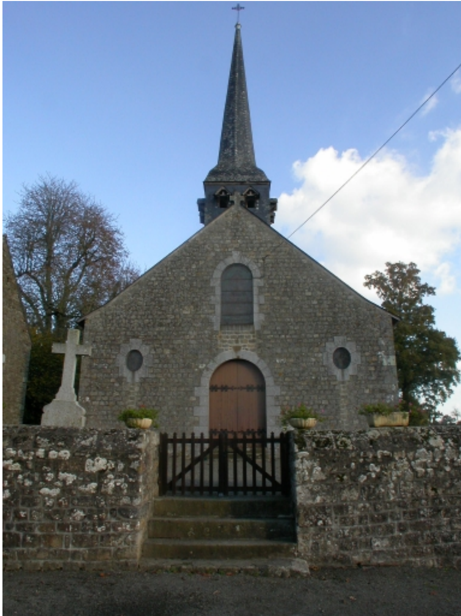
Vue de l'entrée de l'église