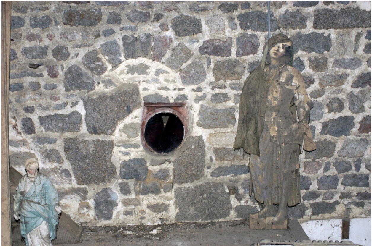
Étage de la sacristie, détail de la maçonnerie du mur est de l'église