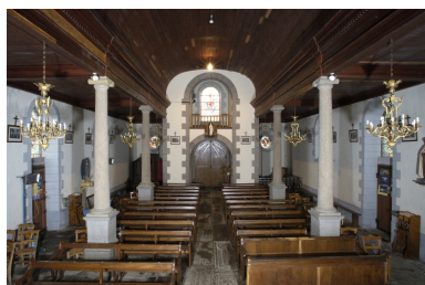
Vue intérieure prise du chœur vers la nef