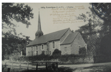
Carte postale IVR53_20053520886NUCA