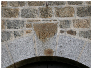
Date au-dessus de la porte principale : 1902