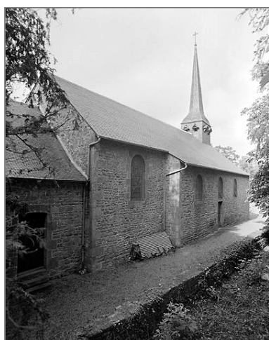
Vue générale sud