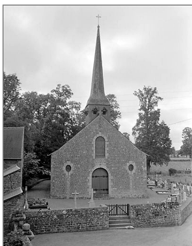
Vue générale IVR53_19943500989X