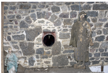
Etage de la sacristie, détail de la maçonnerie du mur est de l'église