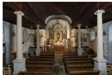
Vue intérieure prise de la nef vers le chœur