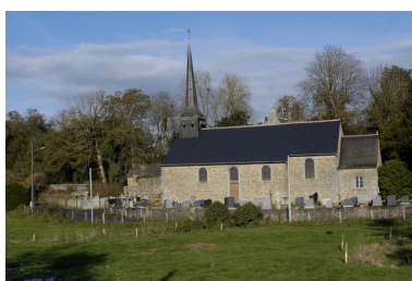
Vue générale IVR53_20053503285NUCA