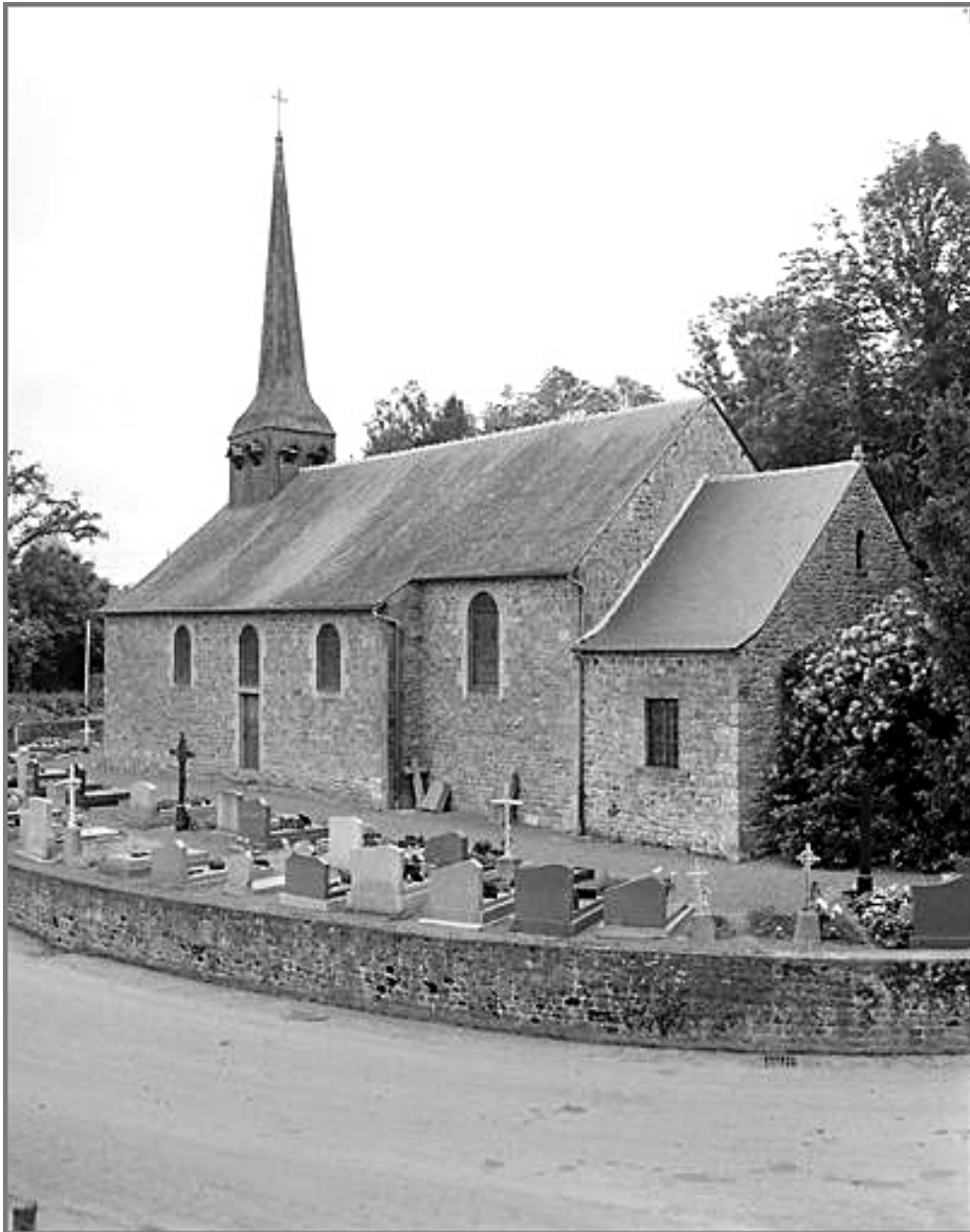
Vue générale nord ouest