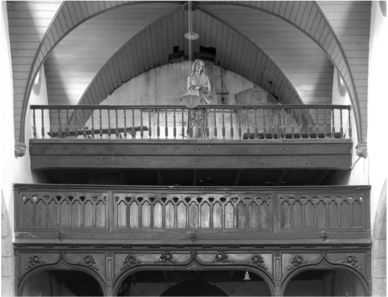
Collorec, église paroissiale Notre-Dame : tribunes, état en 1967