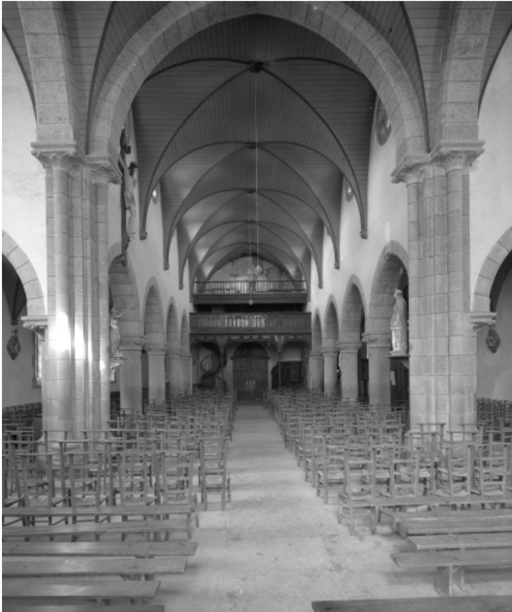
Collorec, église paroissiale Notre-Dame : vue générale intérieure d'est en ouest, état en 1967