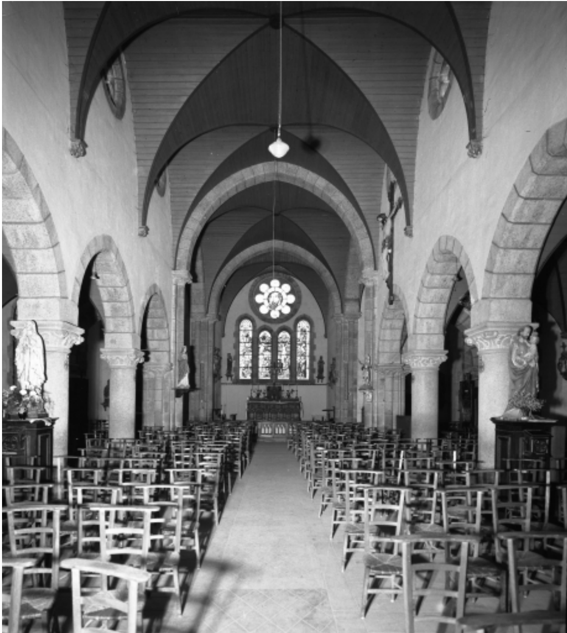
Collorec, église paroissiale Notre-Dame : vue générale intérieure d'ouest en est, état en 1967