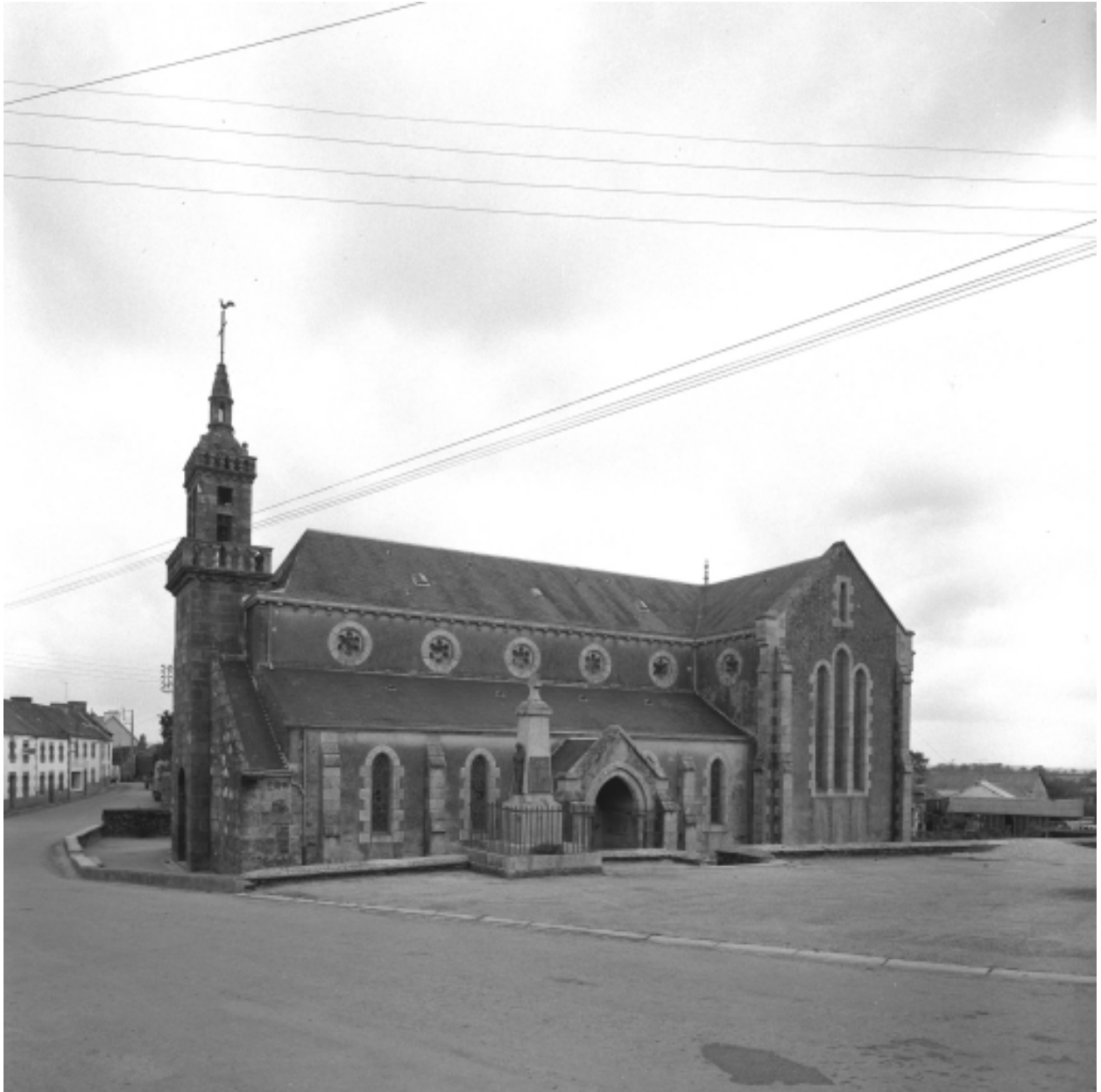
Collorec, église paroissiale Notre-Dame : vue générale sud, état en 1967