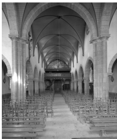
Collorec, église paroissiale Notre- Dame : vue générale intérieure d'est en ouest, état en 1967 IVR53_19672900191V