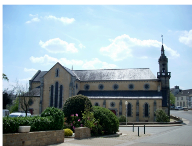
Collorec, église paroissiale Notre-Dame : vue générale nord IVR53_20082905832NUCA