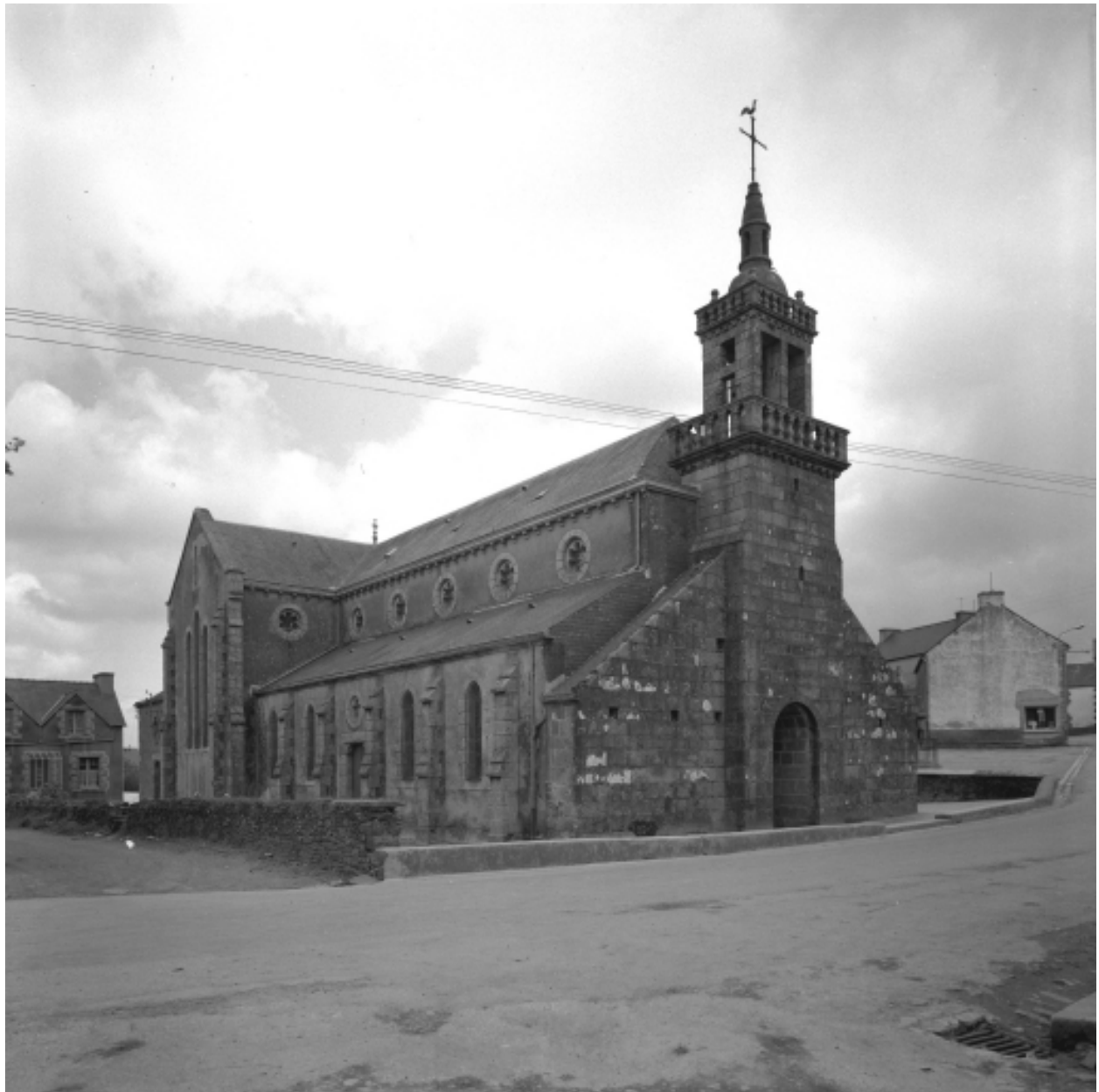
Collorec, église paroissiale Notre-Dame : vue générale nord-ouest, état en 1967