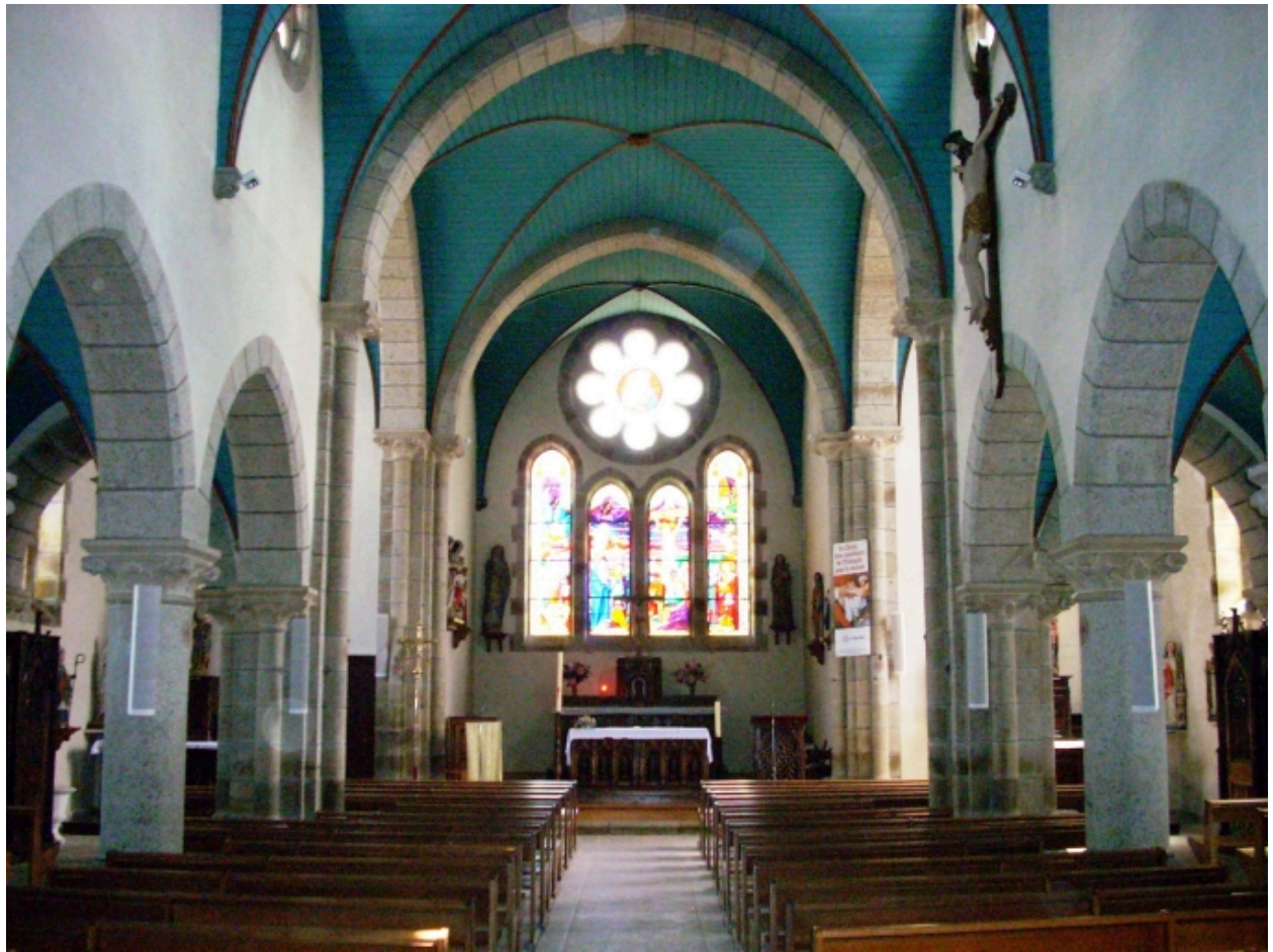
Collerec, église paroissiale Notre-Dame : vue axiale est