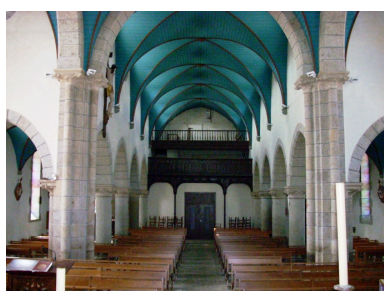
Collorec, église paroissiale Notre-Dame : vue axiale ouest IVR53_20082905834NUCA