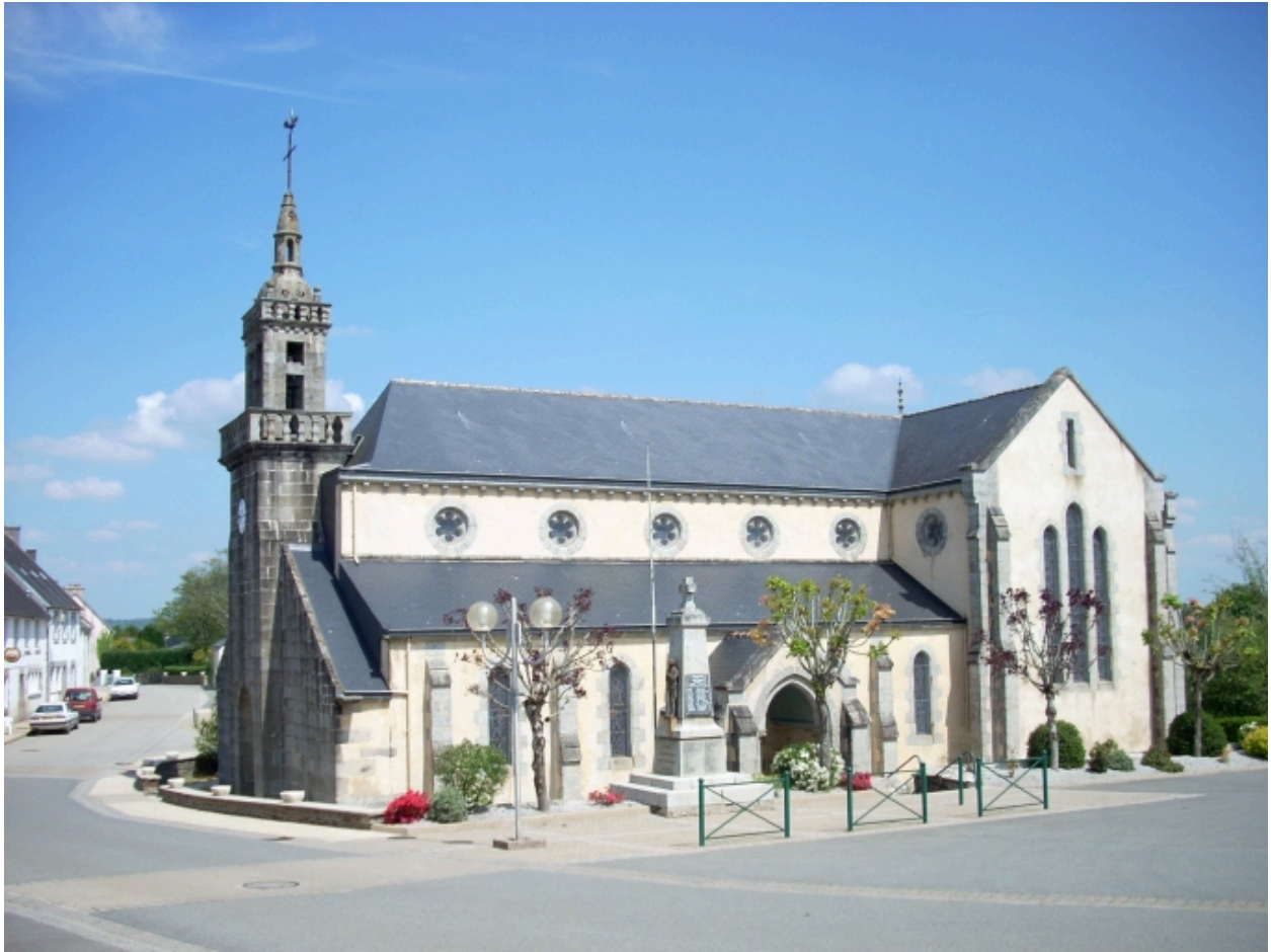
Collorec, église paroissiale Notre-Dame : vue générale sud-ouest