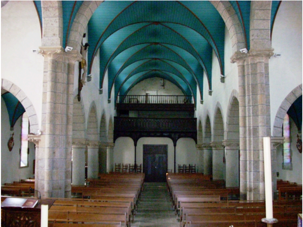
Collorec, église paroissiale Notre-Dame : vue axiale ouest