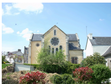
Collorec, église paroissiale Notre-Dame : élévation est IVR53_20082905831NUCA