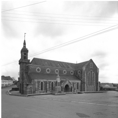
Collirec, église paroissiale Notre-Dame : vue générale sud, état en 1967 IVR53_19672900178V