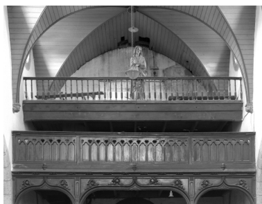
Collorec, église paroissiale Notre- Dame : tribunes, état en 1967 IVR53_19672900192V