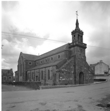
Collirec, église paroissiale Notre-Dame : vue générale nord-ouest, état en 1967 IVR53_19672900179V