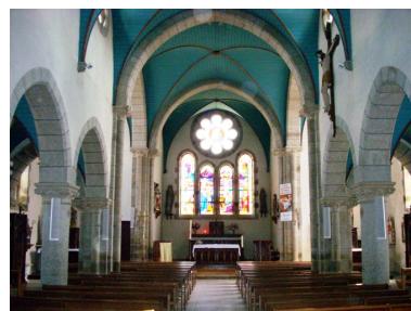
Collorec, église paroissiale Notre-Dame : vue axiale est IVR53_20082905833NUCA