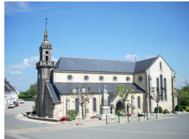
Collirec, église paroissiale Notre-Dame : vue générale sud-ouest IVR53_20082905830NUCA