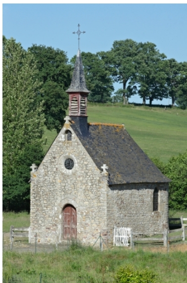
Vue sud-ouest IVR53_20113502066NUCA