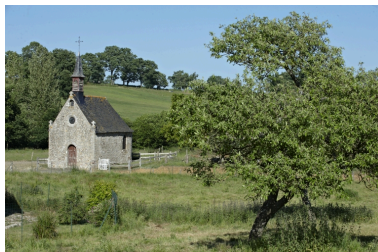
Vue générale sud-ouest IVR53_20113502068NUCA