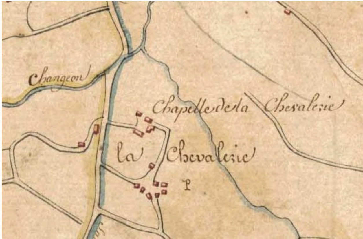
La Chevalerie sur le cadastre de 1827