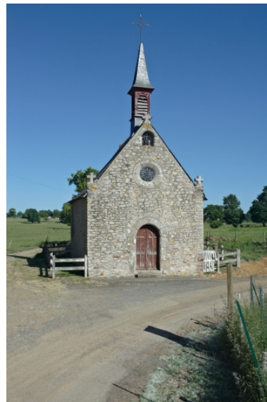
Vue générale ouest IVR53_20113502063NUCA