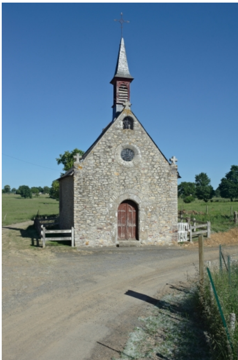
Vue générale ouest