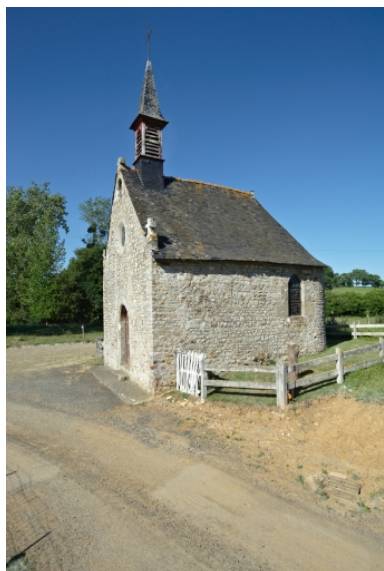
Vue sud-ouest IVR53_20113502065NUCA