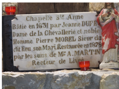
Plaque commémorative IVR53_20113505723NUCA