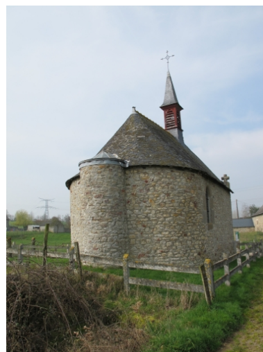
Vue nord-est IVR53_20113505717NUCA