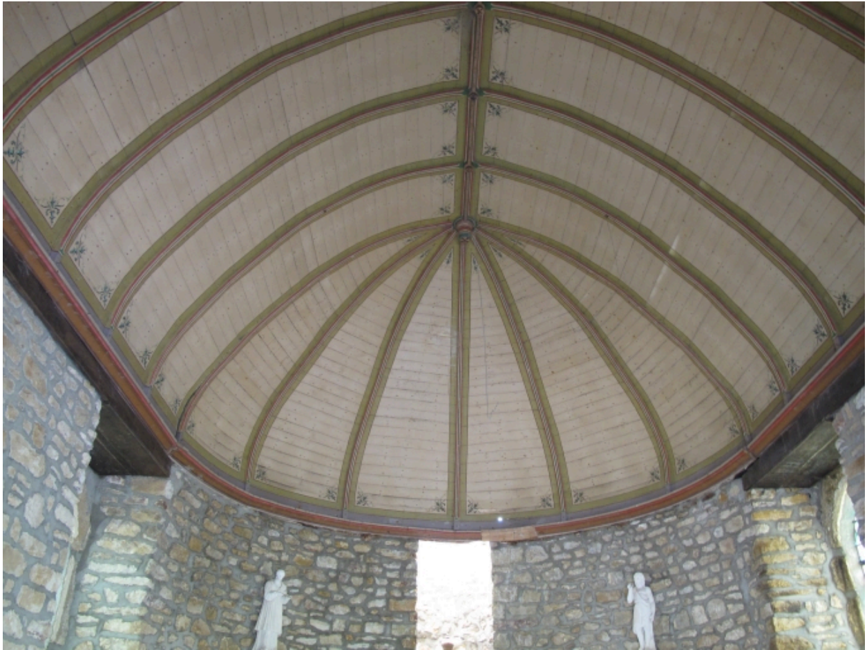
La voute en bois