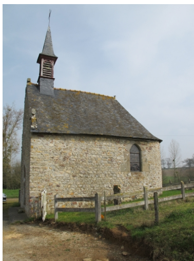
Vue générale sud IVR53_20113505716NUCA