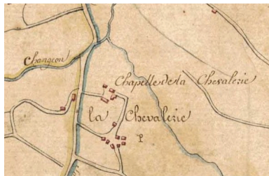
La Chevalerie sur le cadastre de 1827, IVR53_20113506140NUCA