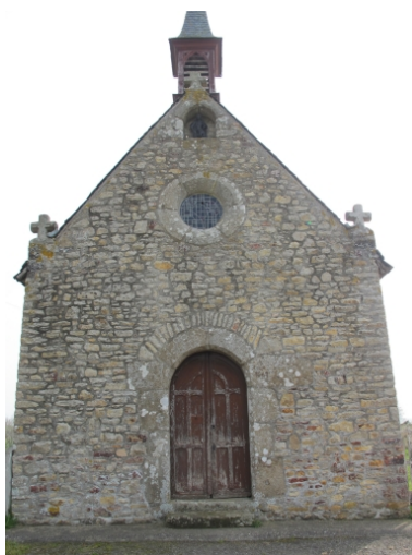
Façade ouest