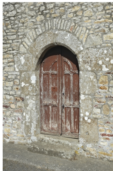
Détail de la porte ouest IVR53_20113502064NUCA