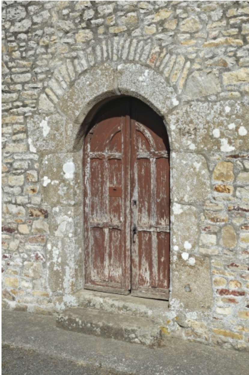
Détail de la porte ouest