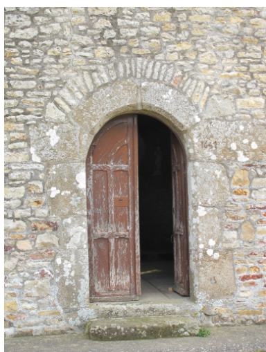
Porte ouest