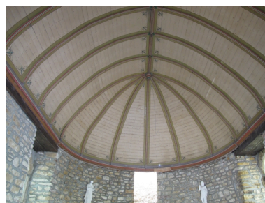
La voute en bois IVR53_20113505722NUCA