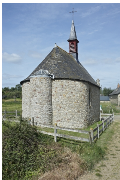
Vue nord-est IVR53_20113502312NUCA