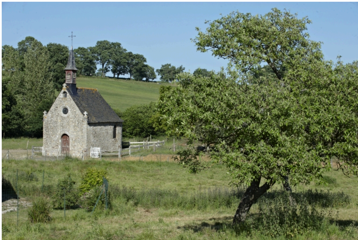
Vue g n rale sud-ouest