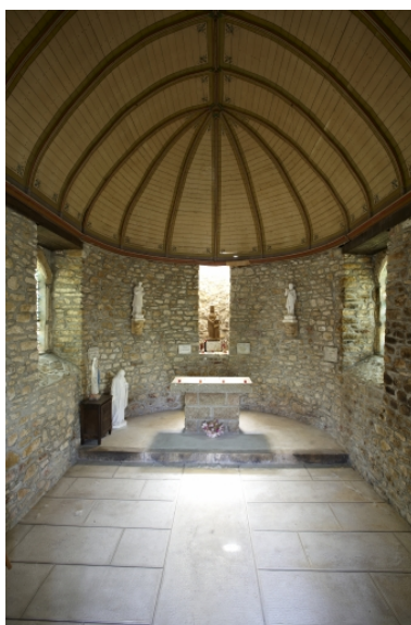
Vue intérieure IVR53_20113502067NUCA