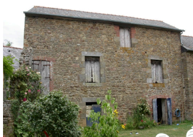
Les dépendances IVR53_20053518258NUCA