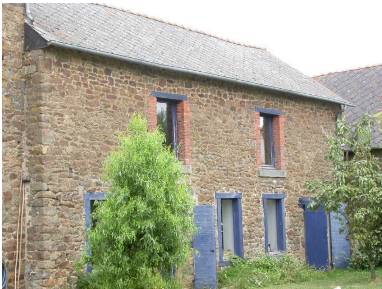
Bâtiment de dépendances