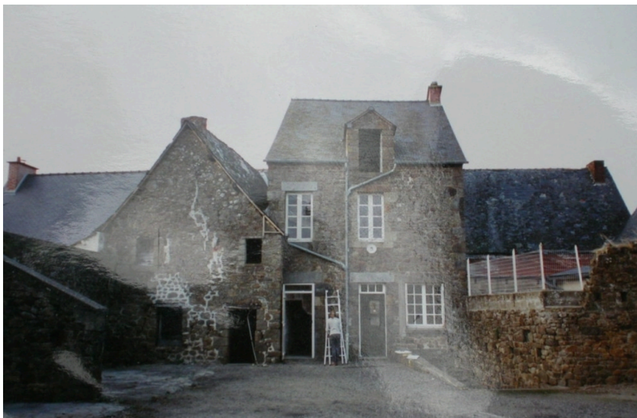
Photographie avant travaux