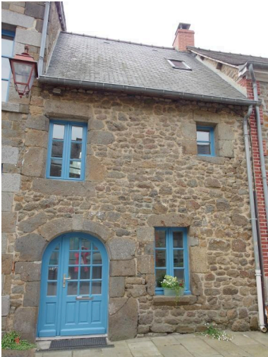
Vue de la façade nord, partie ouest, 14 Rue de l#Abbaye (Hédé-Bazouges) IVR53_20243532231NUCA