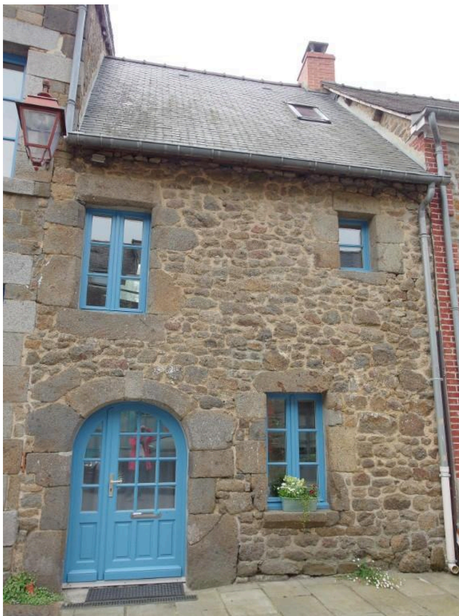
Vue de la façade nord, partie ouest, 14 Rue de l'Abbaye (Hédé-Bazouges)