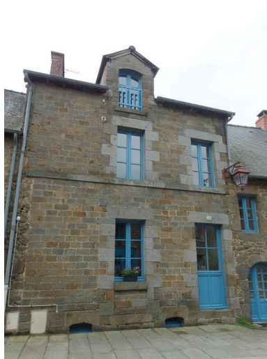
Vue de la façade nord, partie est IVR53_20243532230NUCA