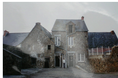
Photographie avant travaux IVR53_20053518257NUCA