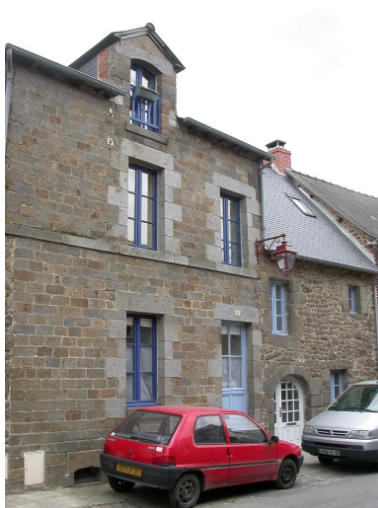
Vue d'ensemble nord-est IVR53_20053518256NUCA