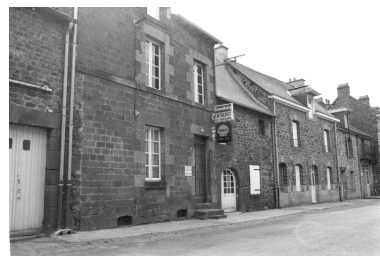
Le bâtiment sur une photographie de 1975 IVR53_19753501086Z