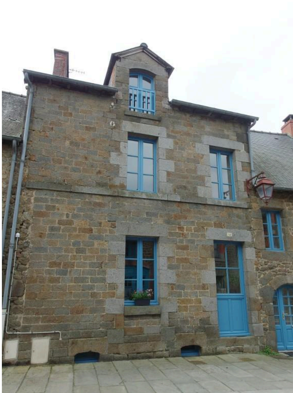
Vue de la façade nord, partie est