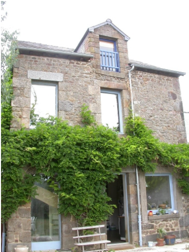
Façade postérieure IVR53_20053518254NUCA