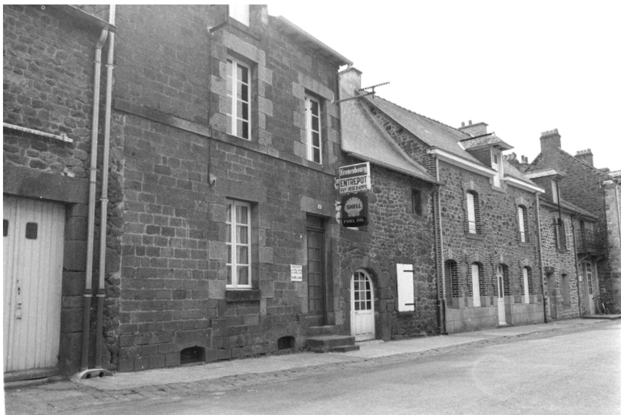
Le bâtiment sur une photographie de 1975