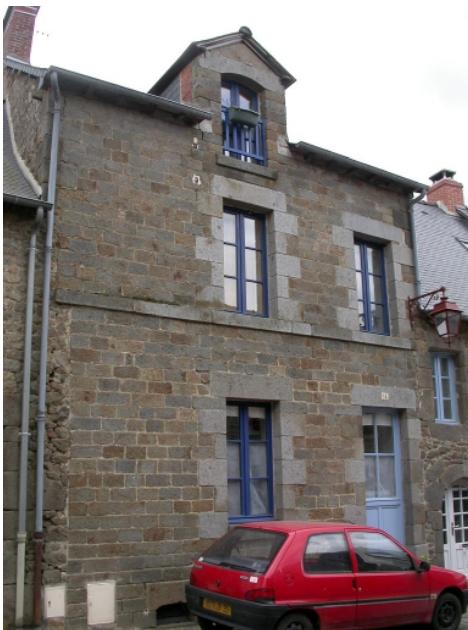
Vue générale nord