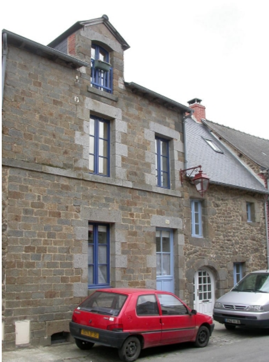
Vue d'ensemble nord-est