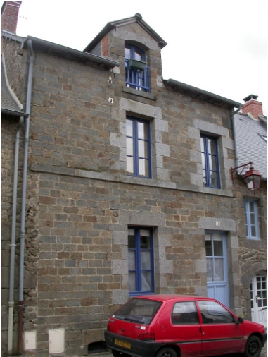
Vue générale nord IVR53_20053518253NUCA