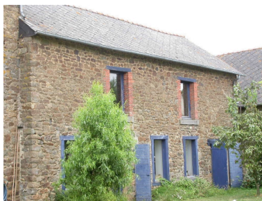
Bâtiment de dépendances IVR53_20053518259NUCA