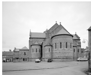
Elévation Sud-Ouest : vue générale IVR53_19943500122X