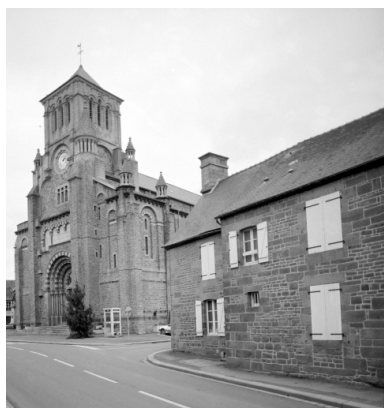
Elévation Nord-Ouest : vue générale IVR53_19943500127X