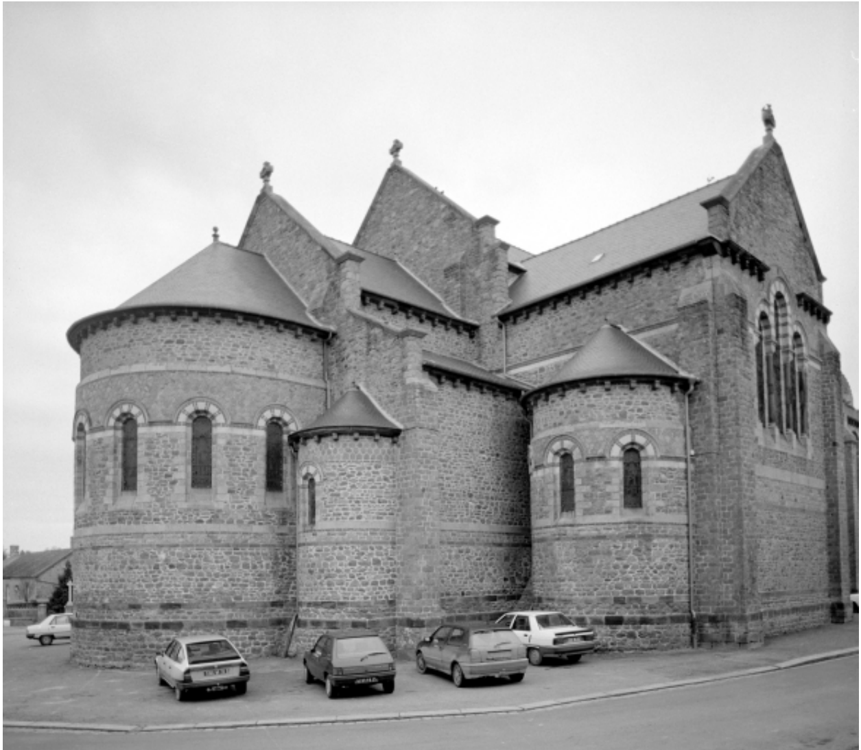
Elévation Sud-Est : vue générale