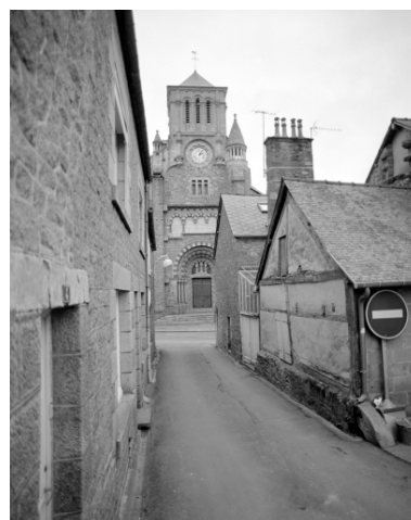
Elévation Nord : vue générale IVR53_19943500125X