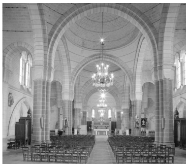
Intérieur : vue générale vers le chœur. IVR53_19943500008X