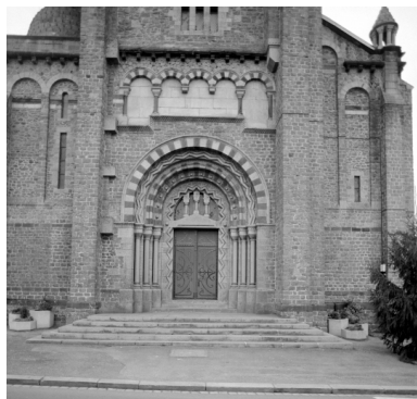
Elévation Nord, porte principale : vue générale