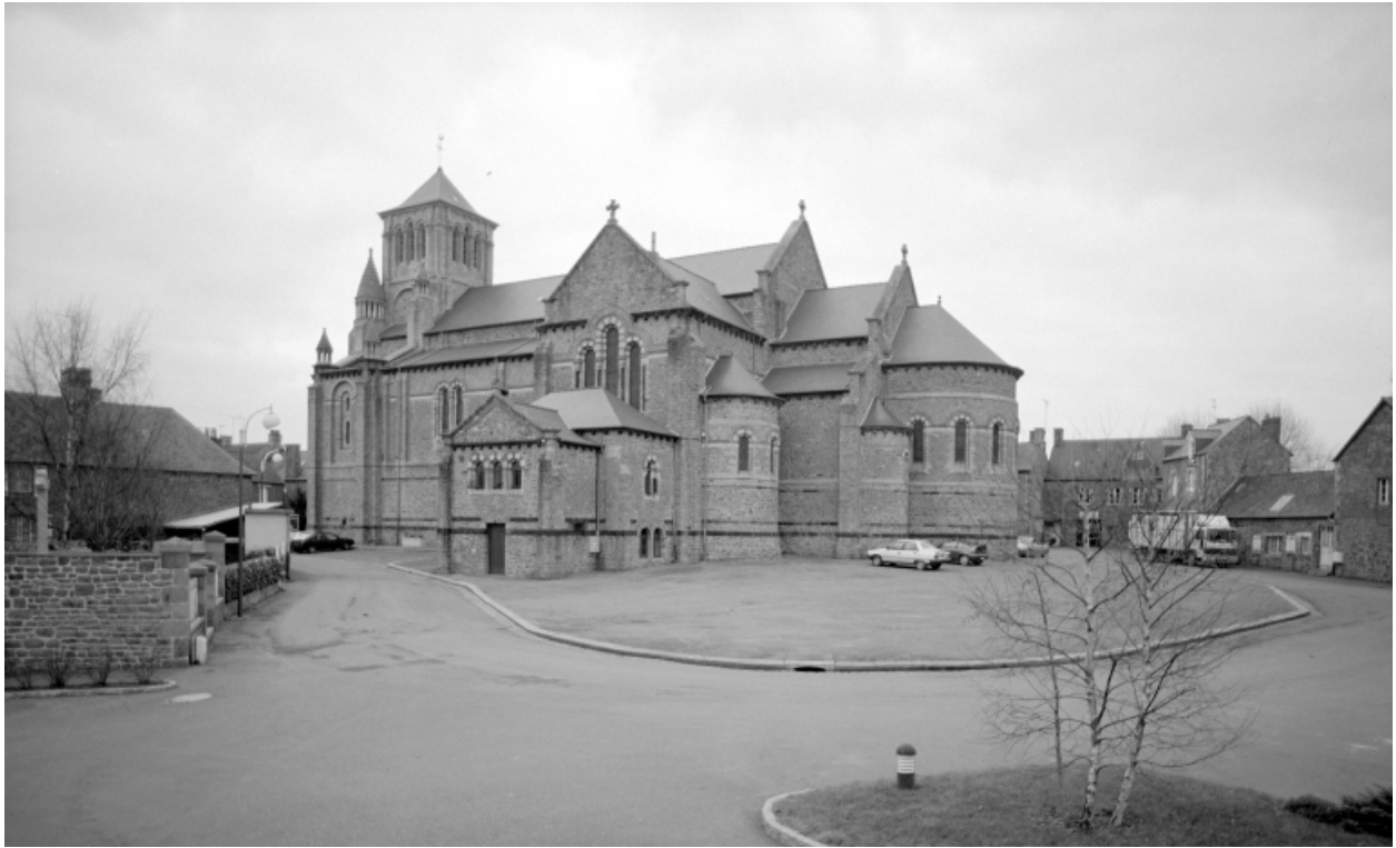
Elévation Sud-Ouest : vue générale