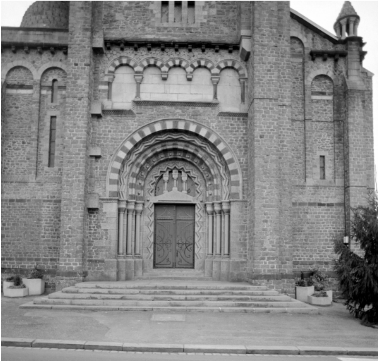
Elévation Nord, porte principale : vue générale