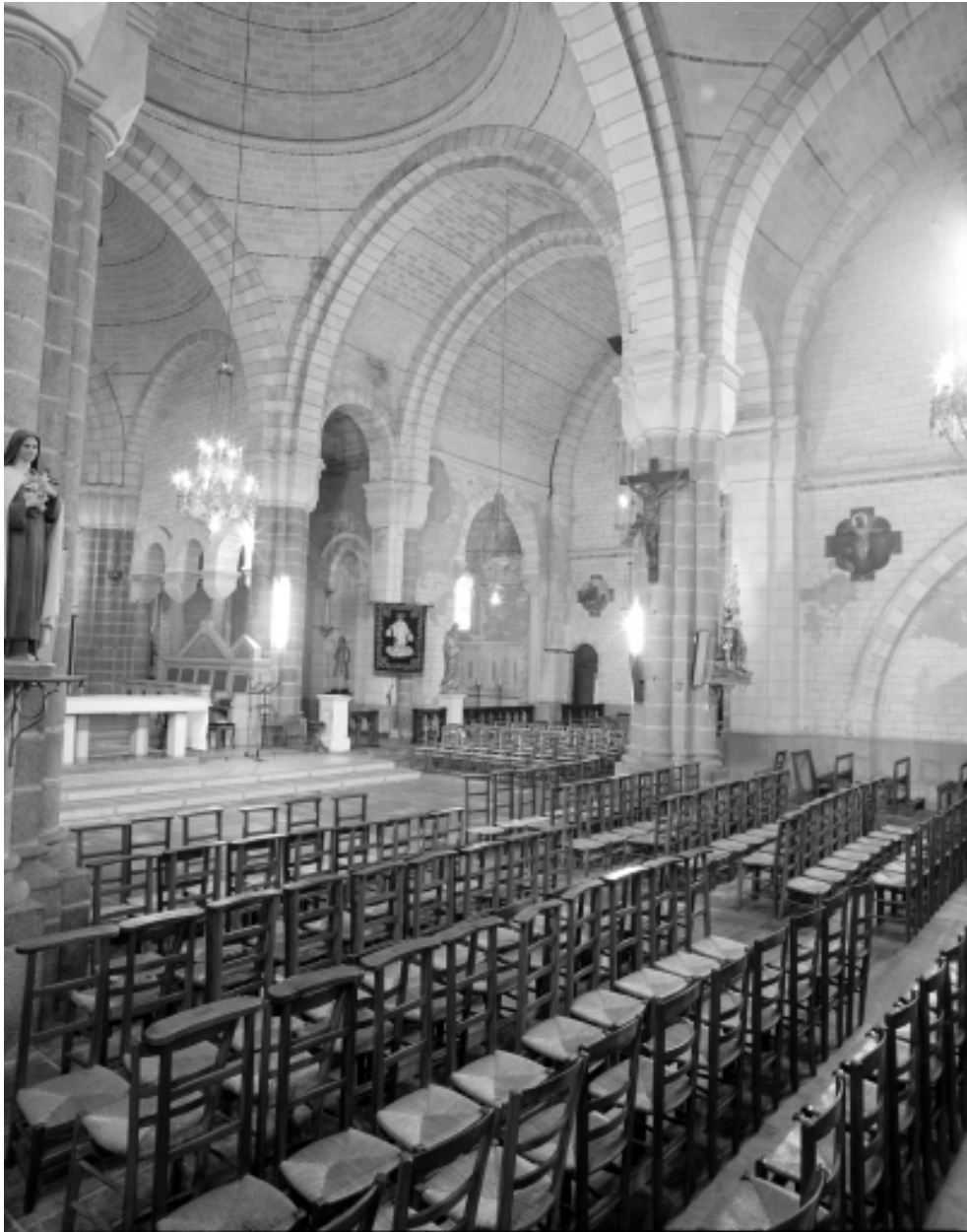
Intérieur, bras Ouest du transept : vue générale.