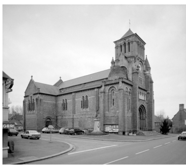
Elévation Nord-Est : vue générale IVR53_19943500124X