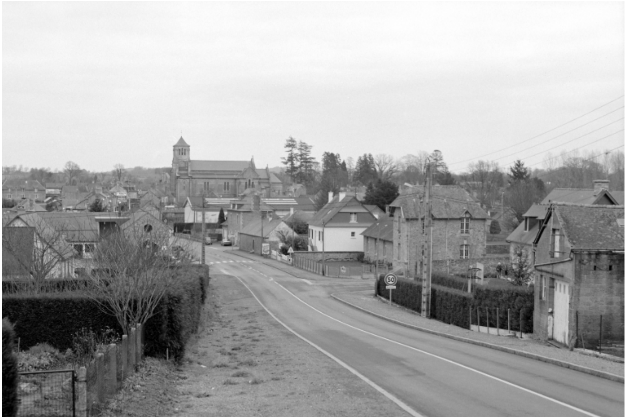
Elévation Ouest : vue de situation