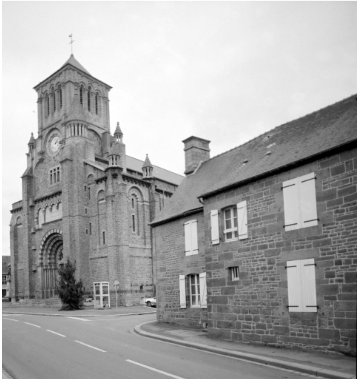
Elévation Nord-Ouest : vue générale