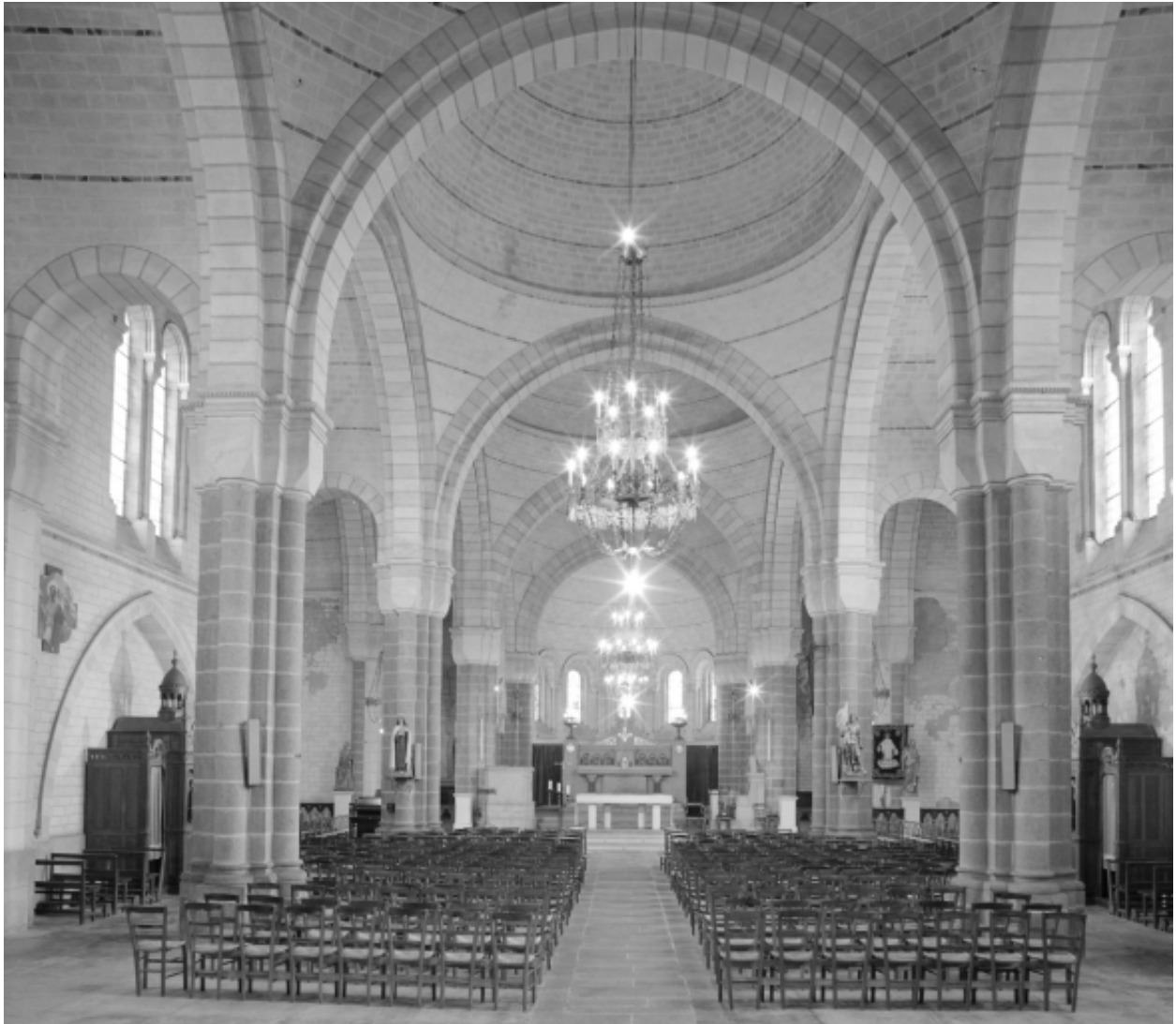
Intérieur : vue générale vers le chœur.