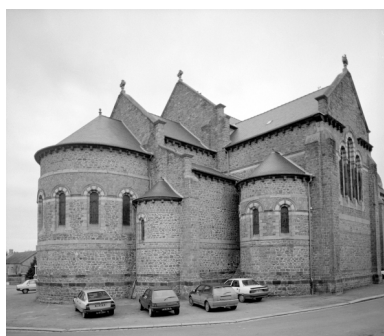
Elévation Sud-Est : vue générale