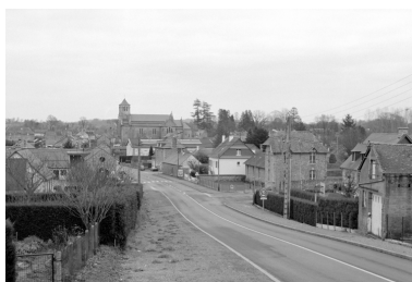
Elévation Ouest : vue de situation IVR53_19943500128X