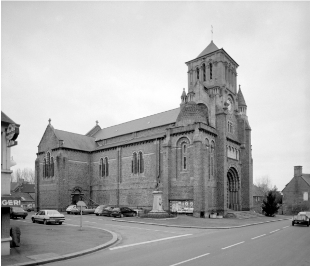
Elévation Nord-Est : vue générale