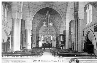
Carte postale ancienne - Intérieur : vue générale vers le chœur. IVR53_19933500884X