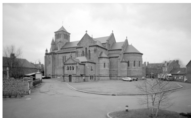
Elévation Sud-Ouest : vue générale IVR53_19943500121X