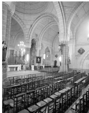
Intérieur, bras Ouest du transept : vue générale. IVR53_19943500009X