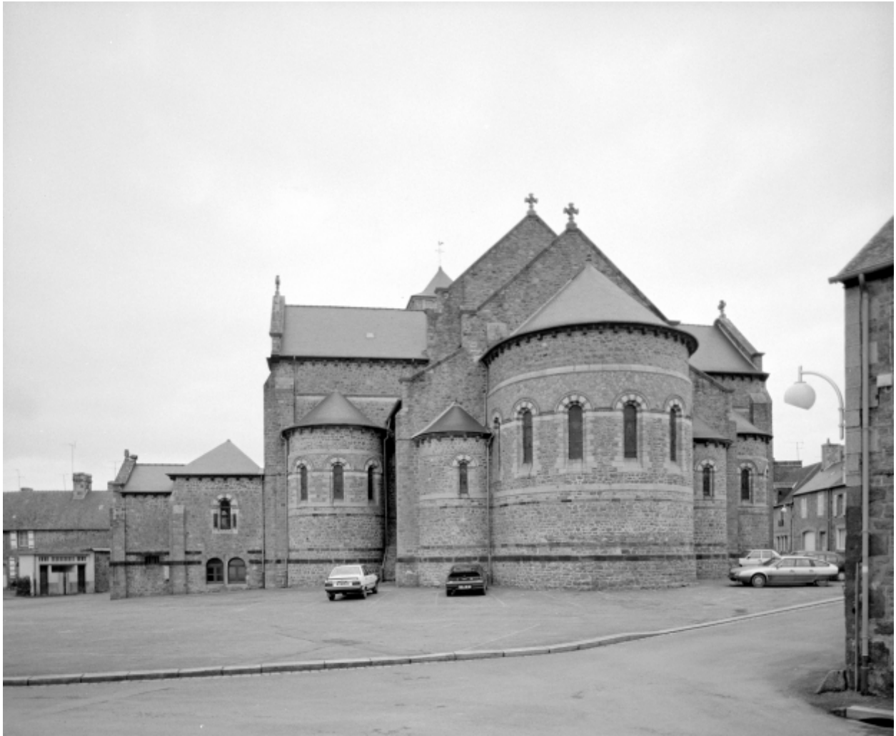
Elévation Sud-Ouest : vue générale