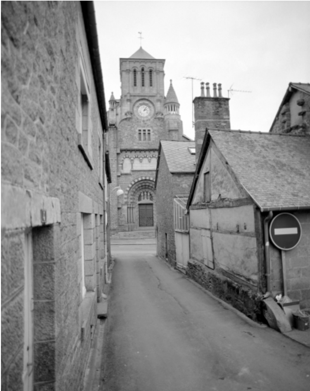
Elévation Nord : vue générale