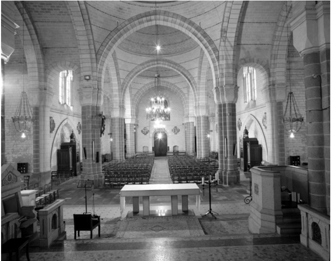
Intérieur, nef : vue générale.