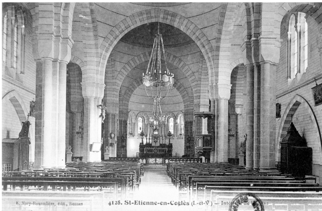
Carte postale ancienne - Intérieur : vue générale vers le chœur.