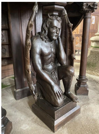
Démon agenouillé, vue de côté IVR53_20255610622NUCA