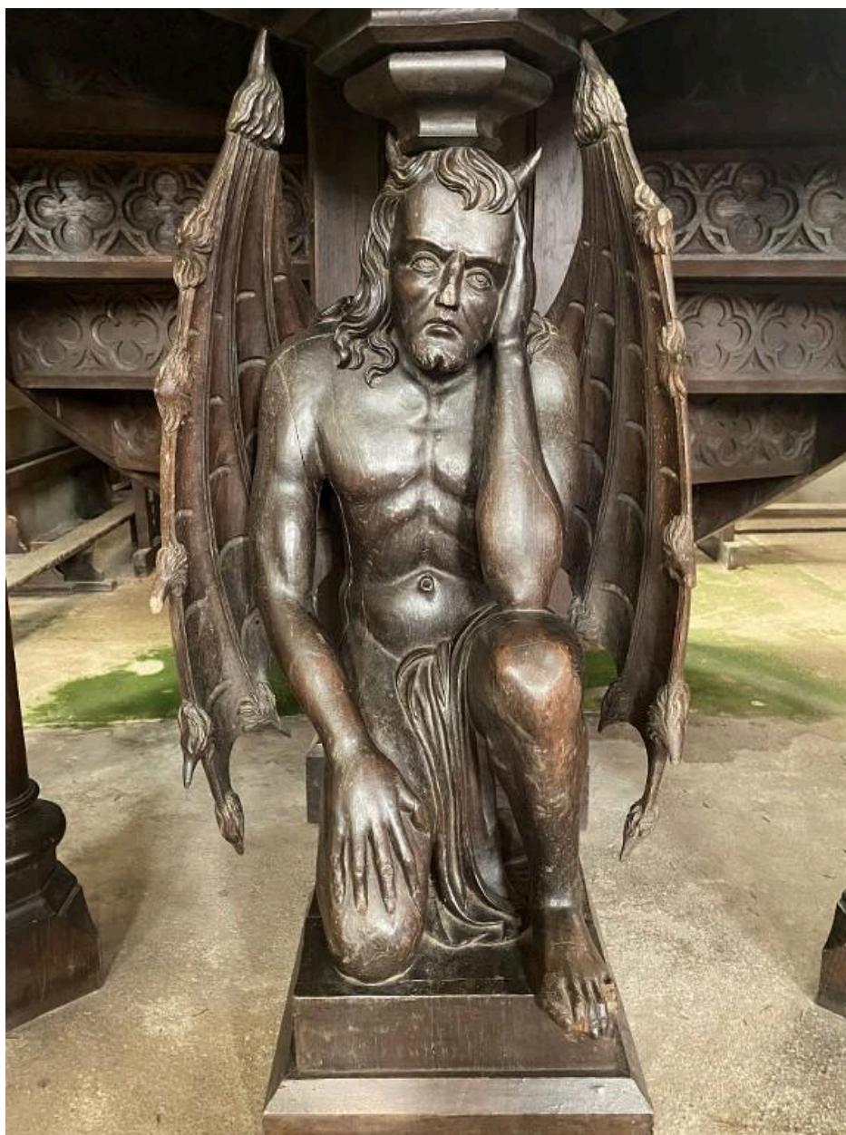
Démon agenouillé, vue de face