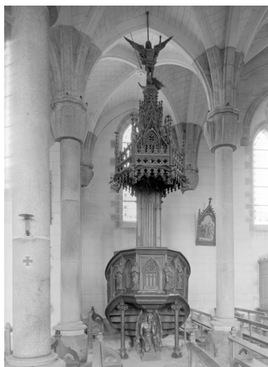
Chaire à prêcher (état en 1984)