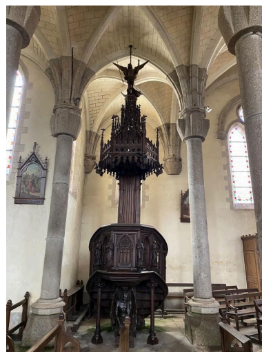
Vue générale IVR53_20255610621NUCA