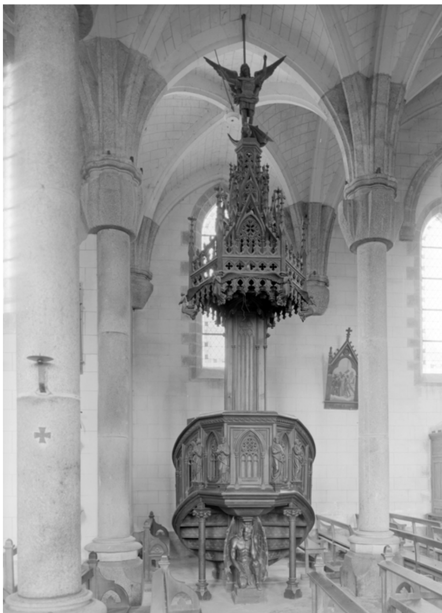
Chaire à prêcher (état en 1984)