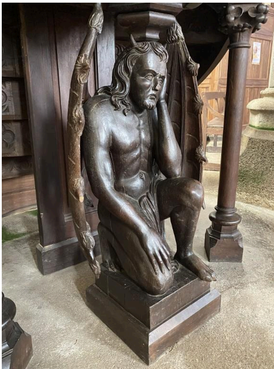
Démon agenouillé, vue de côté