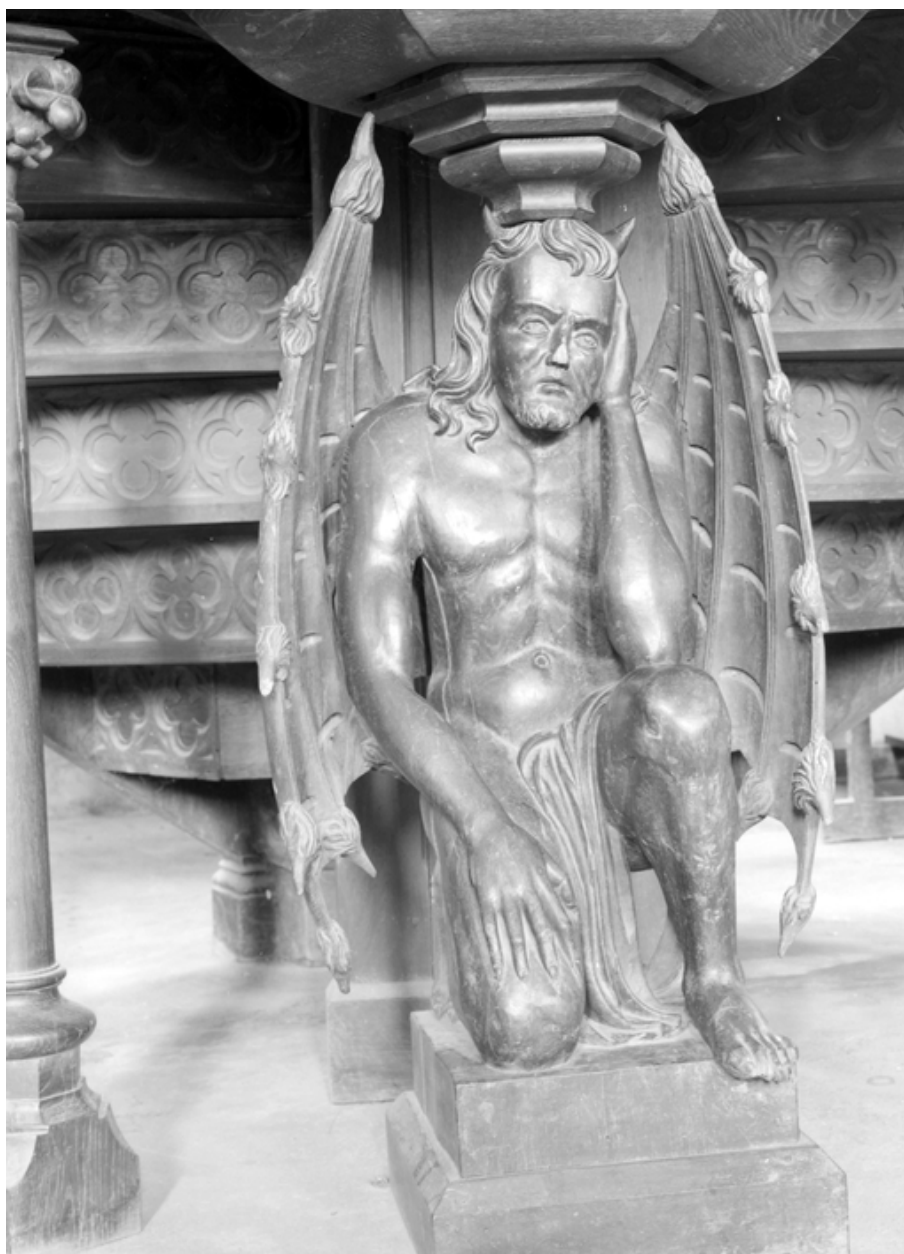
Chaire à prêcher, le culot : un diable (état en 1984)