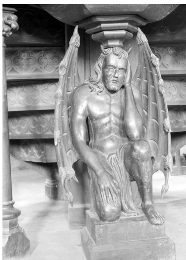
Chaire à prêcher, le culot : un diable (état en 1984) IVR53_19845601399X