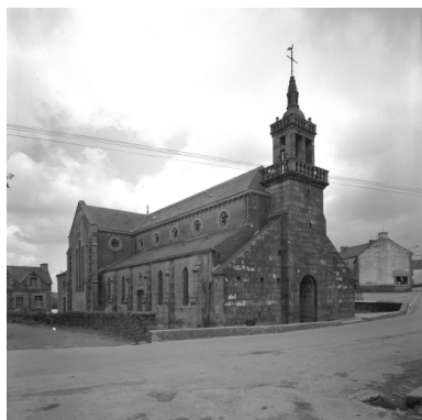
Vue générale nord-ouest