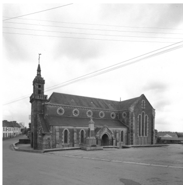
Vue générale sud