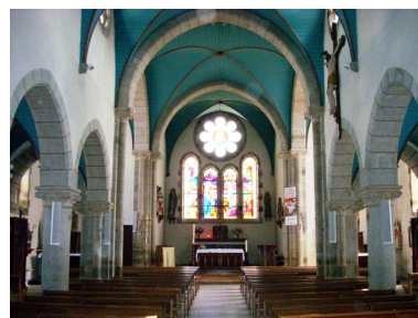
Vue axiale est. IVR53_20082905833NUCA