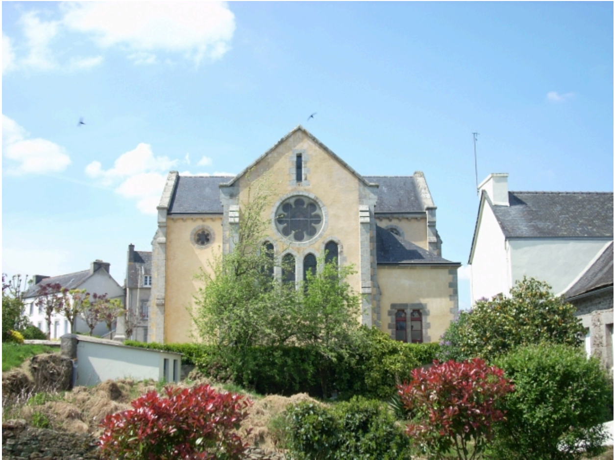
Elévation est, état en 2008.