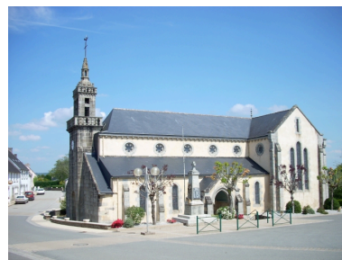
Vue générale sud-ouest, état en 2008. IVR53_20082905830NUCA

Vue générale intérieure d'ouest en est IVR53_19672900190V