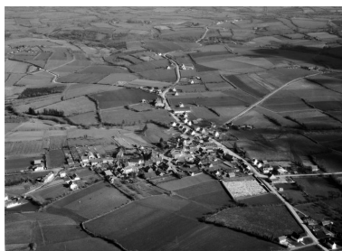
Vue aérienne ouest IVR53_19732900048V