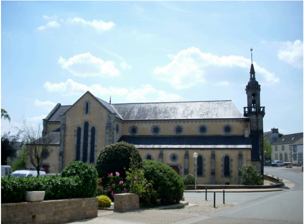
Vue générale nord, état en 2008.