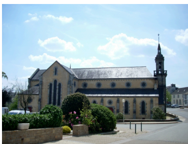
Vue générale nord, état en 2008. IVR53_20082905832NUCA