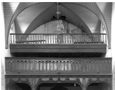
Tribunes, état en 1967.

Vue générale intérieure d'ouest en est