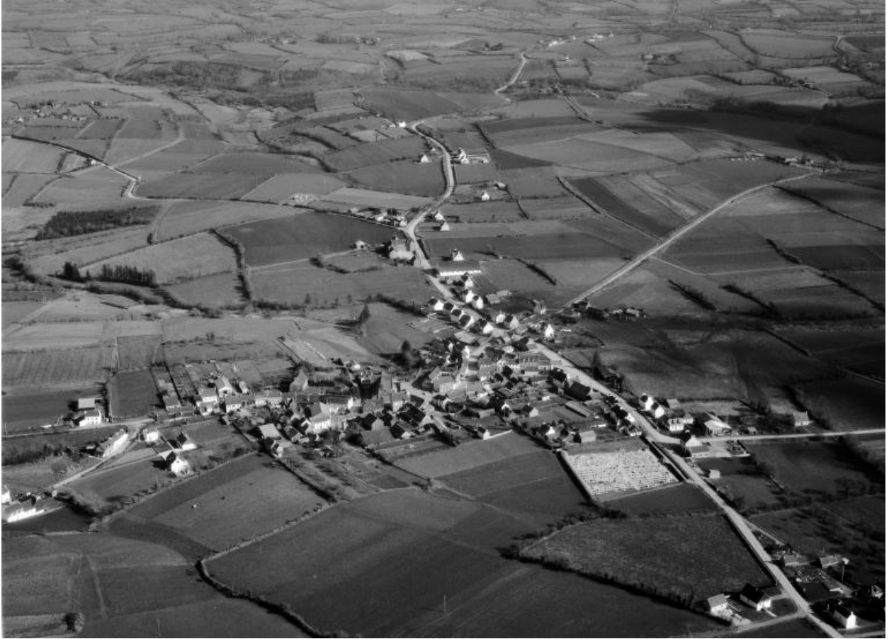
Vue aérienne ouest