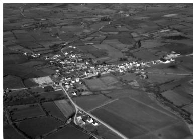
Vue aérienne sud IVR53_19732900046V