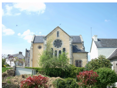
Elévation est, état en 2008. IVR53_20082905831NUCA