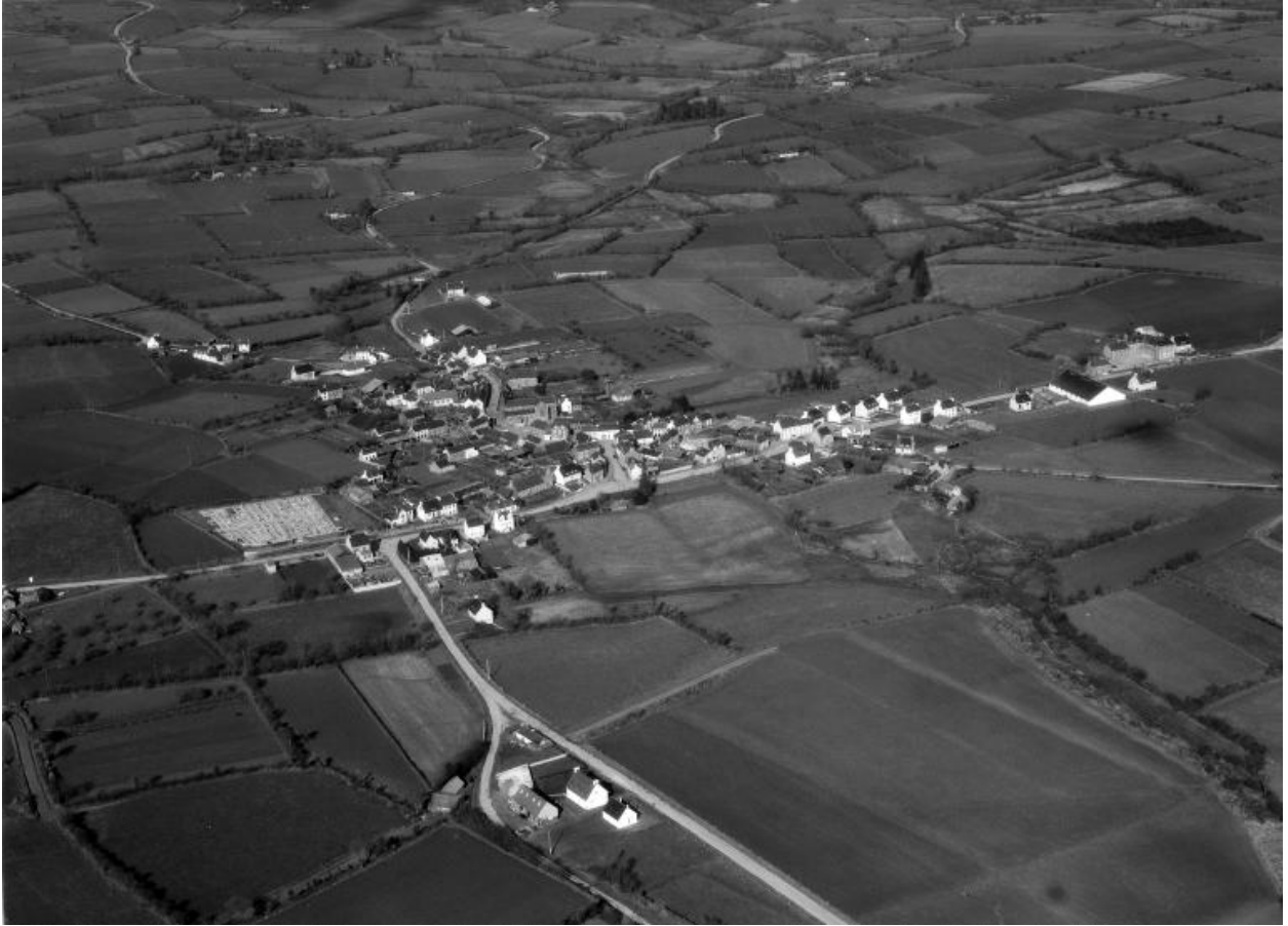
Vue aérienne sud