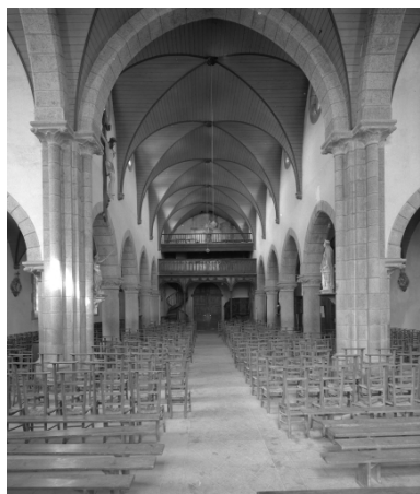
Vue générale intérieure d'est en ouest IVR53_19672900191V