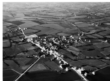
Vue aérienne est IVR53_19732900047V