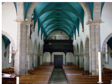
Vue axiale ouest. IVR53_20082905834NUCA