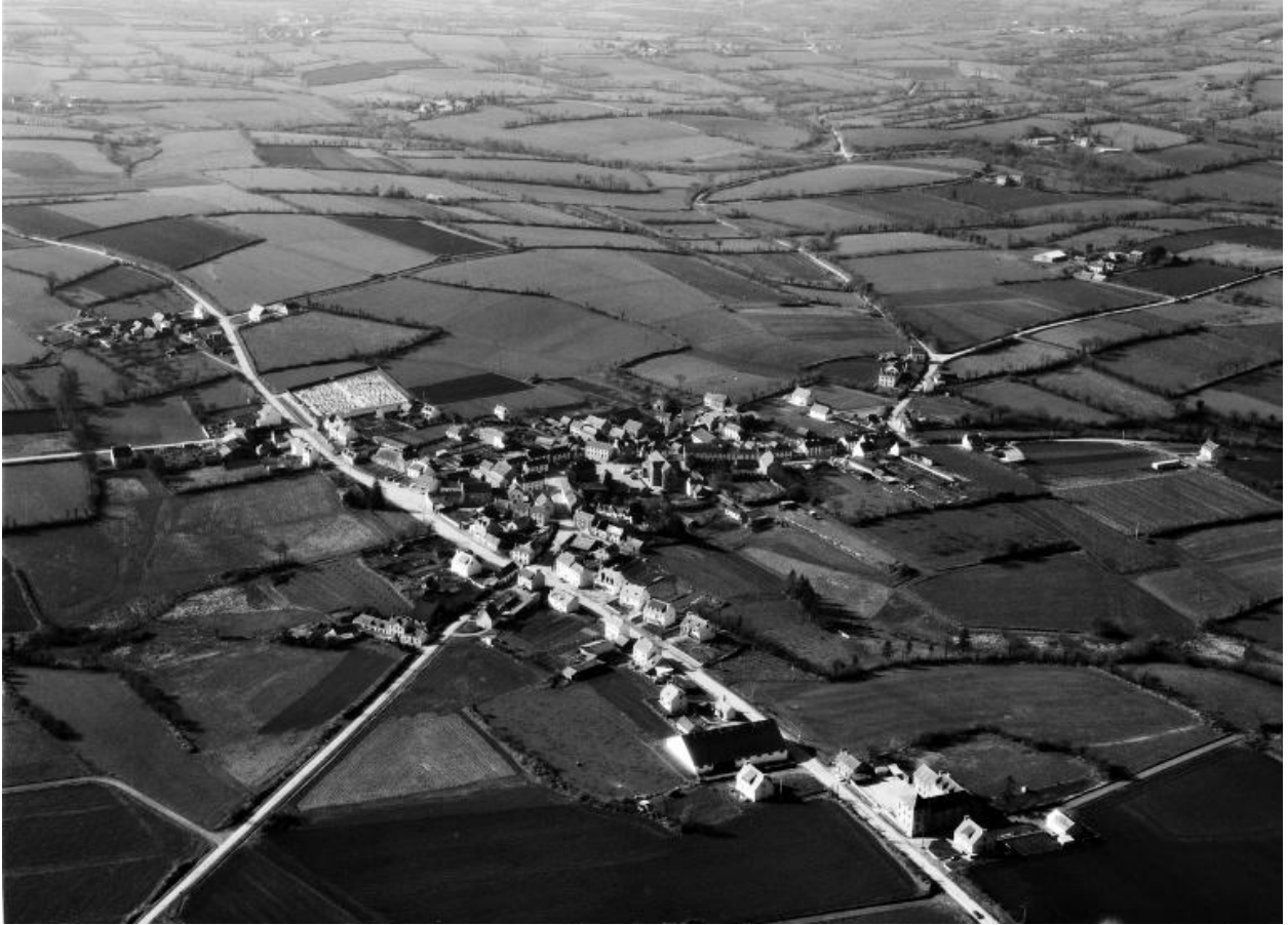
Vue aérienne est