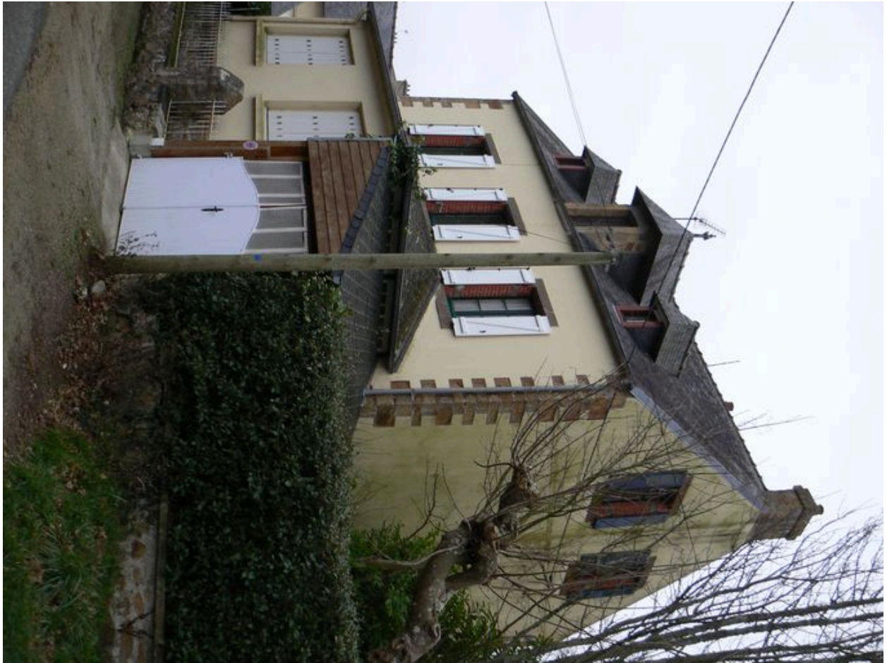
Vue de trois-quarts de la villa Les Ormes