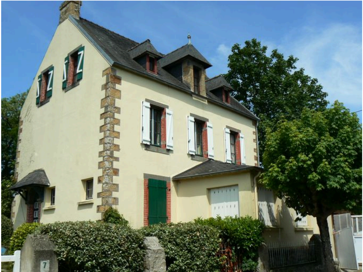
Vue générale de la villa Les Ormes