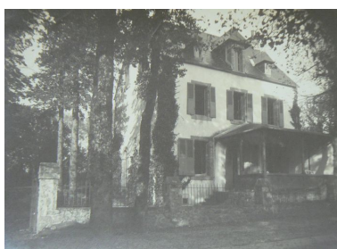
Vue ancienne de la villa Les Ormes IVR53_20072908644NUC