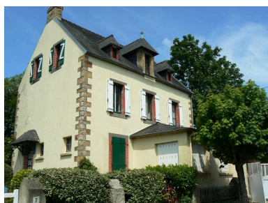
Vue générale de la villa Les Ormes