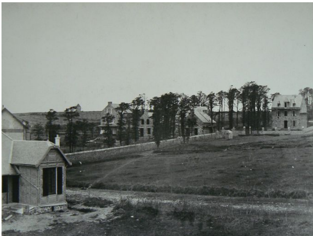
Vue ancienne de villas dont Les Ormes