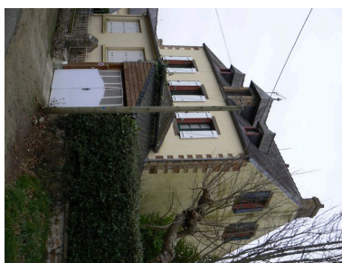
Vue de trois-quarts de la villa Les Ormes