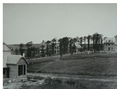
Vue ancienne de villas dont Les Ormes IVR53_20072908826NUC