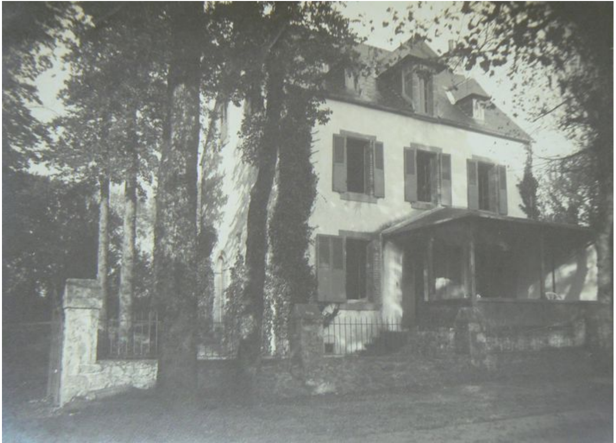
Vue ancienne de la villa Les Ormes