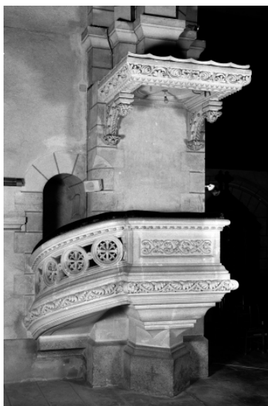
Chaire à prêcher, vue générale. IVR53_19923500754V