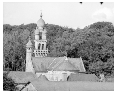
Elévation Sud : vue générale IVR53_19923500721X