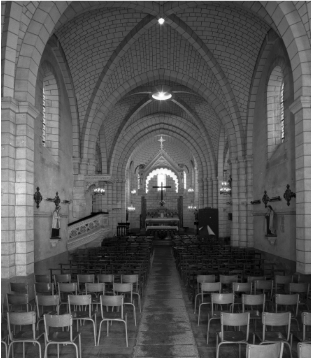
Intérieur : vue générale vers le chœur.