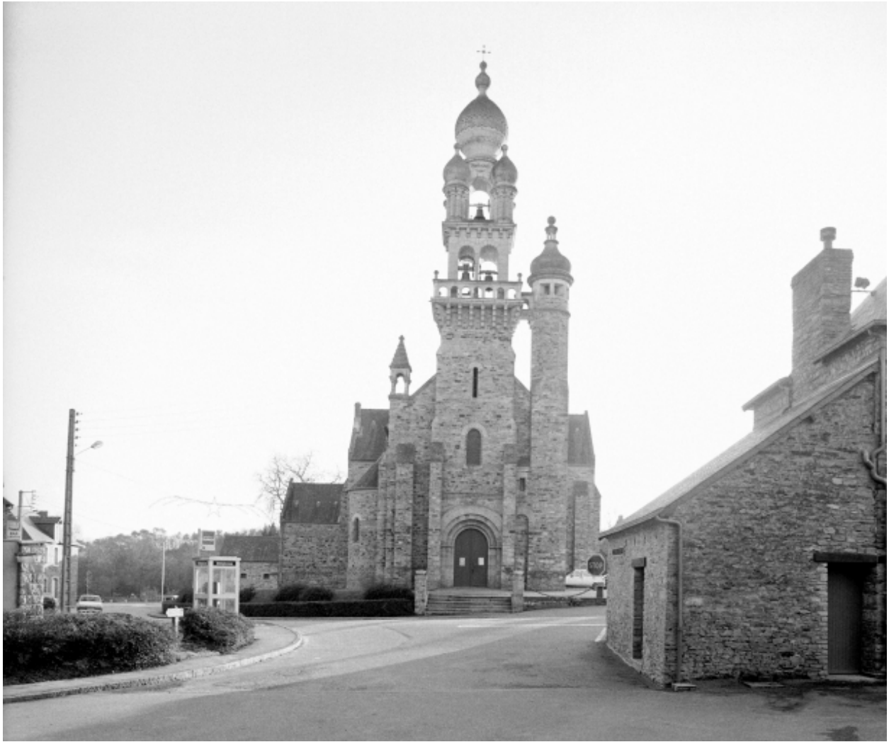
Elévation Nord : vue générale