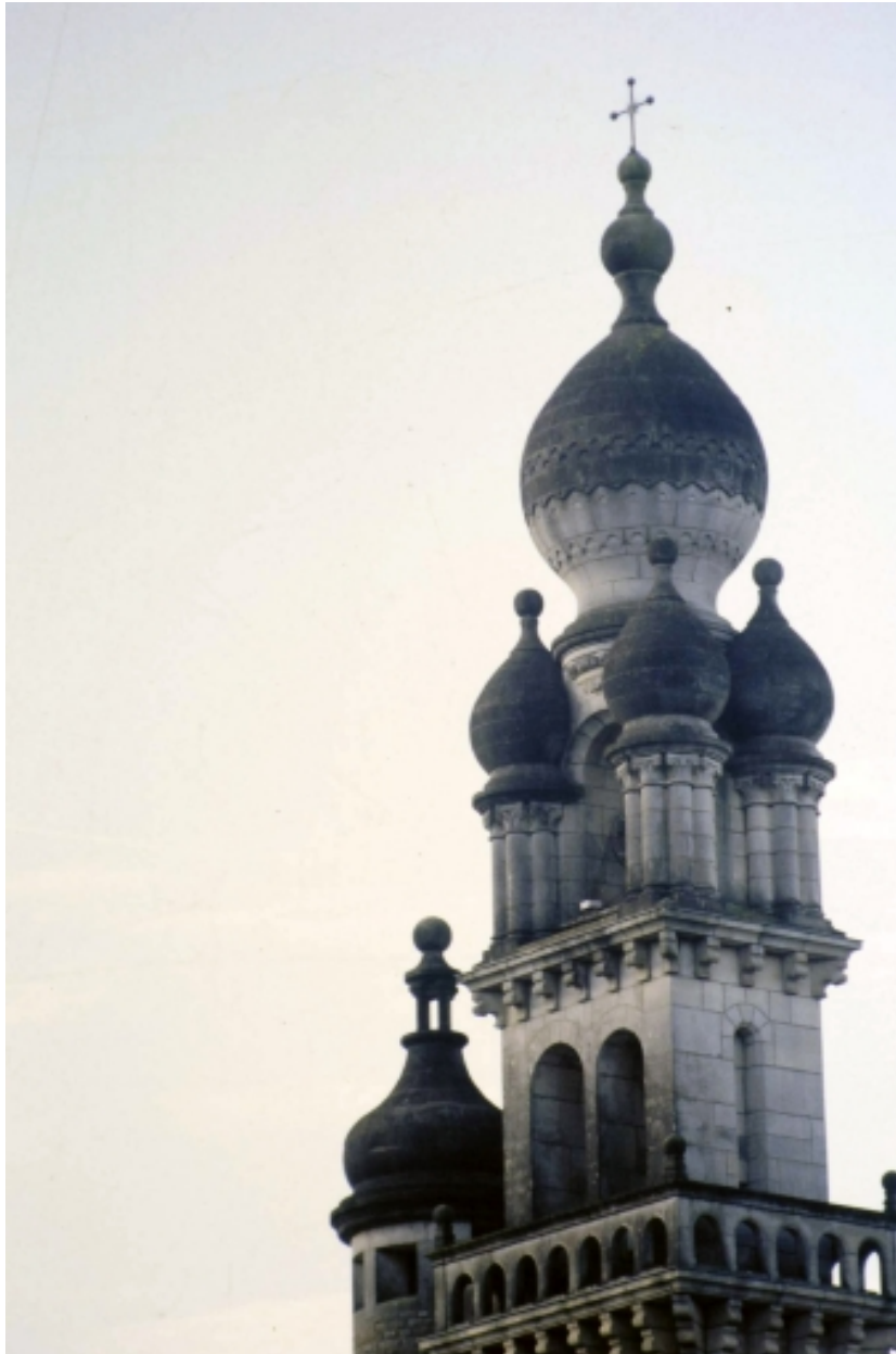
Clocher à bulbes : détail.