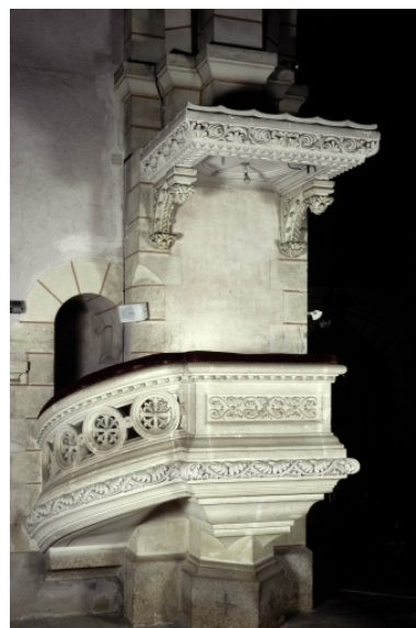
Chaire à prêcher : vue générale. IVR53_19923500698VA