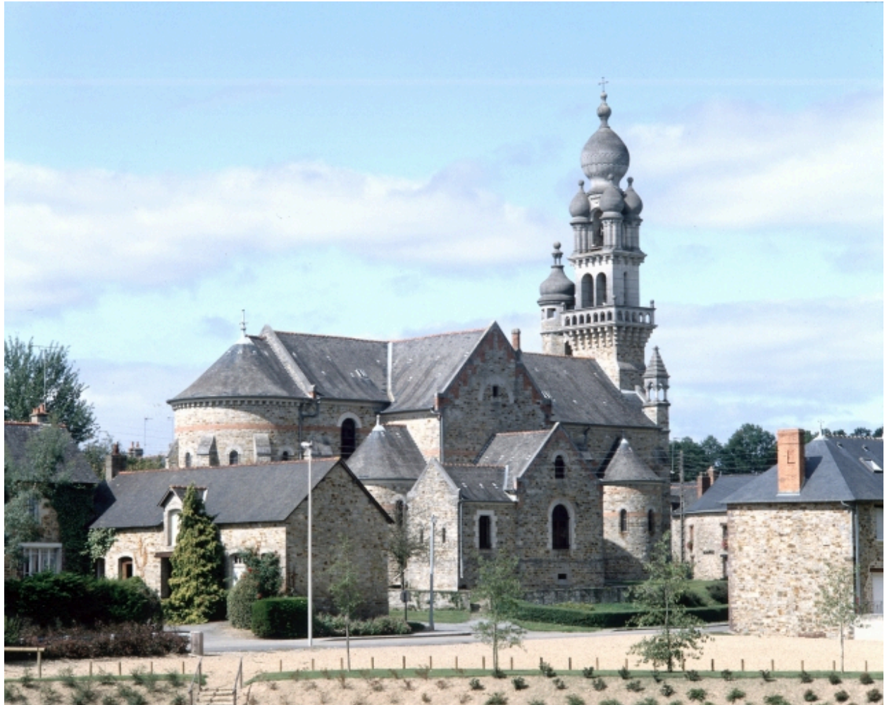
Elévation Sud-Est : vue générale