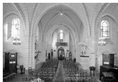
Intérieur, nef : vue générale.