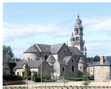
Elévation Sud-Est : vue générale IVR53_19923500722XA