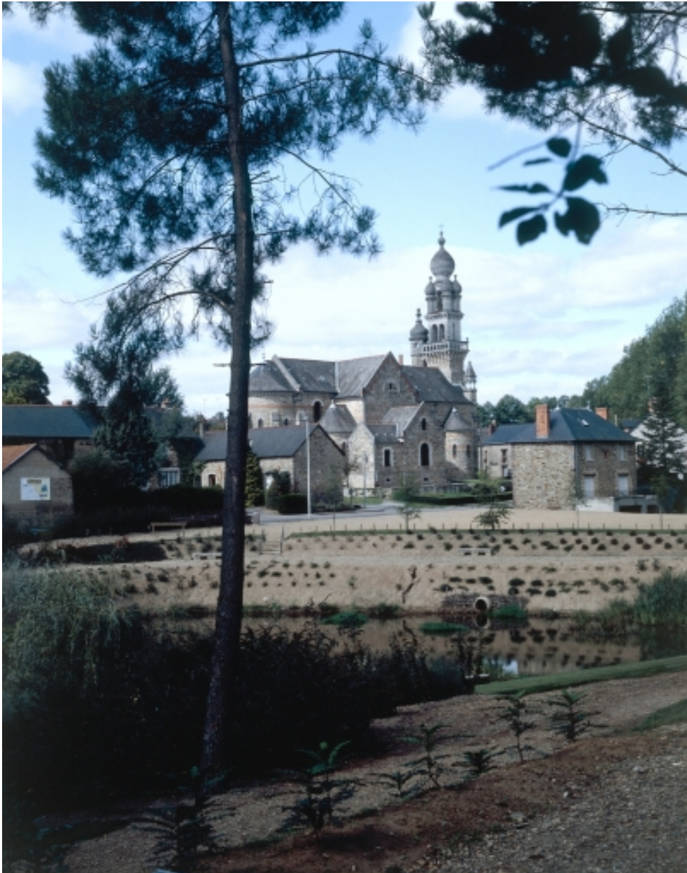
Elévation Ouest : vue générale