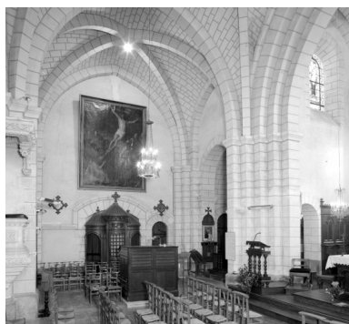
Elévation Sud-Ouest : vue générale IVR53_19943500151X