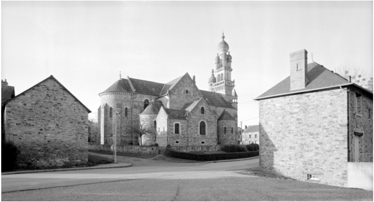
Elévation Sud-Ouest : vue générale