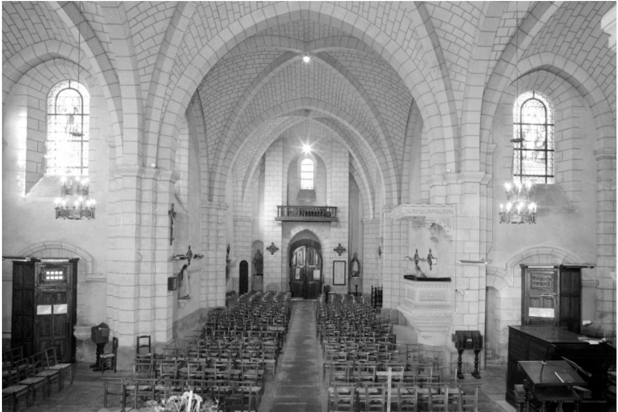
Intérieur, nef : vue générale.