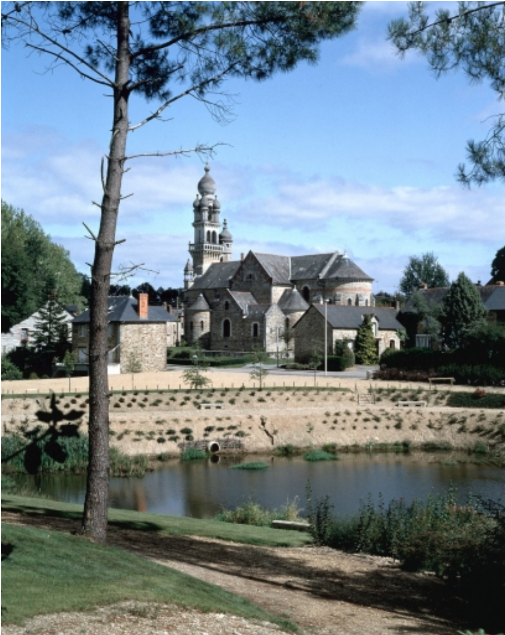
Elévation Sud-Est : vue générale