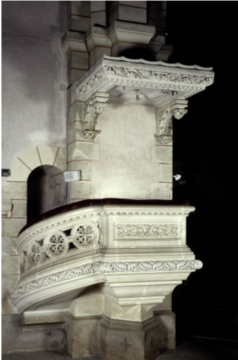
Chaire à prêcher : vue générale.