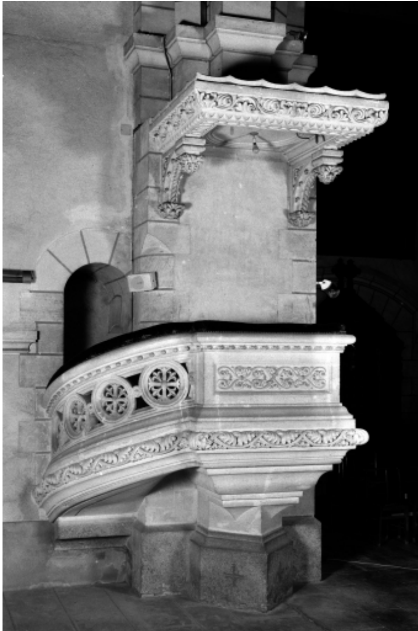
Chaire à prêcher, vue générale.