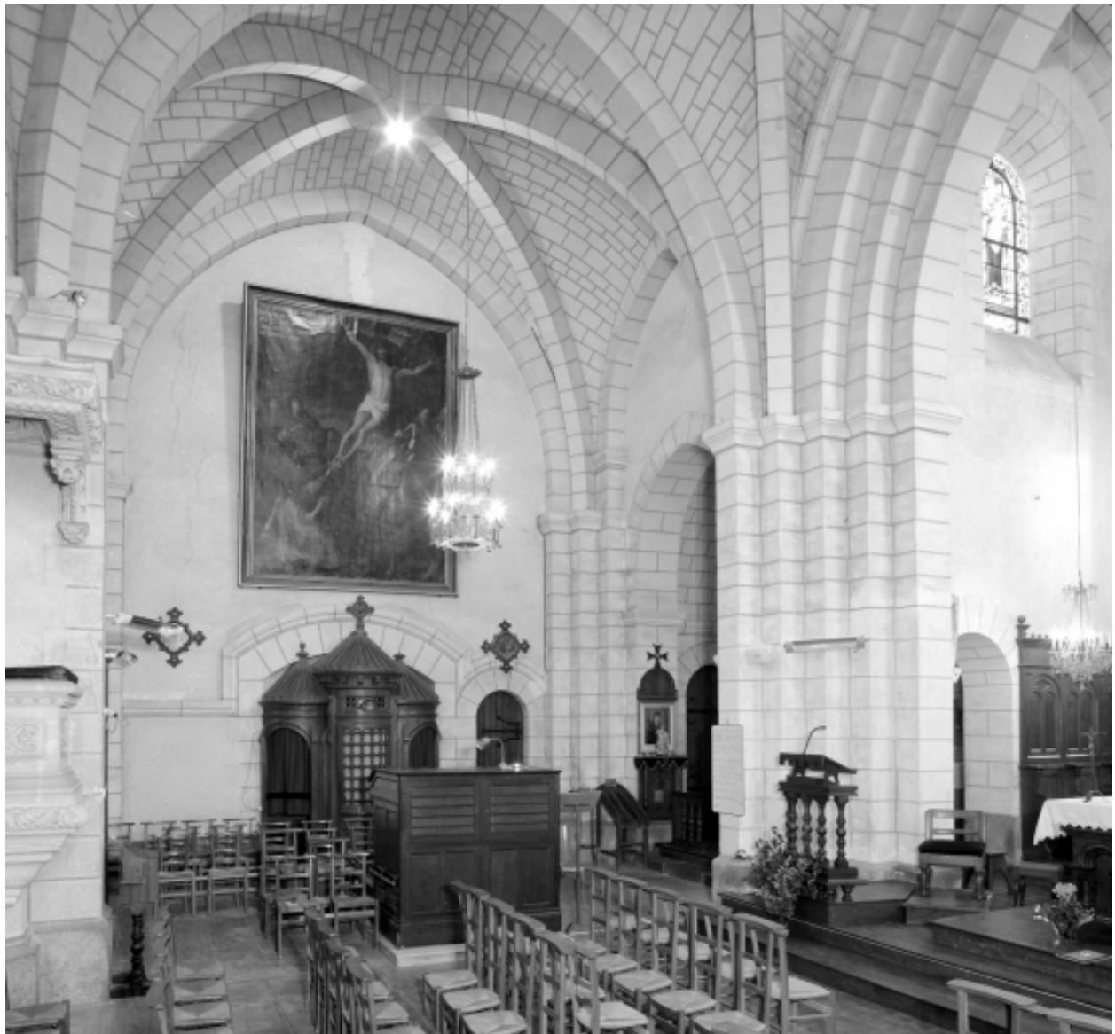
Elévation Sud-Ouest : vue générale