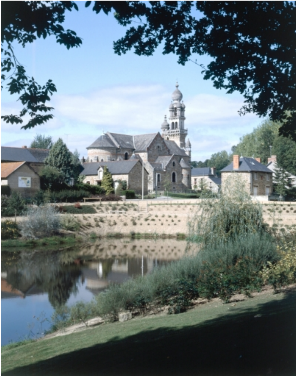
Elévation Sud-Est : vue générale