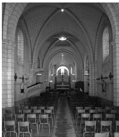
Intérieur : vue générale vers le choeur. IVR53_19943500152X