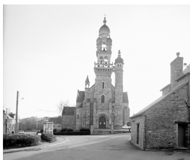
Elévation Nord : vue générale IVR53_19943500155X