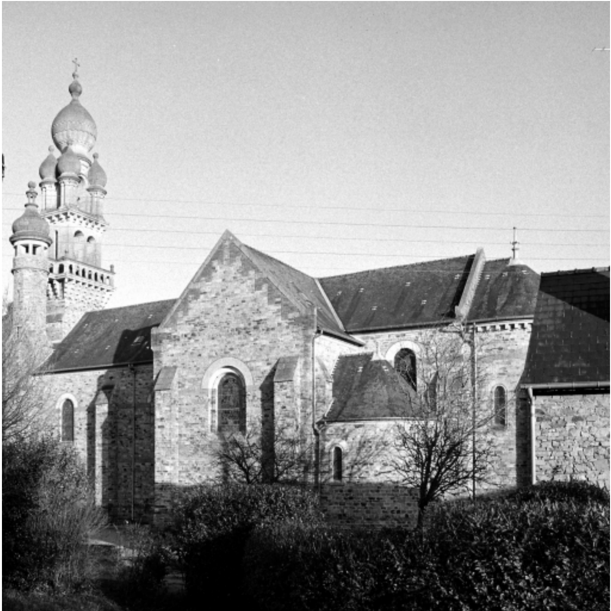
Elévation Ouest : vue générale