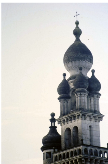
Clocher à bulbes : détail.