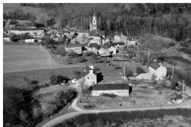
Vue aérienne vers l'ouest. IVR53_19713500492V