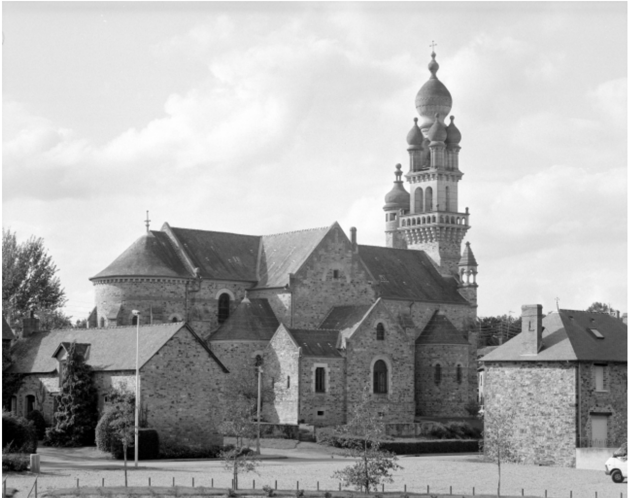
Elévation Sud-Est : vue générale