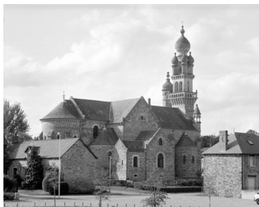
Elévation Sud-Est : vue générale IVR53_19923500720X