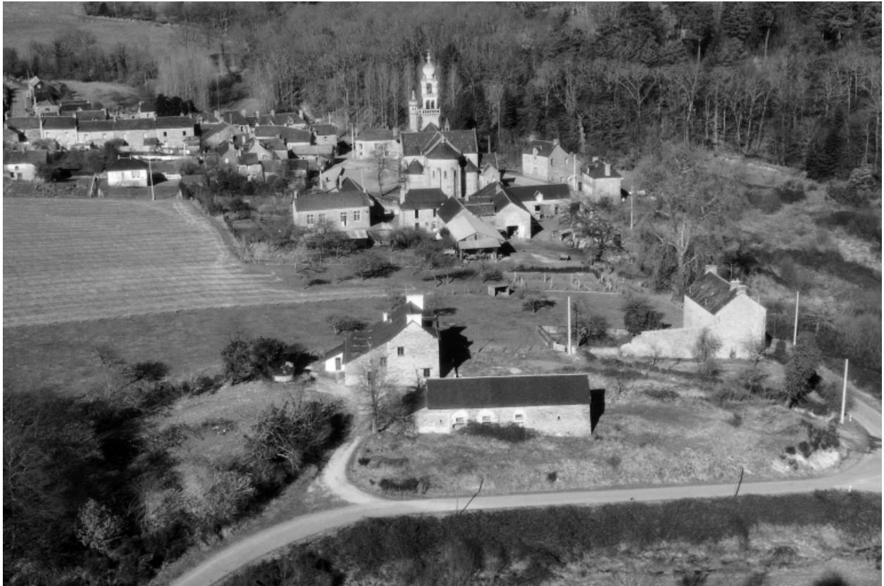
Vue aérienne vers l'ouest.