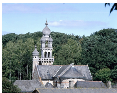
Elévation Sud : vue générale, IVR53_19923500723XA