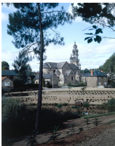
Elévation Ouest : vue générale IVR53_19953500007XA