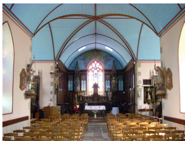
Tréglonou, église paroissiale : vue axiale est IVR53_20082906142NUCA