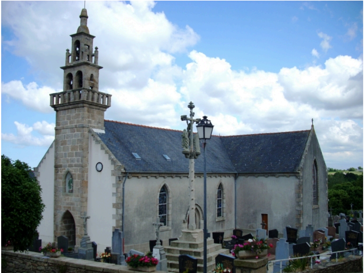
Tréglonou, église paroissiale : vue générale sud-ouest