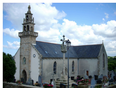
Tréglonou, église paroissiale : vue générale sud-ouest