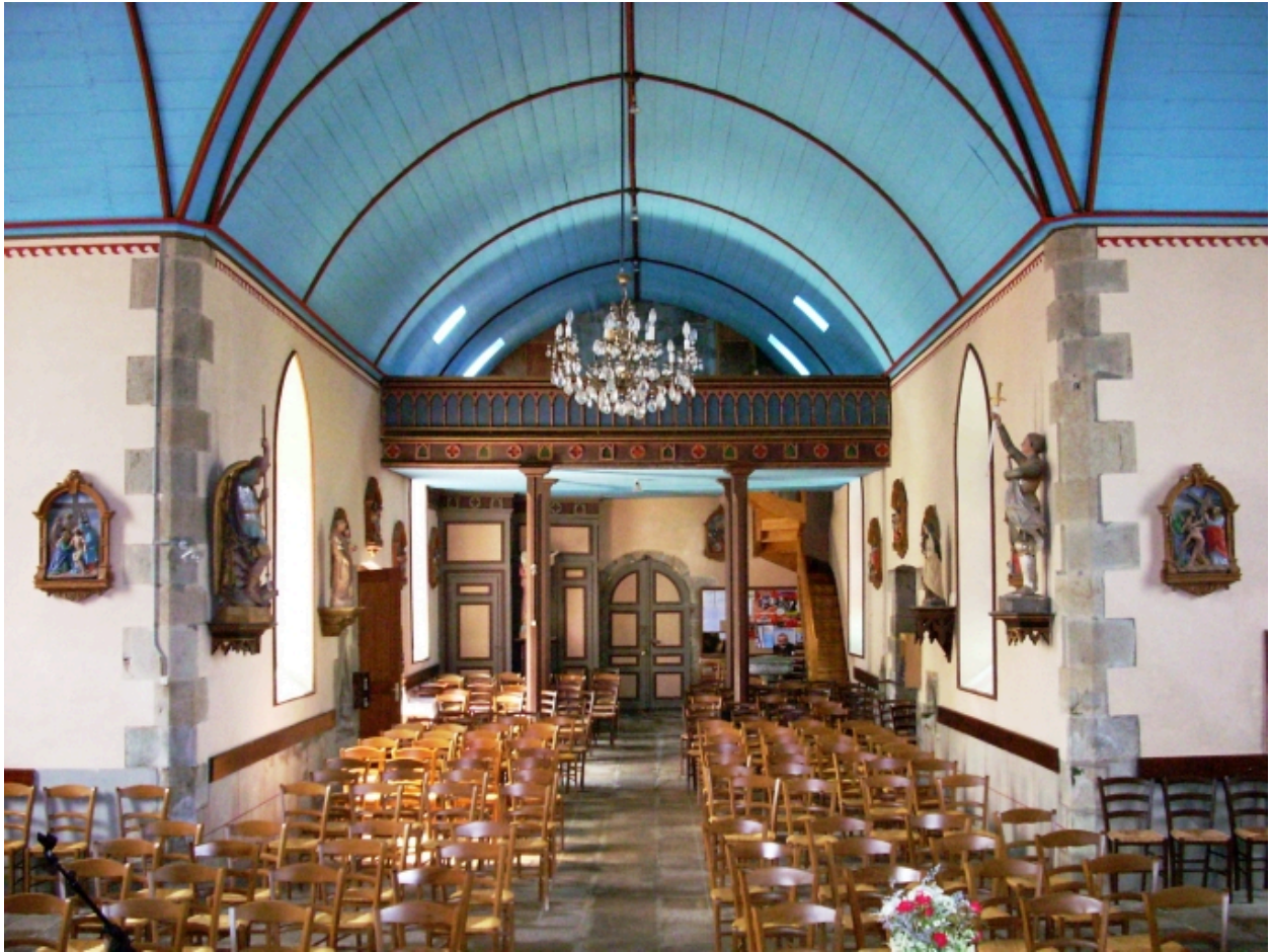
Tréglonou, église paroissiale : vue axiale ouest