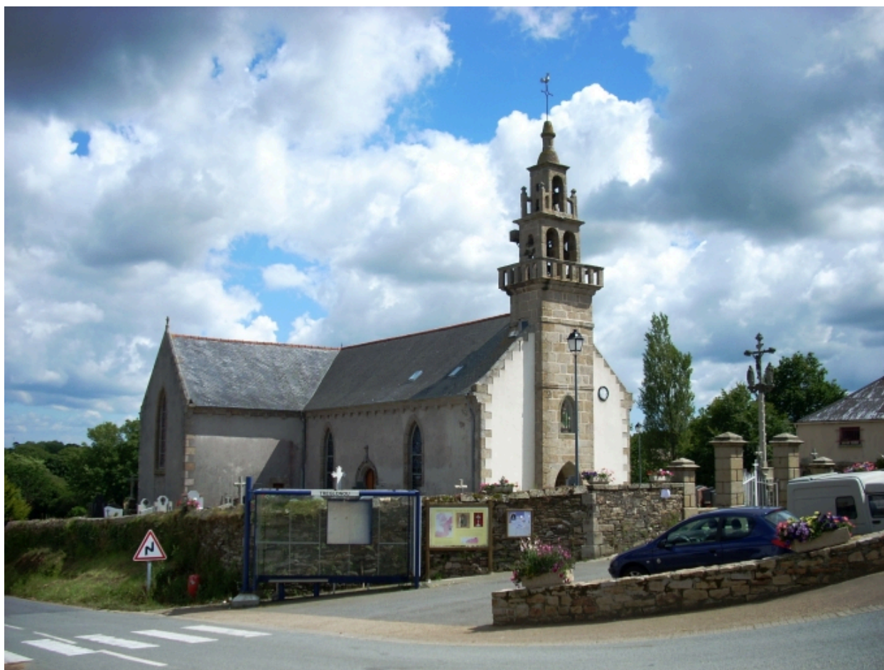
Tréglonou, église paroissiale : vue générale nord-ouest