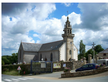
Tréglonou, église paroissiale : vue générale nord-ouest IVR53_20082906139NUCA