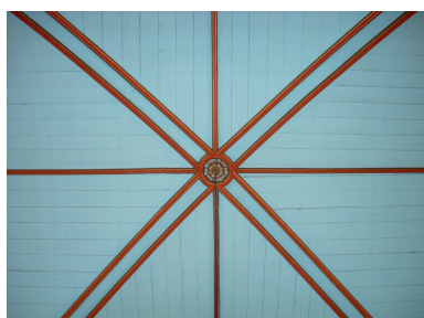
Tréglonou, église paroissiale : détail du lambris à la croisée du transept IVR53_20082906144NUCA