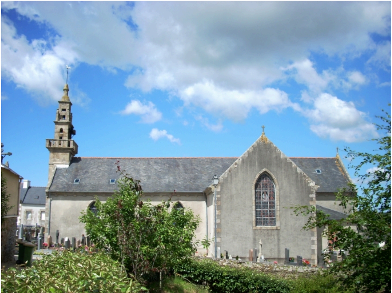
Tréglonou, église paroissiale : élévation sud