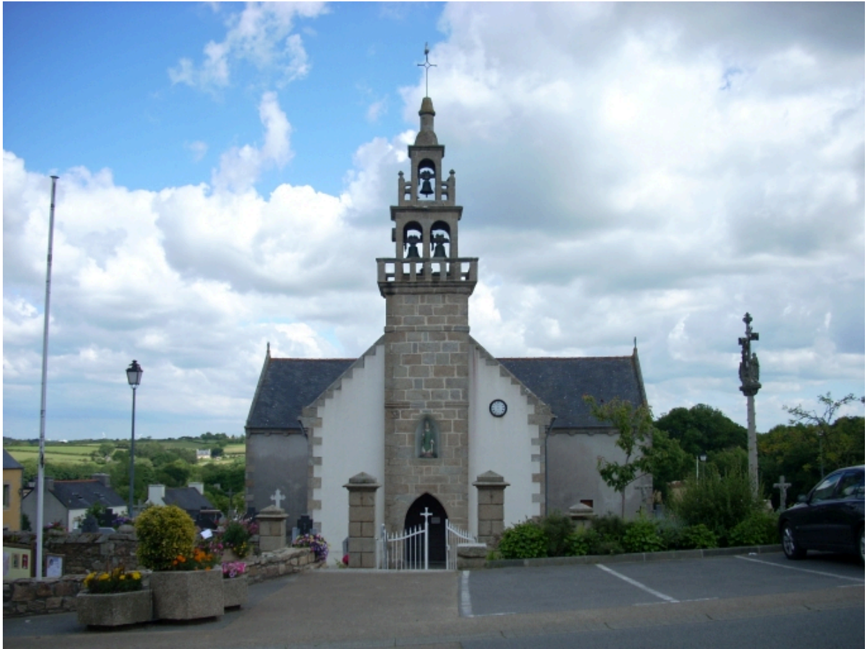
Tréglonou, église paroissiale : élévation ouest