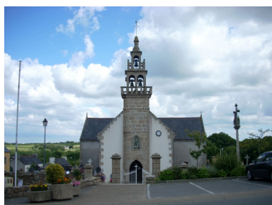
Tréglonou, église paroissiale : élévation ouest