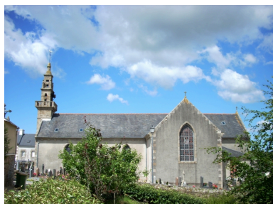
Tréglonou, église paroissiale : élévation sud IVR53_20082906141NUCA