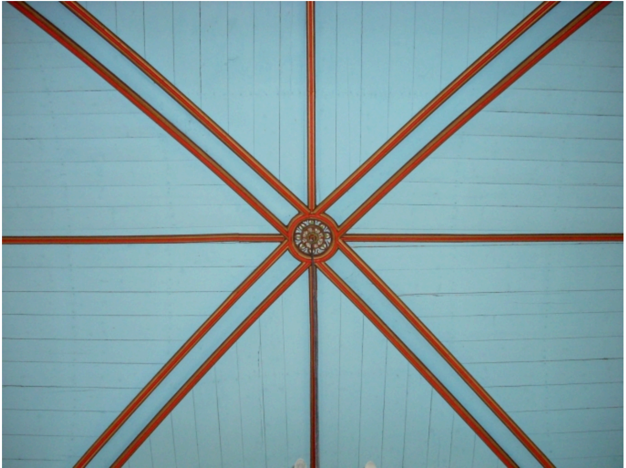
Tréglonou, église paroissiale : détail du lambris à la croisée du transept