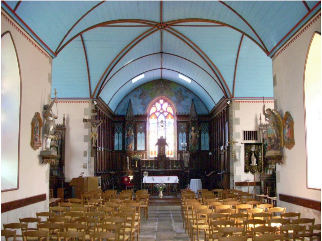
Tréglonou, église paroissiale : vue axiale est