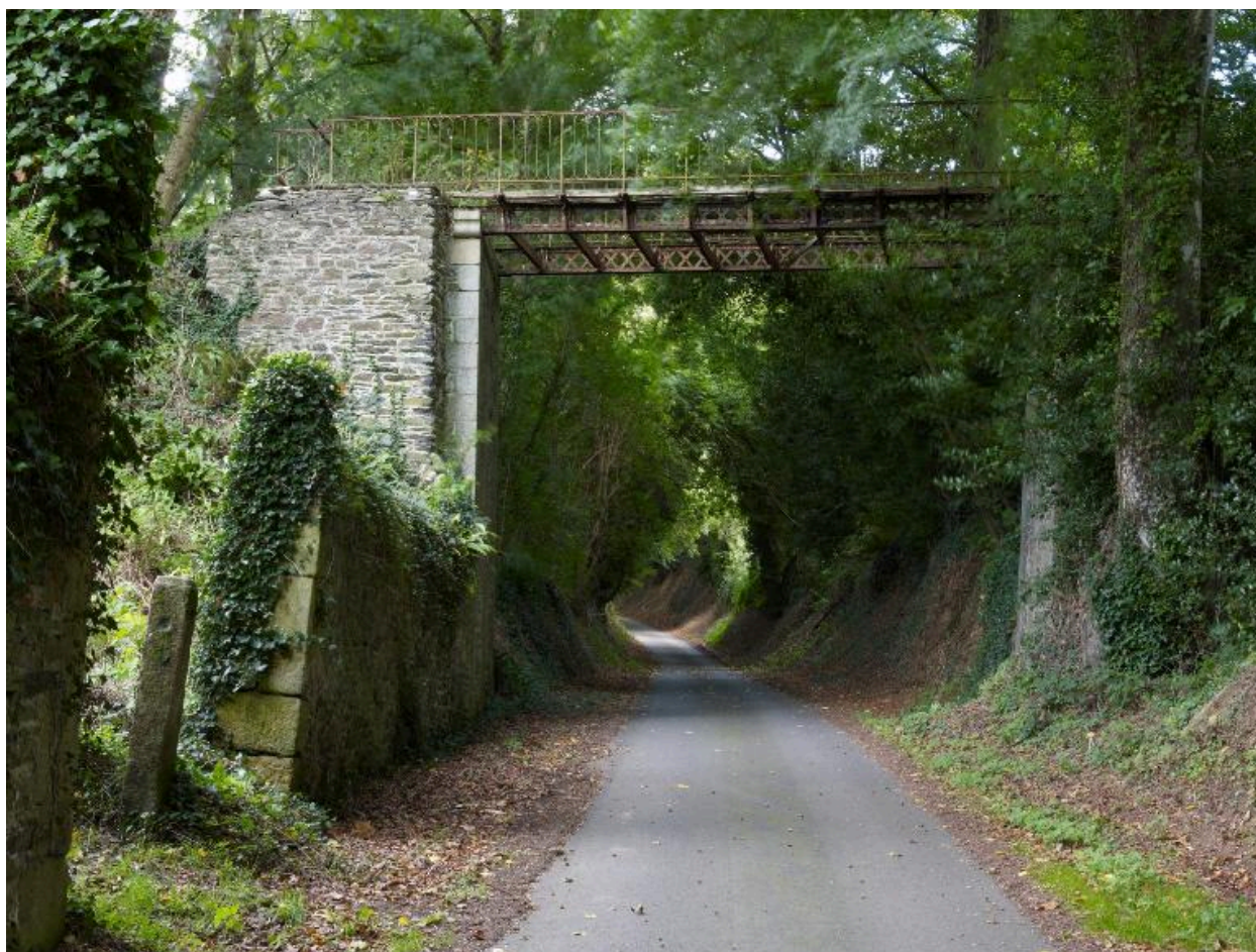
Passerelle métallique. Vue générale