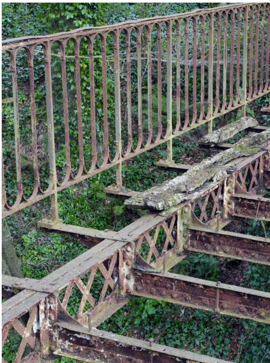
Passerelle métallique. Détail du parapet fixé à la poutre en treillis