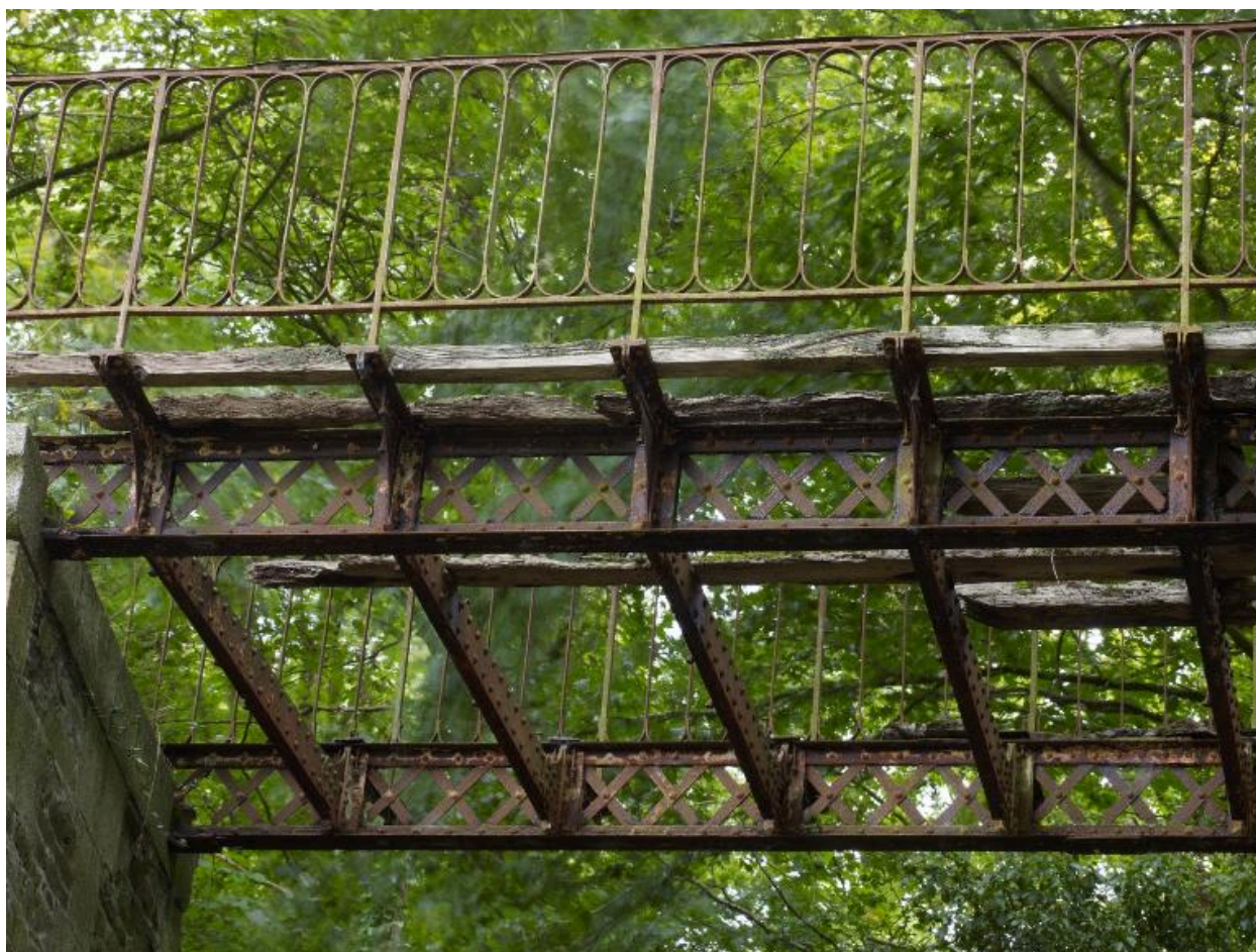
Passerelle métallique. Tablier vu du dessous : poutrelles rivetées fixées sur les poutres en treillis