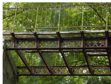
Passerelle métallique. Tablier vu du dessous : poutres rivetées fixées sur les poutres en treillis IVR53_20142201528NUCA