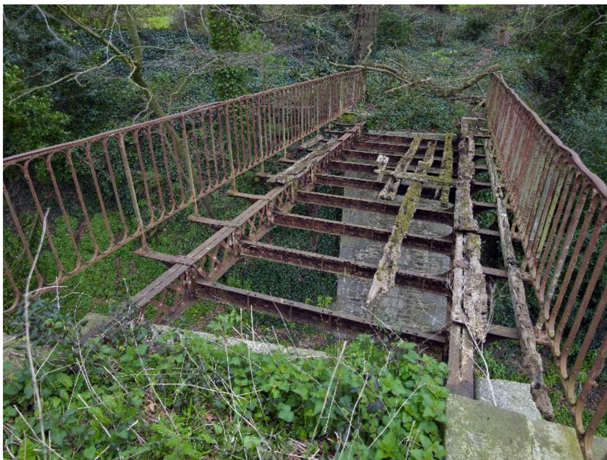
Passerelle métallique. Vue générale du tablier