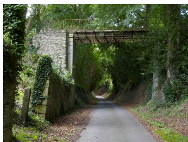
Passerelle métallique. Vue générale IVR53_20142201529NUCA