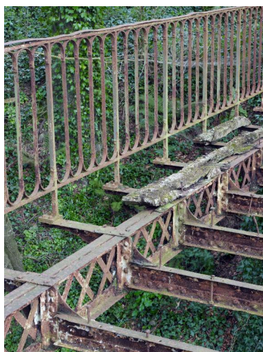
Passerelle métallique. Détail du parapet fixé à la poutre en treillis IVR53_20152200432NUCA