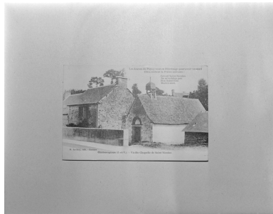
Carte postale ancienne - Châteaugiron (I.-et-V.) - Vieille chapelle de Saint Nicolas.