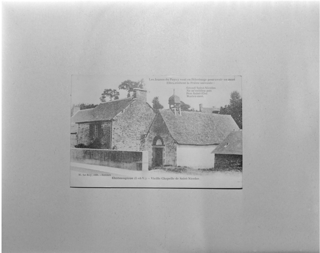
Carte postale ancienne - Châteaugiron (I.-et-V.) - Vieille chapelle de Saint Nicolas.