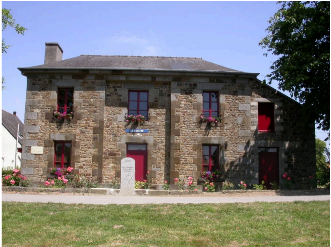
Vue générale sud en 2005