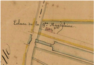
Extrait du cadastre de la commune de Bazouges-sous-Hédé, 1835 IVR53_20173506278NUCA