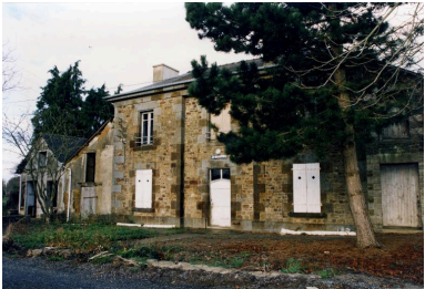
La maison éclésièrre de La Madeleine en 1995 IVR53_20173506275PA