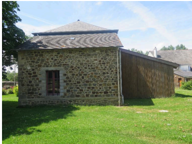
Vue Est de la maison Madeleine IVR53_20173506221NUCA