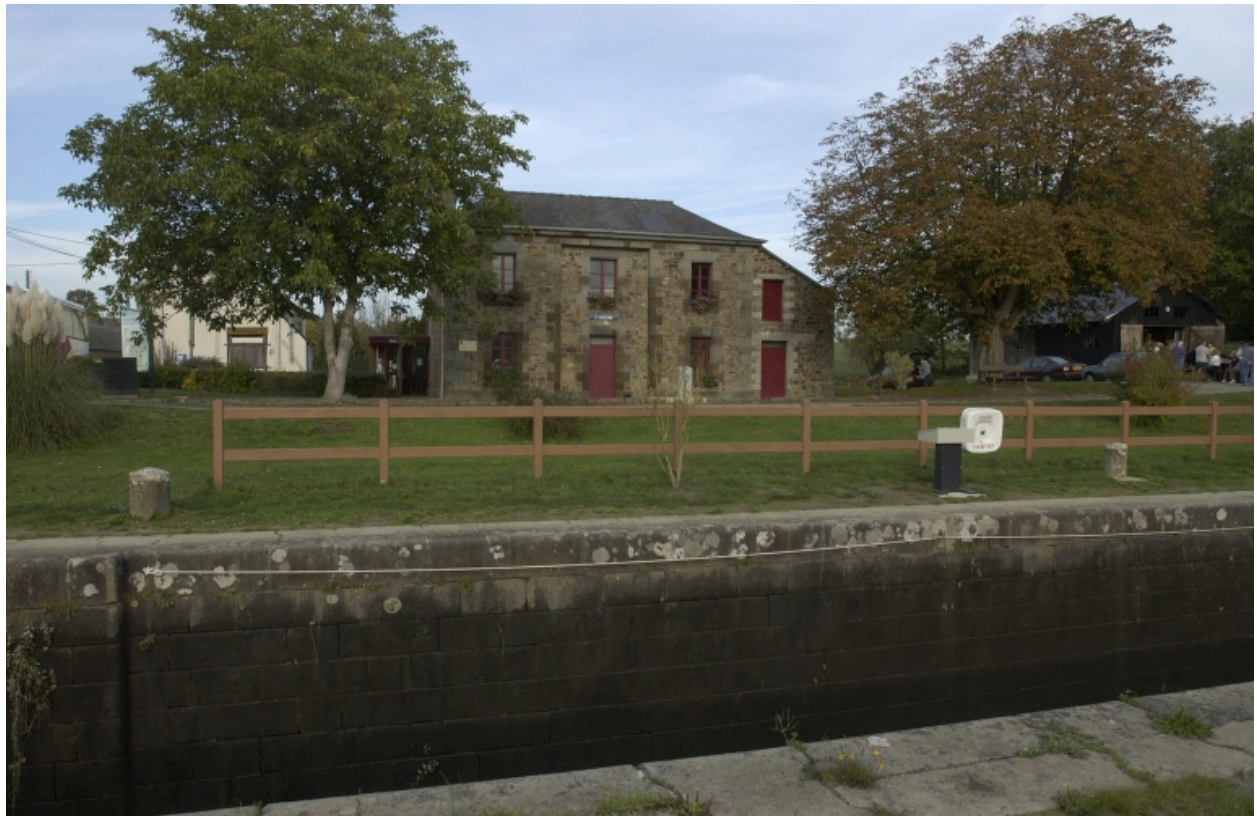
Vue sud en 2005