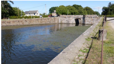
Vue sud ouest IVR53_20243531589NUCA