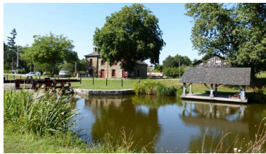
Vue d#ensemble depuis le sud IVR53_20243531588NUCA