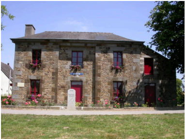
Vue générale sud en 2005 IVR53_20053519016NUCA