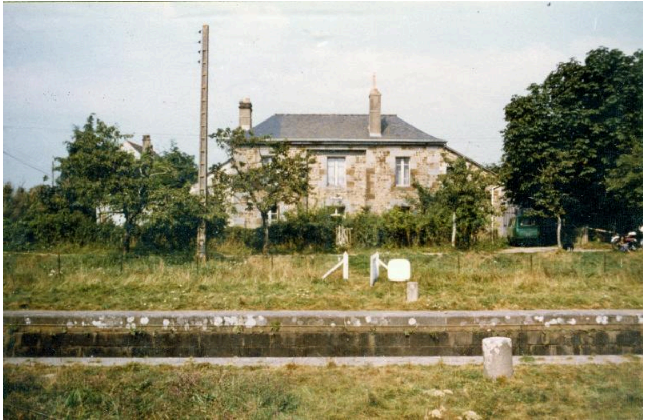
La maison éclusière de La Madeleine en 1981