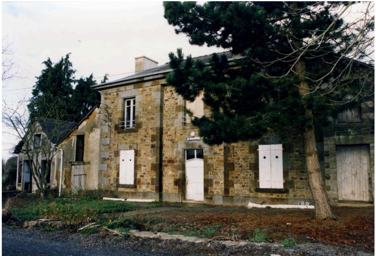
La maison éclésièrre de La Madeleine en 1995