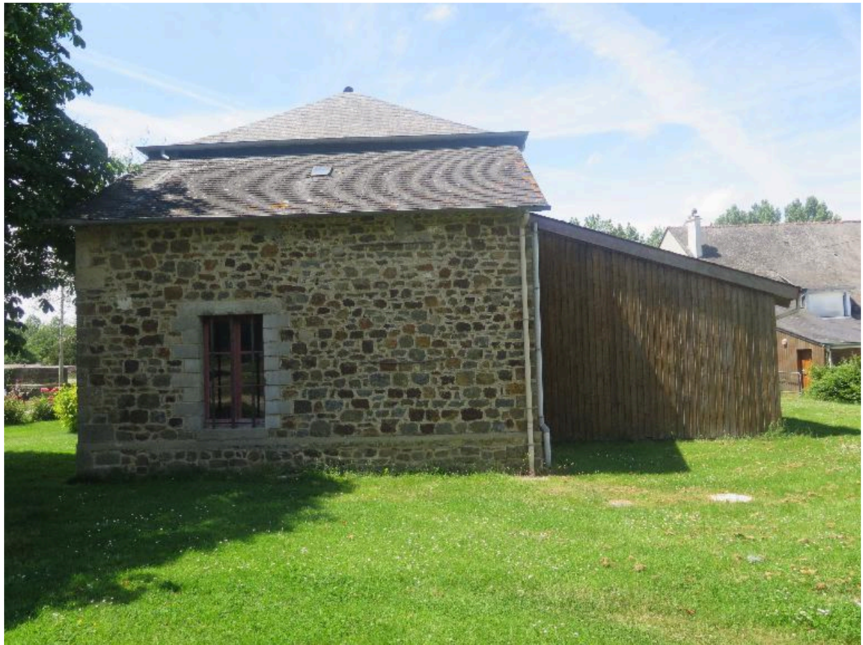
Vue Est de la maison Madeleine