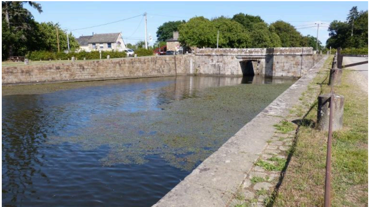
Vue sud ouest