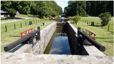
Vue vers l'est IVR53_20243531590NUCA