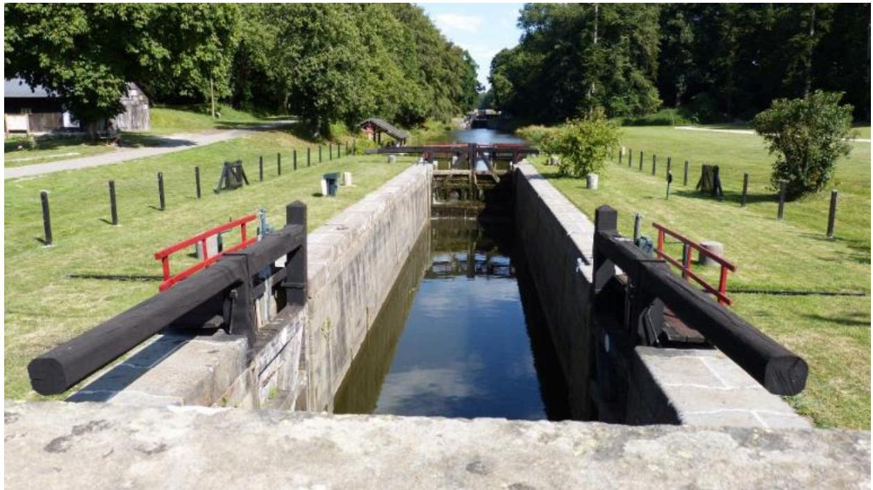
Vue vers l'est