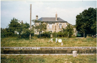
La maison éclésièrre de La Madeleine en 1981 IVR53_20173506276PA