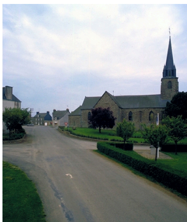
Vue de situation nord IVR53_19993500802XA