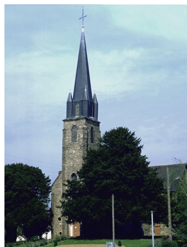
Le clocher : vue générale ouest, IVR53_19993500864XA