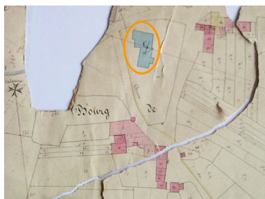
L'ancienne église sur le cadastre napoléonien (cerclée d'un trait orange)