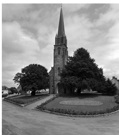
Vue de situation sud-ouest IVR53_19943501050X