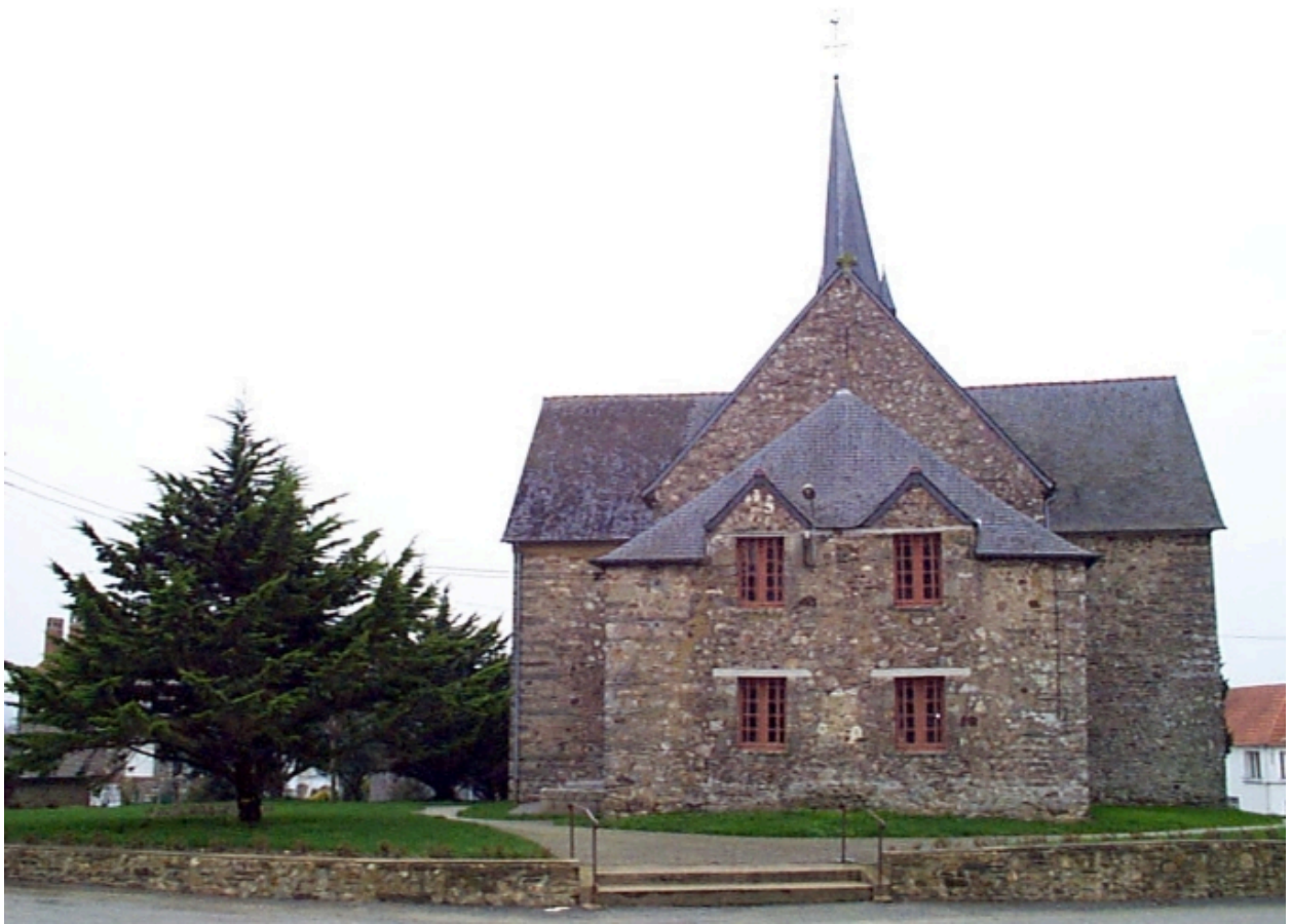
Le chevet et la sacristie : vue générale est