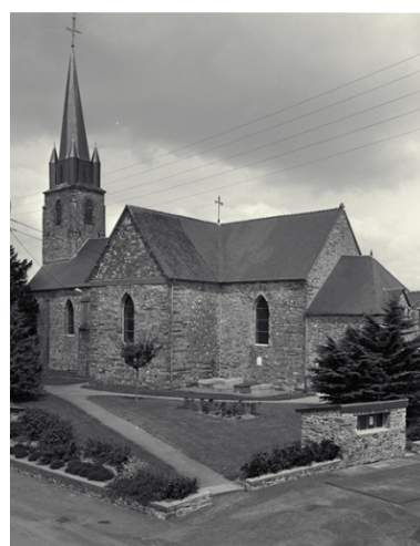
Vue générale sud-est IVR53_19943501040X