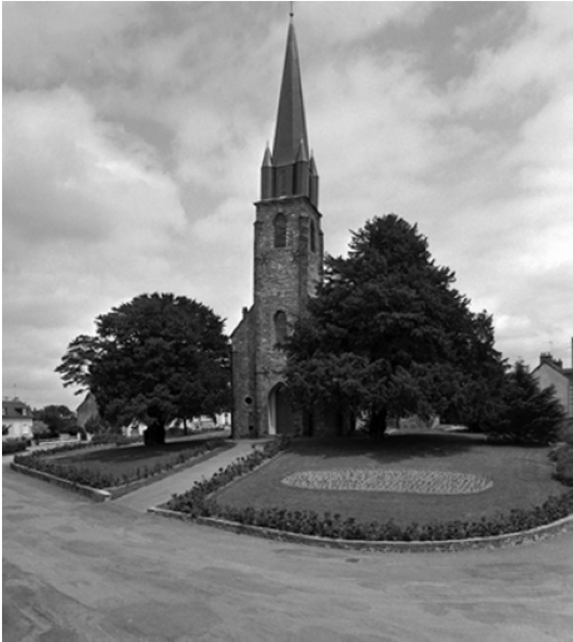
Vue de situation sud-ouest