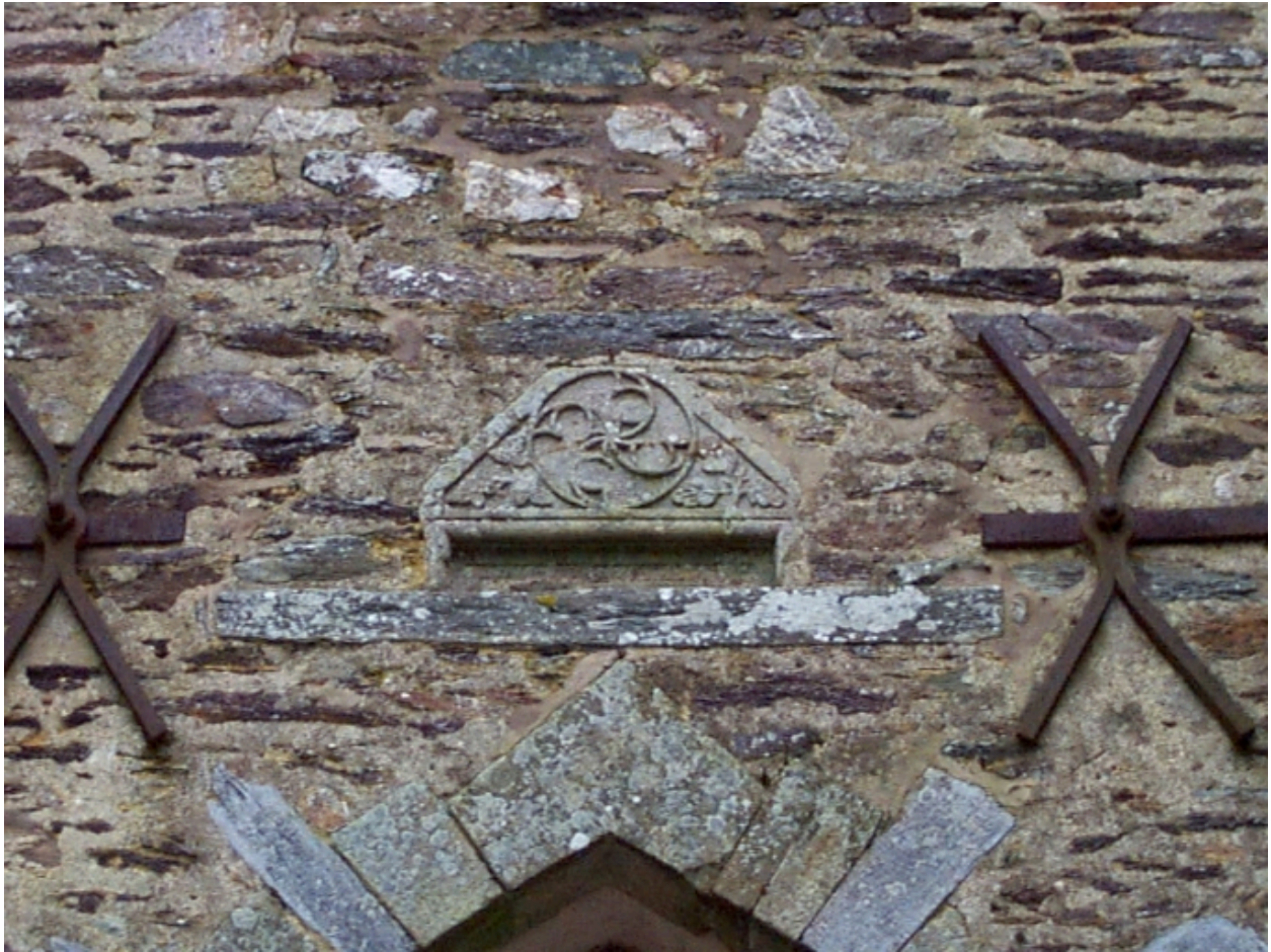
Pierre de rempli au dessus du portail : détail