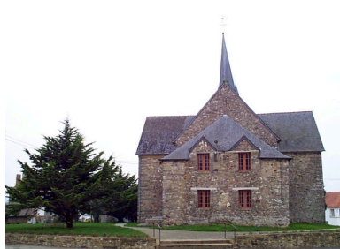
Le chevet et la sacristie : vue générale est IVR53_19993504150NUCA