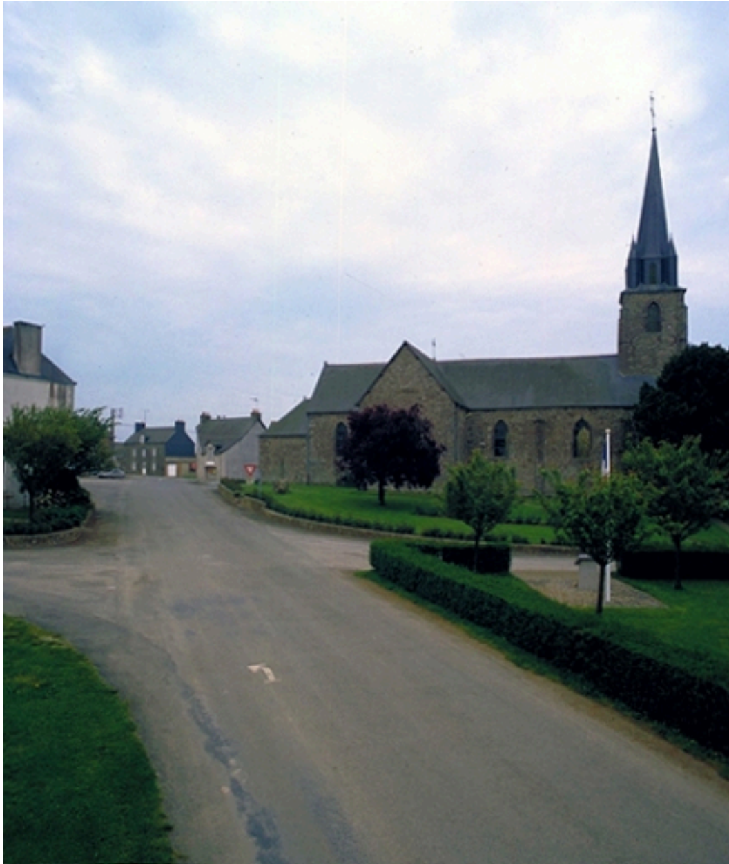
Vue de situation nord