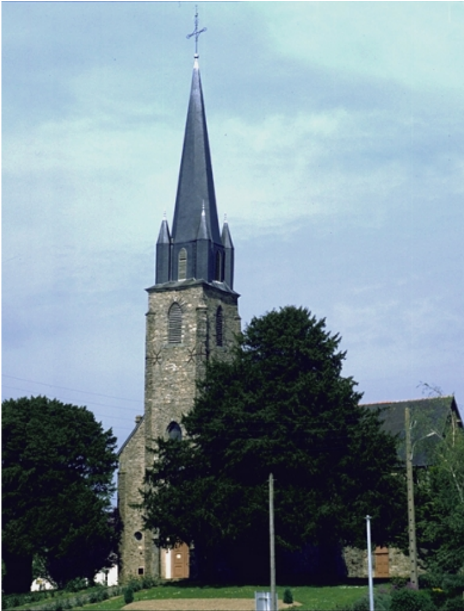
Le clocher : vue générale ouest