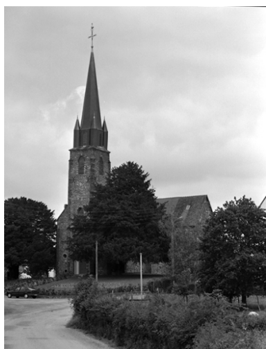
Le clocher : vue générale ouest IVR53_19943501051X