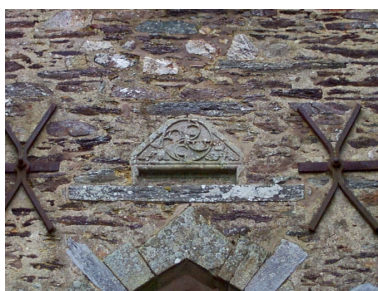
Pierre de remploi au dessus du portail : détail IVR53_19993504149NUCA