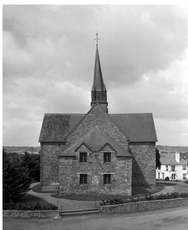
Le chevet et la sacristie : vue générale est IVR53_19943501038X