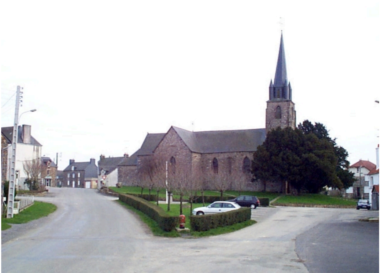
Vue de situation nord