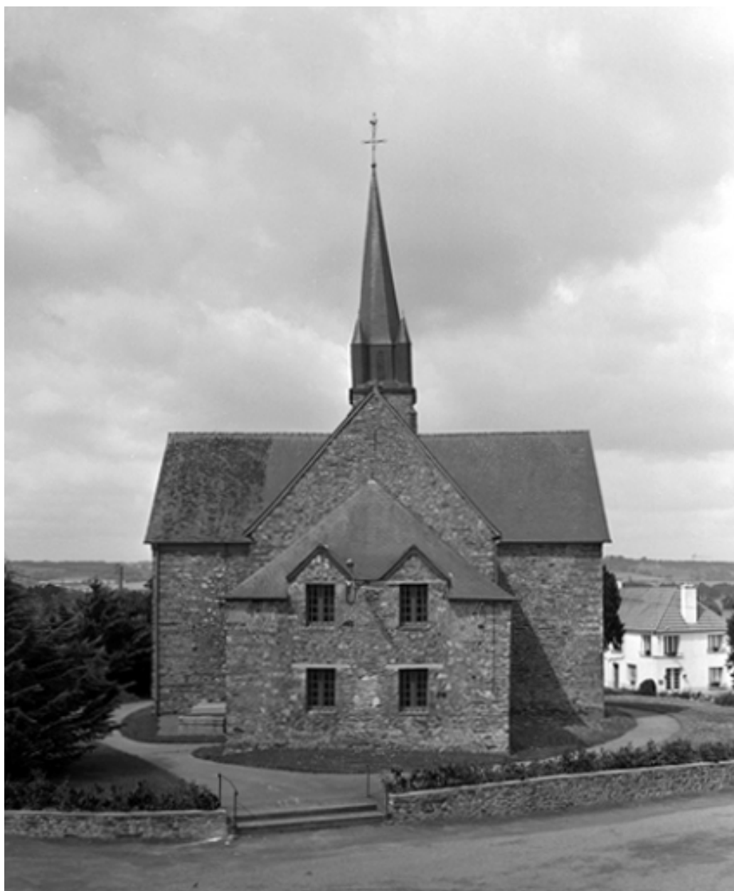
Le chevet et la sacristie : vue générale est