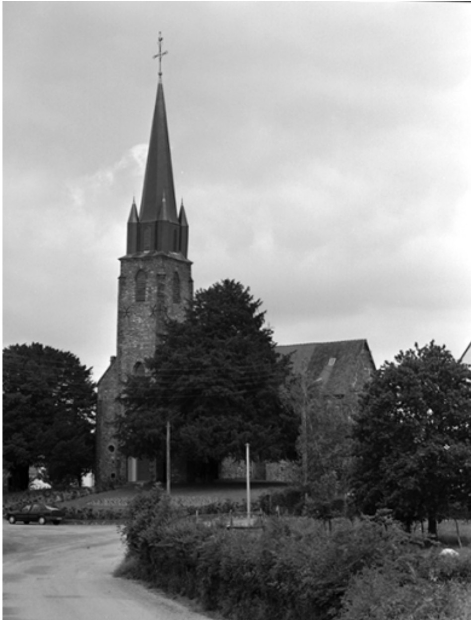
Le clocher : vue générale ouest