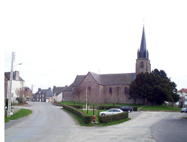
Vue de situation nord IVR53_19993504377NUCA