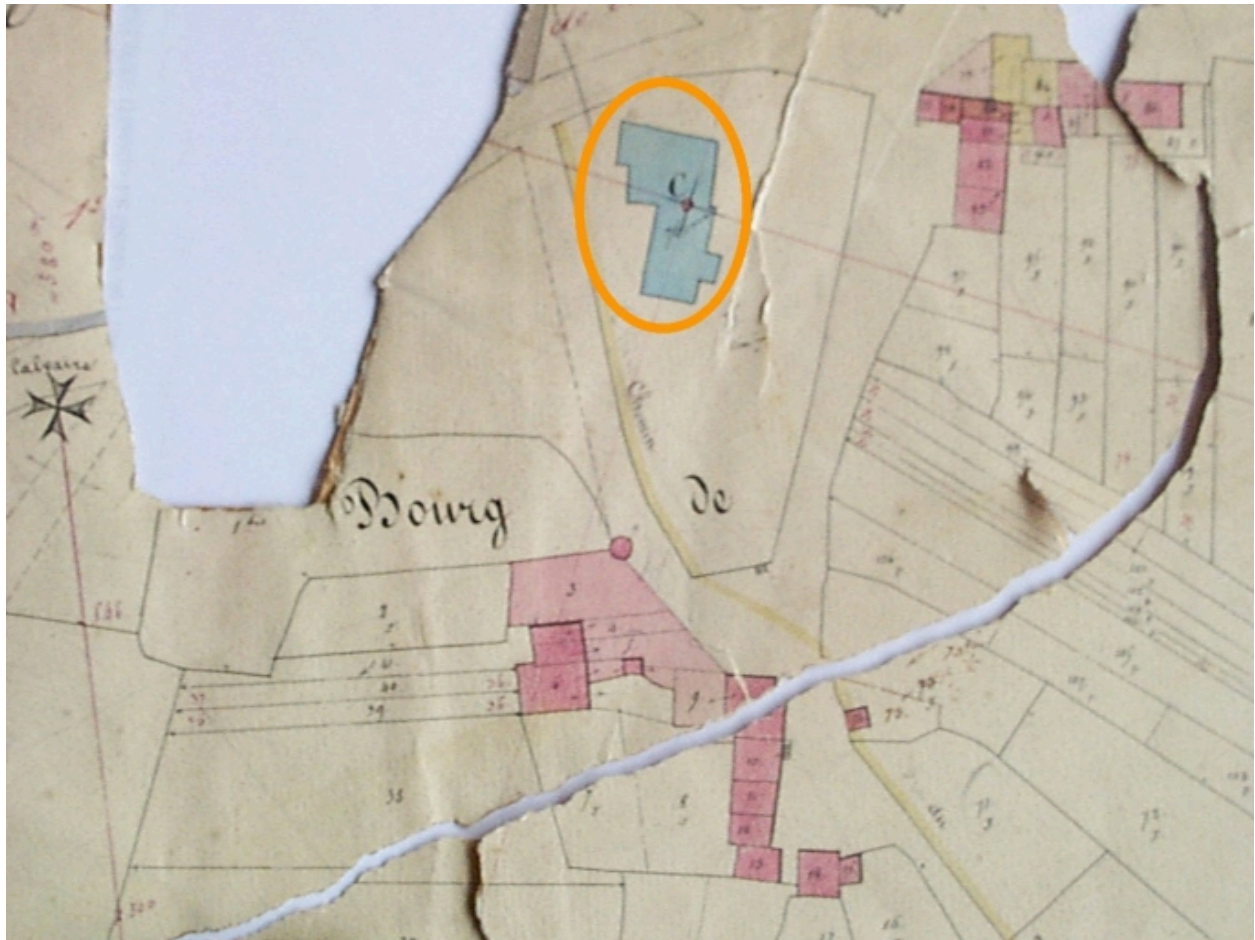
L'ancienne église sur le cadastre napoléonien (cerclée d'un trait orangé)