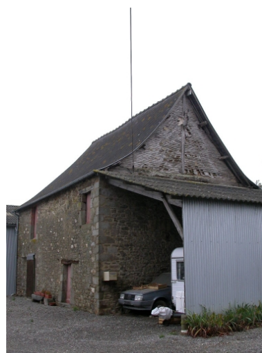
Vue sud-est IVR53_20053518899NUCA