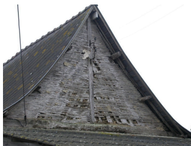
Détail de la tête de pignon en pan de bois IVR53_20053518900NUCA