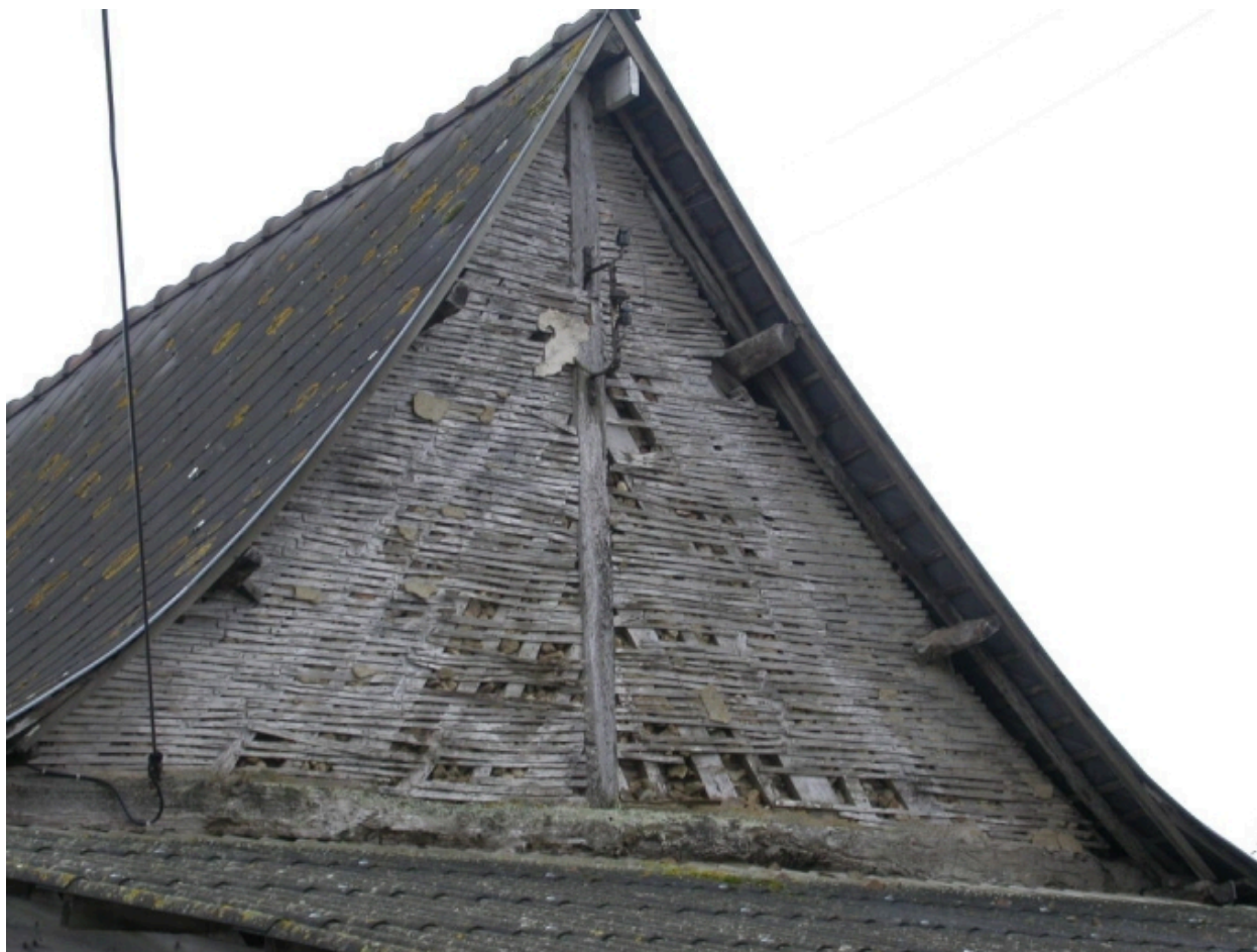
Détail de la tête de pignon en pan de bois