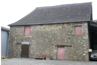
Façade sud IVR53_20053518898NUCA