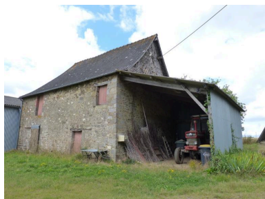
Vue générale est