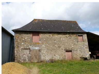
Vue générale est IVR53_20243531274NUCA