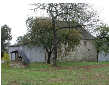
Façade postérieure IVR53_20053518901NUCA