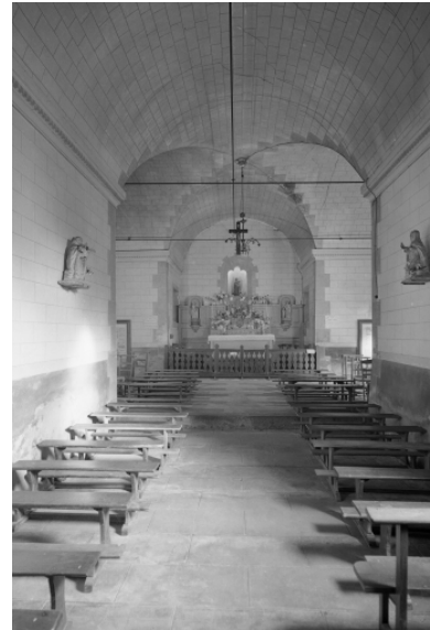
Intérieur : vue générale vers le chœur.