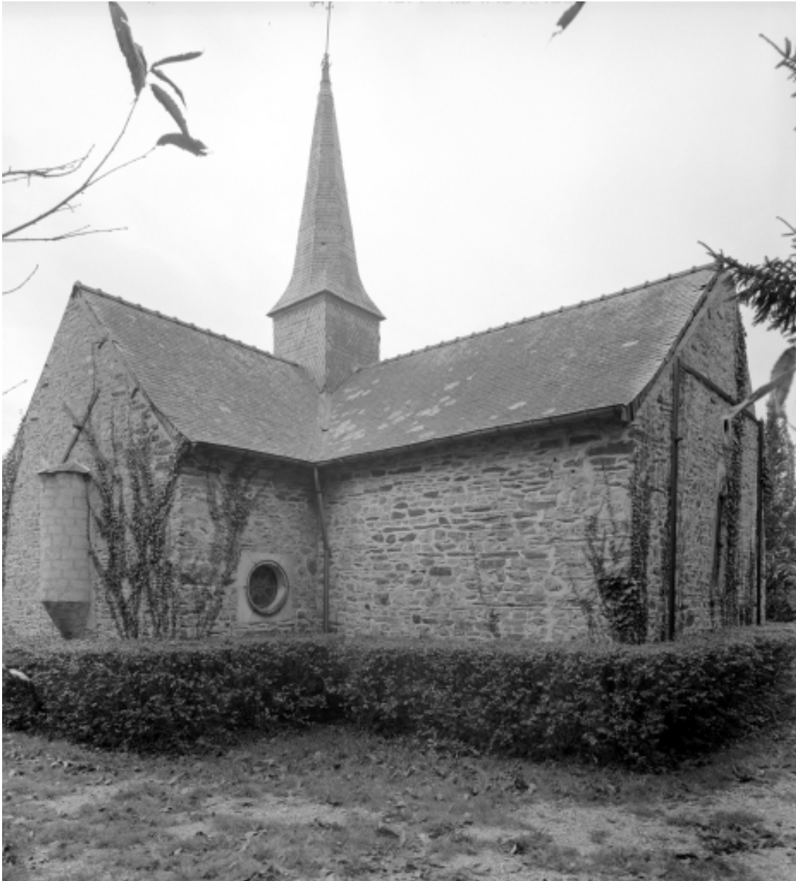
Elévation Nord-Est : vue générale