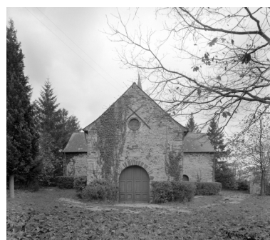
Elévation Ouest : vue générale IVR53_19673500420V