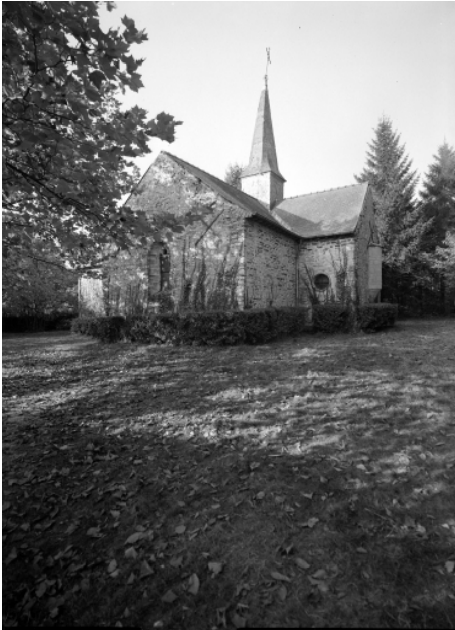
Elévation Est : vue générale