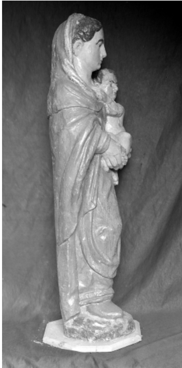
Statue de Vierge à l'Enfant, profil droit.