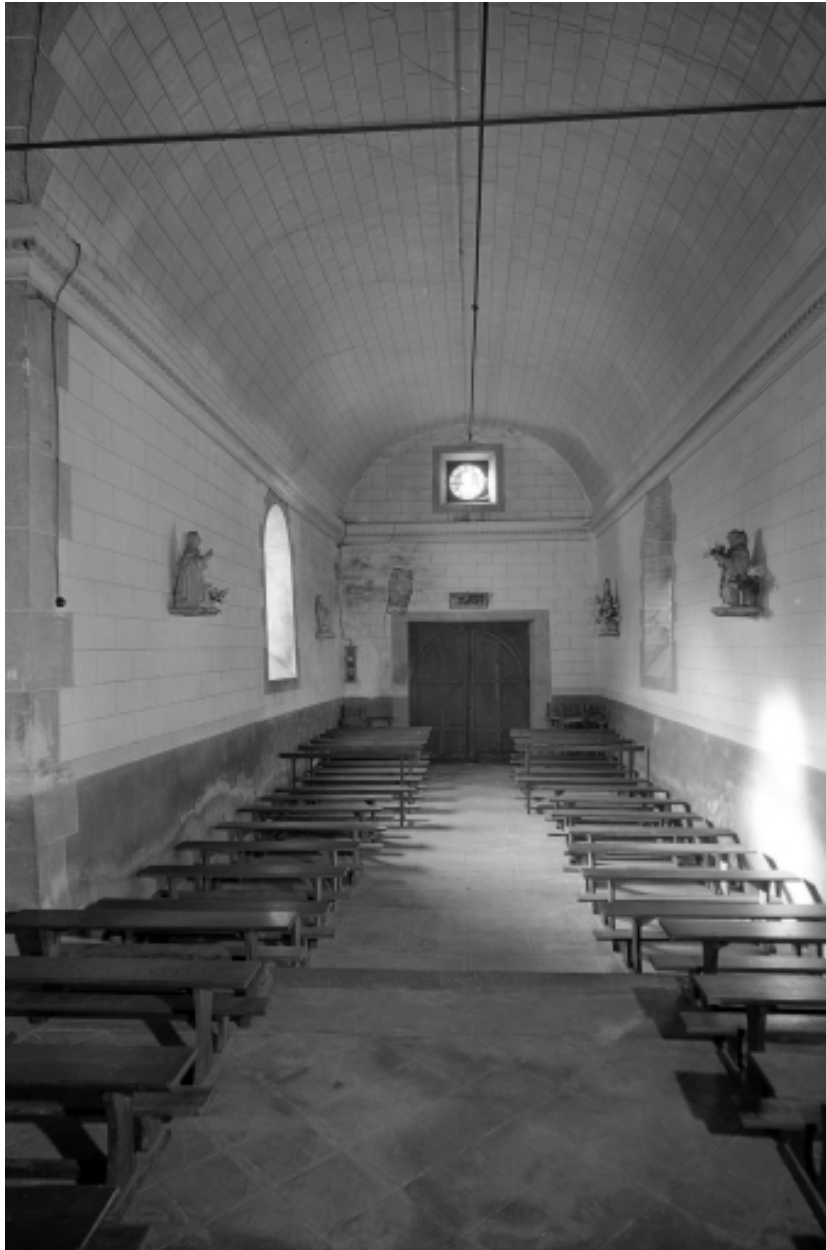
Intérieur, nef : vue générale.