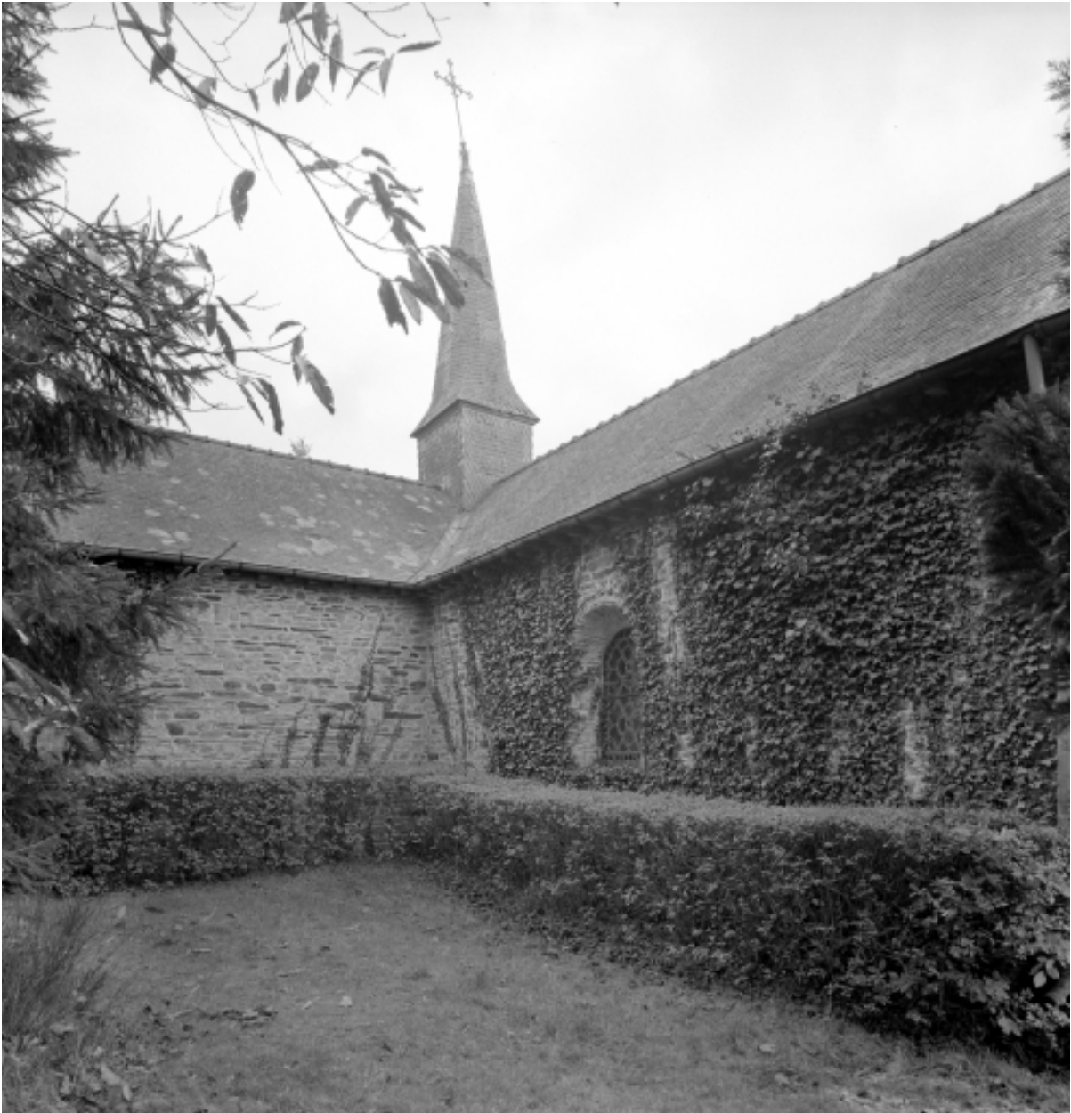
Elévation Nord-Ouest : vue générale