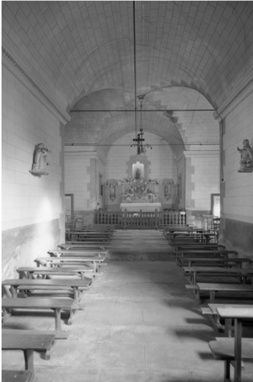
Intérieur : vue générale vers le chœur.