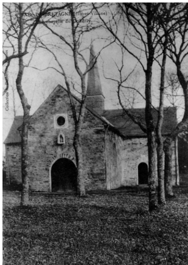
Elévation Ouest : vue générale (Carte postale ancienne, AD35 : 6Fi) IVR53_19693500103V