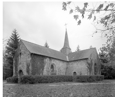
Elévation Sud : vue générale IVR53_19673500119V