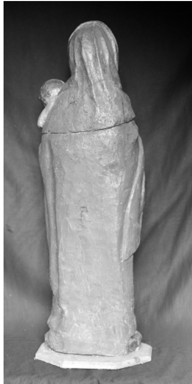
Statue de Vierge à l'Enfant, revers. IVR53_19703501403V