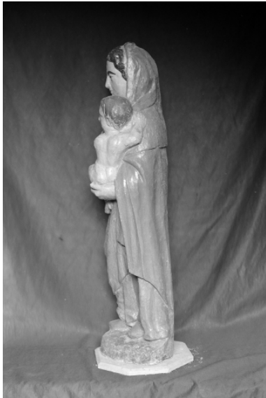
Statue de Vierge à l'Enfant, profil gauche. IVR53_19703501405V