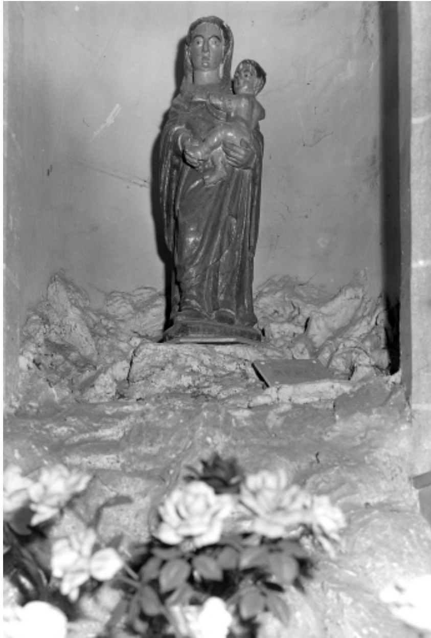
Statue de Vierge à l'Enfant, vue de face.