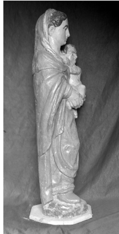
Statue de Vierge à l'Enfant, profil droit. IVR53_19703501404V