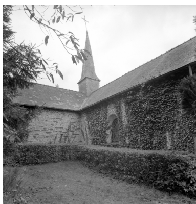
Elévation Nord-Ouest : vue générale IVR53_19673500120V