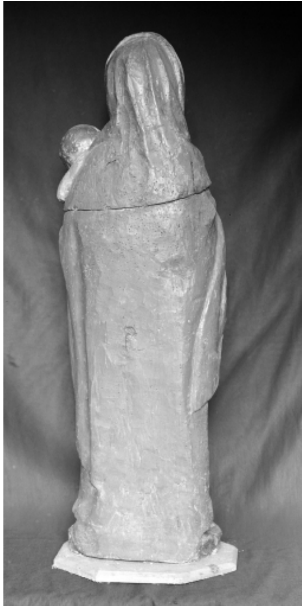
Statue de Vierge à l'Enfant, revers.