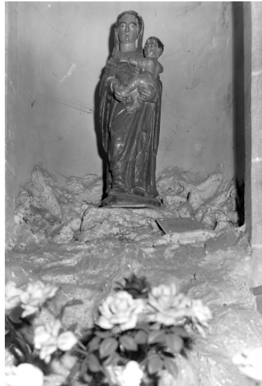
Statue de Vierge à l'Enfant, vue de face.