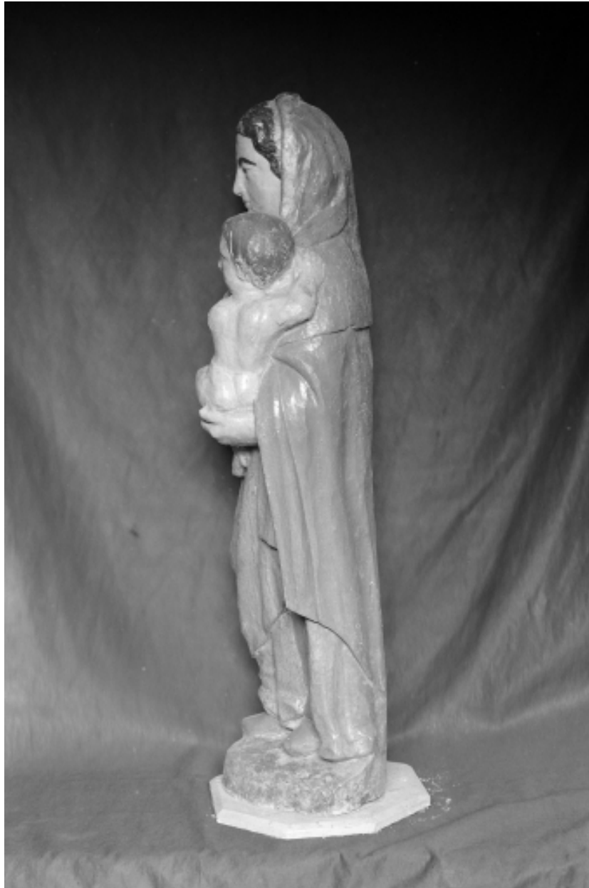
Statue de Vierge à l'Enfant, profil gauche.