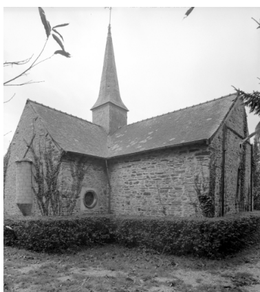
Elévation Nord-Est : vue générale IVR53_19673500121V