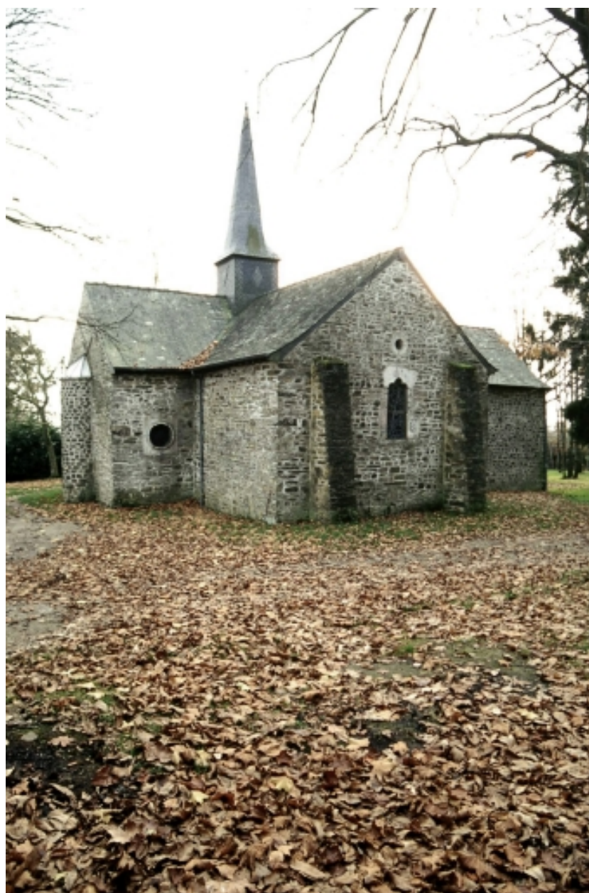
Vue générale prise du nord-est.