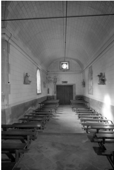
Intérieur, nef : vue générale. IVR53_19703501407V