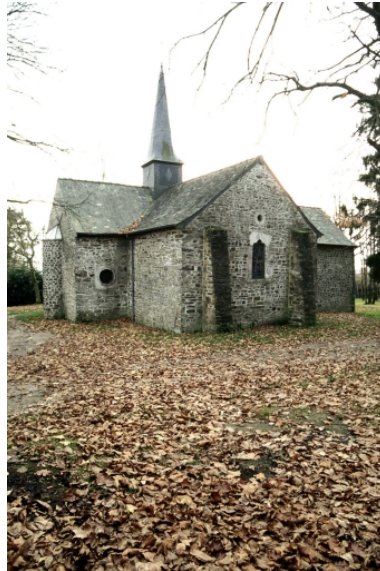
Vue générale prise du nord-est. IVR53_19943502466ZA