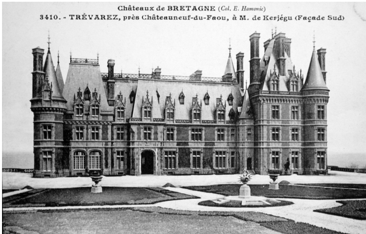
Vue de la façade principale (Archives départementales d'Ille-et-Vilaine, 6 Fi Saint-Goazec)