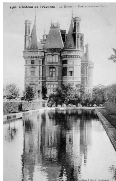
Le Miroir, photographie du début du 20e siècle