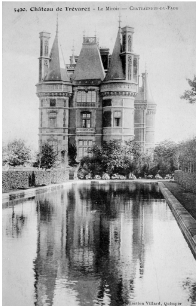
Le Miroir, photographie du début du 20e siècle