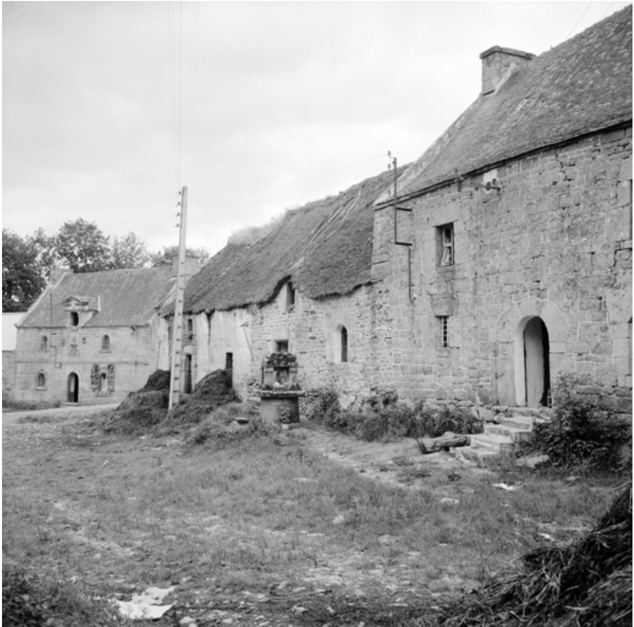
Kerdanet, alignement de maisons : vue de situation prise du nord-est