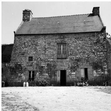
Maison (parcelle 298) : vue d'ensemble de la façade ouest