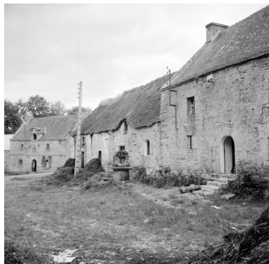
Kerdanet, alignement de maisons : vue de situation prise du nord-est IVR53_19665600768X