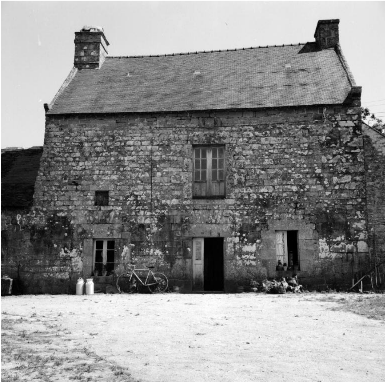
Maison (parcelle 298) : vue d'ensemble de la façade ouest