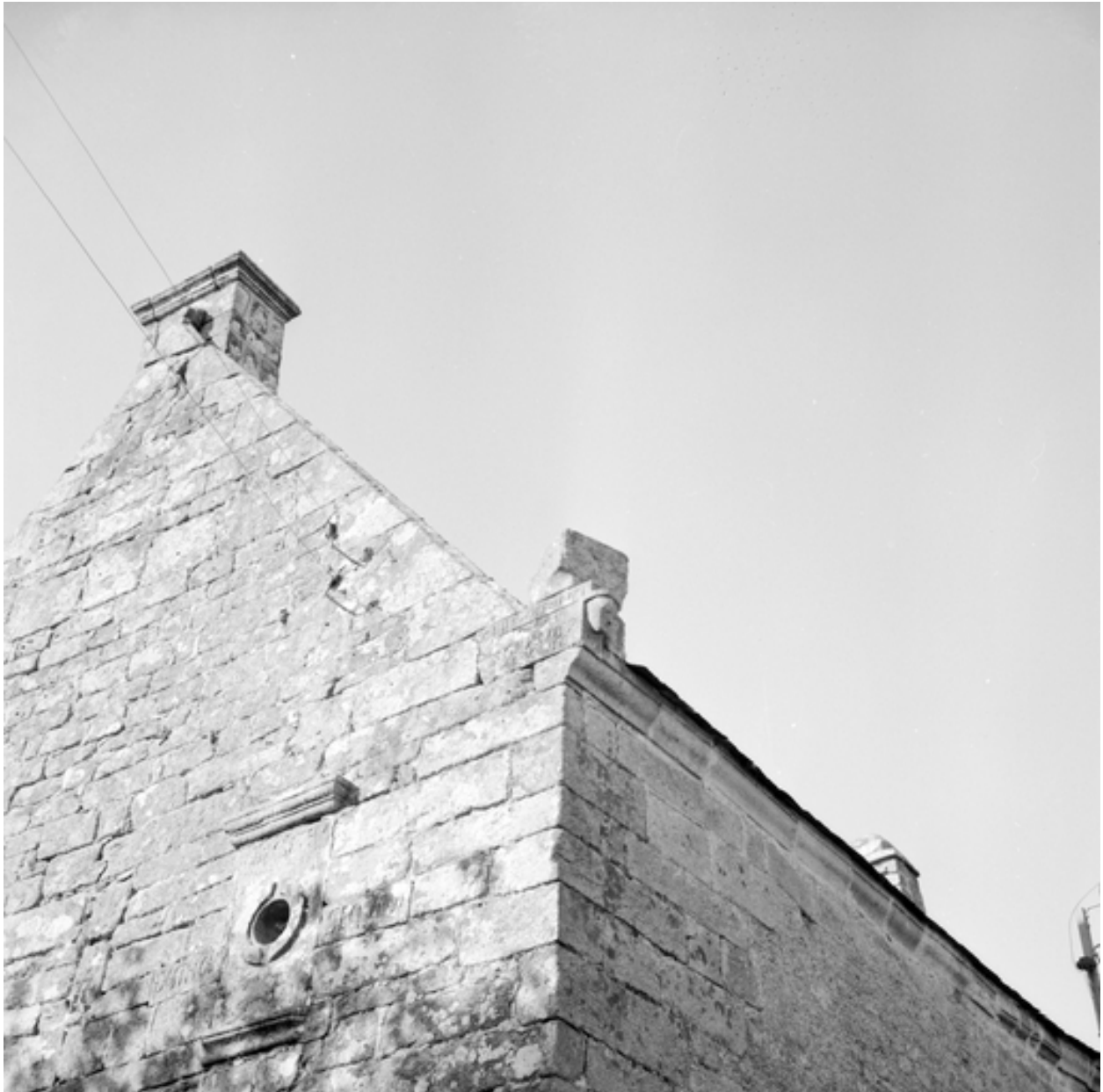
Kervihan, maison : détail de l'angle sud-ouest