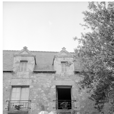
Linguennec, maison : lucarnes de la façade sud-est IVR53_19665600770X