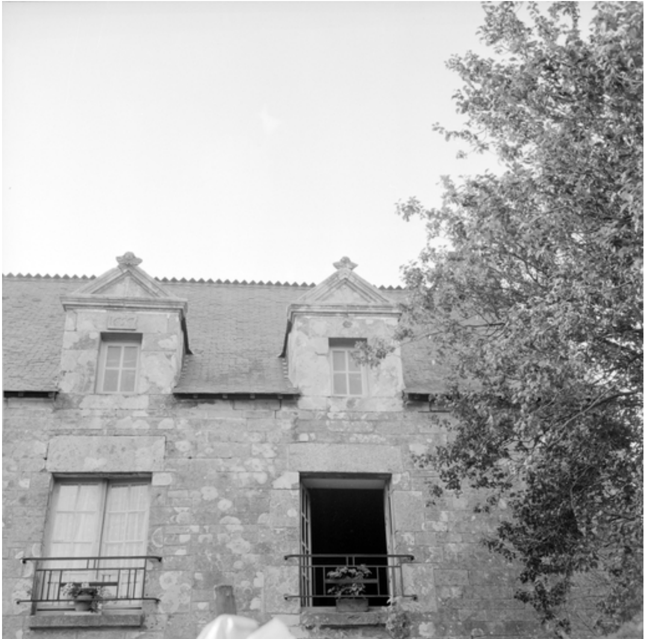
Linguennec, maison : lucarnes de la façade sud-est