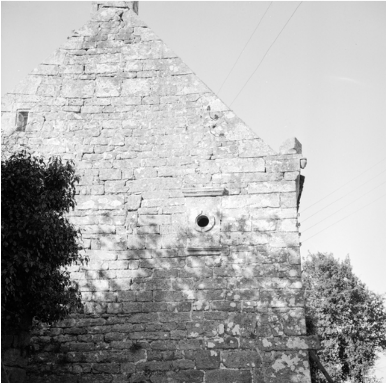
Kervihan, maison : vue d'ensemble du pignon ouest