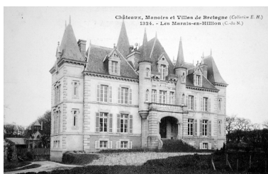
Vue générale IVR53_20042209038NUCB