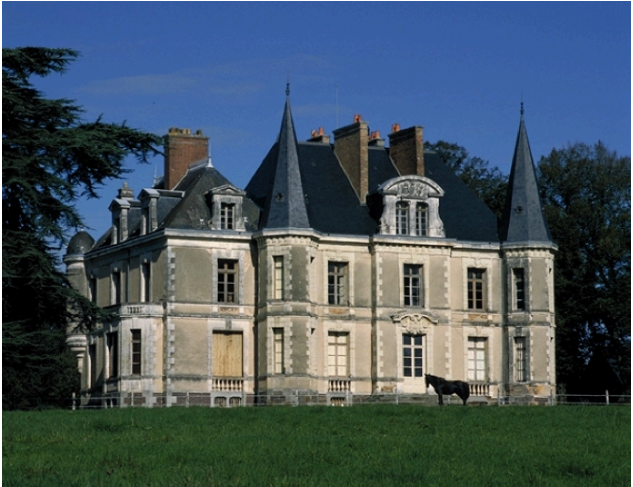
Façade sur le parc : vue générale sud-ouest