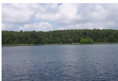
L'étang de Livry, au nord du domaine : vue générale sud IVR53_19993503885NUCA