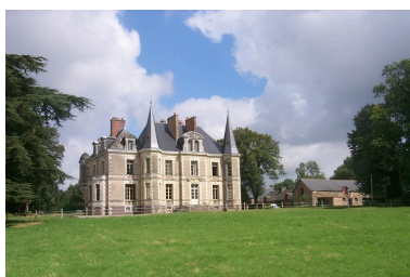
Façade sur le parc : vue générale sud-ouest