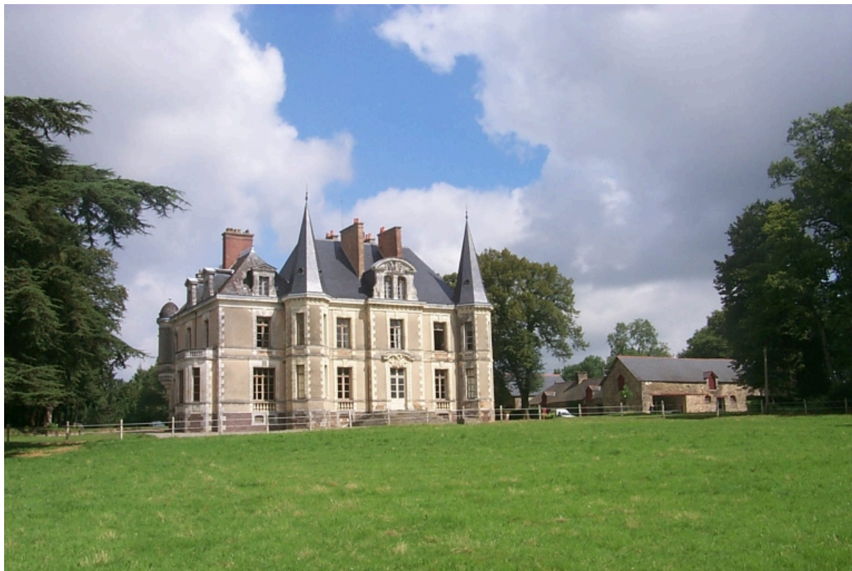
Façade sur le parc : vue générale sud-ouest