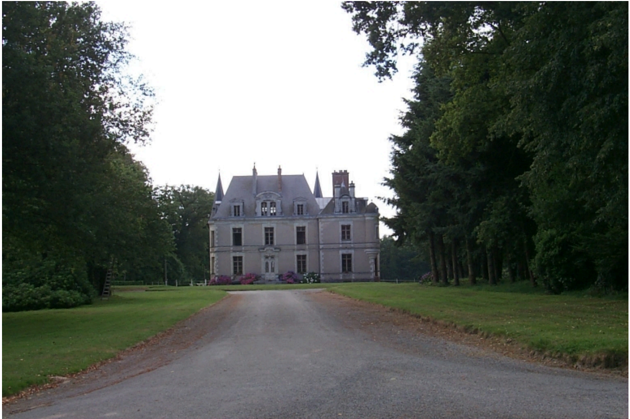
Le château au bout de son mail : vue de situation nord