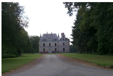
Le château au bout de son mail : vue de situation nord IVR53_19993503749NUCA