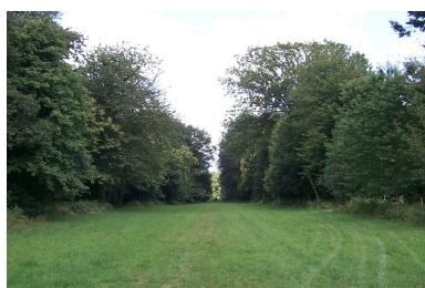
Mail menant au château de la Motte et à l'étang de Livry : vue générale sud IVR53_19993503759NUCA