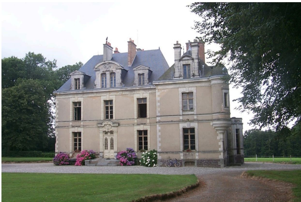
Façade sur le mail : vue générale nord-ouest