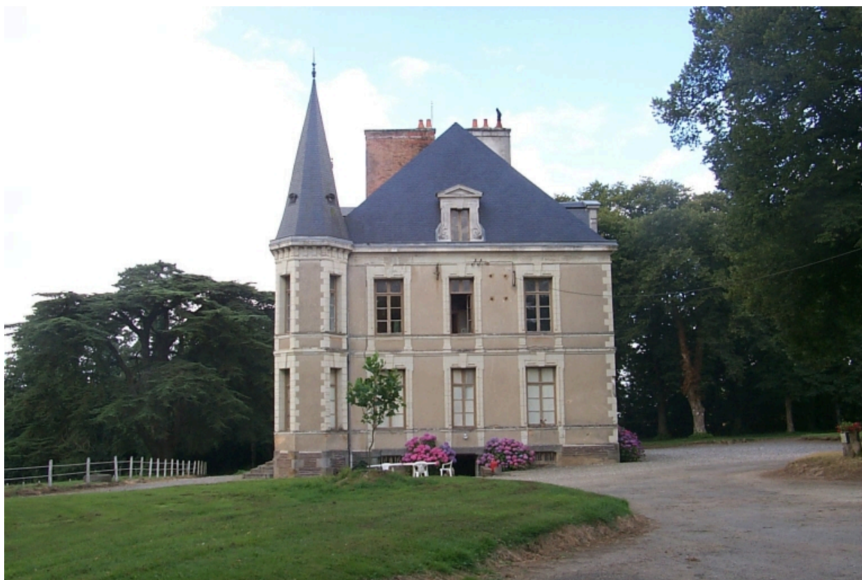
Le pignon est : vue générale