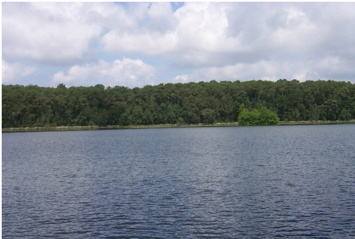
L'étang de Livry, au nord du domaine : vue générale sud