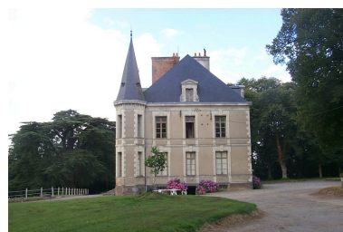
Le pignon est : vue générale IVR53_19993503751NUCA