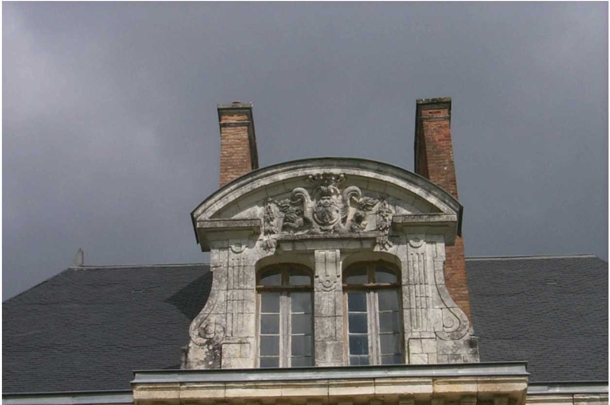
Façade sur le parc, fronton de l'avant-corps aux armes des Jacquelin d'Urfé : détail