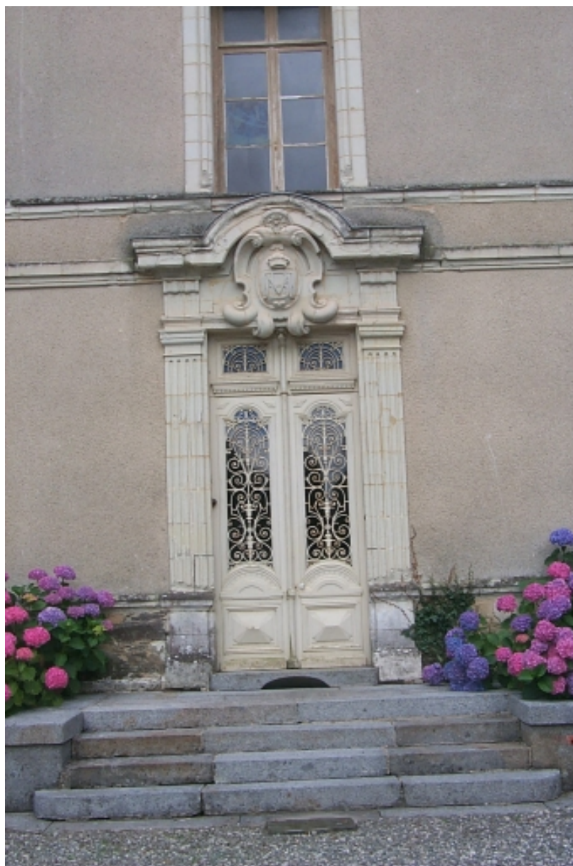
La porte principale : vue générale nord