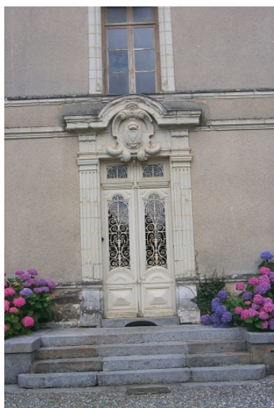
La porte principale : vue générale nord IVR53_19993503753NUCA

IVR53_19993501979XA