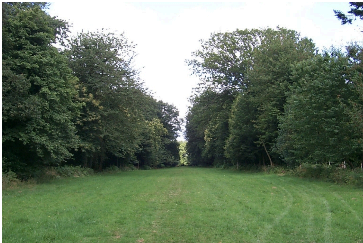
Mail menant au château de la Motte et à l'étang de Livry : vue générale sud