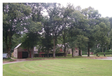
La métairie : vue générale nord-ouest IVR53_19993503884NUCA