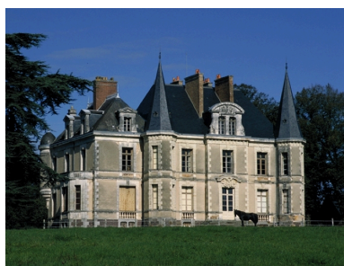
Façade sur le parc : vue générale sud-ouest