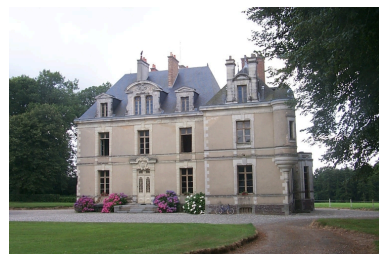
Façade sur le mail : vue générale nord-ouest IVR53_19993503750NUCA