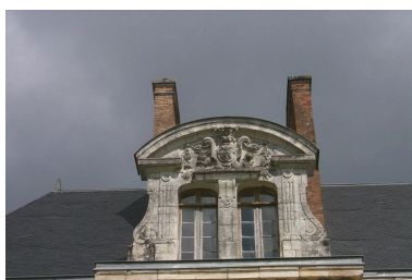
Façade sur le parc, fronton de l'avant-corps aux armes des Jacquelin d'Urfé : détail IVR53_19993503752NUCA