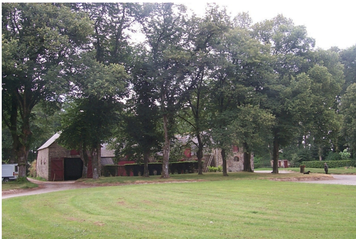
La métairie : vue générale nord-ouest