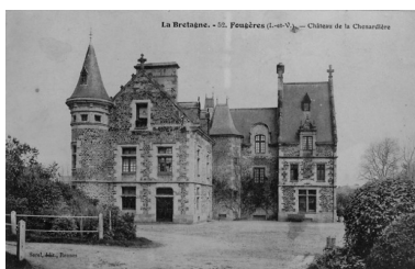
Vue générale sur l'arrière