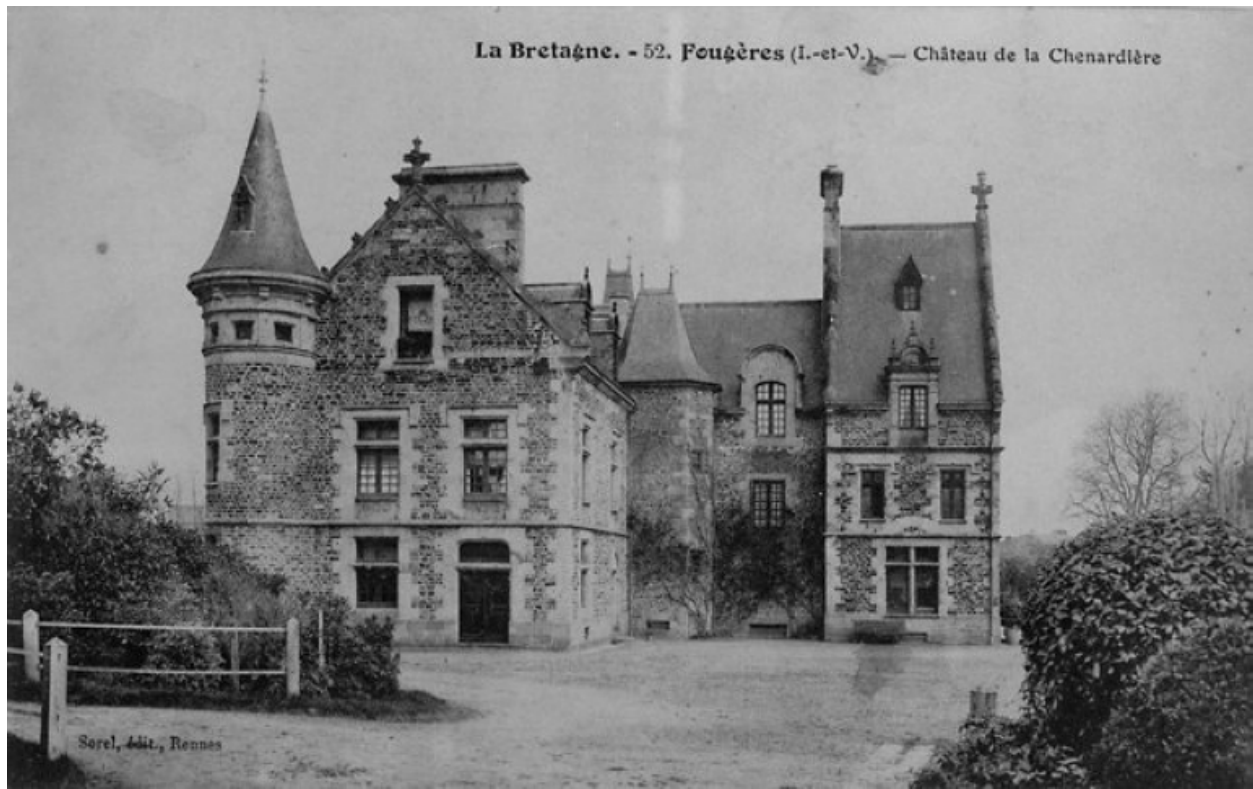
Vue générale sur l'arrière