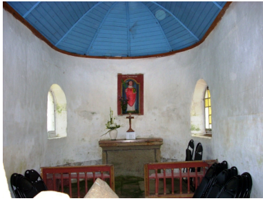
Primelin, chapelle Saint-Chrysanthe : vue axiale ouest IVR53_20082905758NUCA

IVR53_19782900307X