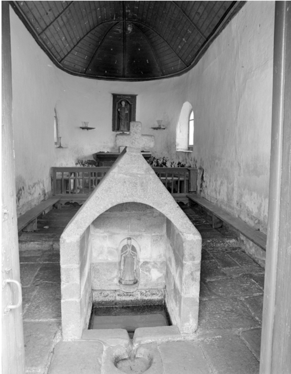
Primelin, chapelle Saint-Chrysanthe : vue intérieure ouest/est, état en 1978