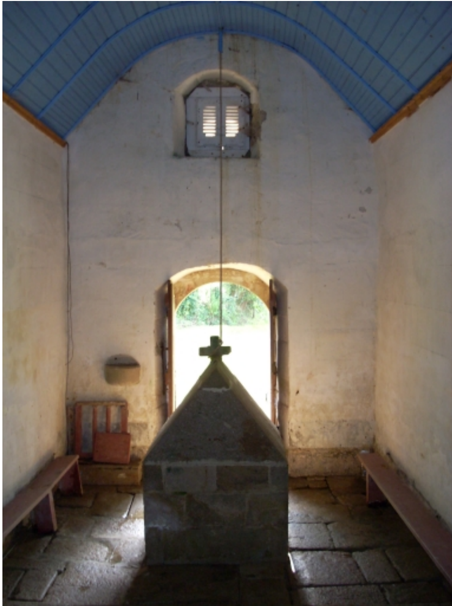
Primelin, chapelle Saint-Chrysanthe : vue axiale ouest