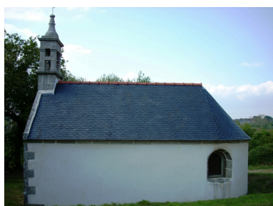
Primelin, chapelle Saint- Chrysanthe : élévation sud