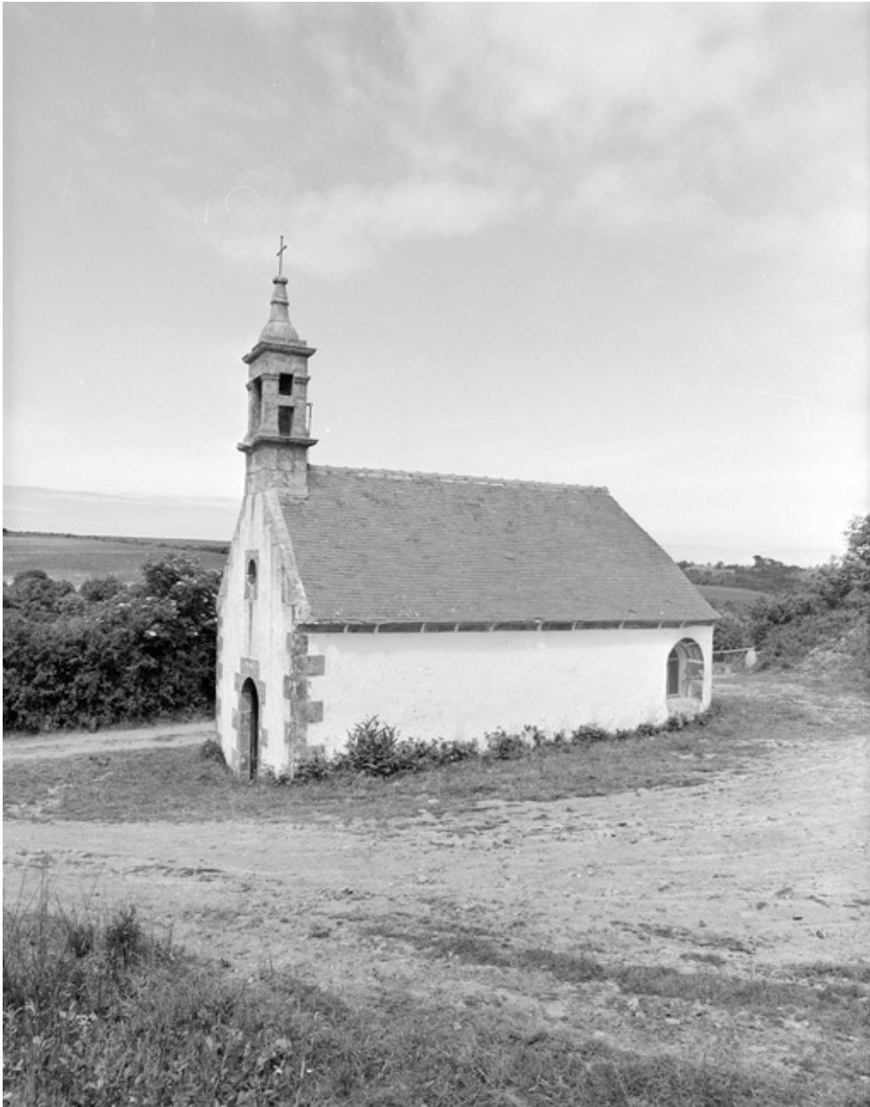
Primelin, chapelle Sainte-Chysanthe : vue générale sud-ouest, état en 1978