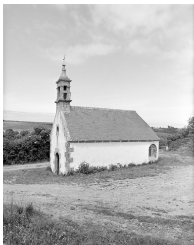
Primelin, chapelle Sainte-Chysanthe : vue générale sud-ouest, état en 1978 IVR53_19782900959X