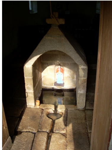
Primelin, chapelle Saint-Chrysanthe : détail, fontaine IVR53_20082905760NUCA