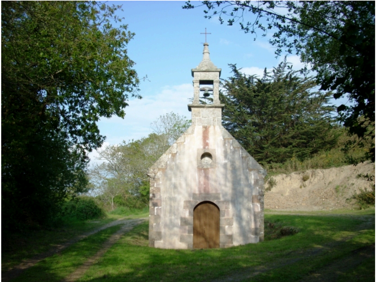
Primelin, chapelle Saint-Chrysanthe : élévation ouest