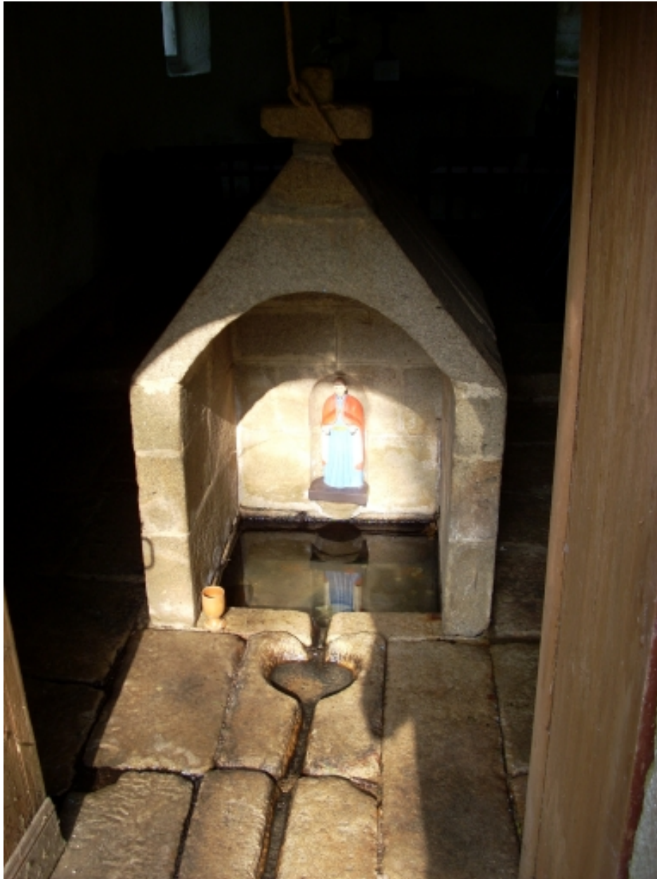
Primelin, chapelle Saint-Chrysanthe : détail, fontaine