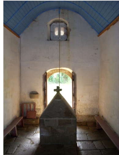
Primelin, chapelle Saint-Chrysanthe : vue axiale ouest IVR53_20082905759NUCA

IVR53_19782900312X