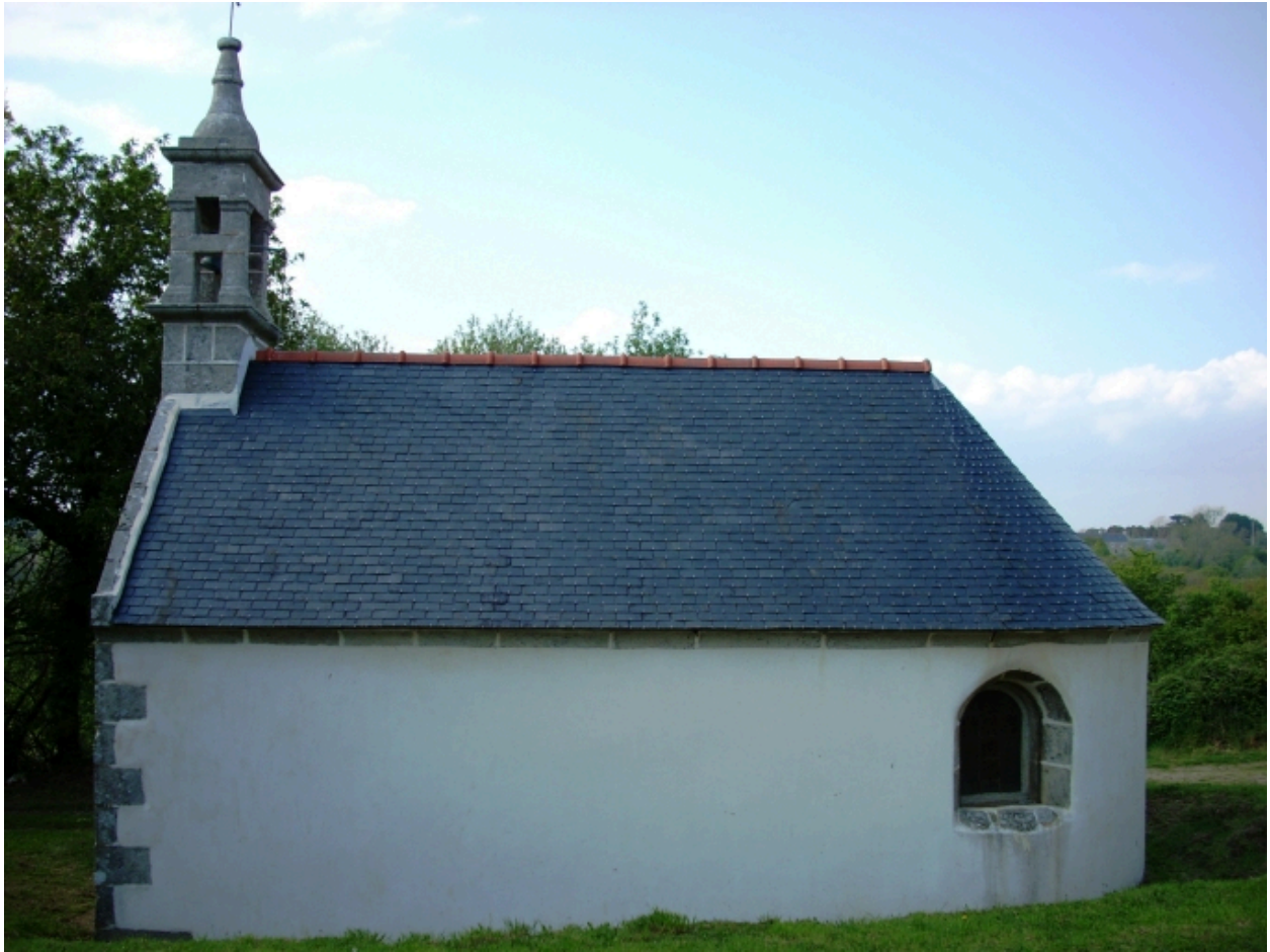
Primelin, chapelle Saint-Chrysanthe : élévation sud