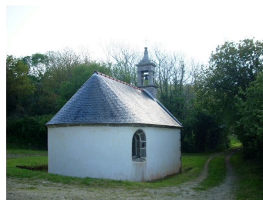
Primelin, chapelle Saint- Chrysanthe : vue générale nord-est IVR53_20082905756NUCA