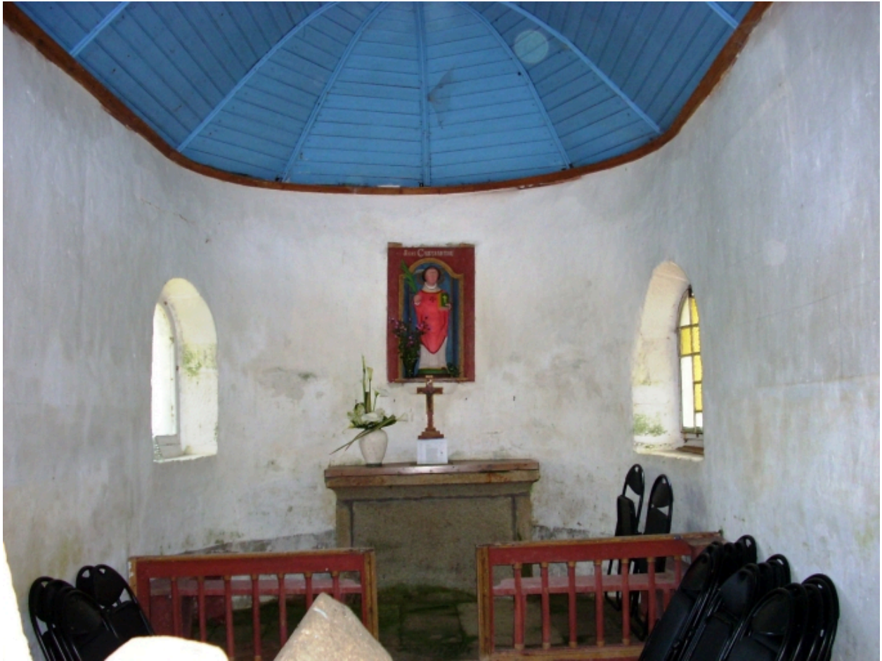
Primelin, chapelle Saint-Chrysanthe : vue axiale ouest