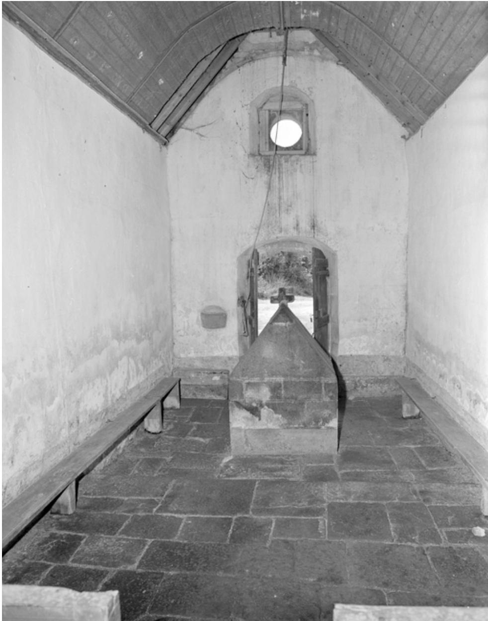
Primelin, chapelle Saint-Chrysanthe : vue intérieure est/ouest, état en 1978