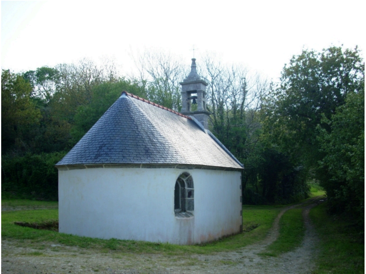
Primelin, chapelle Saint-Chrysanthe : vue générale nord-est