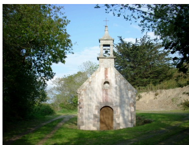
Primelin, chapelle Saint- Chrysanthe : élévation ouest IVR53_20082905755NUCA