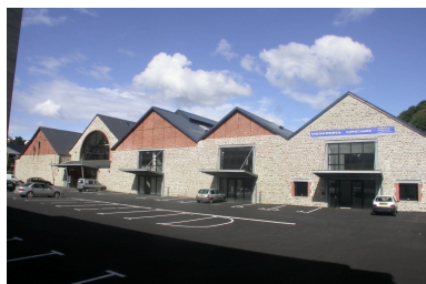
Vue générale IVR53_20062203233NUCA