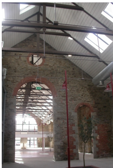
Vue intérieure