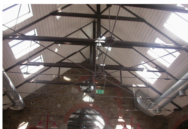
Détail de la charpente