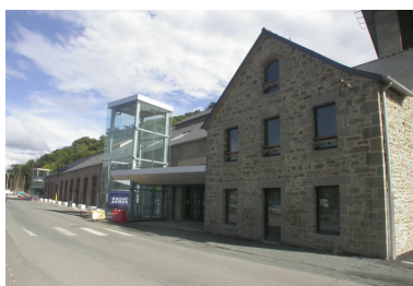
Vue de la façade sur rue