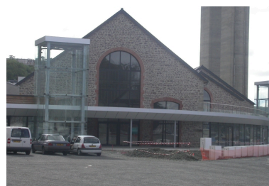
Pignon postérieur IVR53_20062203238NUCA