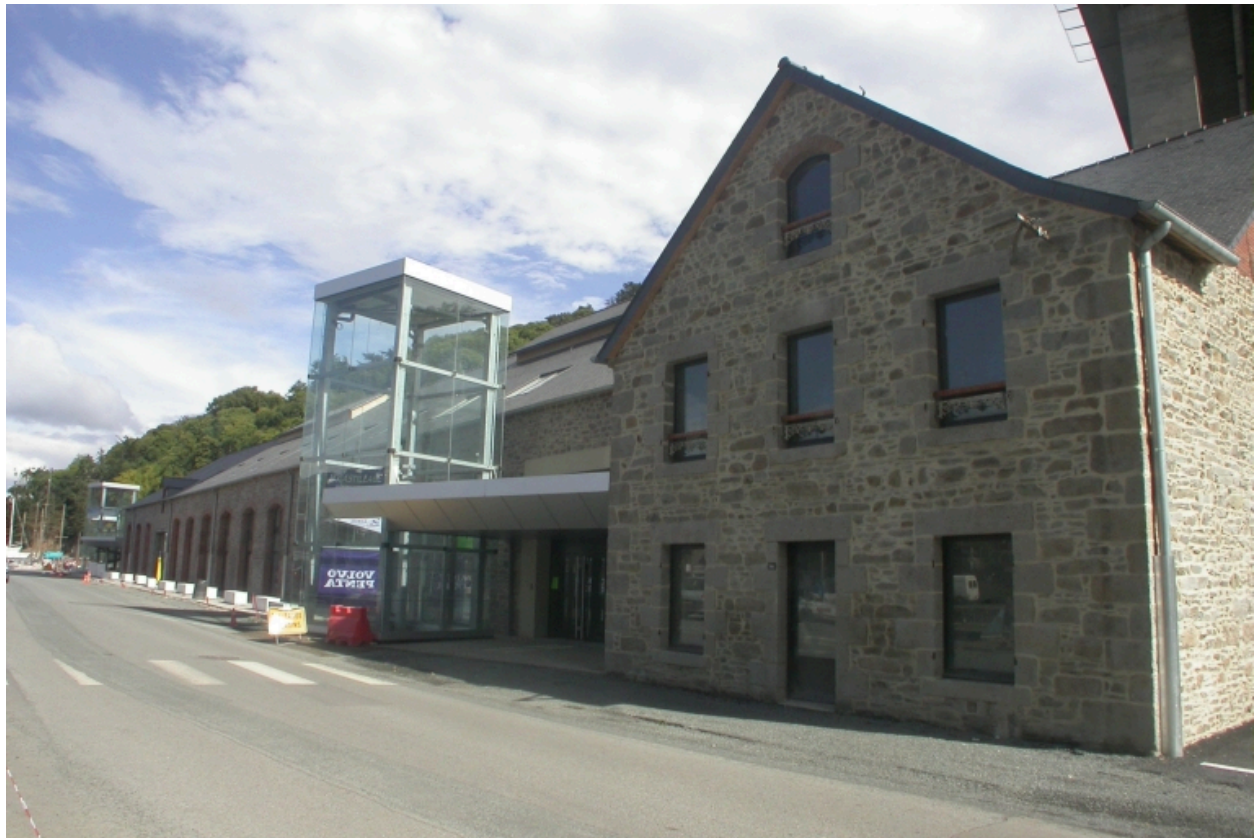
Vue de la façade sur rue