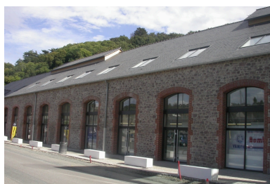
détail de la façade sur rue