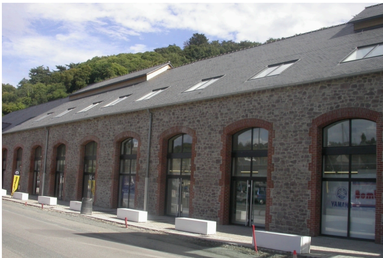
détail de la façade sur rue