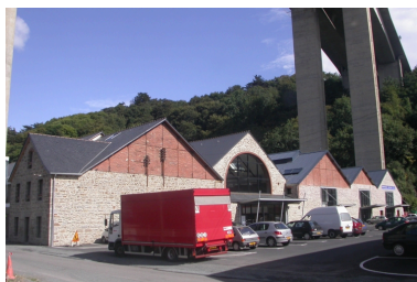
Vue générale IVR53_20062203234NUCA