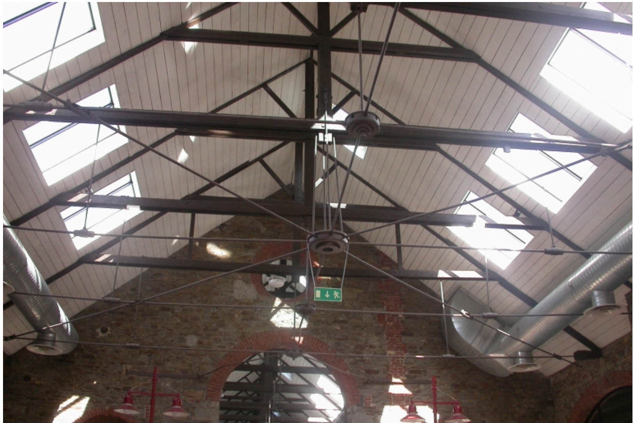
Détail de la charpente