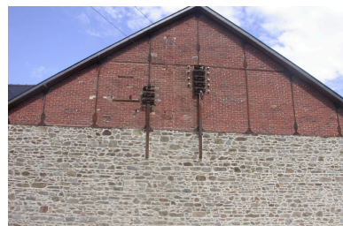
détail de la façade