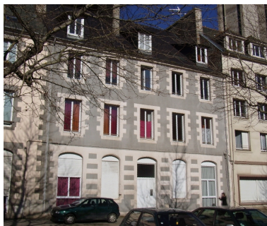
Vue générale IVR53_20082212646NUCA