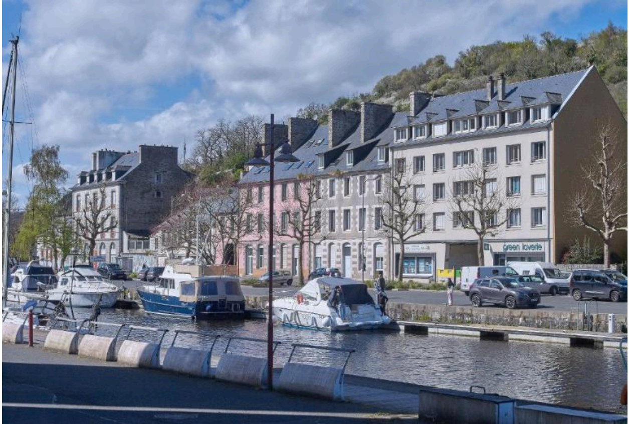
Maisons d'armateur et immeubles de logements