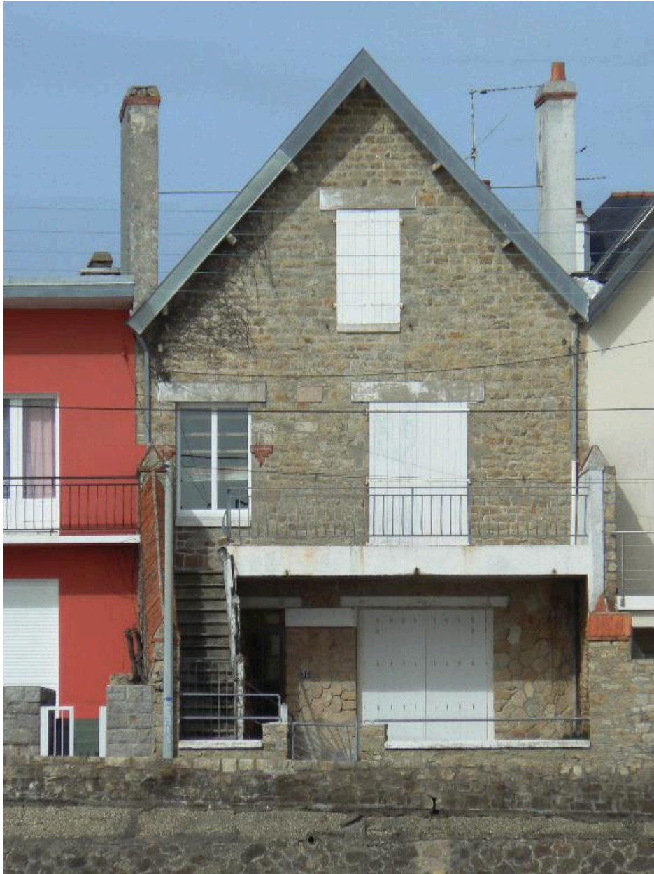
Vue générale de la maison de villégiature du 35 boulevard de la Nourriguel