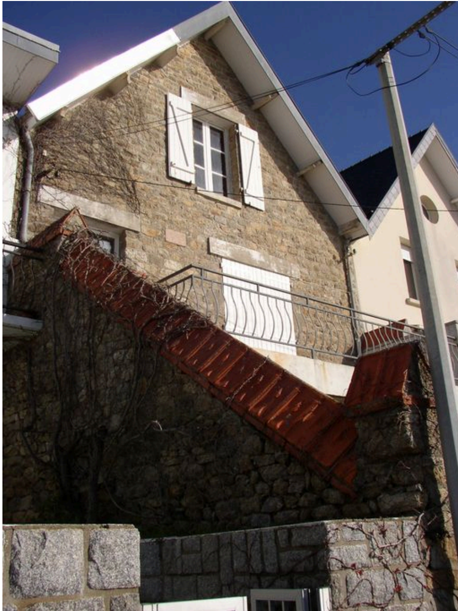
Maison de villégiature du 35 boulevard de la Nourriguel