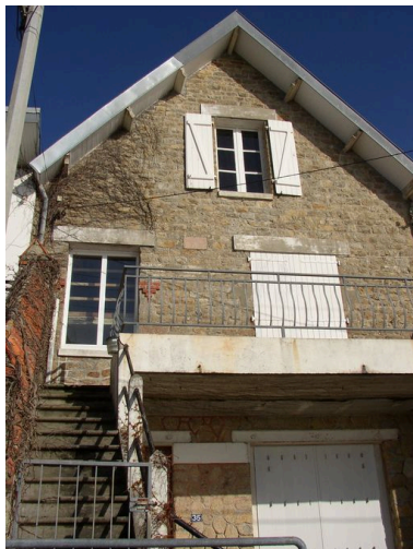
Maison de villégiature du 35 boulevard de la Nourriguel IVR53_20065606550NUCA