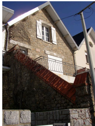
Maison de villégiature du 35 boulevard de la Nourriguel IVR53_20065606551NUCA