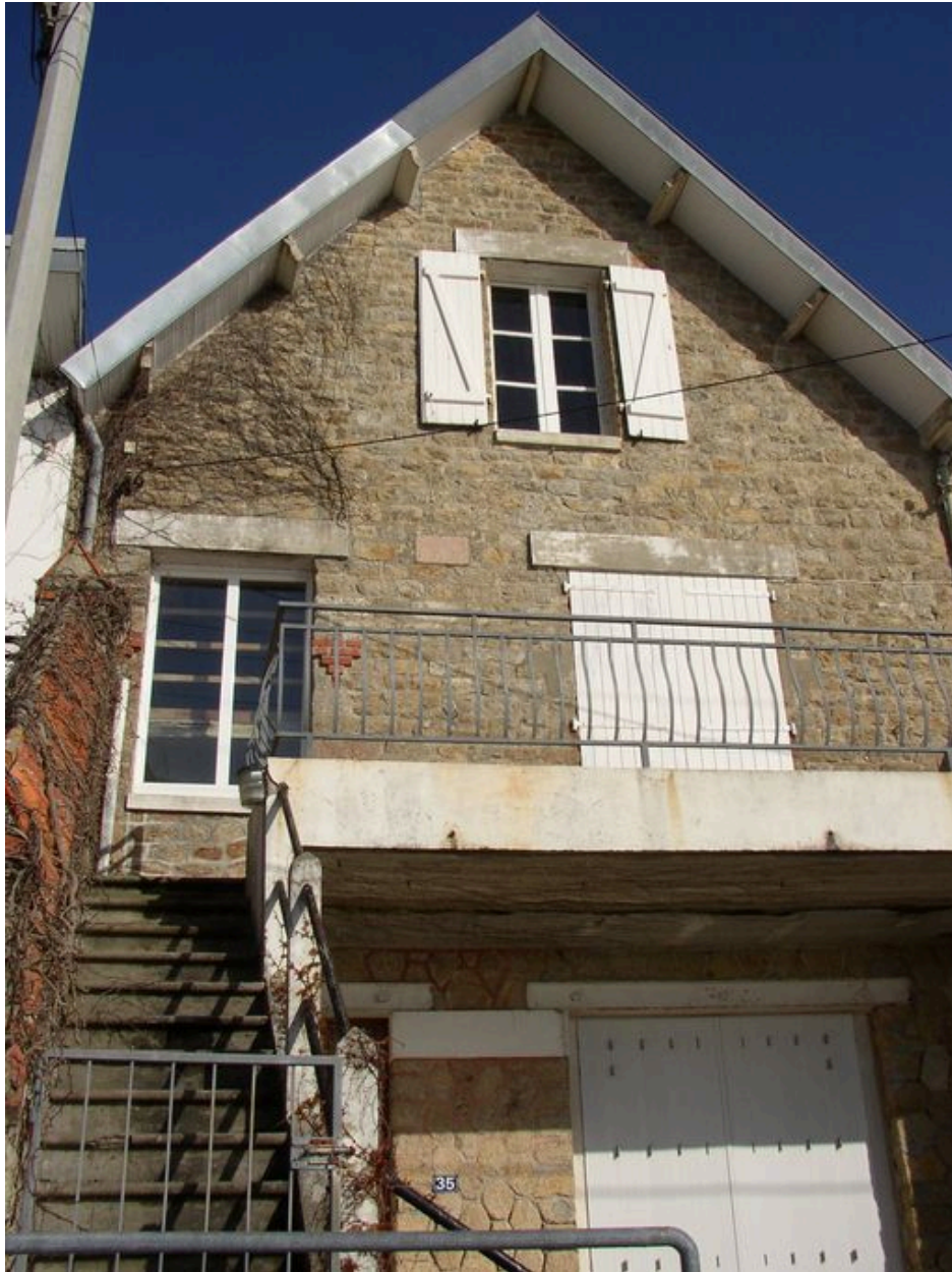
Maison de villégiature du 35 boulevard de la Nourriguel