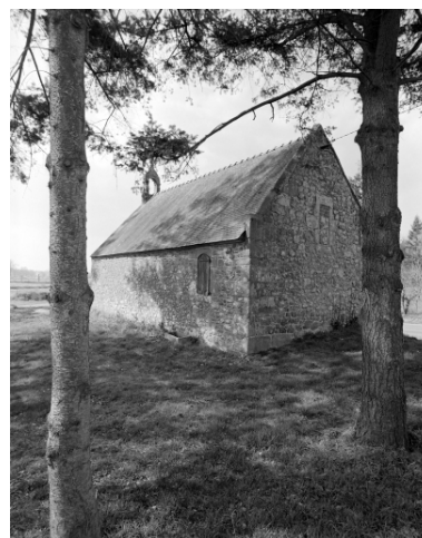
Elévation Sud-Ouest : vue générale IVR53_19933500330X