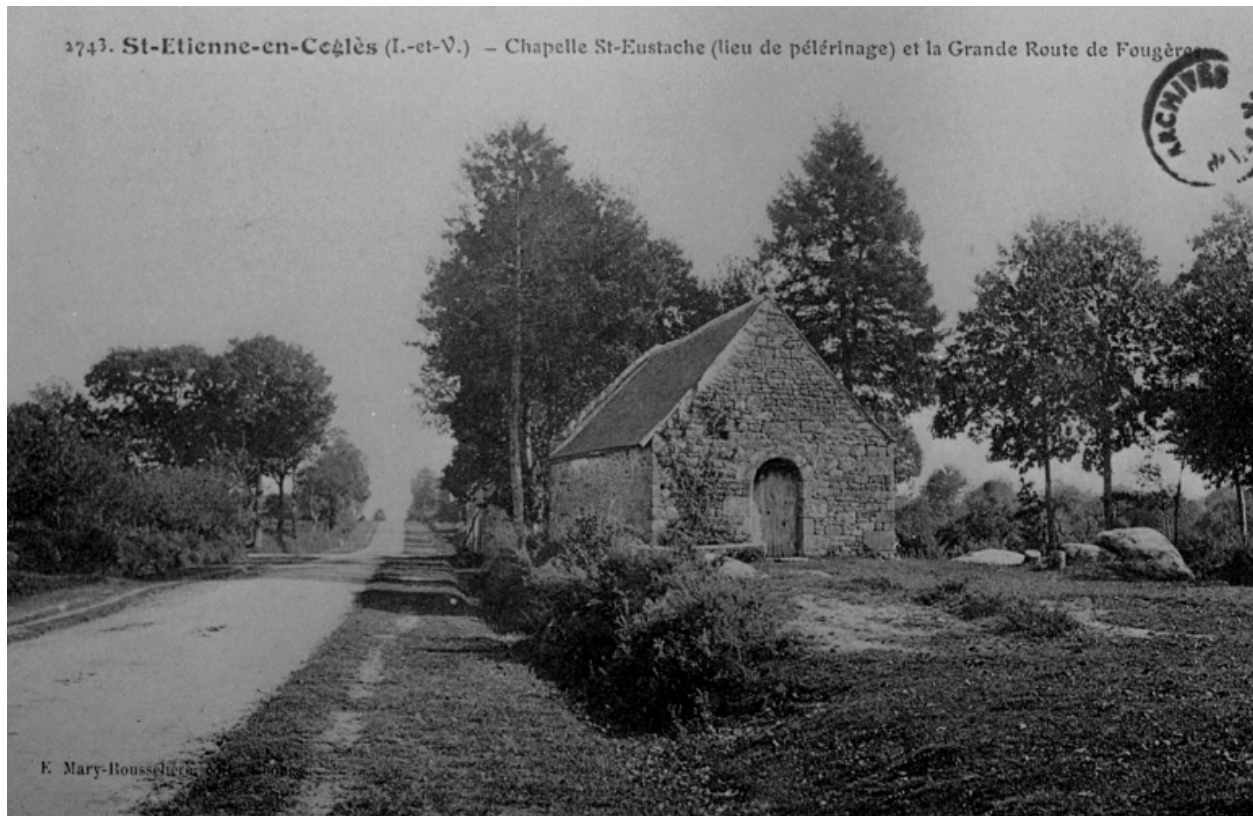
Elévation Ouest : vue de situation (Carte postale ancienne, AD35 : 6Fi)