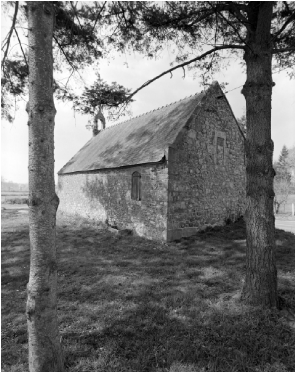
Elévation Sud-Ouest : vue générale