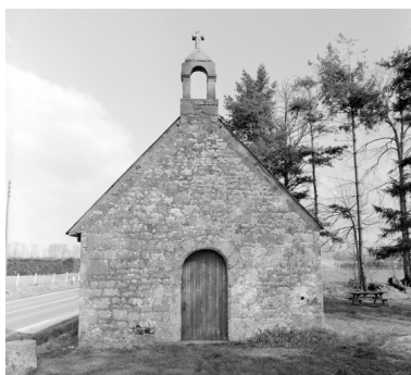
Elévation Sud-Est : vue générale IVR53_19933500329X