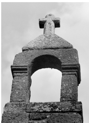
Elévation Ouest : détail du clocher IVR53_19933500332X