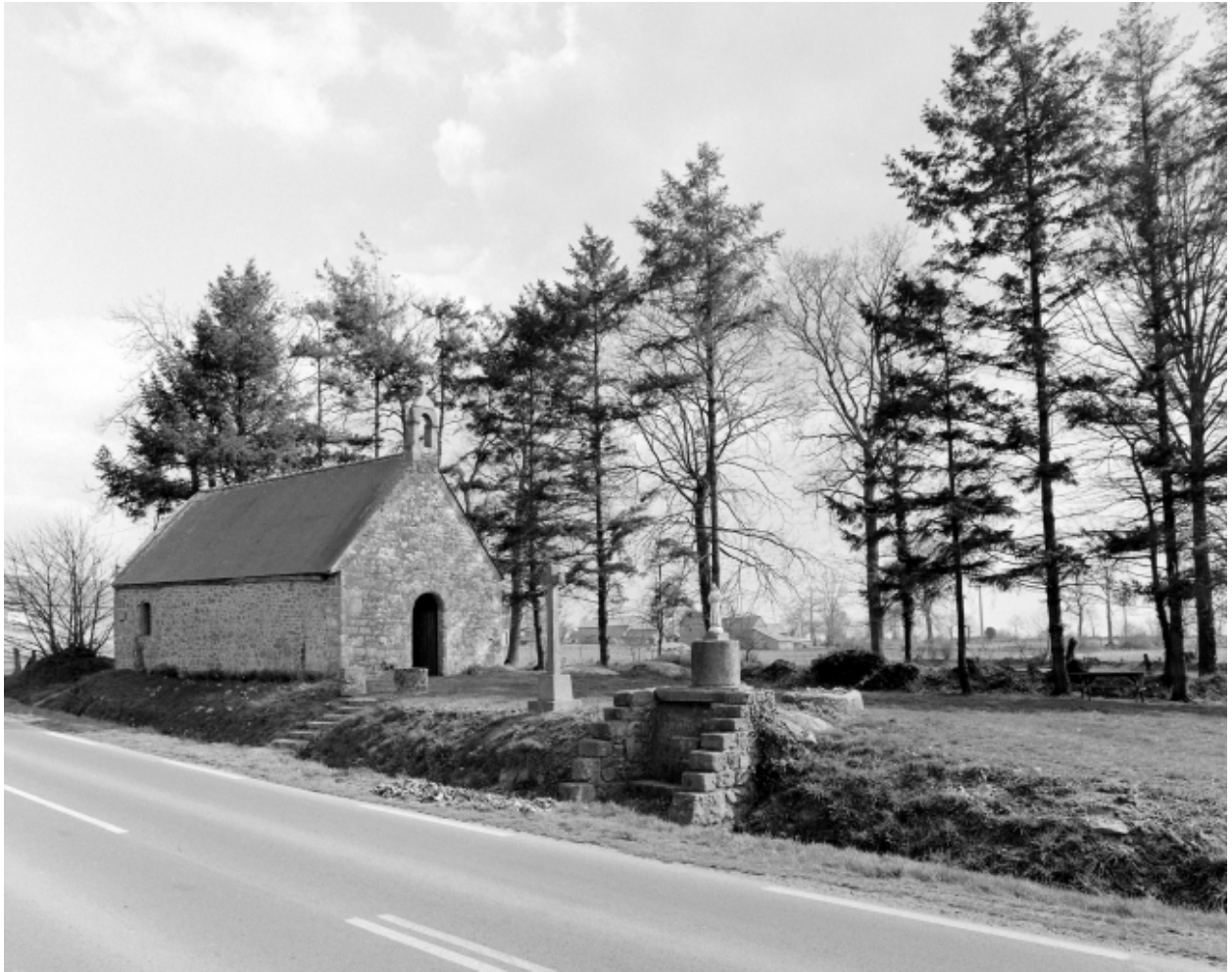
Elévation Nord-Ouest : vue de situation