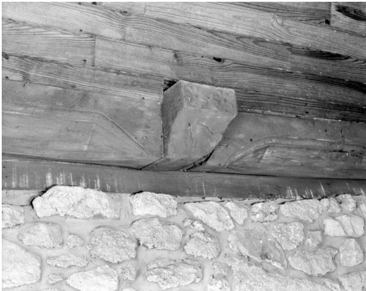
Intérieur : détail de la charpente.