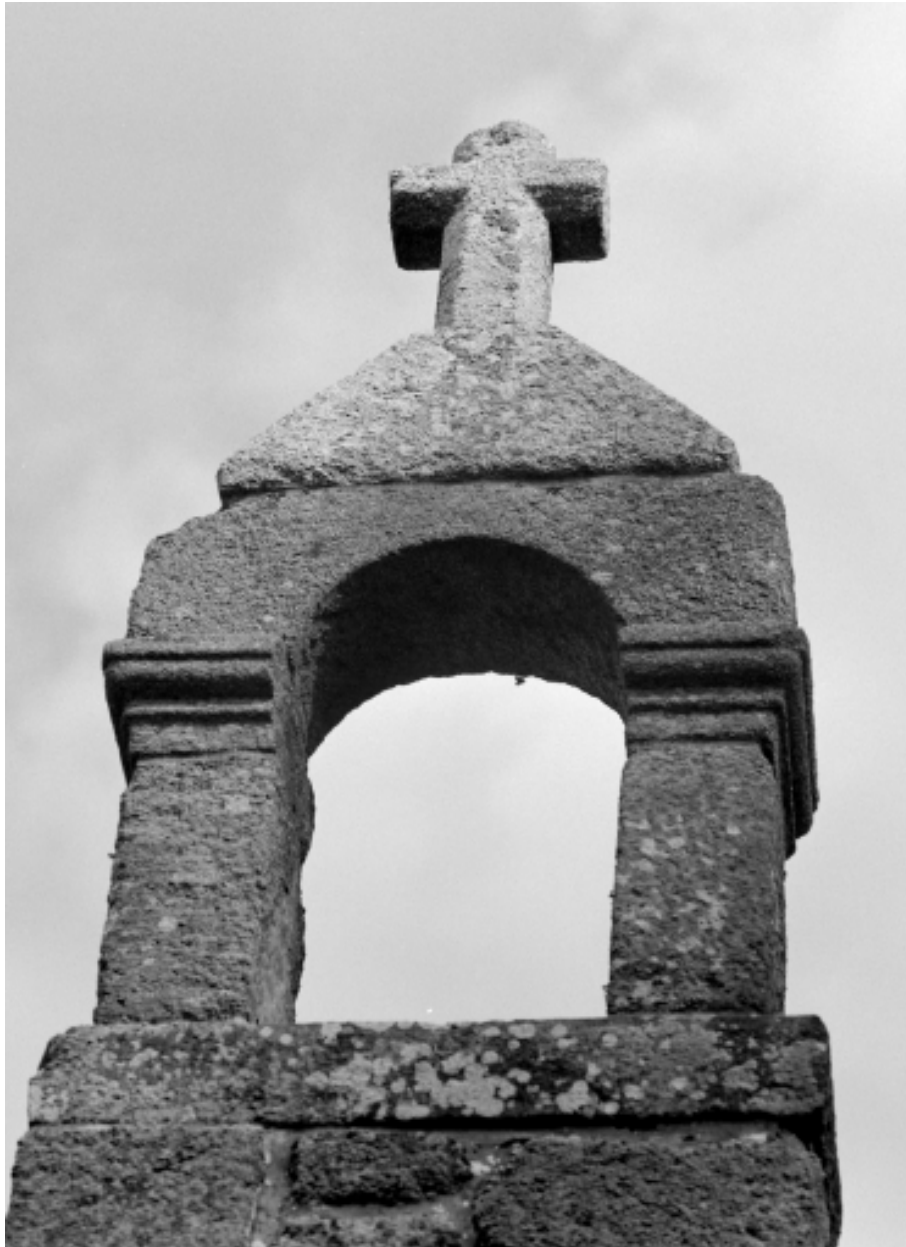
Elévation Ouest : détail du clocher