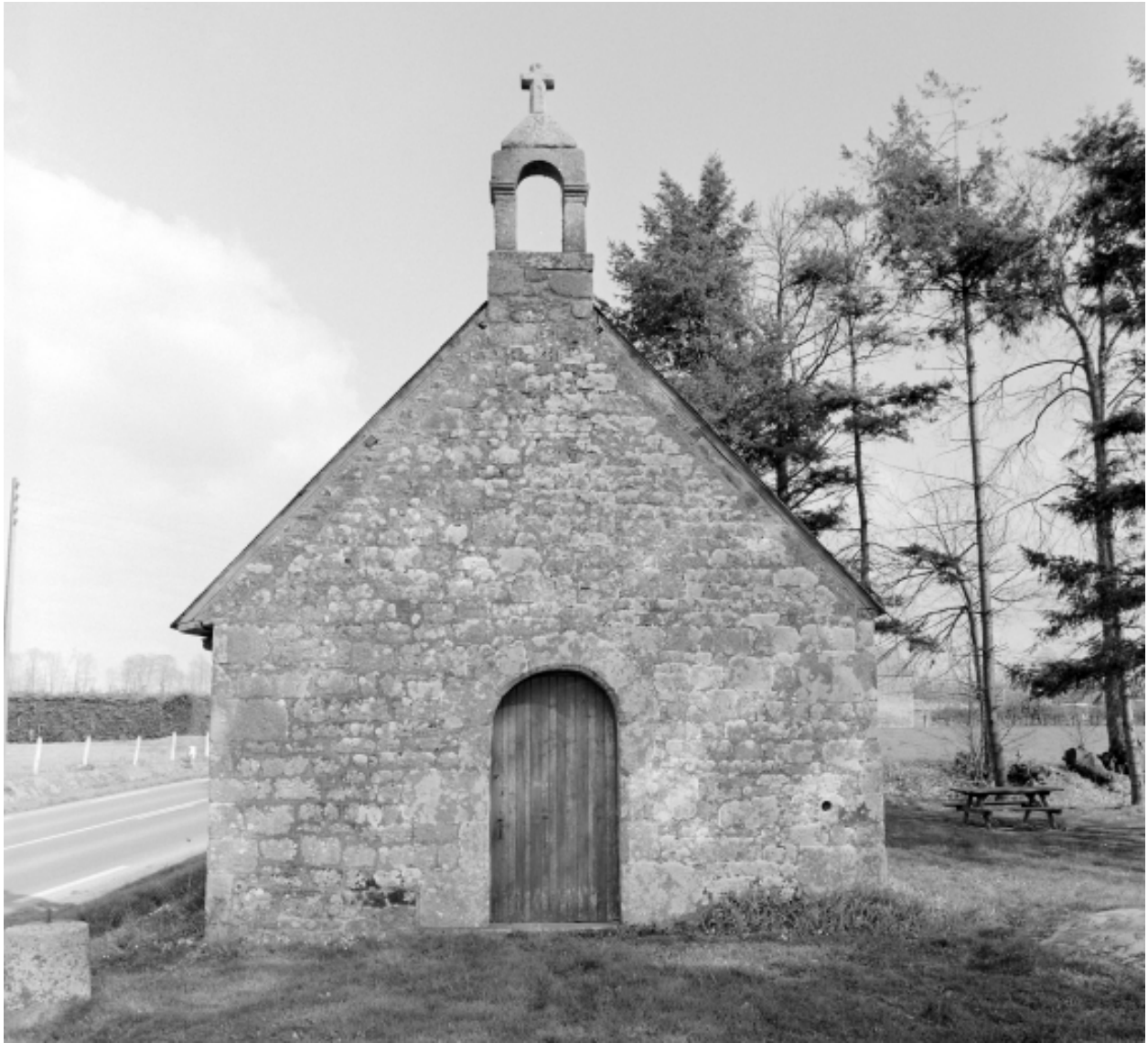
Elévation Sud-Est : vue générale