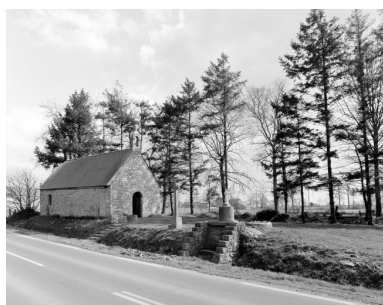
Elévation Nord- Ouest : vue de situation IVR53_19933500331X