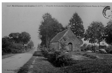
Elévation Ouest : vue de situation (Carte postale ancienne, AD35 : 6Fi) IVR53_19933500229X