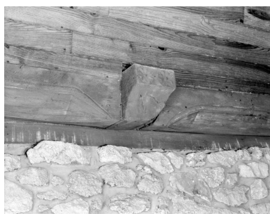
Intérieur : détail de la charpente.