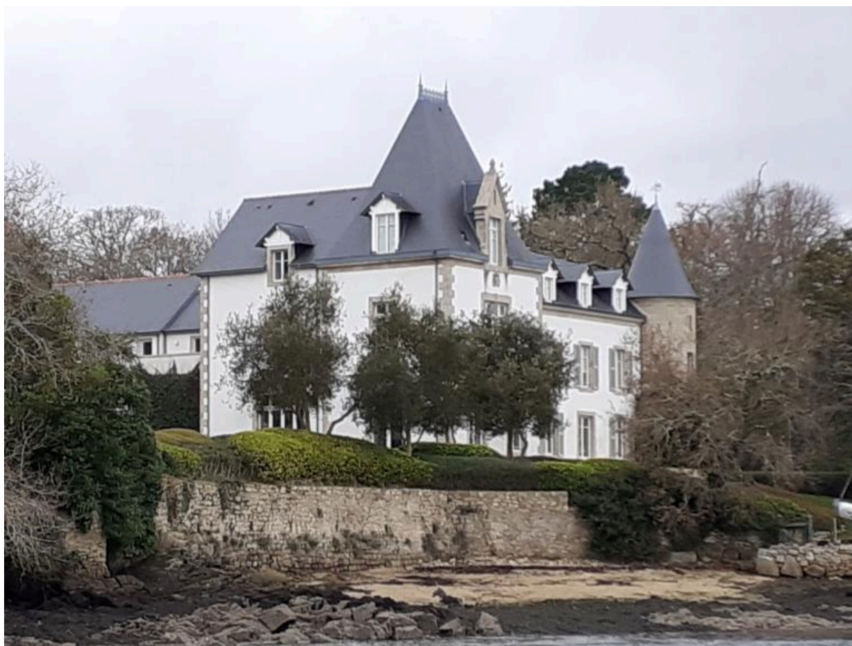
Vue prise des pontons de Sainte-Marine