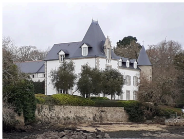
Vue prise des pontons de Sainte-Marine