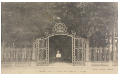
L'entrée du château de la Bretèche sur une carte postale ancienne IVR53_20053518364NUCB