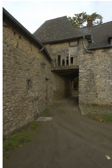
Le porche de la Ville Allée IVR53_20053503171NUCA