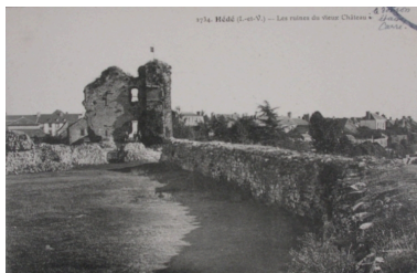
Les vestiges du château de Hédé sur une carte postale ancienne IVR53_20053518374NUCA