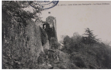
Le château de Hédé IVR53_20053518370NUCA