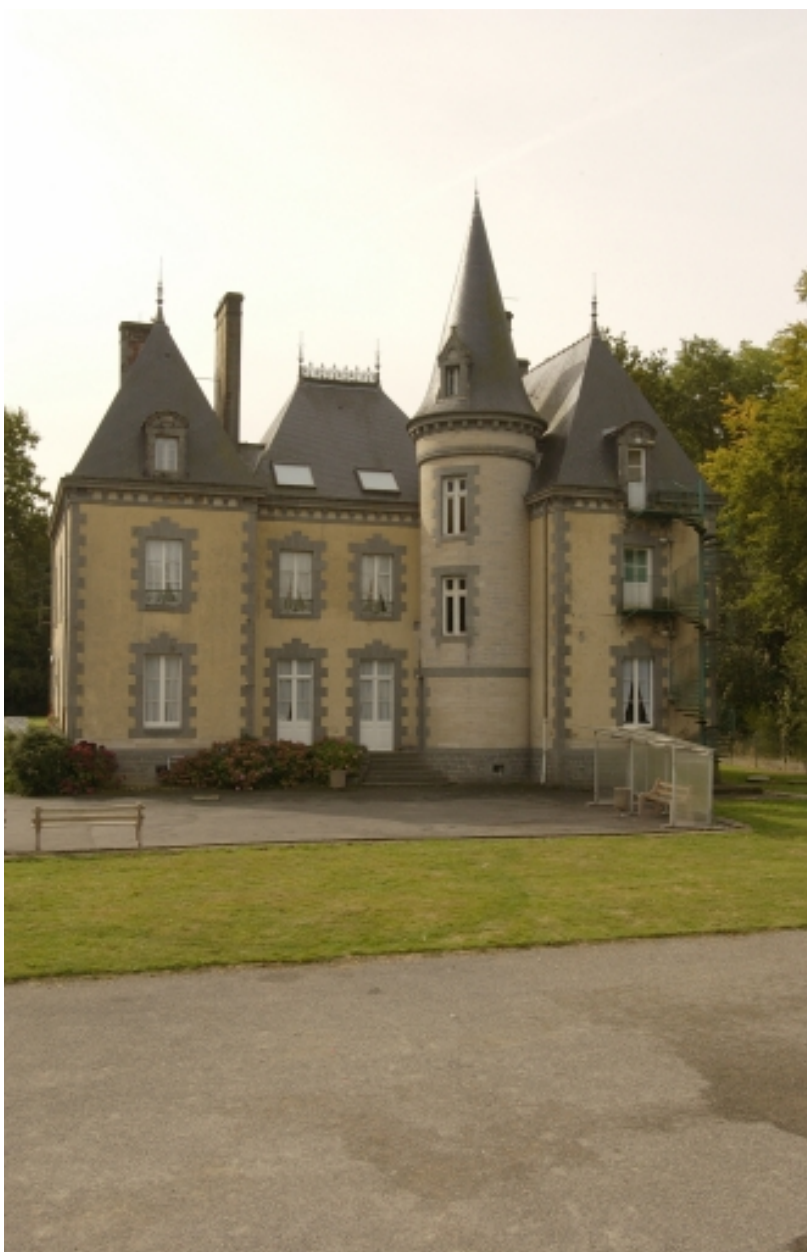
Le château de la Châtetière