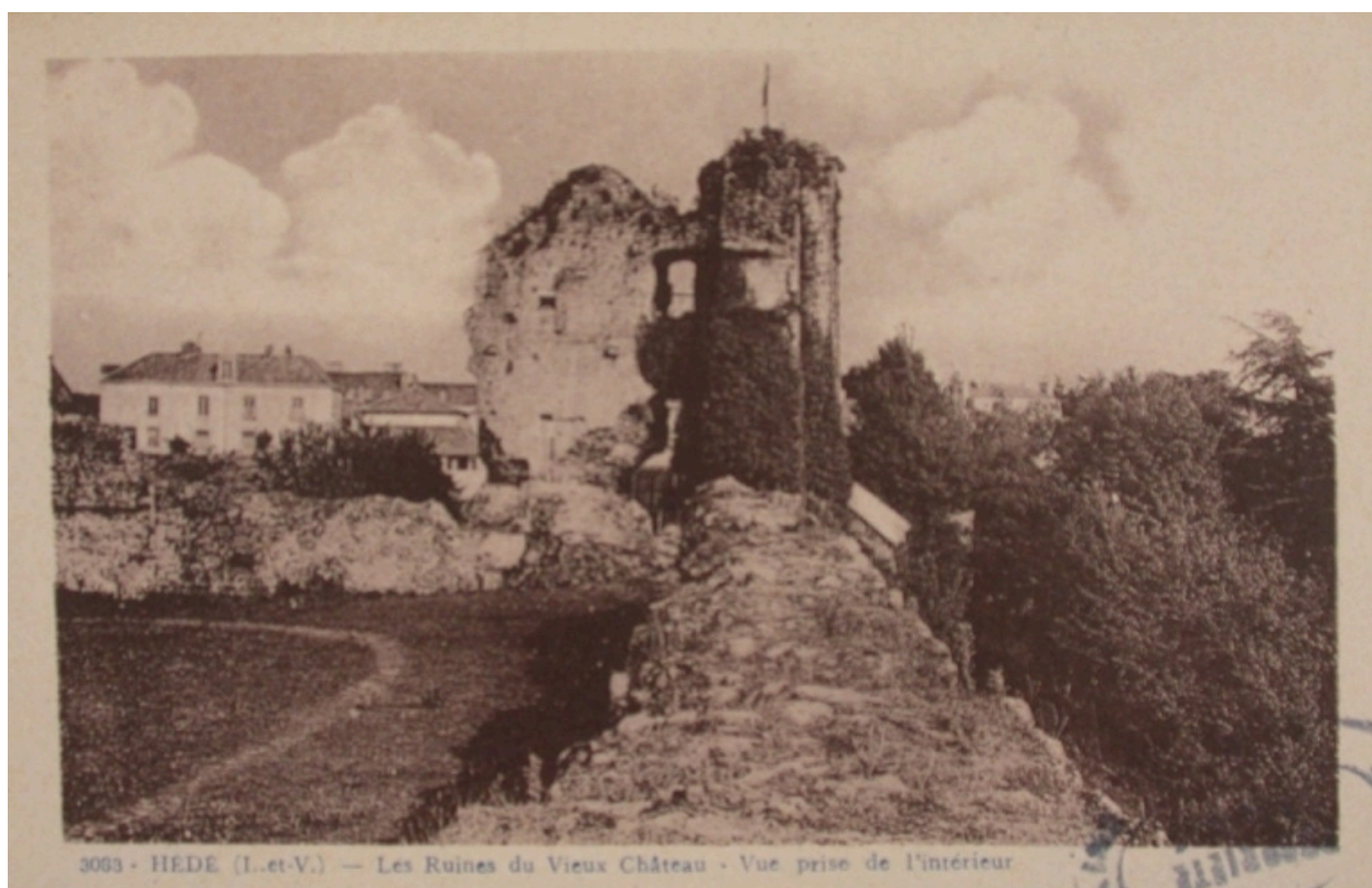
Vue intérieure des ruines du château