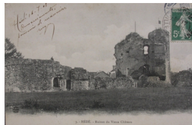
Les ruines du château de Hédé IVR53_20053518369NUCA