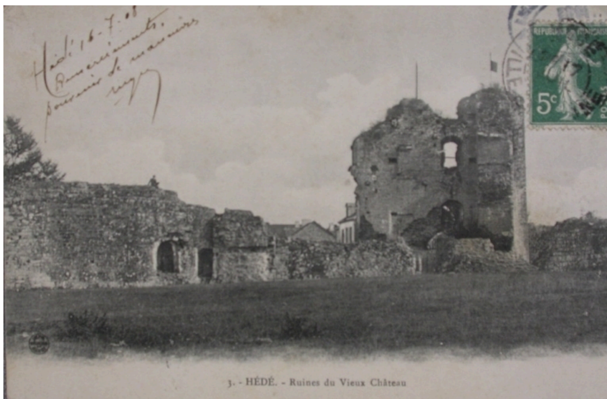
Les ruines du château de Hédé