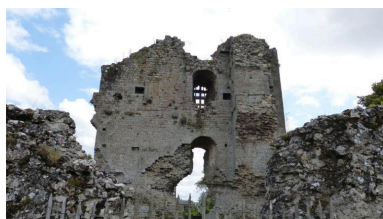
Vue ouest de l'ancienne tour IVR53_20243531724NUCA