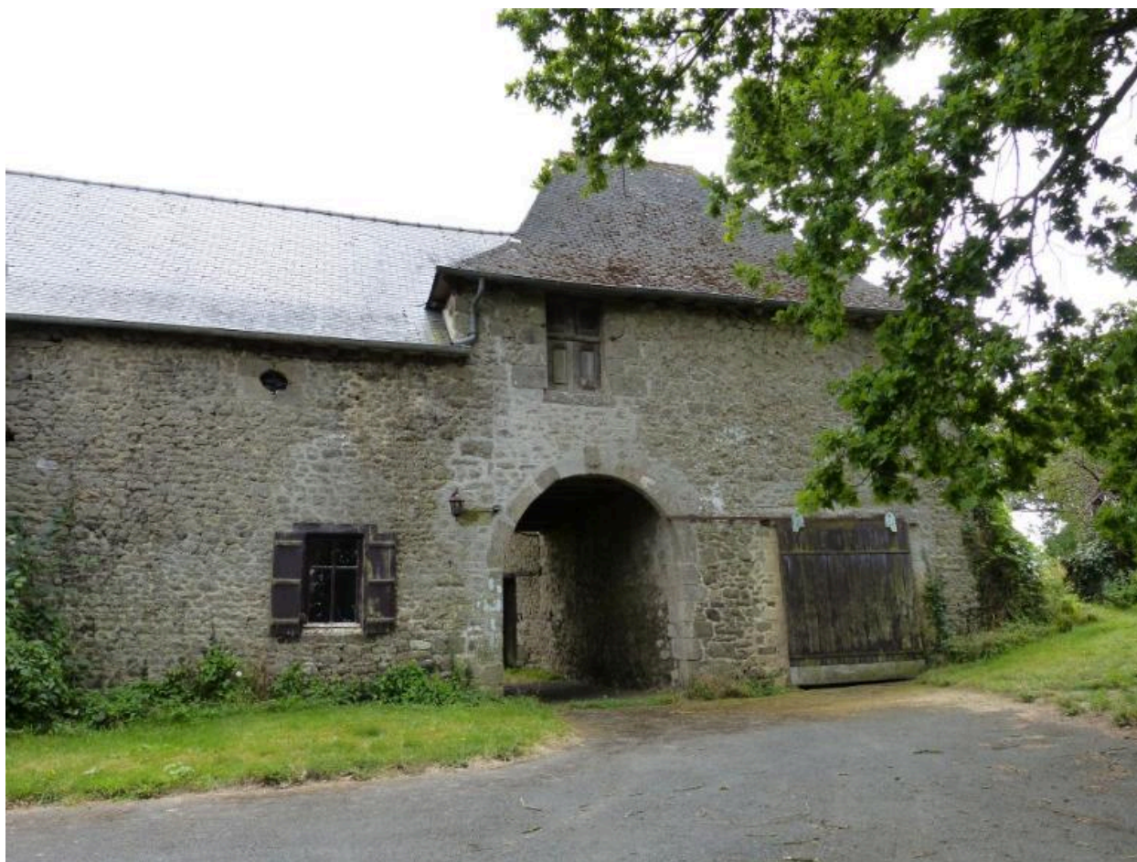
Vue générale nord, Ferme, La Ville Allée (Hédé-Bazouges)