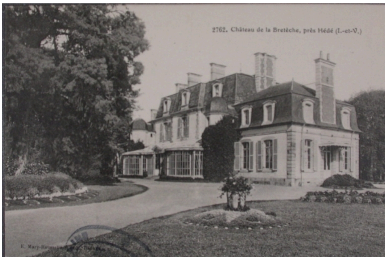
Le château de la Bretèche sur une carte postale du début du 20e siècle