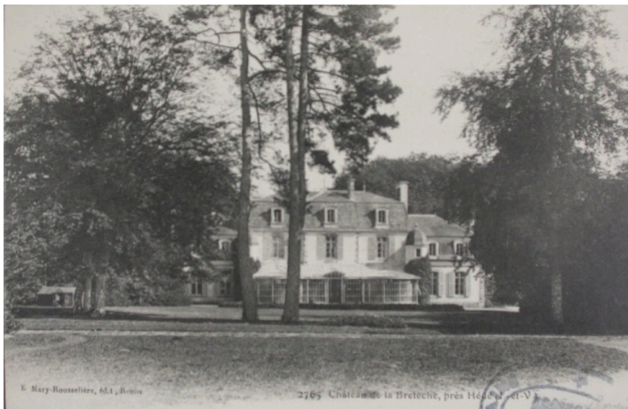
Carte postale ancienne, le château de la Bretèche