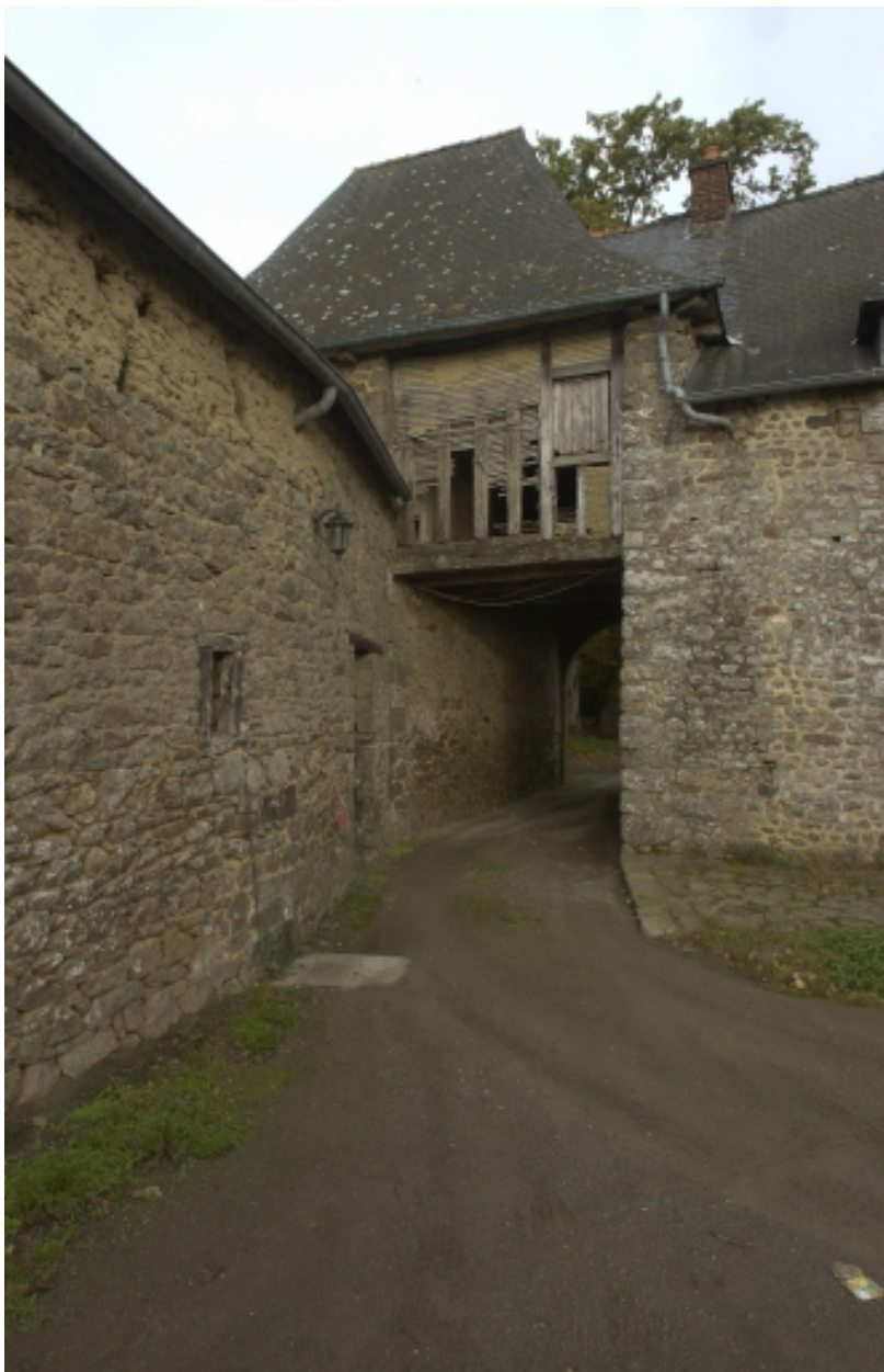
Le porche de la Ville Allée