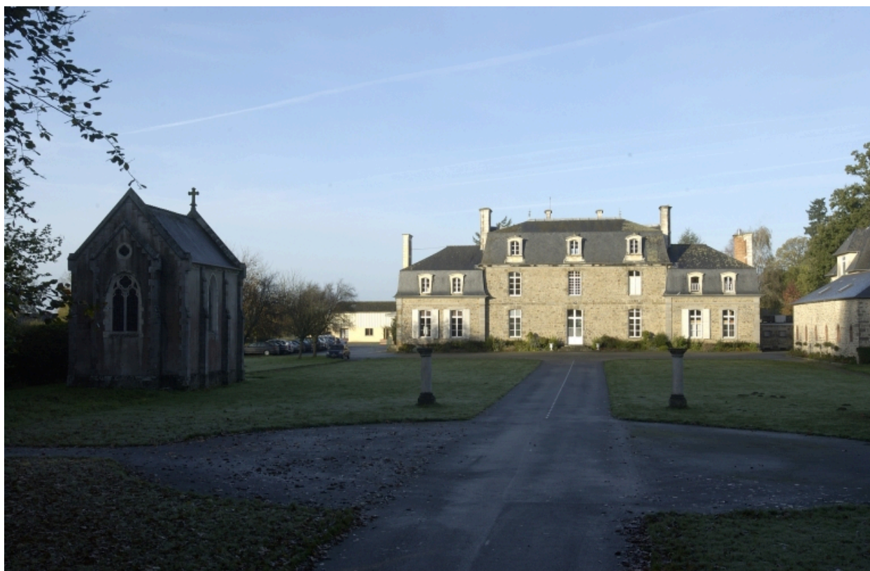
Le château et la chapelle de la Bretèche