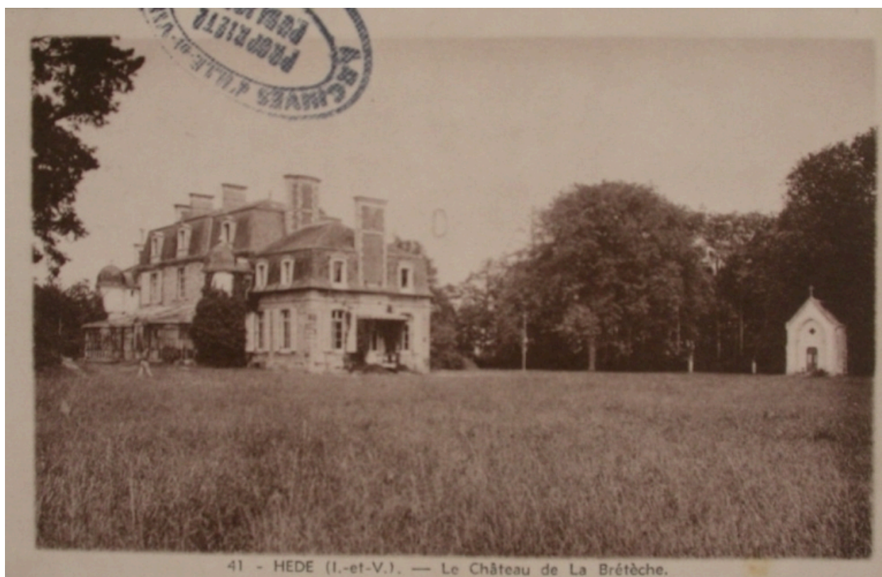
Le château de la Bretèche sur une carte postale ancienne