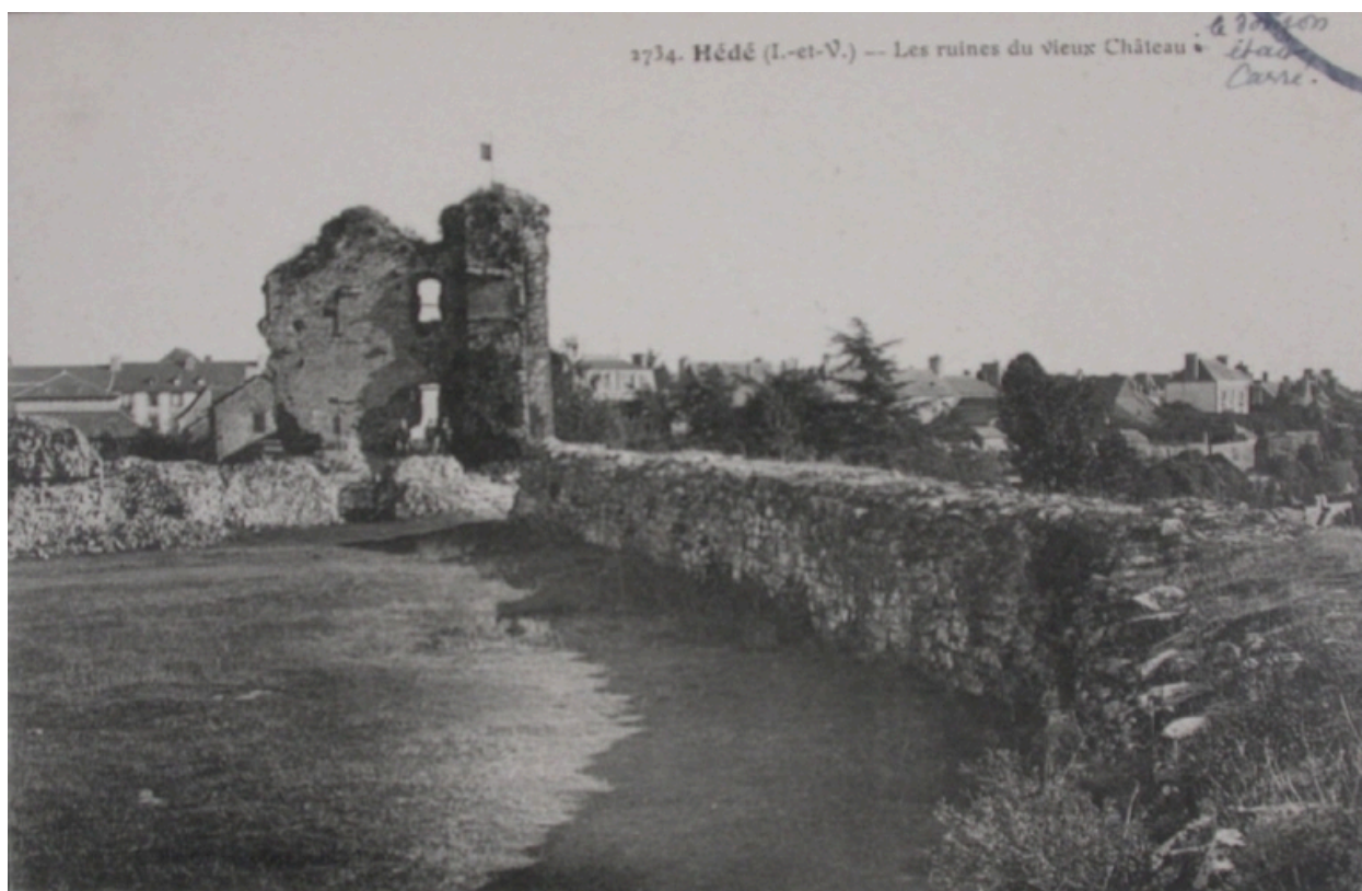
Les vestiges du château de Hédé sur une carte postale ancienne