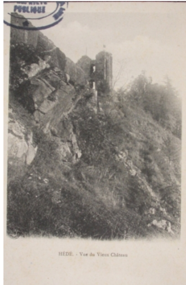
Le château de Hédé