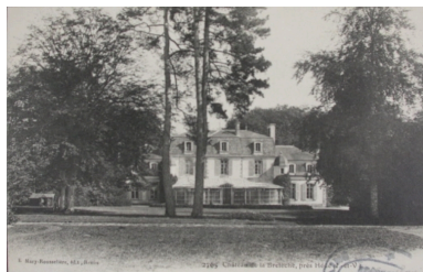
Carte postale ancienne, le château de la Bretèche