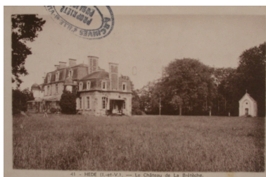
Le château de la Bretèche sur une carte postale ancienne