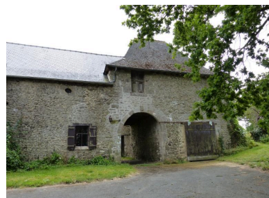
Vue générale nord, Ferme, La Ville Allée (Hédé-Bazouges) IVR53_20243531472NUCA