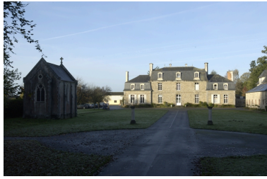
Le château et la chapelle de la Bretèche IVR53_20053503029NUCA