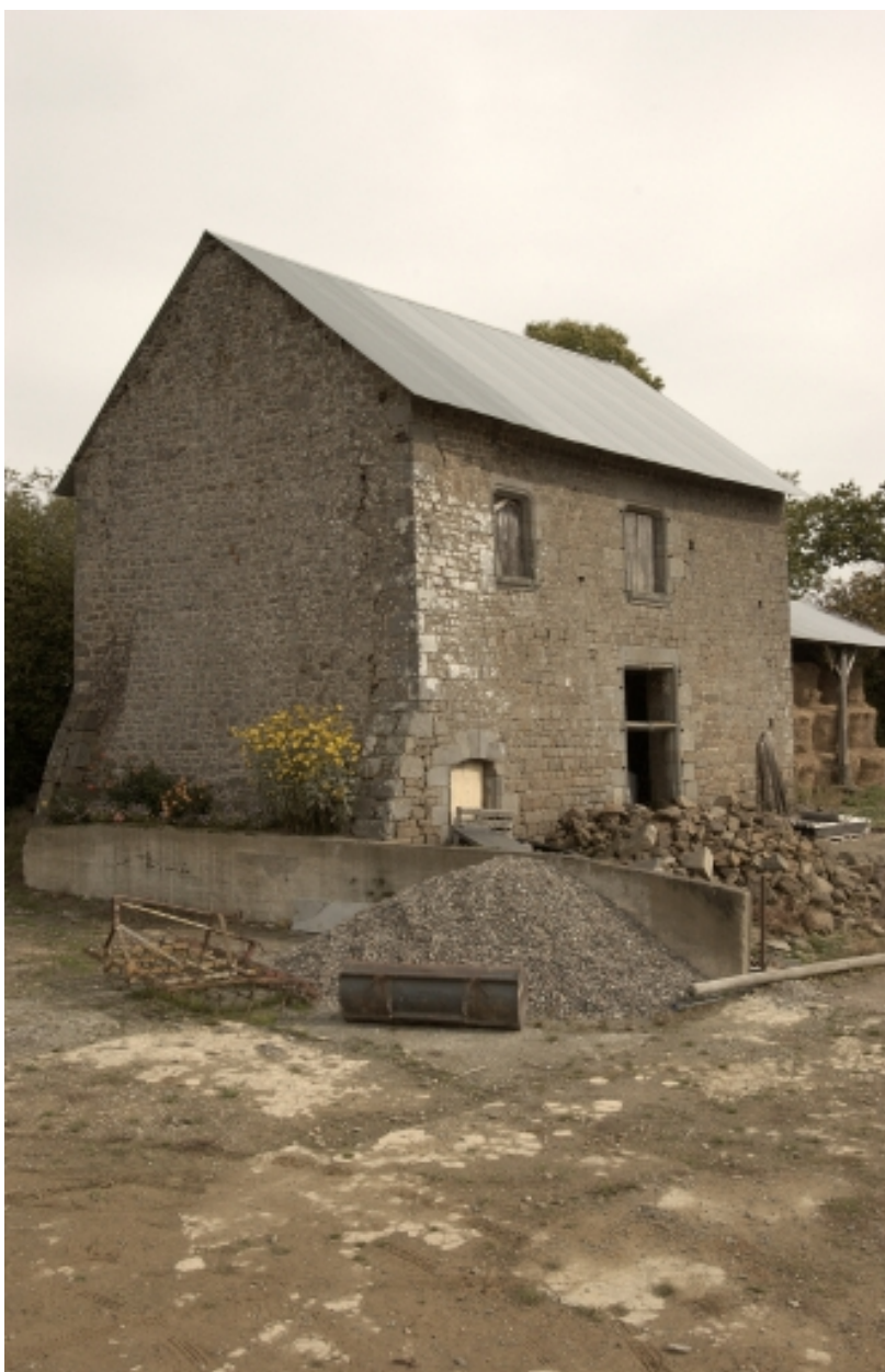
Manoir de la Crosille