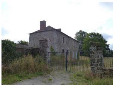
Vue générale nord ouest, Ferme ancien château, Bon Espoir ( Hédé-Bazouges)