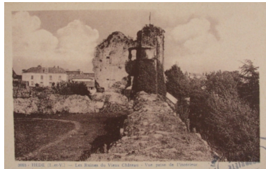
Vue intérieure des ruines du château IVR53_20053518378NUCA