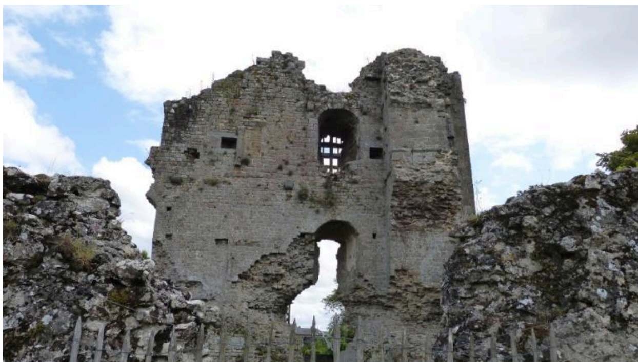
Vue ouest de l'ancienne tour