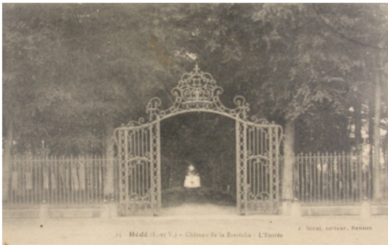
L'entrée du château de la Bretèche sur une carte postale ancienne