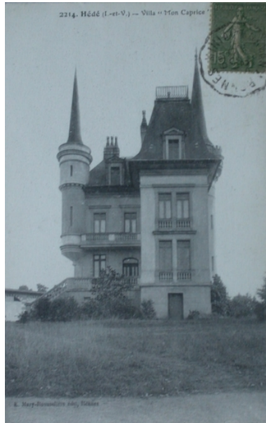
Villa, rue de la Motte IVR53_20053519251NUCA