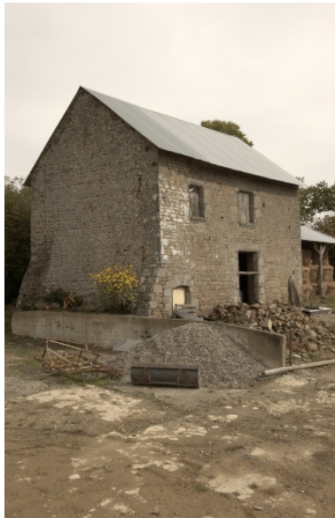
Manoir de la Crosille