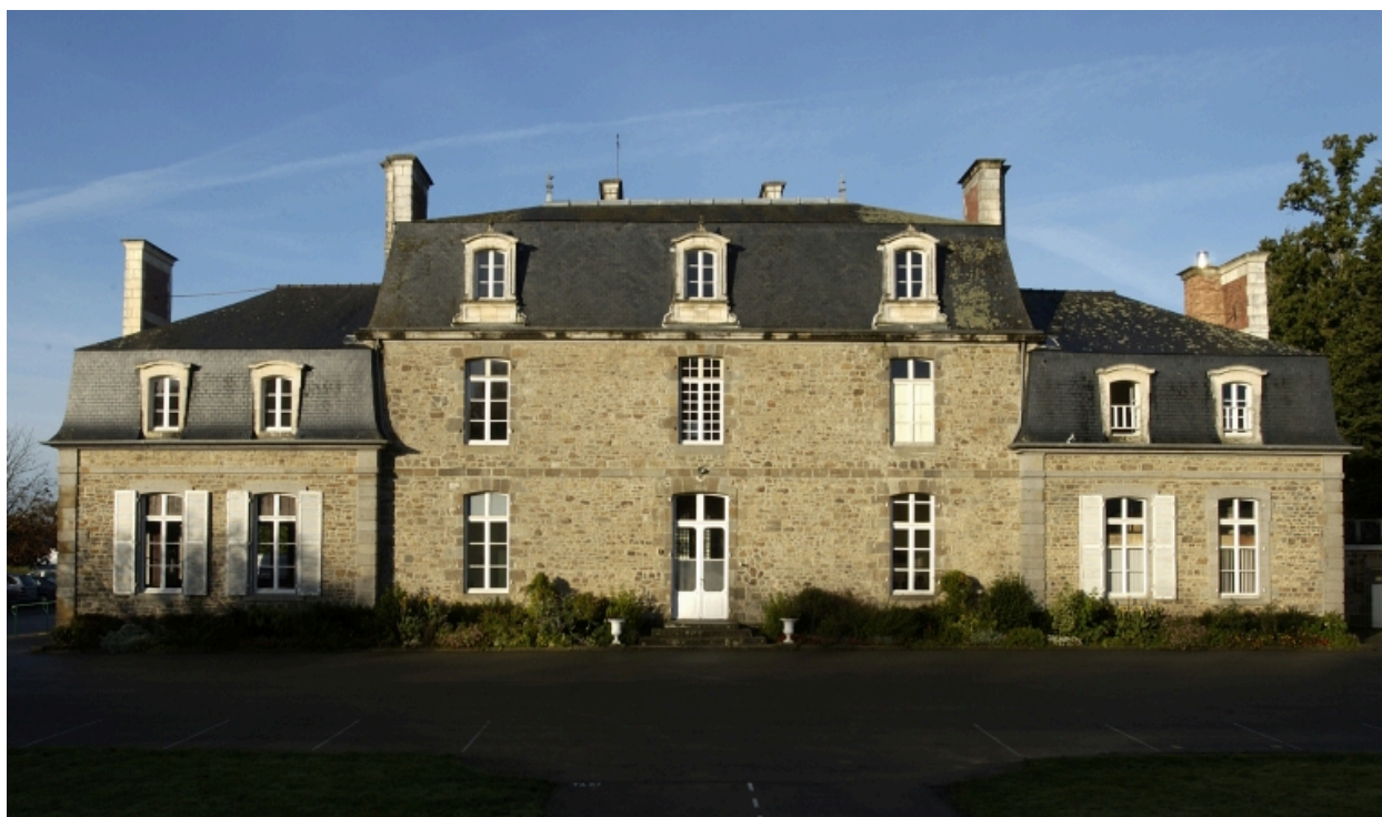
Le château de la Bretèche