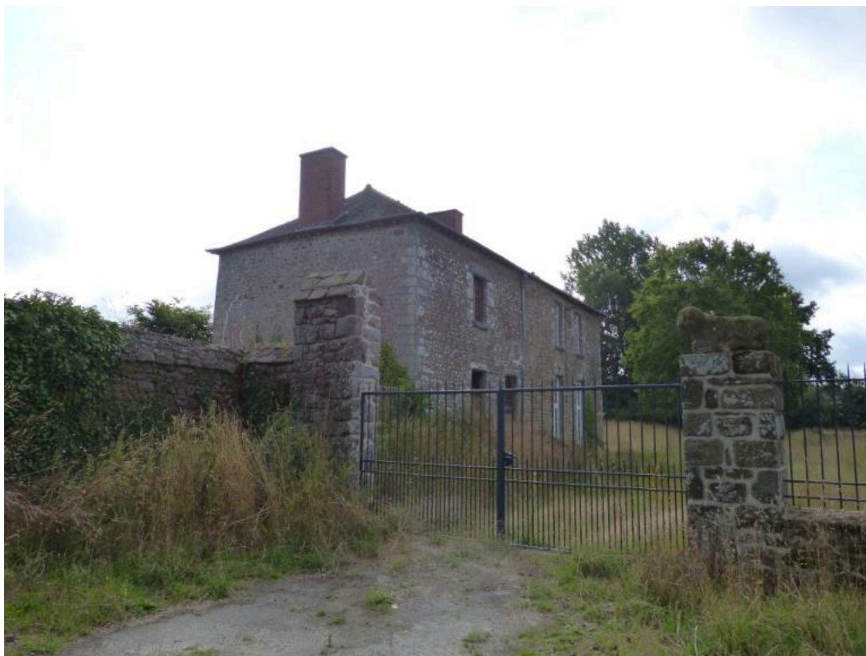
Vue générale nord ouest, Ferme ancien château, Bon Espoir ( Hédé-Bazouges)