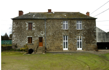
Bon Espoir IVR53_20053503188NUCA