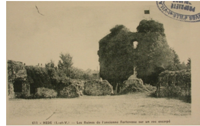
Ruines de l'ancienne forteresse de Hédé