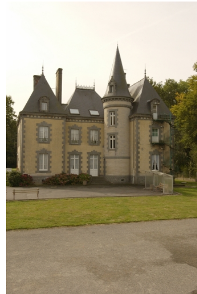
Le château de la Châtière