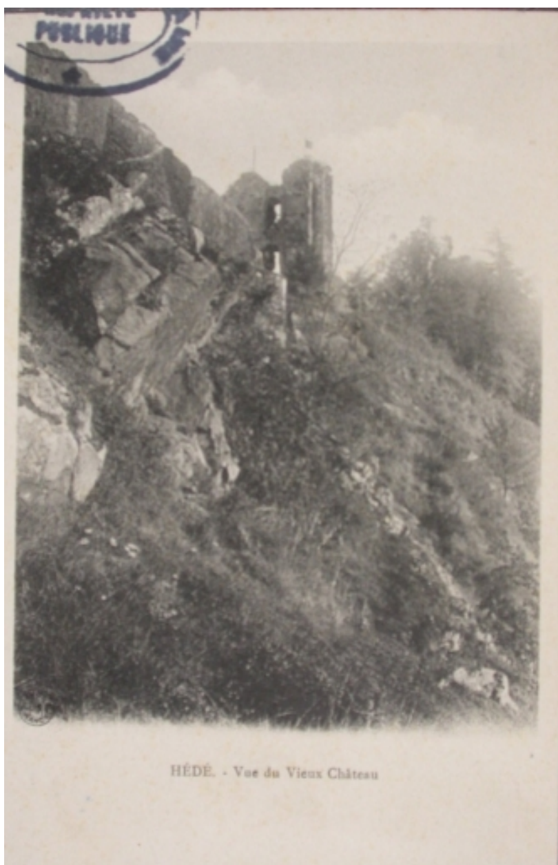
Le château de Hédé