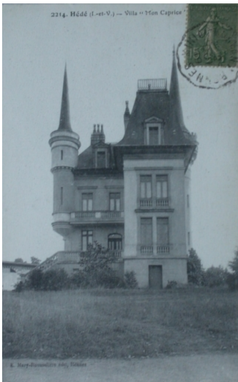
Villa, rue de la Motte