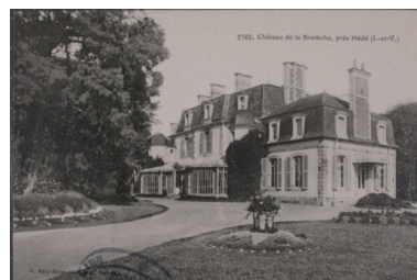
Le château de la Bretèche sur une carte postale du début du 20e siècle