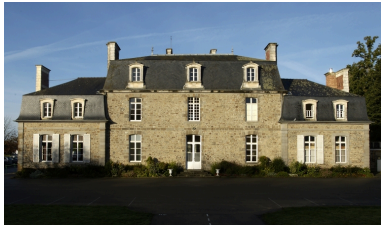
Le château de la Bretèche