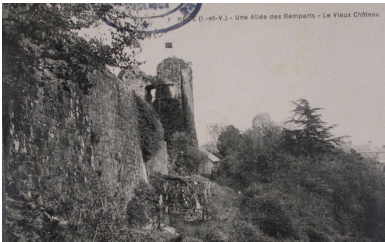
Le château de Hédé