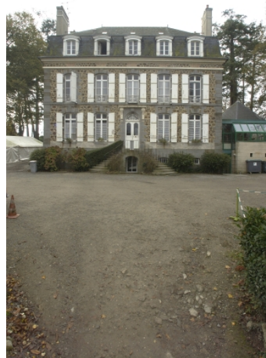
Beauvoir IVR53_20053503176NUCA